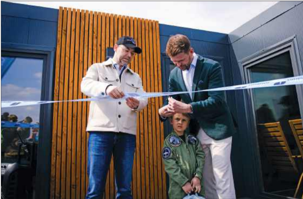
„Wisienka na torcie” w Mielcu. Nowa atrakcja na mapie lotniczej kraju już otwarta.

Otwarcie Domku Pilota stało się okazją do wielkiej integracji środowiska. Na mieleckim niebie i płycie lotniska pojawili się piloci z całego kraju, a szczególnymi gośćmi była młodzież z Mieleckiej Klasy Lotniczej. Uczniowie mieli okazję przetestować w locie szybowiec, który szkoła otrzymała w ostatnich tygodniach, co idealnie wpisało się w atmosferę budowania przyszłych kadr polskiego lotnictwa. PK