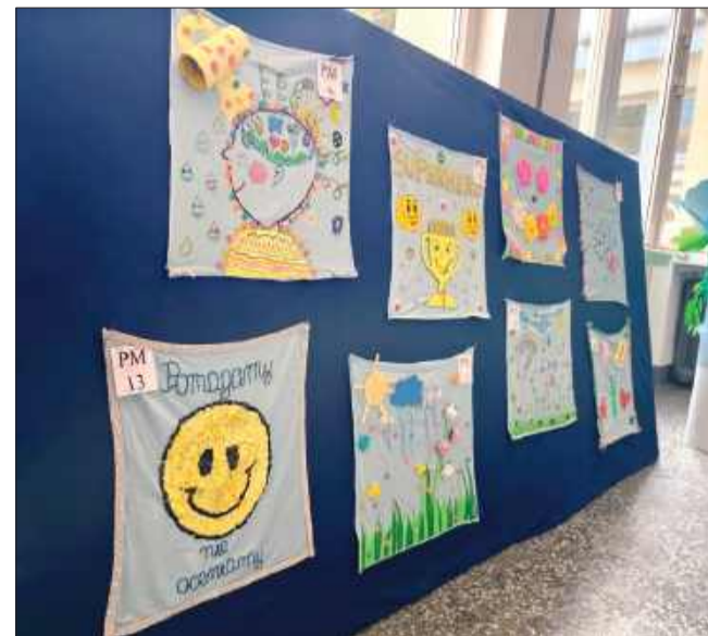
Prace plastyczne dzieci, które wzięły udział w konkursie.

Wspaniałe nagrody dla małych uczestników konkursu ufundowali liczni sponsorzy, które rozdali obecni na miejscu goście. Końcowym elementem wydarzenia było wspólne spotkanie i rozmowy przy pięknym i pysznym torcie.