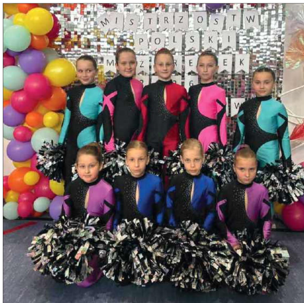
Radomyśl Wielki świętuje! Zespół GH Cheerleaders przywiózł złoto z Mistrzostw Polski.