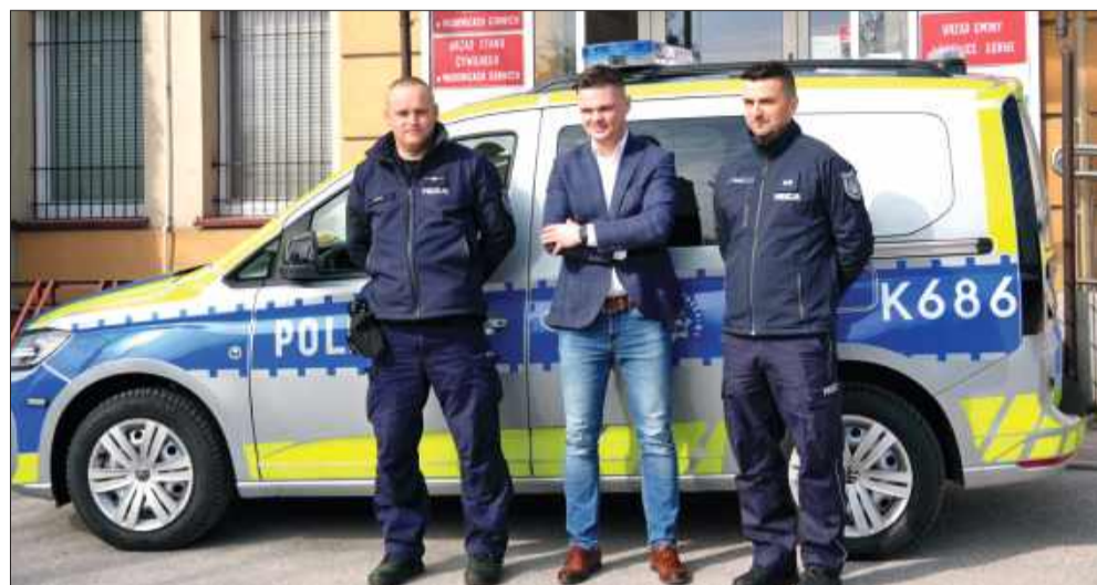
Funkcjonariusze z Wadowic Górnych odebrali kluczyki do nowego auta

To dobra wiadomość dla mieszkańców gminy Wadowic Górne. Tutejszy posterunek policji wzbogacił się o nowy radiowóz. Nowoczesny pojazd ma nie tylko poprawić komfort pracy funkcjonariuszy, ale przede wszystkim skrócić czas reakcji na zgłoszenia i zwiększyć bezpieczeństwo na lokalnych drogach.