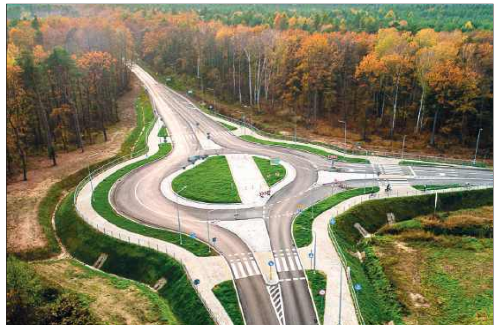
Mieszkańcy chcieli, radni przegłosowali. Rondo Bożej Opatrzności oficjalnie zatwierdzone.