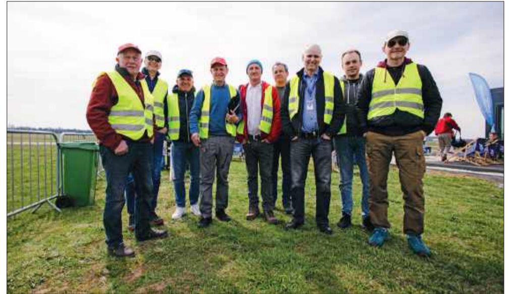
Piloci z całej Polski świętowali otwarcie nowej infrastruktury.