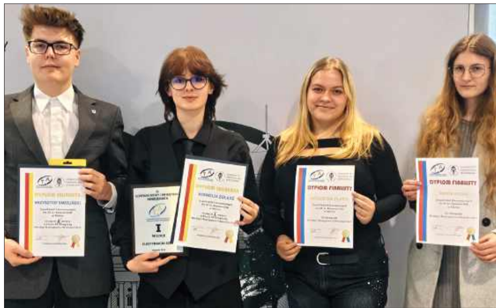
Mielec stolicą młodych menedżerów. Uczniowie „Ekonomika” zmiądzili konkurencję.

Ten sukces to nie tylko powód do dumy dla szkoły, ale także sygnał dla przyszłych pracodawców, że w Mielcu rośnie kadra doskonale przygotowana do wyzwań nowoczesnego rynku pracy.