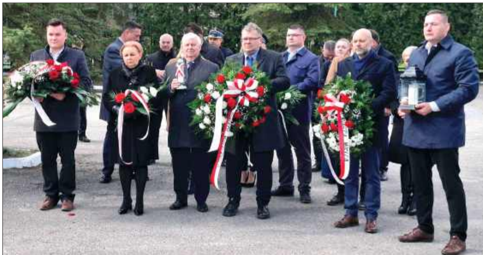
Politycy i samorządowcy złożyli wieńce.

Szesnaście lat temu doszło do tragedii, która wstrząsnęła całą Polską. Od tamtej pory, w tym samym czasie, wspominamy dwie narodowe tragedie.