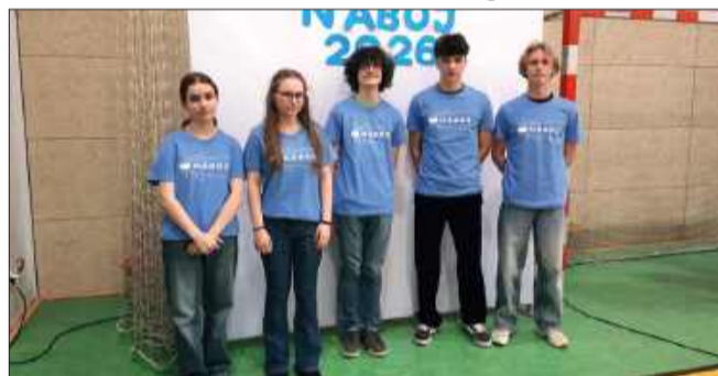
Miejski „Kopernik” ma patent na sukces. Ich uczniowie to krajowa elita matematyczna

W II LO w Mielcu matematyka to znacznie więcej niż tylko liczby w dzienniku. Nocne mecze połączone z liczeniem, obozy naukowe i olimpijczycy, którzy sami uczą młodszych kolegów – tak „Kopernik” buduje nową elitę ścisłowców.