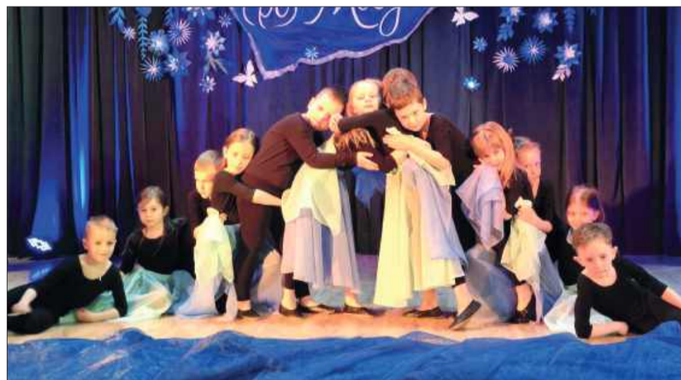
Wydarzeniu towarzyszyły artystyczne występy.