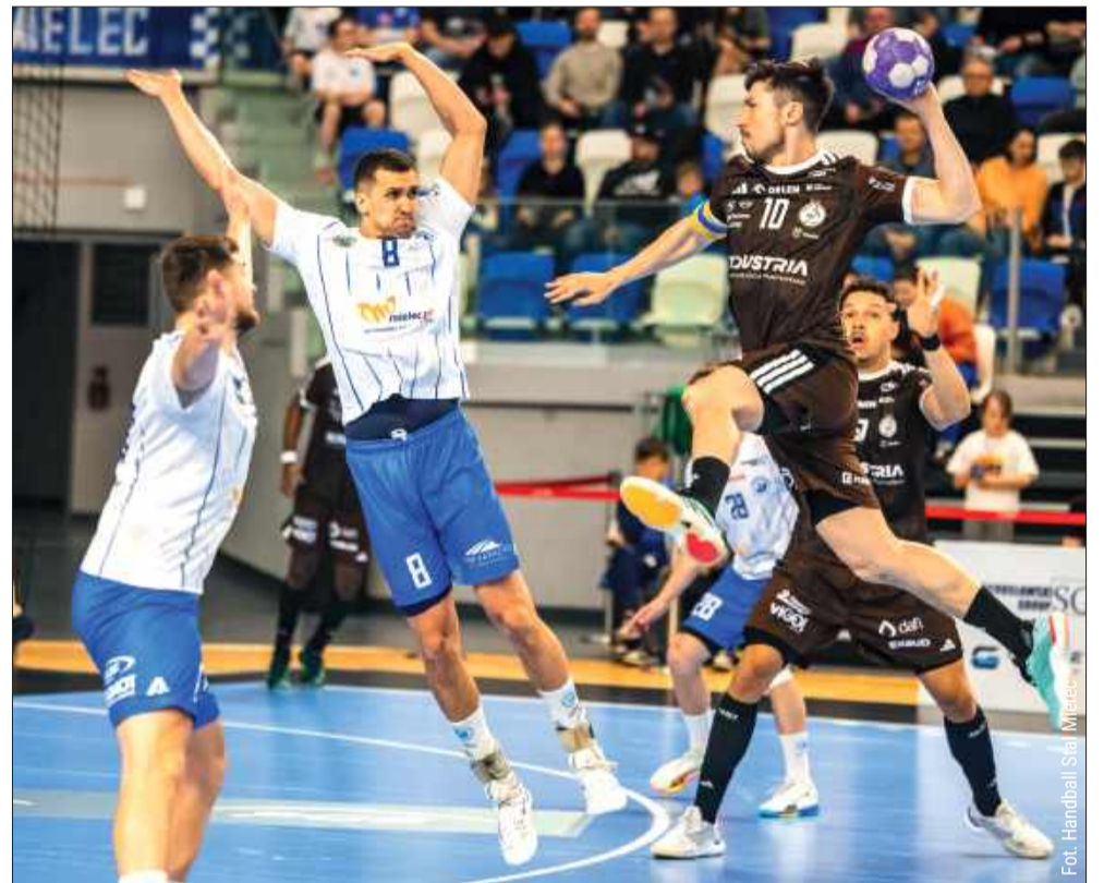
Kielczanie pokazali klasę w Mielcu.

Początek spotkania przed własną publicznością zapo-