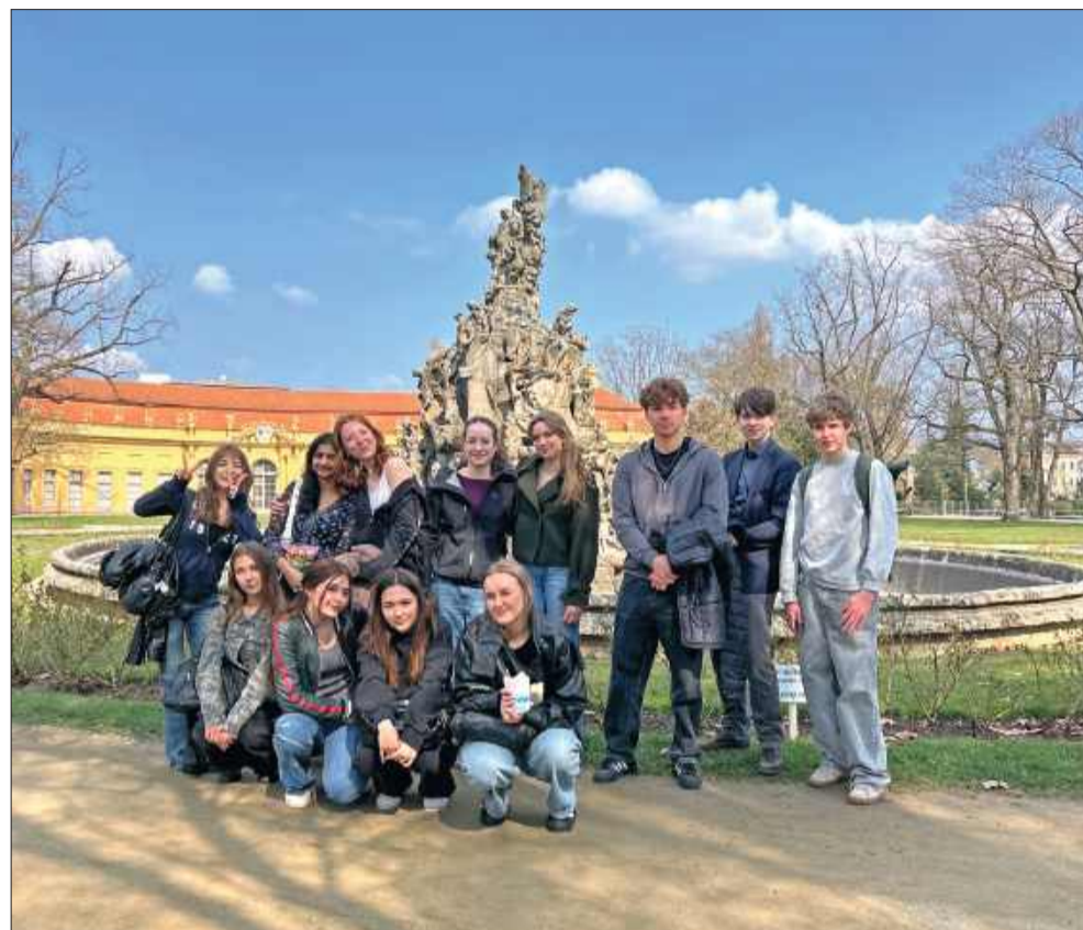
Zamiast szkolnej ławy – niemiecki dom. Wyjątkowa misja uczniów II LO w Mielcu.

– „To projekt, który realnie zmienia młodych ludzi. Widzimy jak nabierają pewności sie-