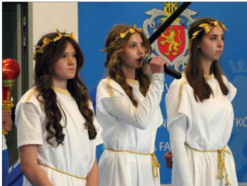
Podczas uroczystości zaproszeni goście mogli wiele się dowiedzieć o historii olimpiad.

Całkowity koszt to 5,329 mln zł. Dofinansowanie z programu „Olimpia”: 3 431 900 zł. Czas oczekiwania: blisko 3 dekady.