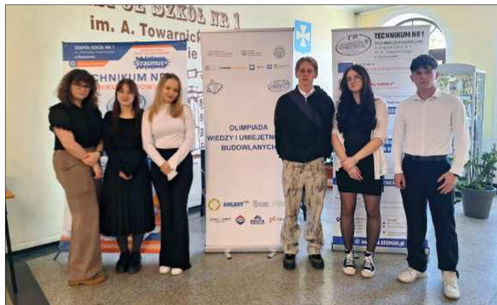
Geometryczne myślenie i wielkie sukcesy. Zobacz, co dzieje się w mieleckim ZSB