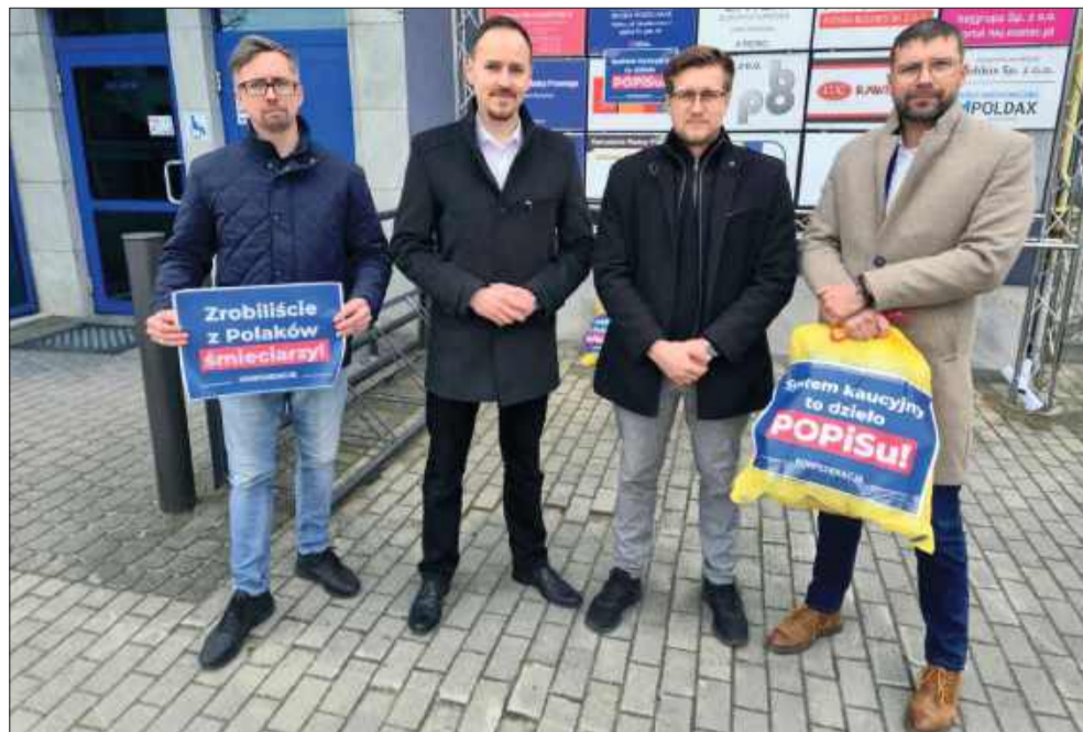
Przedstawiciele mieleckiej konfederacji podczas sobotniej konferencji