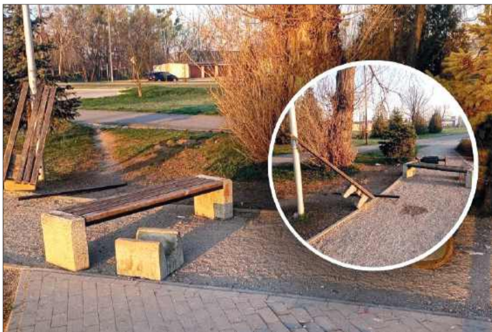
Zniszczona ławka na Błoniach MOSiR