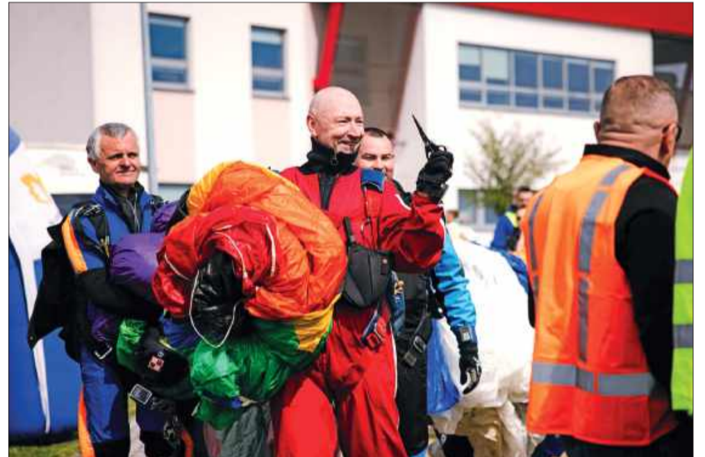
Nowoczesna przystań dla lotników już otwarta. Domek Pilota stanął tuż obok wieży kontrolnej.