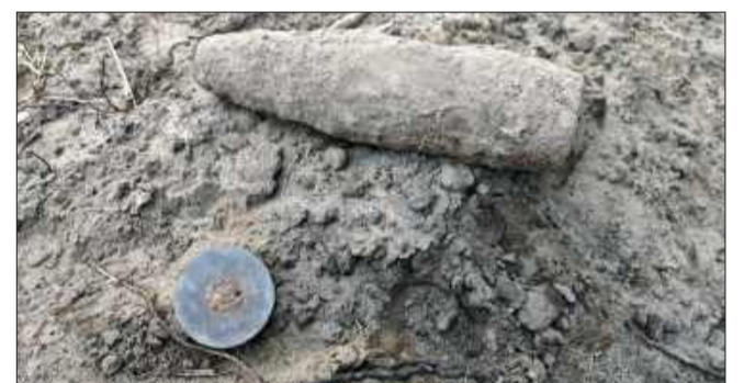
Tak wyglądał pocisk po znalezieniu.