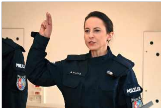
Policjantka złożyła ślubowanie.

Aby przejść z pracy administracyjnej do służby mundurowej, musiała przejść pełną procedurę rekrutacyjną. Obejmowała ona m.in. egzamin, testy sprawnościowe, badania psychologiczne, rozmowy kwalifikacyjne, badania lekarskie oraz