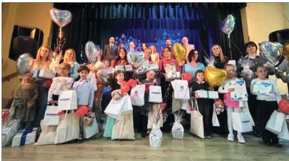
Wszystkie dzieci otrzymały prezenty.