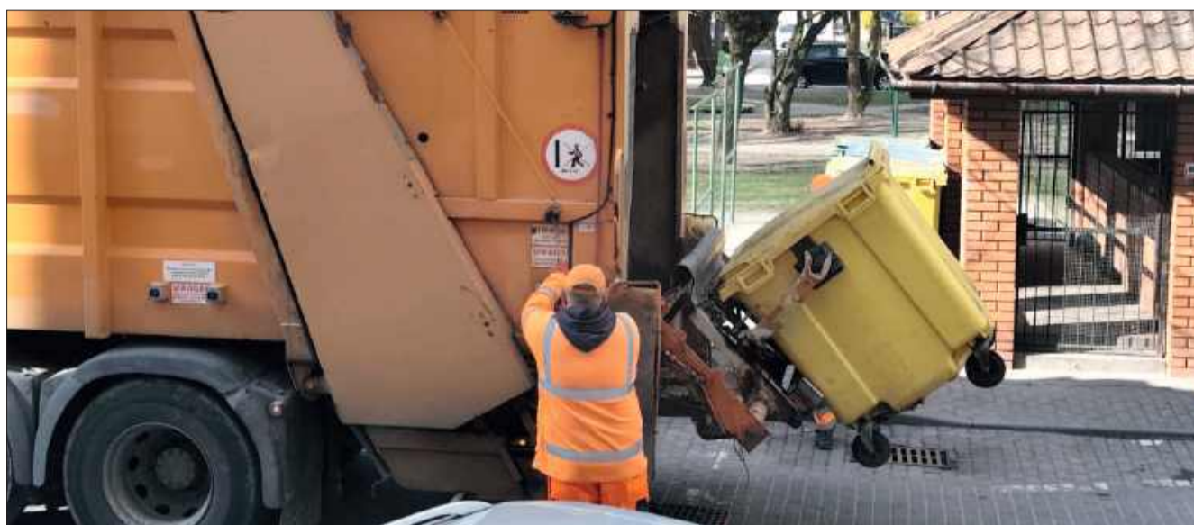
Mieleckie MPGK zauważa zmianę składu żółtych worków.

Już dzisiaj firmy zajmujące się przyjmowaniem wyselekcjonowanych odpadów z tworzyw sztucznych zauważają wyraźny spadek wartościowego surowca, jakim są plastikowe butelki. Mieszkańcy - z wiadomych przyczyn - oddają je do butelkomatów, a nawet te butelki, które trafiają do miejskich koszy na śmieci czy altan bywają wydobywane i spieniężane przez osoby bezdomne lub poszukujące dodatkowego dochodu. Sprawia to, że w żółtych workach coraz większy udział mogą mieć zabrudzona folia i inne elementy,