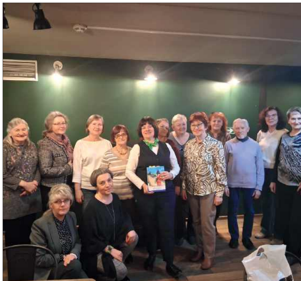
Wiersze, muzyka i zapach kawy. Tak wyglądało spotkanie z autorką „Na krawędzi”