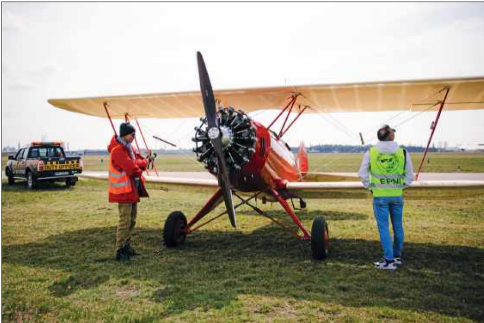
To miejsce przyciągnie do Mielca setki samolotów.