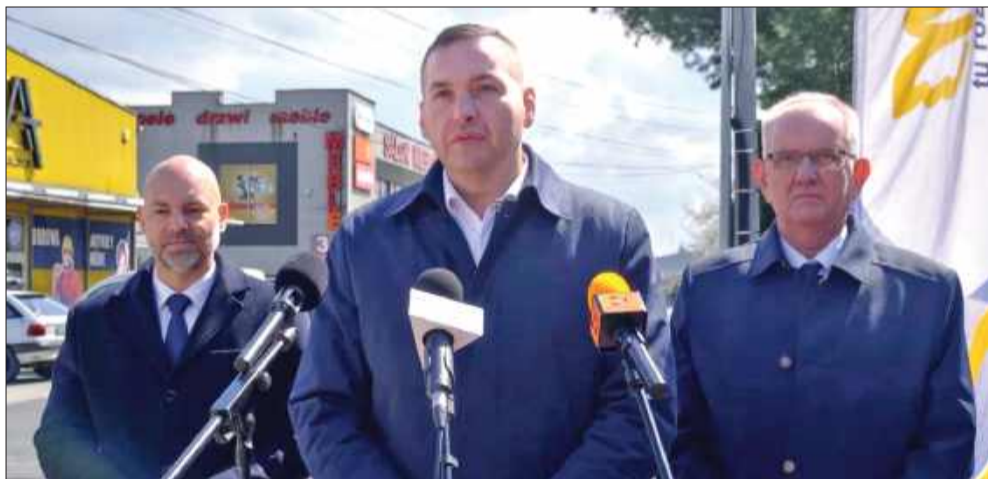
Nowa droga z pewnością ucieszy kierowców.

Pamiętacie, jak jeszcze kilkanaście lat temu narzekaliśmy na polskie drogi? Teraz coraz więcej mamy powodów do domu.