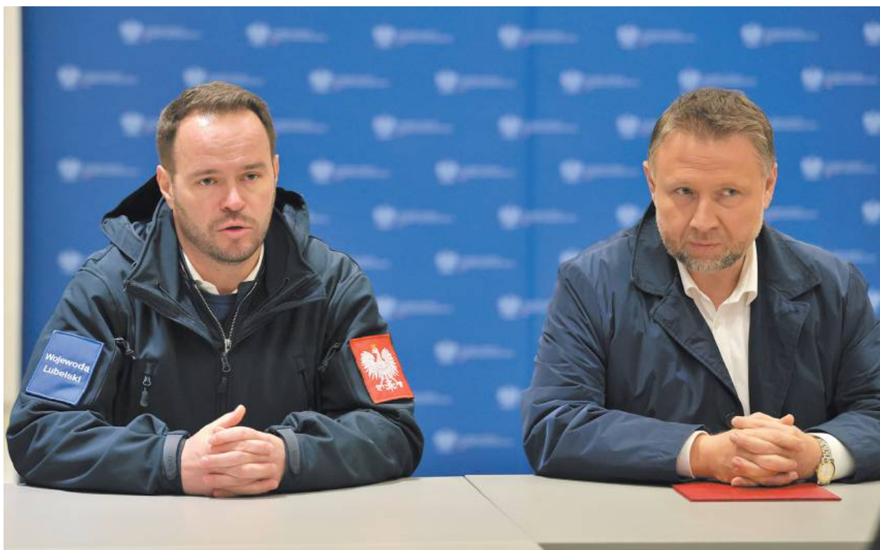
Wojewoda lubelski Krzysztof Komorski (z lewej) oraz minister spraw wewnętrznych i administracji Marcin Kierwiński (z prawej) podczas ogłoszenia Programu OLIOC dla woj. lubelskiego

– Kluczowe jest nie tylko reagowanie na zagrożenia militarne czy hybrydowe, ale też na te, które spotykamy najczęściej: klimatyczne, atmosferyczne oraz hydrologiczne. Dlatego niezbędna jest diagnoza i modernizacja zasobów, potrzebne są nowe lokalizacje ochronne, ale także