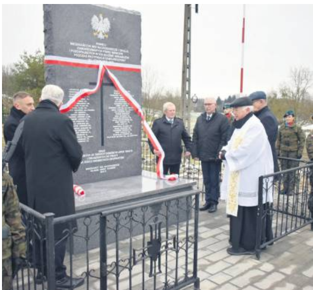
Uroczystości odbyły się w Rachodoszczach.

Wydarzenie zgromadziło mieszkańców, rodziny ofiar, przedstawicieli władz samorządowych oraz zaproszonych gości. 28 listopada w Rachodoszczach (gm. Adamów) uroczysto odsłonięto odnowiony pomnik pamięci mieszkańców tej i okolicznych wiosek, zamordowanych przez Niemców oraz pozostałych w ich służbie Ukraińców podczas pacyfikacji Zamojszczyzny.