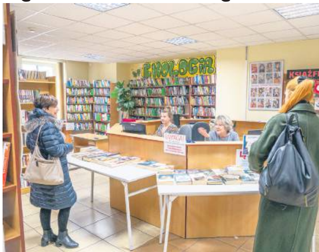
Od 1 stycznia powiat będzie wspierał działalność Książnicy Zamojskiej kwotą 200 tys. zł rocznie.

Uchwałę w sprawie utworzenia Powiatowej Biblioteki Publicznej w Zamościu z sie-