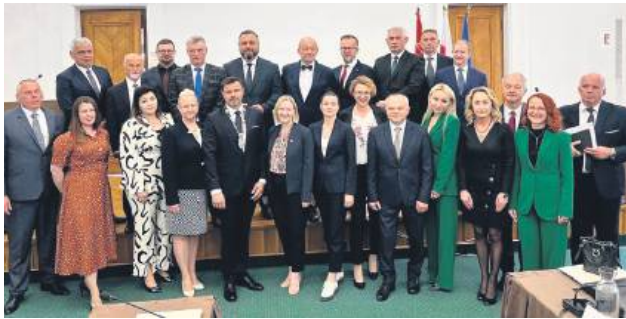
Rada Miasta Zamość na początku nowej kadencji.

Analizę struktury społecznej rad gmin, miast, powiatów oraz województw w Polsce, opartą na danych Głównego Urzędu Statystycznego za 2024 r., przygotowali Katarzyna Sekuła-Jelito i Rafał Rudka ze Związku Powiatów Polskich. Celem opracowania jest przedstawienie profilu demograficznego, edukacyjnego i zawodowego osób pełniących funkcje radnych na wszystkich szczeblach władzy samorządowej.