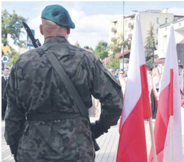
Biłgorajscy samorządowcy dążą do utworzenia jednostki wojskowej.

Jak podkreślono w trakcie sesji, rozmowy dotyczące lokalizacji jednostki wojskowej na terenie Biłgoraja lub okolicznych gmin trwają od dłuższego czasu. Według władz miasta i gminy przemawia za tym zarówno sytuacja międzynarodowa, jak i potencjalne korzyści gospodarcze.