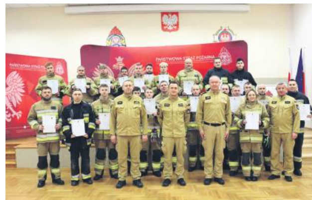
24 kolejnych druhow z powiatu tomaszowskiego przeszło szkolenie na strażaka ratownika.

Przed przystąpieniem do egzaminu strażacy musieli zaliczyć testy w komorze dymowej Ośrodka Szkolenia Komendy Wojewódzkiej PSP w Lublinie. Następnie, 28 listopada, w Komendzie Powiatowej Państwowej Straży Pożarnej w Tomaszowie Lubelskim przeprowadzono egzamin teoretyczny i praktyczny kończący szkolenie podstawowe strażaka