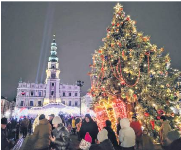
Wszystkie te świąteczne atrakcje kosztowały miasto prawie 75 tys. zł.

wstała kolorowa „bajkowa kraina”. W tej zimowej strefie – nie tylko na najmłodszych – czekają świetlne dekoracje, w tym m.in. igloo, sanie z białym niedźwiedziem