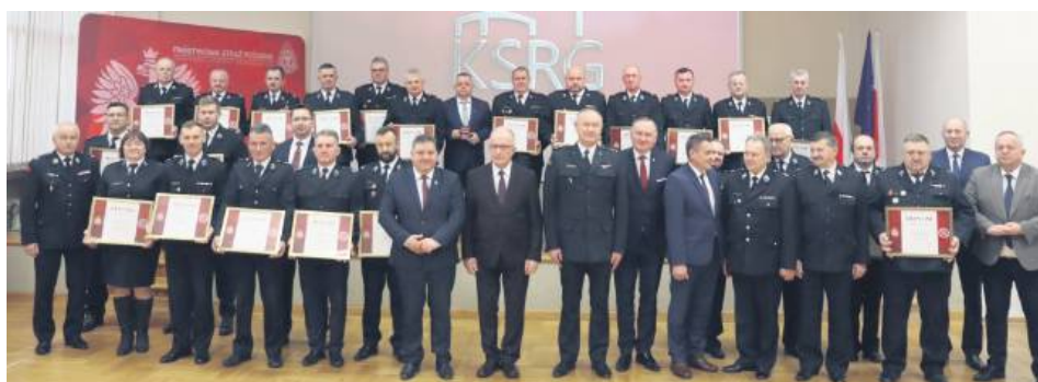
Odprawa szkoleniowa prezesów i naczelników jednostek OSP KSRG oraz komendantów gminnych ZOSP RP powiatu tomaszowskiego.

27 listopada w Komendzie Powiatowej Państwowej Straży Pożarnej w Tomaszowie Lubelskim odbyła się odprawa szkoleniowa przedstawicieli jednostek OSP włączonych do Krajowego Systemu Ratowniczo-Gaśniczego oraz komendantów gminnych ZOSP RP. Podczas spotkania jednostkom wręczono pamiątkowe medale z okazji 30-lecia KSRG w naszym regionie.