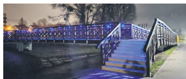
Powstała bezpieczna kładka.