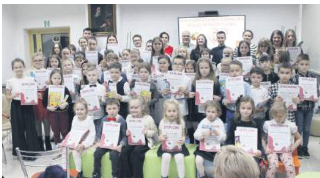
Laureaci Konkursu Recytatorskiego Poezji Patriotycznej.

Uroczyste podsumowanie ósmej edycji Konkursu Recytatorskiego Poezji Patriotycznej