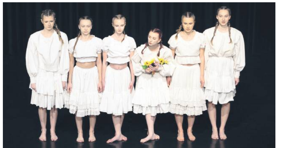
Dziewczyny ćwiczą w Młodzieżowym Domu Kultury.