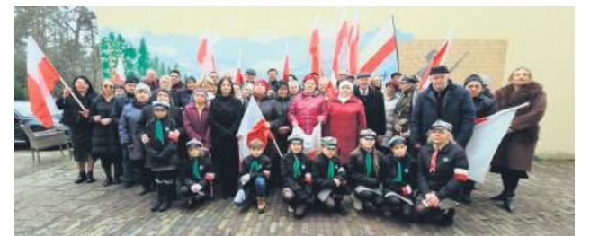
Odsłonięcie muralu stało się okazją do wspólnego świętowania.

Mural przedstawia piękno ziemi zamojskiej, w tle widać jej obrońców z czasów II wojny