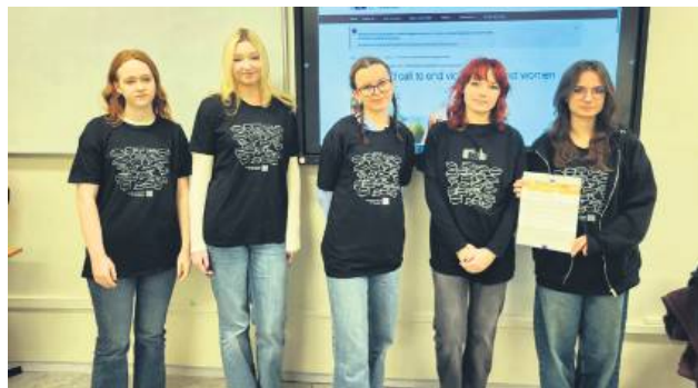
Pięć uczennic zmierzyło się z zadaniem wymagającym zarówno wnikliwej analizy, jak i dużej wrażliwości językowej.