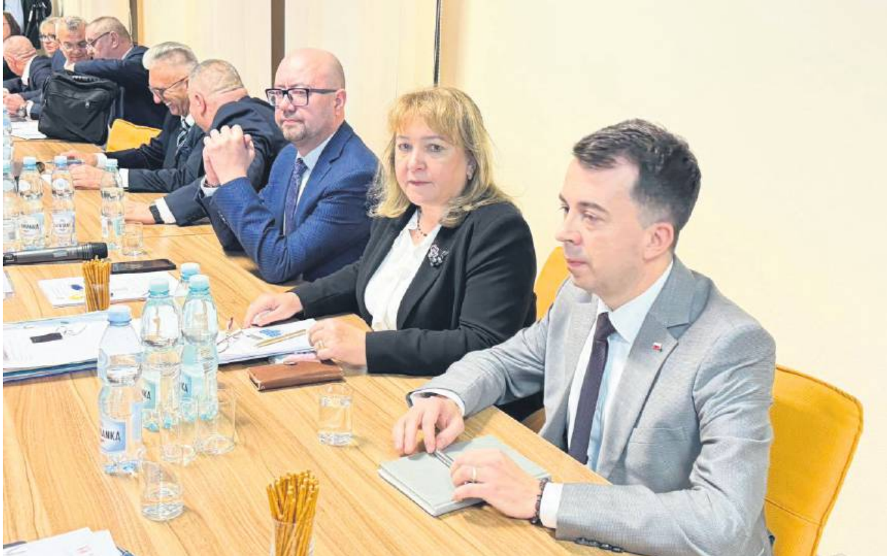
Radni nie odwołali zarządu powiatu.

Już na początku sesji pojawiły się problemy procedu-