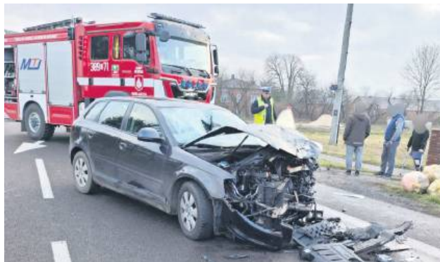
Kierująca audi najpierw potrafiła pieszego, a potem czołowo zderzyła się z innym samochodem.

W Wielączy kierująca audi potrafiła przechodzącego przez jezdnię 72-latkę, po czym zjechała na przeciwny pas ruchu i czołowo zderzyła się z kierującą fordem. Niestety, pieszy w wyniku odniesionych obrażeń zmarł na miejscu wypadku.