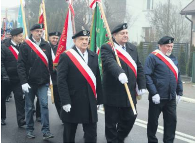
Obchody 83. rocznicy wysiedlenia Skierbieszowa oraz okolicznych wiosek odbyły się 30 listopada.

mniano, że wysiedlenia z 1942 r. objęły nie tylko Skierbieszów, ale również liczne okoliczne miejscowości. Ludność była wypędzana ze swoich gospodarstw, a rodziny często rozdzielano. Tragiczne wydarzenia na trwałe wpisały się w historię regionu i pozostają ważnym elementem lokalnej tożsamości.