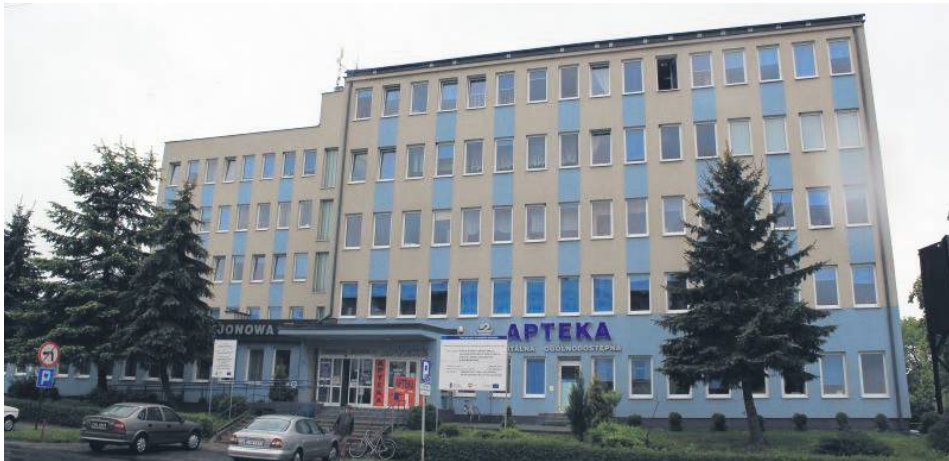
W zaproponowanych zmianach podstawową opiekę zdrowotną w przychodni w Hrubieszowie miałyby sprawować spółka z Zamościa.

– Mamy poważny problem, jeżeli chodzi o podstawową opiekę zdrowotną. Boimy się, że dzisiaj jeszcze są lekarze, ale jak wiemy, czas nie stoi w miejscu. Może się okazać, że starsi lekarze mają swój wiek i mogą w każdej chwili odejść. Nie możemy sobie pozwolić, żeby POZ w Hrubieszowie, Teratynie czy Mirczu stał pusty, tak jak w Trzeszczanach. Budynek jest wyremontowany, a stoi pusty. Prowadziliśmy dużo rozmów. Znalazłem lekarzy, którzy są skłonni przyjść do Hrubieszowa i świadczyć usługi medyczne