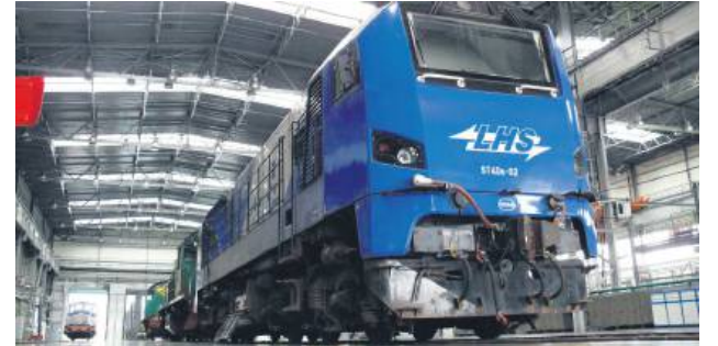
PKP LHS jest najdłuższą linią szerokotorową w Polsce, przeznaczoną do transportu towarowego. Liczy prawie 400 km i łączy kolejowe przejście graniczne Izow-Hrubieszów ze Śląskiem.

– Najważniejszą kwestią jest ratowanie spółki, a jako poseł