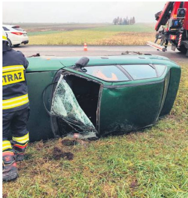
Strażak pomógł kobiecie, która kierowała tym autem.