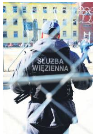
Dwaj funkcjonariusze SW zostali skazani po ucieczce Bartłomieja B. ze szpitala w Radecznicy.

Sąd Rejonowy w Zamościu wymierzył tym strażnikom karę roku więzienia w zawieszeniu na trzy lata. Nałożył na nich również