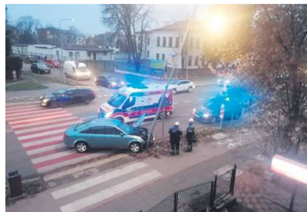
Kierujący audi 57-latek z Zamościa stracił panowanie nad samochodem i uderzył w latarnię.

– Kierowca gwałtownie skręcił, po czym samochód uderzył w latarnię. Na szczęście nikomu nic się nie stało – mówi podkomisarz Dorota