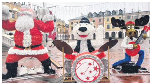
Przed samym ratuszem powstała kolorowa „bajkowa kraina”.

Szczegółowe informacje można uzyskać w Urzędzie Gminy Hrubieszów, pok. nr 8, tel. 84 696 26 81 wew. 22 w godzinach pracy urzędu.