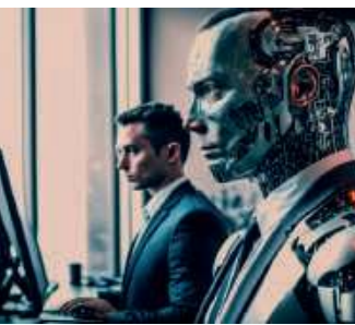
AI – rewolucja technologiczna, jakiej jeszcze nie było? / 12