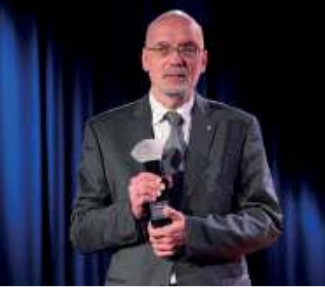
Wielka misja narodów / 4