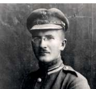
Od mitingu w Paryżu do Katynia. Zamilczana polska gwiazda / 20