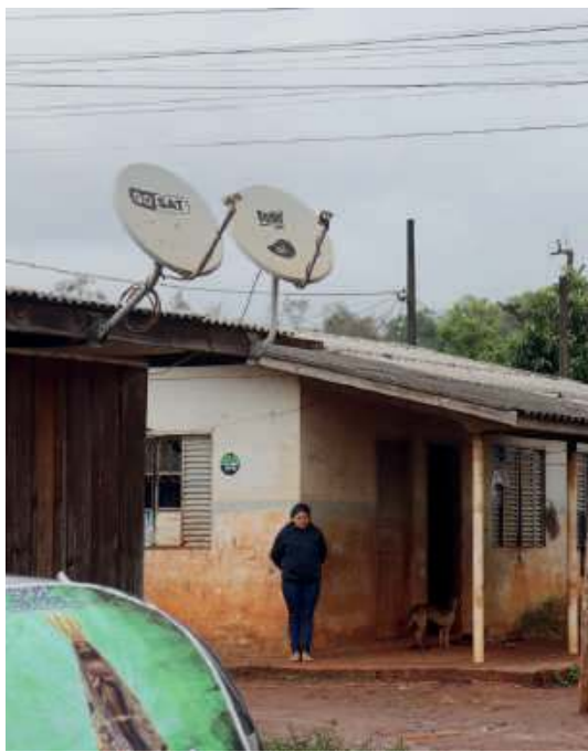
Misjonarze próbują możliwie często objeżdżać wioski znajdujące się w pobliżu ich parafii. Nie zawsze jednak jest to możliwe. Wówczas pozostaje czekanie...

odbywać się uroczyste obchody narodowego święta Matki Bożej z Aparecidy, patronki całej Brazylii. Szczególnie ukochanej właśnie przez rdzenny lud brazylijskiej ziemi.