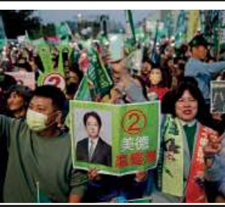
Tajwan postawił na kontynuację i obronę suwerenności / 66