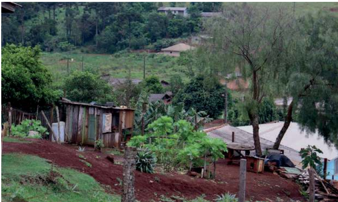
Pomimo dobrych warunków klimatycznych, tutejsza ziemia wcale nie jest łatwa w uprawie.

gadywać po portugalsku, którym zresztą znakomicie włada większość z nich.