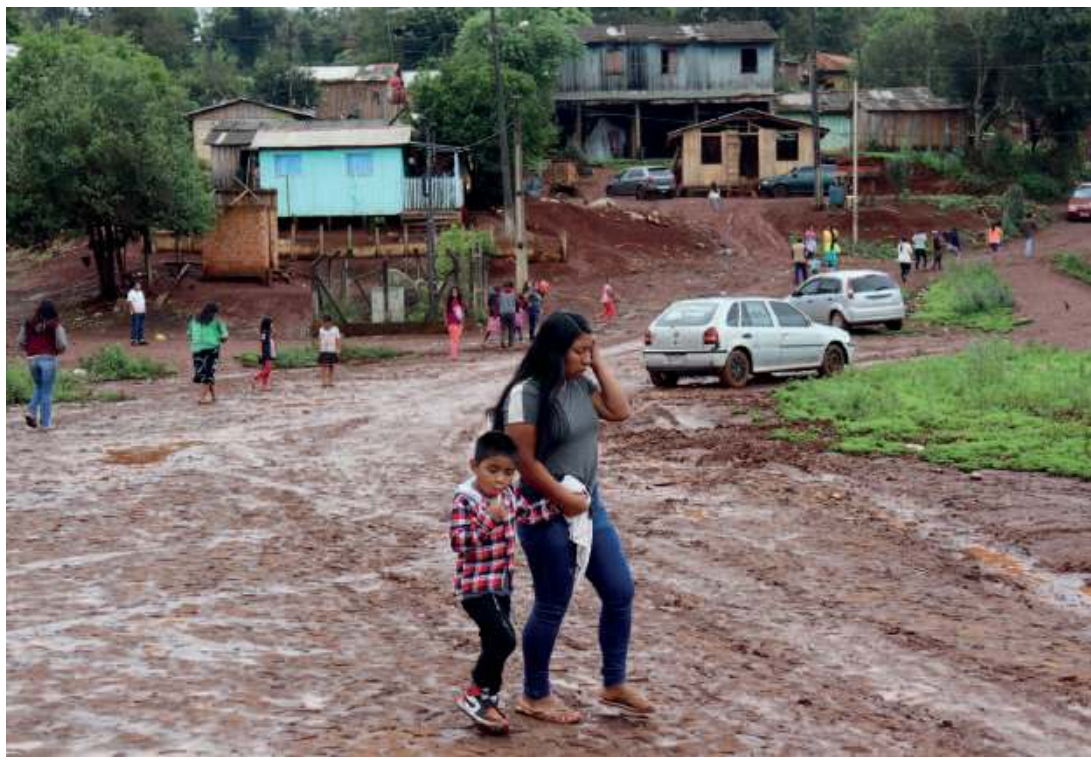
Zamieszkujący rezerwat Indianie często żyją z dnia na dzień. Na patrzenie w przyszłość zwyczajnie brakuje chęci. A często i nadziei.

Świst czajnika z gotującą się wodą roznosi się po niewielkiej kuchni na kościelnej plebanii. Wydostająca się przez małąk nieszczelność para unosi się prędko pod sam sufit. W pomieszczeniu póki co nie ma jeszcze nikogo. Na pustym drewnianym stole stoi paczka dropsów. I kubek z niedopitą kawą. Całość kuchni utrzymana jest w bardzo oszczędnej formie. Ot, zlew, suszarka i niewielka kuchenka.