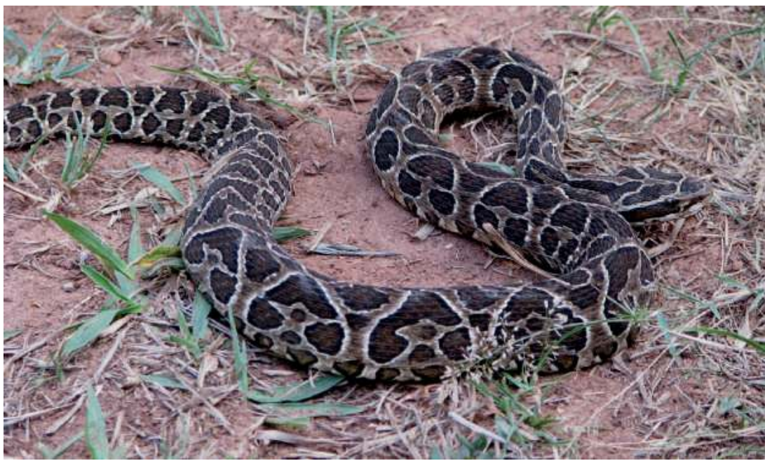
Urutu cruzeiro to niezwykle jadowity i agresywny wąż. Wśród Indian stanu Paraná znany doskonale ze skłonności do atakowania człowieka.

uchroniła księdza Stanisława przed rabunkiem i kolejnymi problemami. Jednak tamten wypadek sprawił, że jeszcze przez dłuższy czas duchowny będzie zasiadał za kierownicą z lekką obawą.