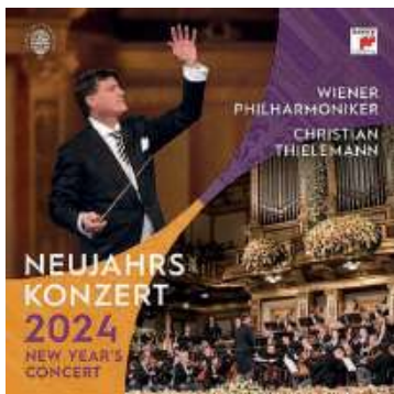
Wiener Philharmoniker, Christian Thielemann, NEW YEAR'S CONCERT 2024, Sony Classical

Wiadomo, że w przyszłym roku (okrągłej rocznicy urodzin Straussa) po raz siódmy batutę przejmie wybitny Włoch Riccardo Muti. Gdy w trakcie pandemii przyszło mu prowadzić koncert bez udziału publiczności, wypowiedział słowa, które być może najlepiej nadają sens tym corocznym spotkaniom. „[...] wierzymy w przekazywanie muzyki. Przynosimy radość, nadzieję, braterstwo, miłość. Muzyka nie jest ważna tylko dlatego, że jest rozrywką. Muzyka nie jest tylko za wodem. Muzyka jest misją. I dlatego wykonujemy ten zawód. [...] Mój apel do wszystkich rządów, premierów, prezydentów – weźcie pod uwagę kulturę jako najważniejszy element rozwoju społeczeństwa”. ■