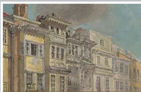
Judith Flanders ŻYCIE CODZIENNE W LONDYNIE DICKENSA