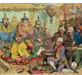
Filizanka herbaty, fajeczka opium / 52