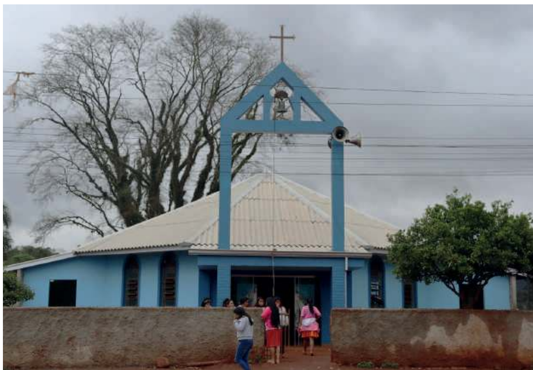
Dla wielu z tutejszych Indian misja to odskocznia od smutnej rzeczywistości.

oknem kroki po piaszczysto-żwirowej drodze zwiastują, że także dzisiaj będzie miał mnóstwo pracy.