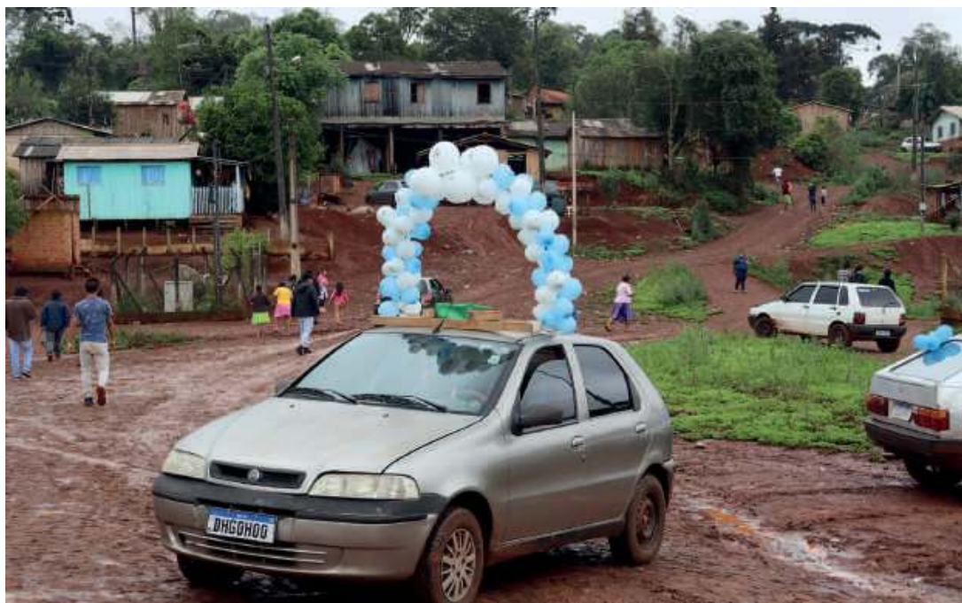
Życie w tej części świata wcale nie oznacza łatwej doli. Bieda, ubóstwo, nędza... Większość mieszkańców ledwo wiąże koniec z końcem.

krofonu. Jest w swoim żywiole. Kapłan szybko dostaje się na scenę.