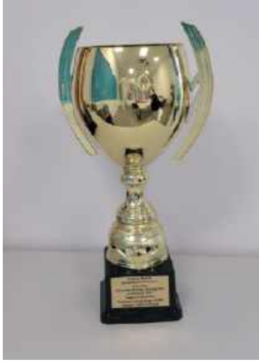
Puchar Wicemistrza krajowego - AgroLiga 2024

Przystąpienie Polski do Unii Europejskiej przyniosło nowe wezwania i kluczowe zmiany dla Zakładów Mięsnych Somianka. Zapadła decyzja o budowie nowej ubojni, która to pozwoliła na stworzenie nowoczesnej linii ubojowej, umożliwiającej zwiększenie uboju do 70 sztuk trzody chlewnej na godzinę. W 2012 roku zakład skorzystał z Funduszy Unijnych, wymieniając cały park maszynowy. W 2020 roku firma otworzyła własne Centrum Dystrybucji wraz z niezależną flotą transportową, co umożliwiło pełną kontrolę nad zaopatrzeniem placówek handlowych.