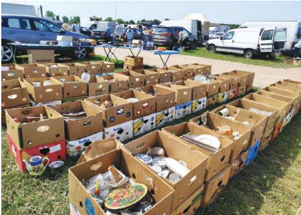
forse. kartonów, a w nich np. węzeł bycze z Ciechanowa i z miast