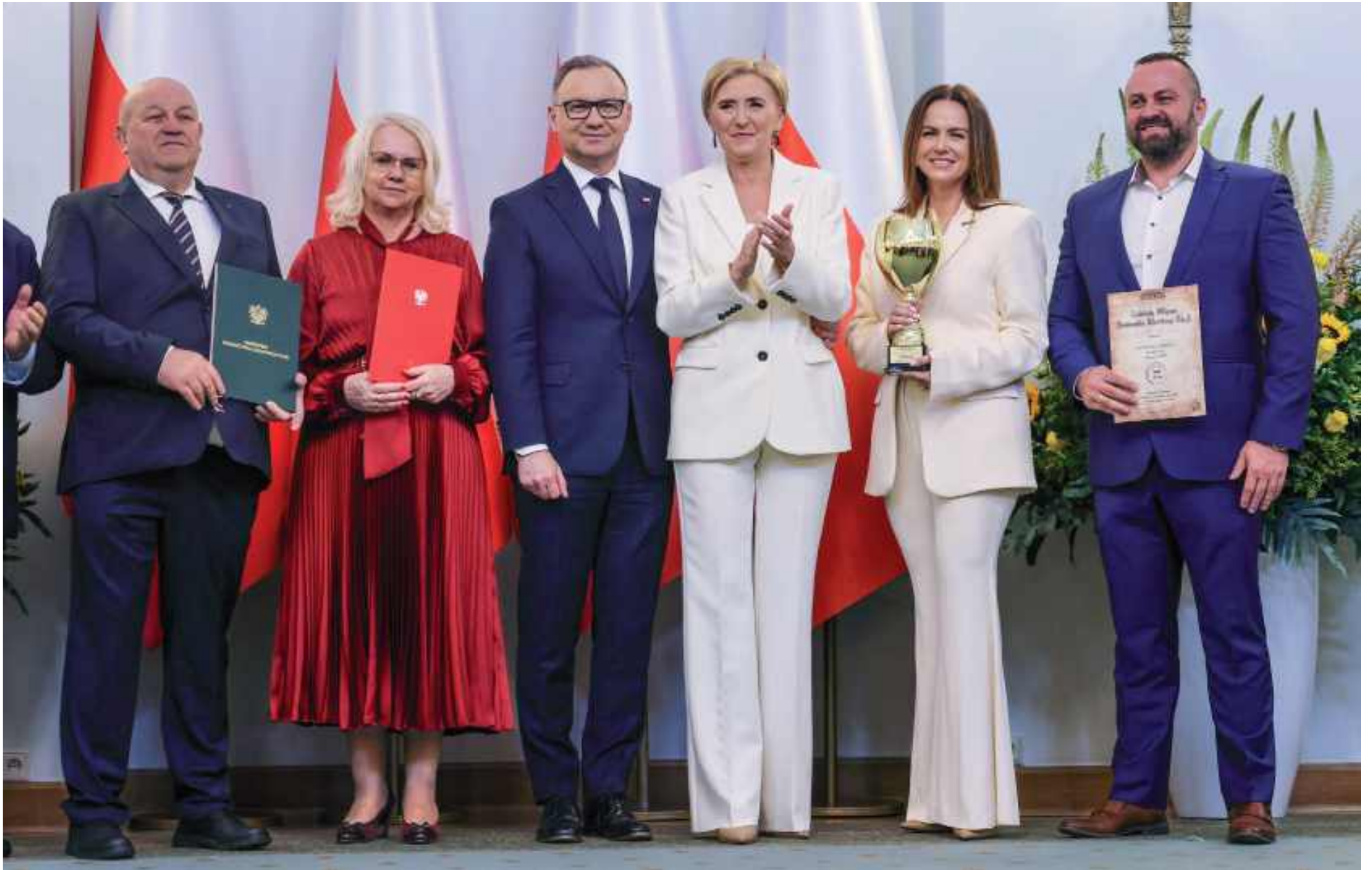
Przedstawiciele Zakładów Mięsnych SOMIANKA odbierający nagrodę z rąk pary prezydenckiej