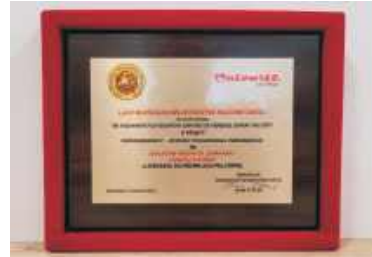
Laur Marszałka 2021 za „Kielbasę dojrzewającą palcówką”