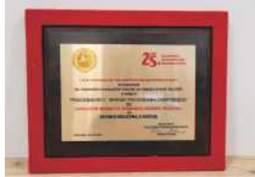
Laur Marszałka 2023 za „Szynkę z kością”

W połowie 2024 roku firma przekształciła się w Zakłady Mięsne „Somianka” Rucińscy Sp.J., która to obecnie zatrudnia blisko 400 pracowników, spośród których niemal połowa pracuje dłużej niż 10 lat. Dobrym przykładem sprzyjającej