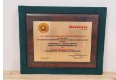
Laur Marszałka 2020 za „Polędwiczkę królewską dojrzewającą”