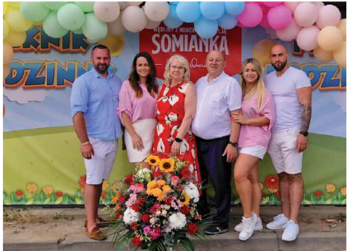
Państwo Rucińscy z dziećmi