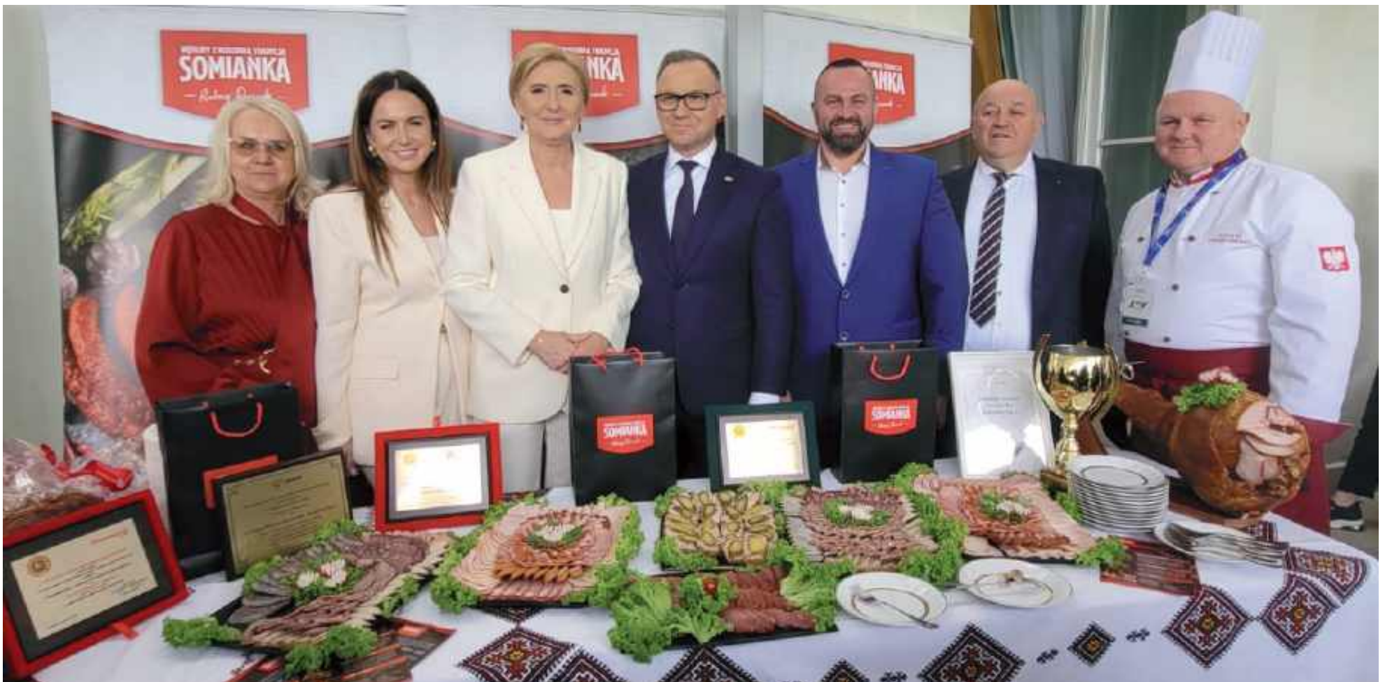
Laureaci przy stoisku wystawowym w pałacu prezydenckim