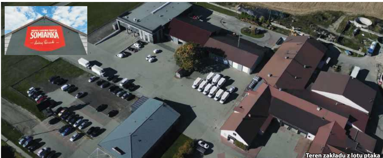
Teren zakładu z lotu ptaka