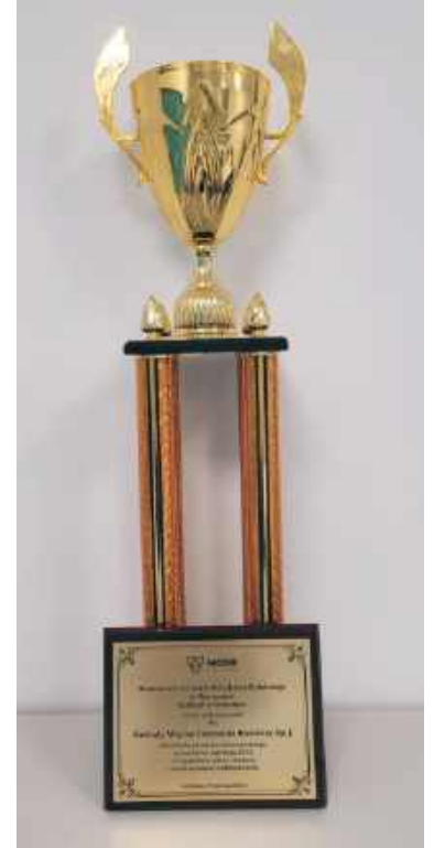
Puchar Mistrza województwa mazowieckiego - AgroLiga 2024

bogatej tradycji i rodzinnych wartości, które z dumą pielęgnują i rozwijają.