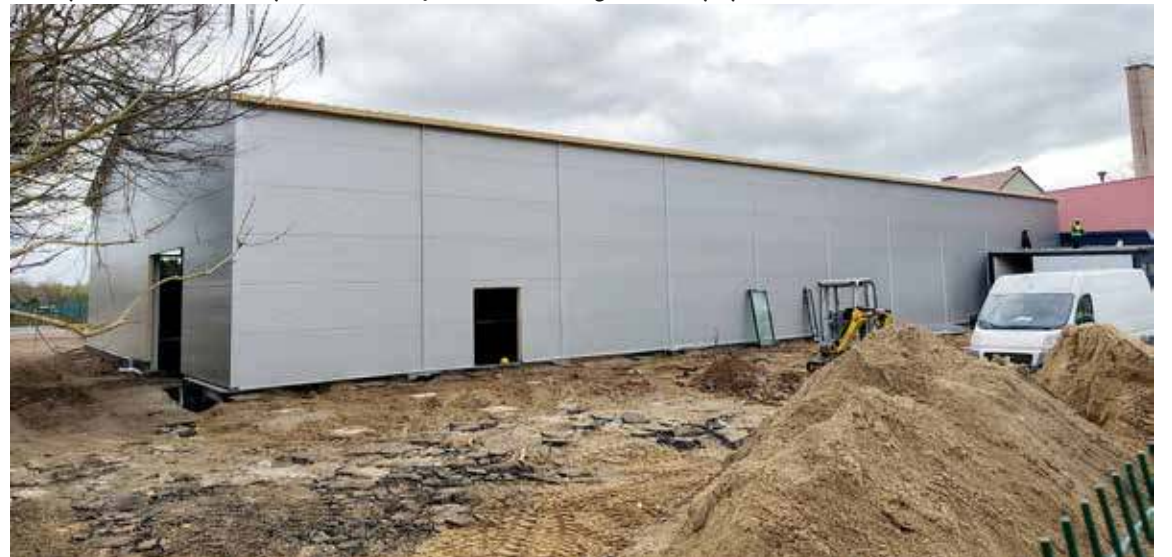
Hala sportowa przy SP nr 2 w budowie, ale ładniej to na pewno nie będzie

PS. Po PRL wydawało się, że gorzej w architekturze miejskiej (wiejskiej także) już być nie może... a jednak... Można? Można!!