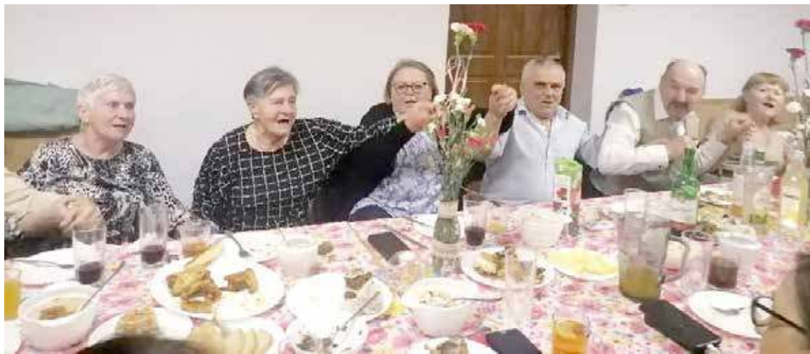
Wspólna biesiada przy stole