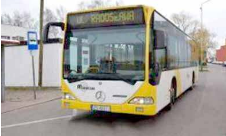
Dotychczasowa linia komunikacji miejskiej nie zostanie poszerzona nawet o jeden przystanek

Wbrew więc wielokrotnie wygłaszanym zapewnieniom ws. poszerzenia trasy przebiegu autobusu komunikacji miejskiej od początku nowej kadencji samorządu, póki co do skutku