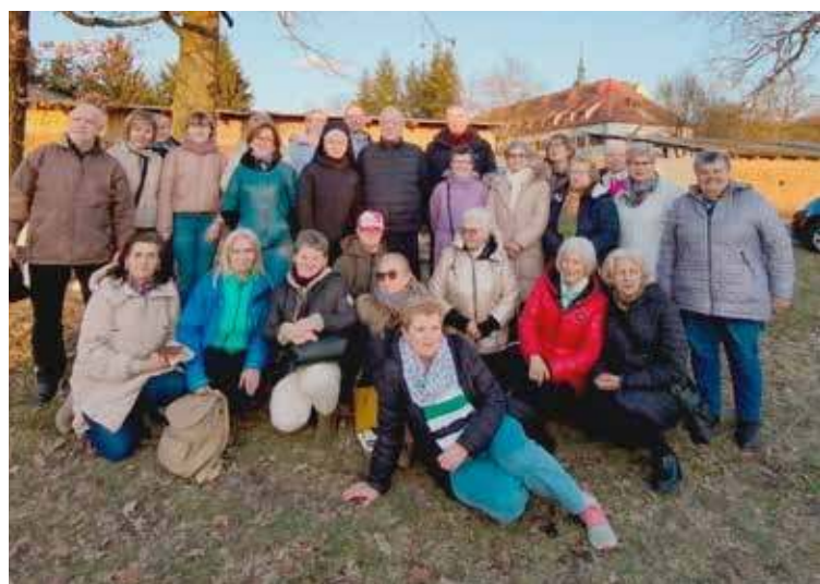
Pielgrzymi z naszej parafii w komplecie