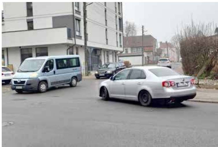
Skrzyżowanie jest dość ruchliwe nie tylko w godzinach szczytu