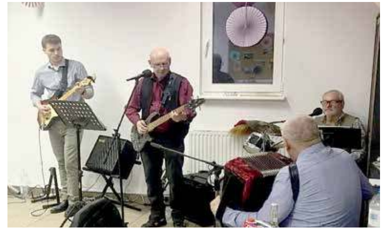
Zespół Retro Relax