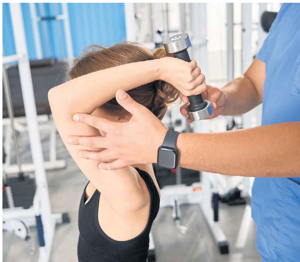
Należy pamiętać, że fizjoterapeuta nie leczy, a przede wszystkim wspomaga proces leczenia oraz znacząco poprawia komfort życia