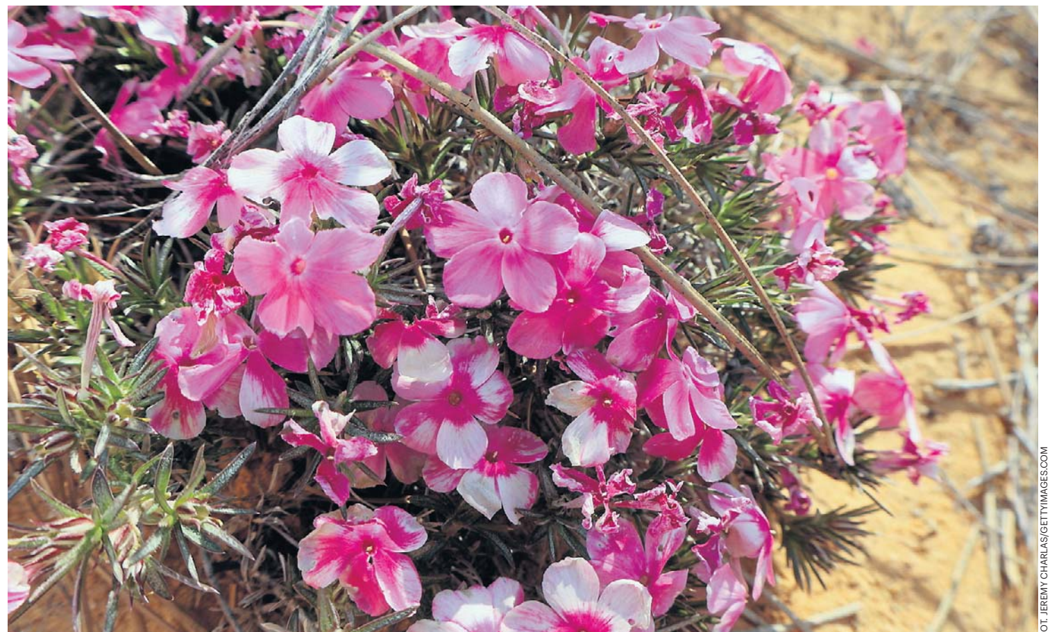
Floksy szydlaste to jedno z podstawowych roślin, jakie warto mieć na skalniaku. Są bardzo niskie, mają płozące pędy pokryte igielkowatymi liśćmi. Ładnie rozrastają się, zadarniając powierzchnię