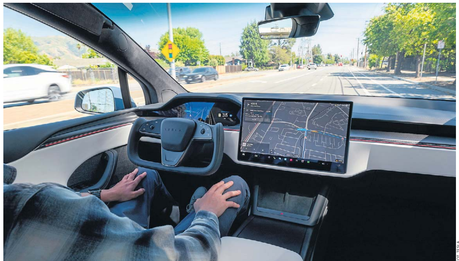
Najnowsze samochody działają jak „centra danych na kołach”, zbierając ogromne ilości informacji o pojeździe, kierowcy i pasażerach. Dane te są gromadzone, przetwarzane i wysyłane do serwerów producentów

Współczesny samochód widzi, słyszy i zapamiętuje. Rejestruje lokalizację, prędkość, styl jazdy, a także dane z telefonu