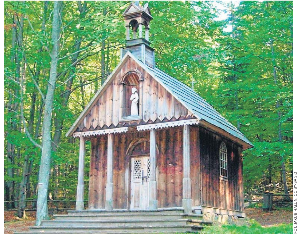
Przy szlaku prowadzącym ze Świętej Katarzyny na Łysicę znajduje się źródło ze smaczną wodą oraz drewnianą kapliczką św. Franciszka

W Górach Świętokrzyskich możecie też wybrać się na wędrowkę szlakiem „Śla-