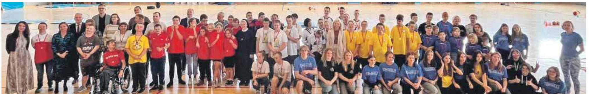
Pamiątkowe zdjęcia uczestników i organizatorów spartakiady