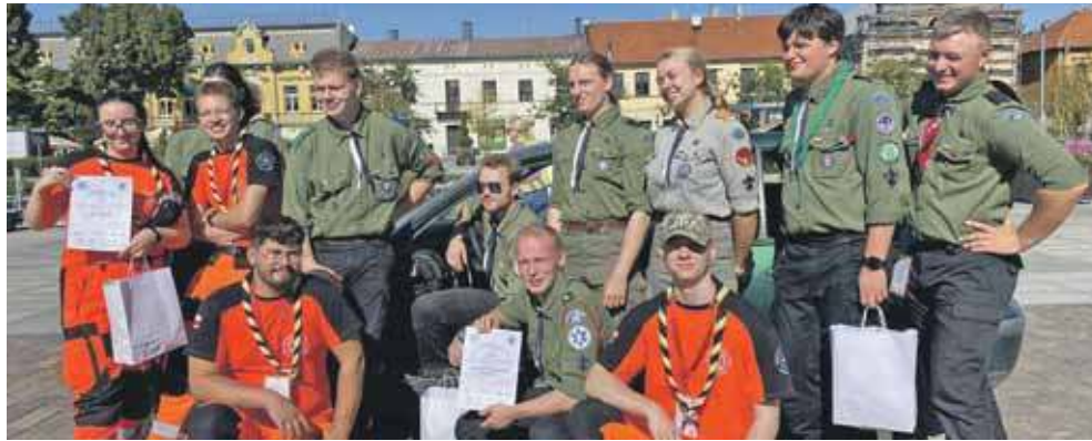
Harcerski Klub Ratowniczy z Tarnowskich Gór wystartował w Ogólnopolskich Zawodach ZHP w Ratownictwie

Zawodnicy zmierzyli się między innymi ze skutkami ataku nożownika w autobusie z udziałem 50 poszkodowanych osób, musieli pomóc