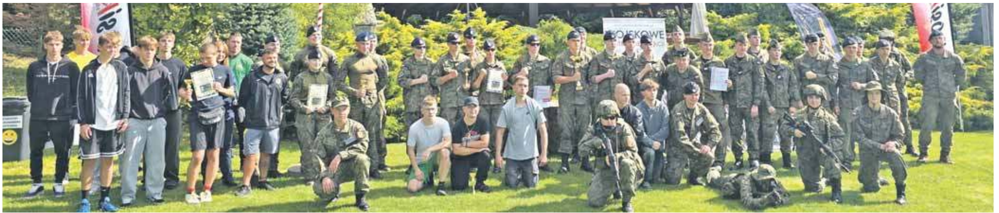
Uczestnicy rywalizowali w konkurencjach nawiązujących do wojskowych realiów