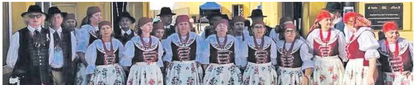
Wśród zespołów wokalnych wygrał chór Sonata z Miejskiego Domu Kultury w Kaletach

Wśród zespołów wokalnych wygrał chór Sonata z Miejskiego Domu Kultury w Kaletach. Jeżeli chodzi o zespoły pieśni i tańca to z wyróżnienia może cieszyć