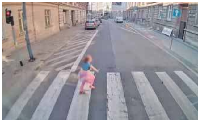
Dziewczynka wbiegła na przejście na czerwonym świetle

Niestety, gwałtowne hamowanie sprawiło, że jedna z pasażerek ucierpiała – kobieta uderzyła głową w kaskownik i konieczne było wezwanie zespołu medycznego. (EKA)