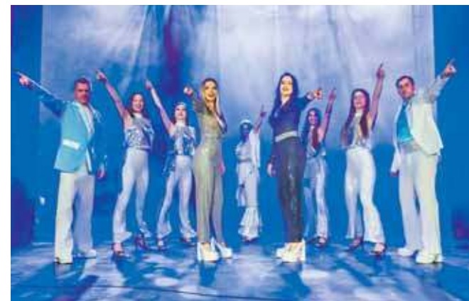
Show koszalińskiego Teatru Variete Muza będzie można zobaczyć w najbliższą niedzielę w Radzionkowie

Publiczność usłyszy największe przeboje zespołu, m.in.: Waterloo, SOS, Mamma Mia, Super Trouper, Dancing Queen, I Have a Dream, Money, Money,