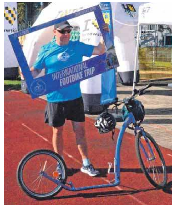
Zdjęcie na pamiątkę

International Footbike Trip w Tarnowskich Górach był nie tylko sportowym wy-