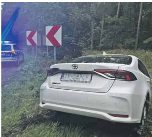
Toyota wjechała do przydrożnego rowu, a jej kierowca został zabrany do szpitala

Toyota wjechała do przydrożnego rowu, a jej kierowca został zabrany do szpitala na dalsze badania. Oboje kierowcy byli trzeźwi. (MIR)