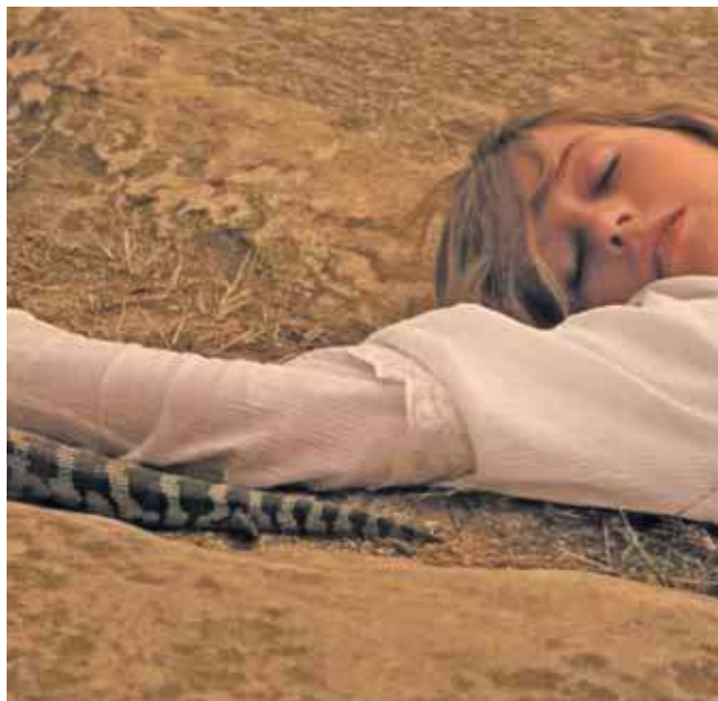
„Piknik pod Wiszącą Skałą” to już klasyka kina

Inauguracja sezonu w DKF odbędzie się 3 października o godz. 18. Bilety wstępu kosztują 13 i 16 zł. (EKA)