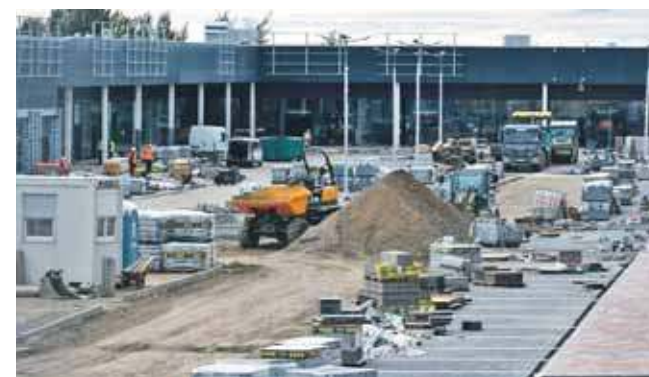
Centrum handlowe przy ul. Zagórskiej ma być otwarte jeszcze w tym roku

Grupa Saller informuje, kiedy planuje zakończenie prac przy budowie centrum handlowego przy ul. Zagórskiej w Tarnowskich Górach. Podaje też listę sklepów, które się w nim znajdą.