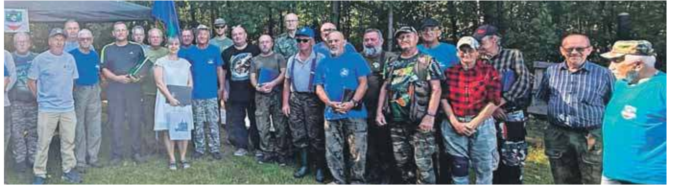
Koło Polskiego Związku Wędkarskiego nr 59 Tarnowskie Góry świętowało jubileusz 75-lecia