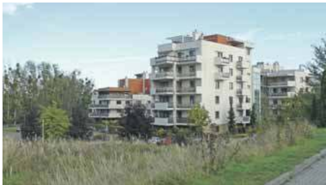
Mieszkańcy mówią, że nowy blok zajmie ostatni teren zielony w okolicy. Do tego byłby na wzniesieniu, a reszta osiedla jest w zagłębieniu terenu

Wskazują też na kwestie problemów z brakiem miejsc parkingowych czy ryzyka zalewania podziemnych garaży. To już się zdarza, a po zabetonowaniu terenów zielonych będzie jeszcze gorzej.