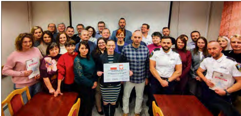
Gmina Zdzieszowice podpisała z wojewodą opolskim sześć umów na łączną kwotę 819 665,93 zł.

Gmina Zdzieszowice pozyskała blisko 820 tysięcy złotych na realizację zadań z zakresu Ochrony Ludności i Obrony Cywilnej. Środki z budżetu państwa pozwolą na zakup specjalistycznego sprzętu, modernizację magazynów, szkolenia oraz zapewnienie awaryjnego zasilania dla urzędu. Część działań, w tym szkolenia dla kadry, już ruszyła.