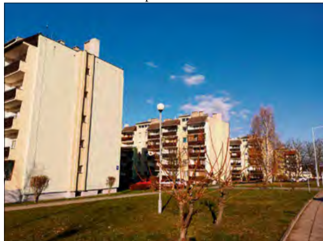
Krapkowskie osiedle Sady - nowe parkingi na razie tutaj nie powstaną.

Po nagłośnieniu problemu przez mieszkańców w sprawę zaangażował się również burmistrz Krap-