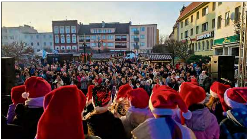
Występy przedszkolaków oraz uczniów szkół podstawowych, które przyciągnęły tłumy.