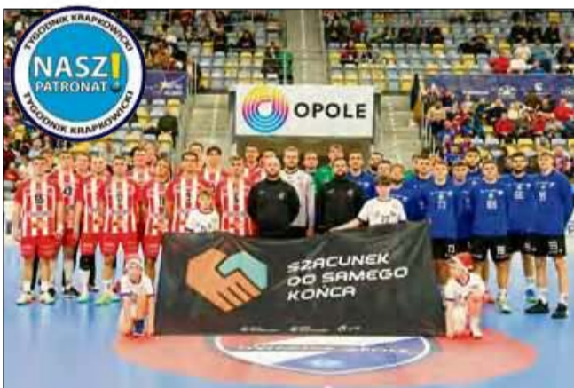
Gwardziści zostali pokonani.

Druga runda Orlen Superligi nie zaczęła się dobrze dla opolskich szczypiornistów. Zawodnicy Corotopu mocno walczyli, ale to piłkarze z Ostrowa Wielkopolskiego byli silniejsi pokonując nas 29:21.