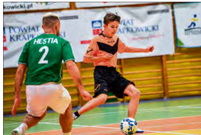
Ambitni gracze Góraźdzy jak na razie zamykają ligową stawkę.