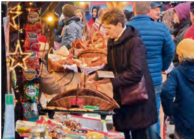
Lokalni producenci z bogatą ofertą świąteczną.