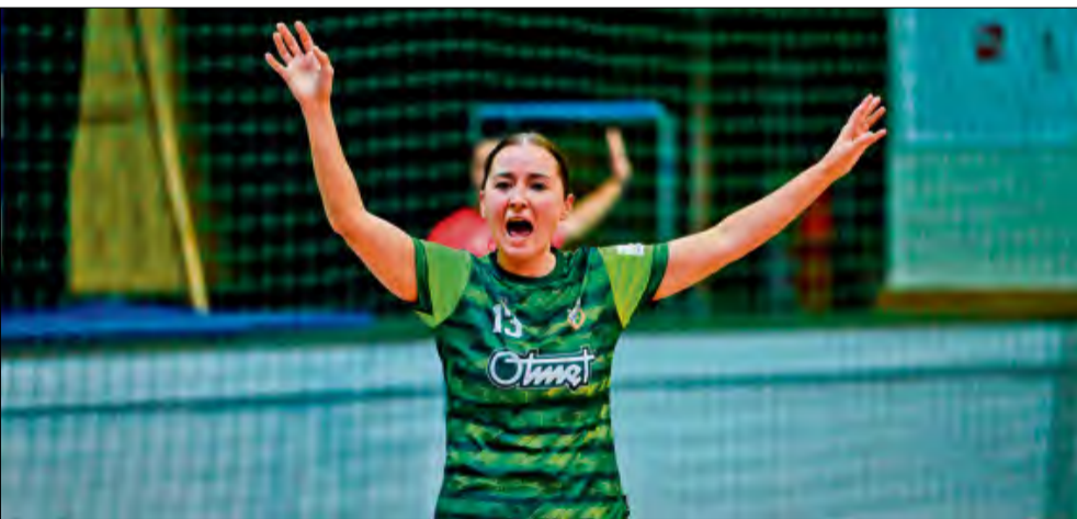
W tym sezonie krapkowiczanki już siedmiokrotnie cieszyły się ze zwycięstwa.