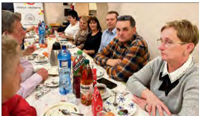
Mieszkańcy Strzebniewa podczas wspólnego świątecznego spotkania i kolędowania.

Grudzień w Strzebniewie, dzielnicy Gogolina, upłynął pod znakiem lokalnych spotkań i inicjatyw skierowanych do mieszkańców. Od mikołajkowych upominków dla dzieci po wspólne kolędowanie i dzielenie się opłatkiem - wydarzenia miały charakter integracyjny i były elementem przygotowań do świąt Bożego Narodzenia.