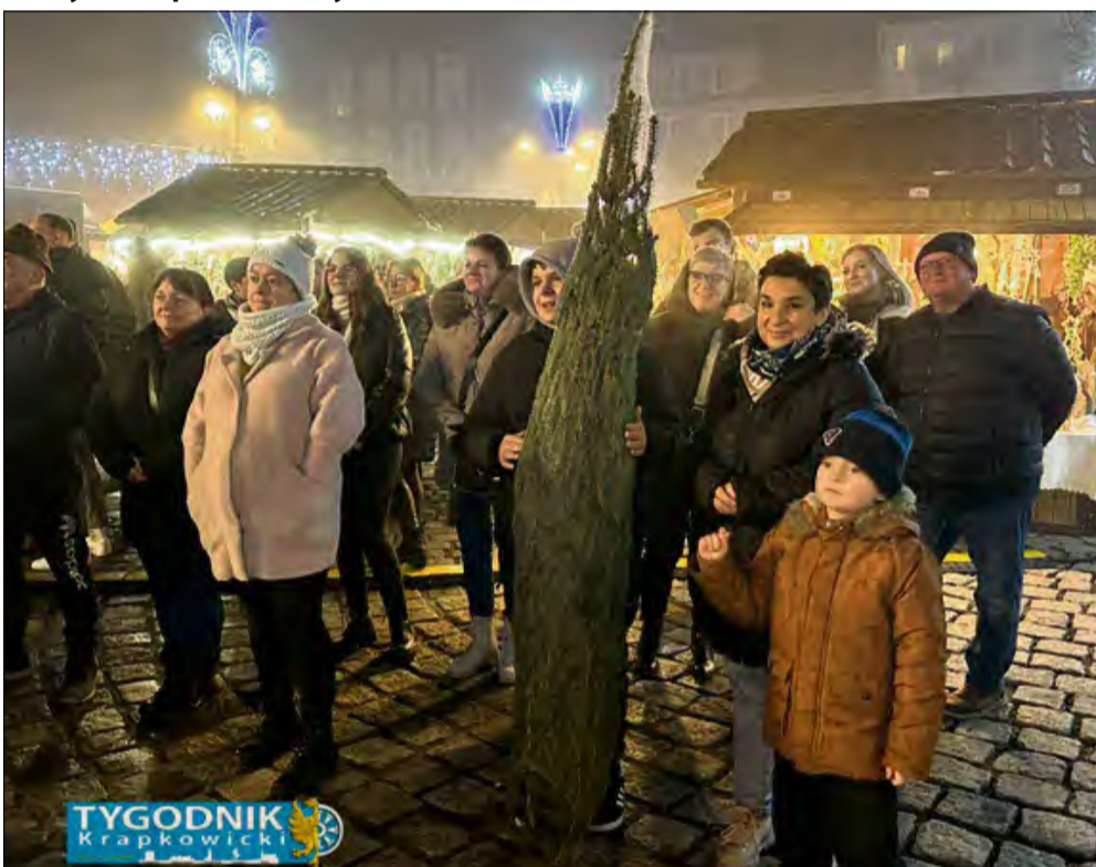
Uśmiechnięci mieszkańcy odbierają swoje pachnące lasem choinki.