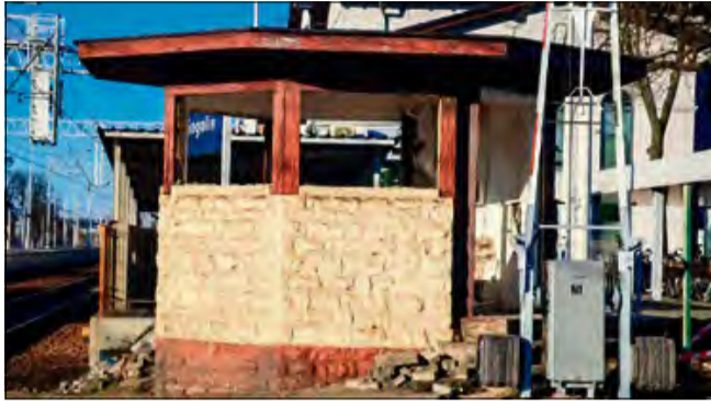
W momencie składania tego wydania „Tygodnika Krapkowickiego” budka dróżnicza jeszcze stała na swoim miejscu.

W odpowiedzi na informacje o planowanej rozbiórce, w ostatnich dniach miały miejsce drobne manifestacje mieszkańców, wyrażających sprzeciw wobec zniszczenia budki. Sprawę oficjalnie podjął również burmistrz Gogolina Krzysztof Reinert. Jak poinformował nasz tygodnik, urząd miejski nie otrzymał wcześniej żadnego oficjalnego zawiadomienia o zamiarze rozbiórki od właściciela obiektu, czyli PKP. Samorząd nie jest jednak stroną w tej sprawie, a spółka kolejowa