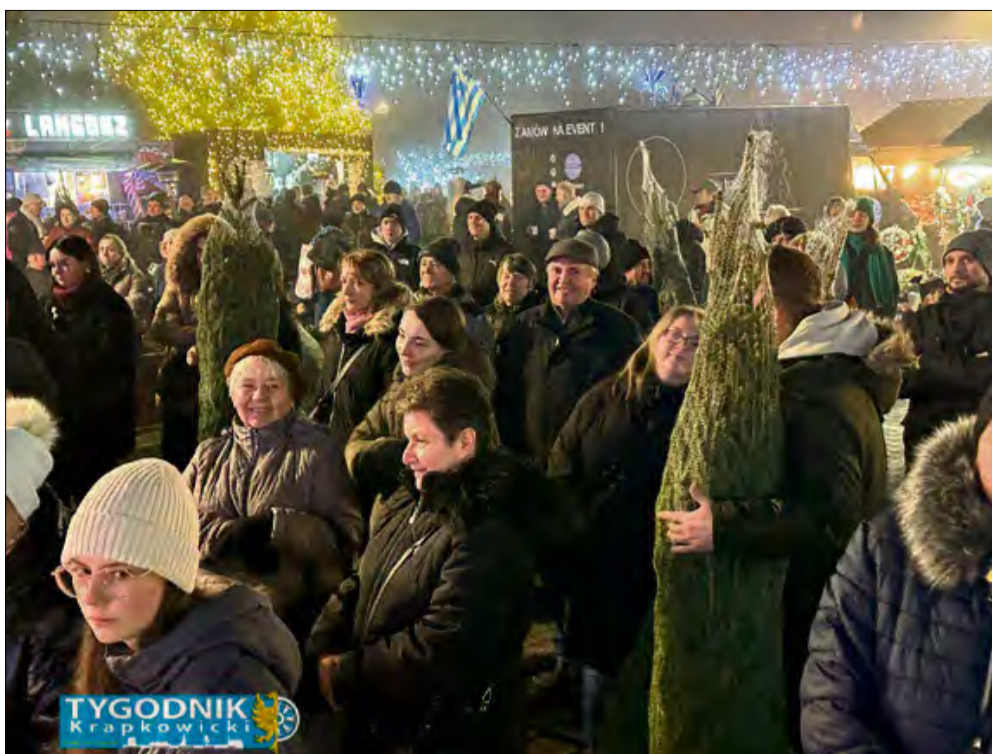
Piątkowy finał akcji zgromadził tłumy na krapkowickim rynku.