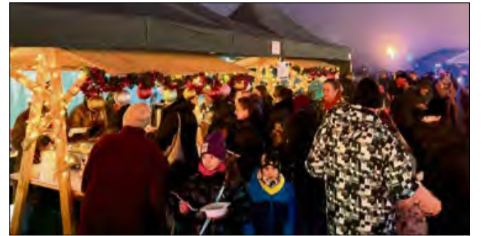
Tłumy mieszkańców i gości przewinęli się przez tegoroczną edycję Strefy Ciepłych Serc.

środków Europejskiego Funduszu Społecznego Plus 2021–2027.