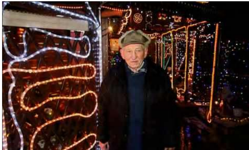
W tym roku iluminacja u Jaschików rozbłyśnie po raz ostatni.

– Nie chcieliśmy odpuszczać – przyznają Jaschiko-