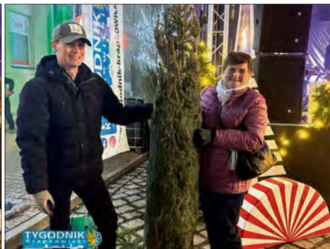
Uczestnicy akcji pozują z wybranymi drzewkami, gotowi do rozpoczęcia świąt.