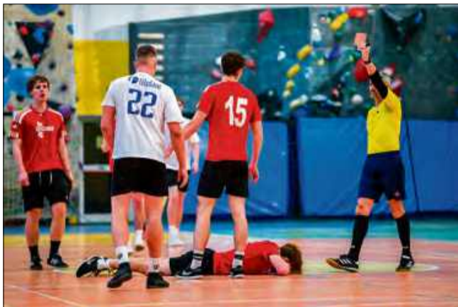
Sędzia nie miał litości dla gracza ekipy z Głogówka.

ułamek sekundy wcześniej, arbiter nie miałby wątpliwości i gola uznał. Żadnych kontrowersji nie było w potyczce „Szewbudzian” przeciwko Autoserwisowi. Faworyt długo prowadził różnicą zaledwie jednego trafienia, lecz im bliżej było końca meczu tym kolejne