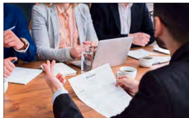
Udział w pracach komisji konkursowej to nie tylko obowiązek, ale przede wszystkim realny wpływ na to, które inicjatywy obywatelskie i społeczne otrzymają wsparcie finansowe gminy.

Urząd Miejski w Zdzieszowicach oficjalnie rozpoczął nabór do bazy kandydatów na członków komisji konkursowych. Osoby z tej puli będą mogły zostać powołane do oceny ofert składanych przez organizacje pozarządowe w otwartych konkursach grantowych, które odbędą się w 2026 roku.