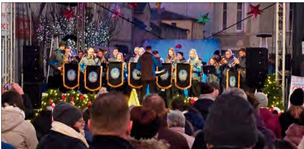
Na jarmarku nie mogło zabraknąć Krapkowickiej Orkiestry Dętej.