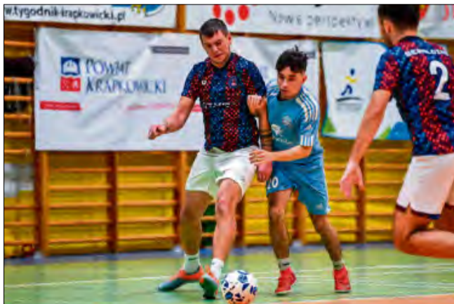
Otmęt SG „z kwitkiem” odprawił LKS Obrowiec.