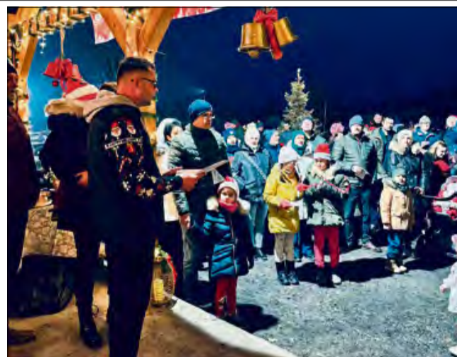
W Stajni pod Dębami w Pietnej zagościła prawdziwa świąteczna magia.

- W imieniu burmistrza Gogolina Krzysztofa Reinerta mieszkańcom przeka-