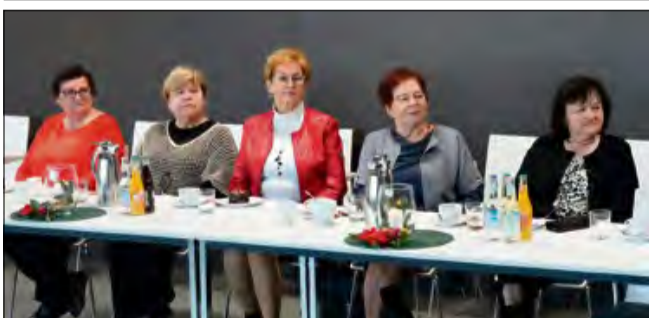
To było ostatnie posiedzenie rady senioralnej w Gogolinie.

W gminie Gogolin opracowano poradnik dotyczący postępowania w sytuacjach kryzysowych. Inicjatywa powstała w odpowiedzi na postulat zgłoszony we wrześniu przez Radę Seniorów.