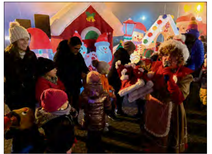
Można powiedzieć, że gogolińska Strefa Ciepłych Serc to już taka mała, lokalna tradycja.

Strefa Ciepłych Serc jest częścią projektu „Bliżej rodziny i dziecka – wsparcie rodzin przeżywających problemy opiekuńczo – wychowawcze oraz wsparcie pieczy zastępczej – etap II” realizowanego w ramach Programu Regionalnego Fundusze Europejskie dla Opolskiego 2021–2027, współfinansowanego ze