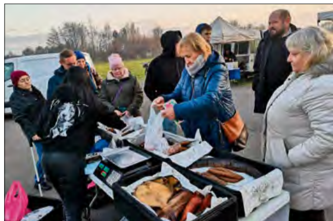
Przed świętami i przed krótką przerwą – „Straganek” na placu Eichendorffa ponownie zaprasza po regionalne specjały i swojskie smaki.

Są takie inicjatywy, które - choć kameralne z założenia - potrafią na stałe wpisać się w pejzaż życia regionu. „Straganek” bez wątpienia należy do tej kategorii. W najbliższy czwartek, 18 grudnia, na placu Eichendorffa odbędzie się przedświąteczna edycja tego mini-targu, który z każdą kolejną odsłoną przyciąga coraz więcej mieszkańców Krapkowic i okolic. Wydarzenie potrwa od godziny 14.00 do 17.00.