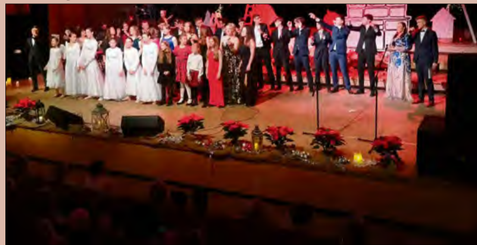
Publiczność w pełnej sali Filharmonii Opolskiej świętowała razem z artystami.