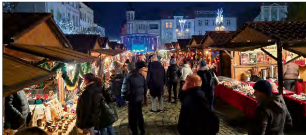
Główna aleja krapkowickiego jarmarku.