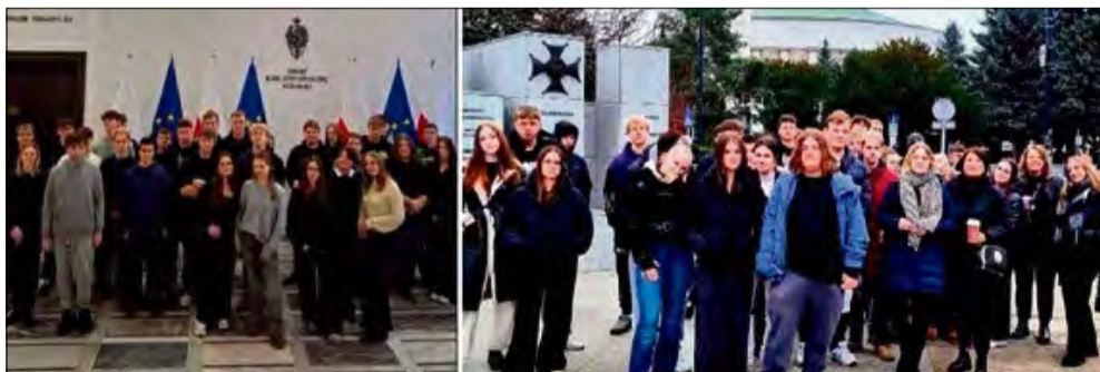
Zwiedzając gmachy i sale sejmowe oraz senatorskie, młodzi ludzie poznali od kulis pracę parlamentarzystów.

Uczniowie Zespołu Szkół im. Jana Pawła II w Zdzieszowicach przeżyli intensywną, praktyczną lekcję obywatelską podczas wizyty w Warszawie. Głównym punktem programu było zwiedzanie Parlamentu RP, gdzie poznali kulisy pracy ustawodawców. Podróż obfitowała także w atrakcje historyczne, sportowe i świąteczne.