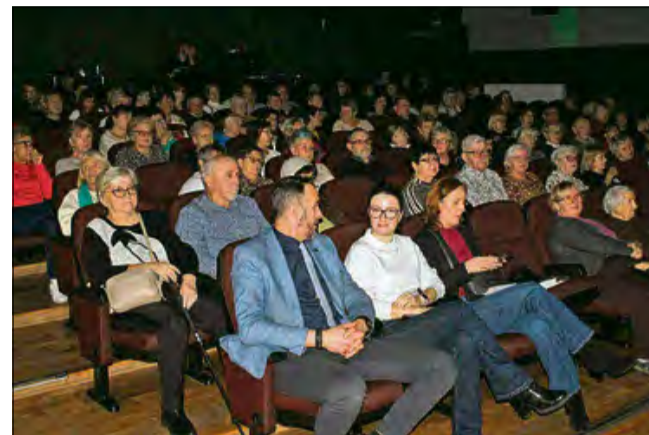
Świąteczne spotkanie seniorów w Zdieszowicach odbyło się w radosnej, pełnej oczekiwania na Boże Narodzenie atmosferze.

Na zaproszenie burmistrza Zdieszowic oraz Gminnej Rady Seniorów odpowiedziało wielu seniorów. Impreza zgromadziła nie tylko mieszkańców, ale i gości z innych części powiatu krapkowickiego. Wszyscy spędzili razem popołudnie, które doskonale wprowadziło w nastrój nadchodzących świąt. Centralnym punktem wydarzenia były występy artystyczne. Nie zabrakło tańców oraz pokazów mażorettek. Ważną była również możliwość spotkania i rozmowy w miłym gronie. Przy przygotowanym słodkim poczęstunku seniorzy dzielili się wspomnieniami, składali sobie życzenia i cieszyli się towarzystwem sąsiadów oraz znajomych.