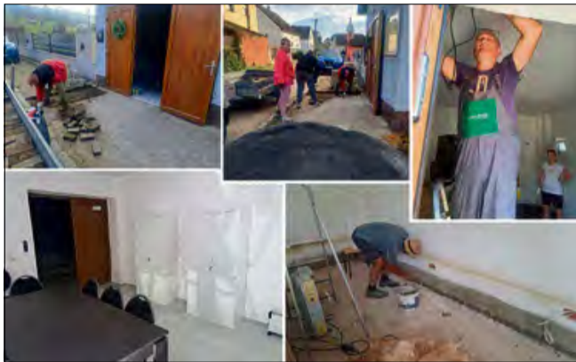
Dzięki pozyskanym środkom „Mała Straż” w Ściborowicach przeszła gruntowną modernizację.

Dzięki wykonanym pracom znacząco poprawił się stan i funkcjonalność obiektu. Kluczowe zadania objęły zabezpieczenie konstrukcji poprzez iniekcję murów, kompleksową wymianę instalacji elektrycznej oraz prace wykończeniowe wewnątrz budynku. W ich skład weszło położenie płytek podłogowych, montaż nowych drzwi wewnętrznych, wykonanie i malowanie tynków oraz zamontowanie schodów na strych. Równie ważne były zmiany na zewnątrz, gdzie ułożono kostkę brukową, co poprawiło dostępność do obiektu. Znaczącym w tym przedsięwzięciu było zaangażowanie lokalnej społeczności. Stowarzyszenie podziękowało mieszkańcom wioski, którzy znaczną część