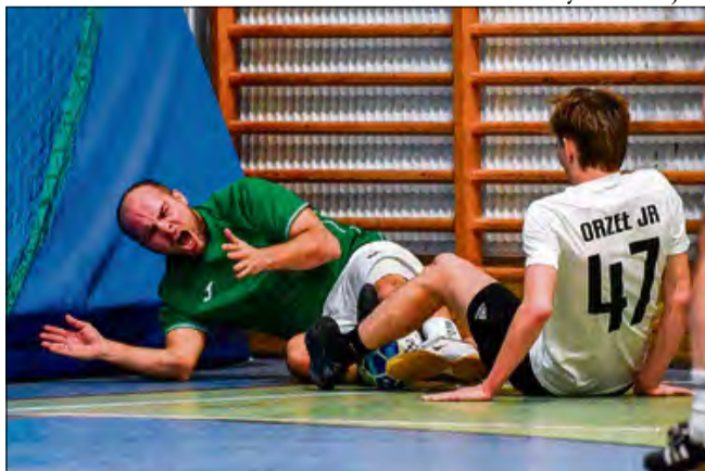
Starcie obrońcy tytułu mistrzowskiego z OQ Squad nie było spacerkiem.