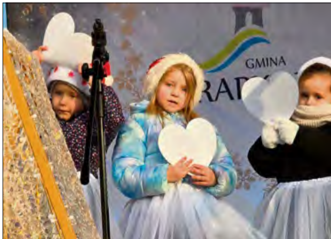
Kolędy, pastorałki i świąteczne utwory w wykonaniu dzieci.