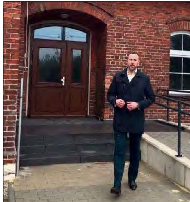
Przekazanie mieszkań to kolejny krok w rozwoju infrastruktury mieszkaniowej na terenie gminy.

1 grudnia gmina Zdzieszowice oficjalnie przekazała pięć nowych, komfortowych mieszkań komunalnych w Rozwadzy. Nowe lokale przeznaczone są wyłącznie dla mieszkańców gminy Zdzieszowice, którzy spełniają określone kryteria. Dzięki środkom z programu udało się zrealizować tę ważną społecznie inwestycję, mającą na celu