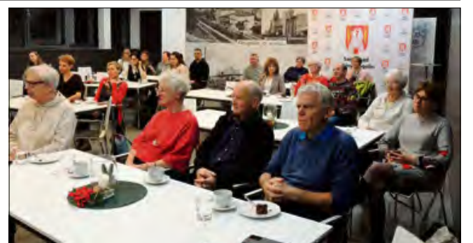
Spotkanie przebiegło w kameralnej atmosferze.

Organizatorzy dziękują wszystkim uczestnikom za