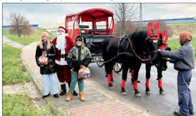
Mikołajkowa niespodzianka dla dzieci – zaprzęg z „reniferami” wzbudził duże zainteresowanie.

Najpierw 6 grudnia po ulicach Strzebniewa jeździł święty Mikołaj, który odwiedzał dzieci z przygotowanymi upominkami. Wydarzenie wyróżniał zaprzęg z końmi stylizowanymi na renifery, który stał się dodatkową atrakcją i przyciągał uwagę mieszkańców. W przygotowanie przedsięwzięcia zaangażowali się lokalni wolontariusze, którzy pomogli przy pakowaniu prezentów, a także osoby odpowiedzialne za organizację zaprzęgu.