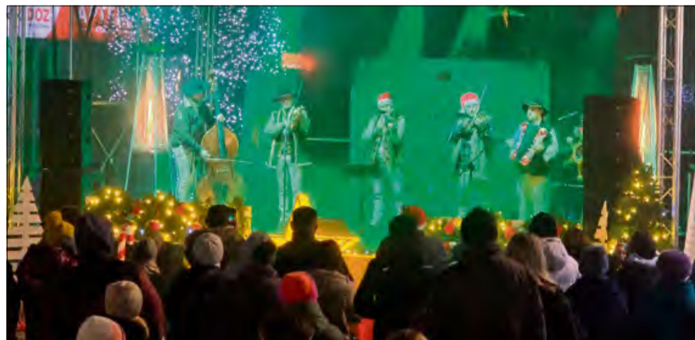
Koncert Kapeli Góralskiej Beskid – główne wydarzenie piątkowego wieczoru.