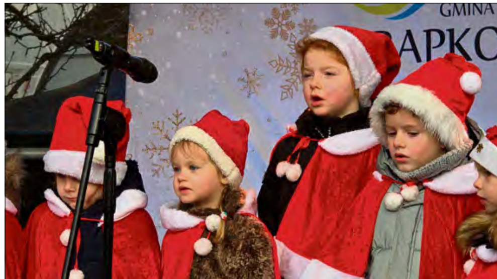
Niedzielne występy najmłodszych artystów z Krapkowic.