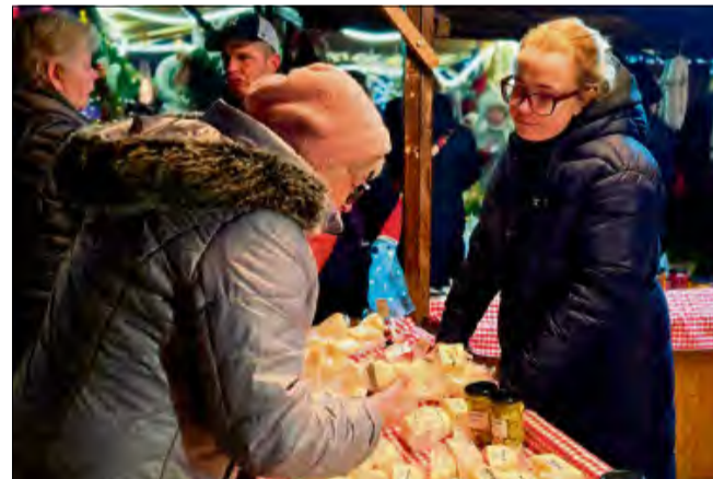
Dużym zainteresowaniem cieszyły się jarmarczne stoiska.