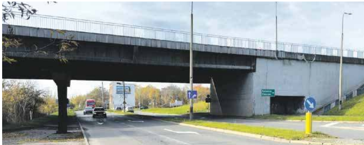
Problem z uszkodzonym wiaduktem spadł na nas całkiem niespodziewanie

BYTOM. ROZPOCZĄŁ SIĘ PROCES GRUNTOWNEJ MODERNIZACJI BĘDĄCEGO W ZŁYM STANIE TECHNICZNYM WIADUKTU WISZĄCEGO NAD ULICĄ SIEMIANOWICKĄ. MAMY PIENIĄDZE NA OPRACOWANIE DOKUMENTACJI TEGO PRZEDSIĘWZIĘCIA, A KIEDY ONA POWSTANIE, PRZYJDZIE CZAS NA POZYSKANIE KOLEJNYCH FUNDUSZY I WIELKIE ROBOTY.