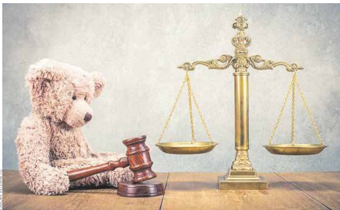
Nie ma czasu na bezsilność. Trzeba działać jeśli partner unika płacenia alimentów

BYTOM. CHOĆ WIELE OSÓB UWAŻA, ŻE ALIMенты TO OBOWIĄZEK RODZICA, KTÓRY NIE WYCHOWUJE NA CO DZIEŃ DZIECI, TO NADAL KARY ZA UNIKANIE PŁACENIA SĄ TAK NISKIE, ŻE KTO NIE CHCE, TEN NIE ZAPŁACI. CZAS TO ZMIENIĆ, BO ZA CWANYCH ALIMENCIARZY PŁACIMY WSZYSCY.