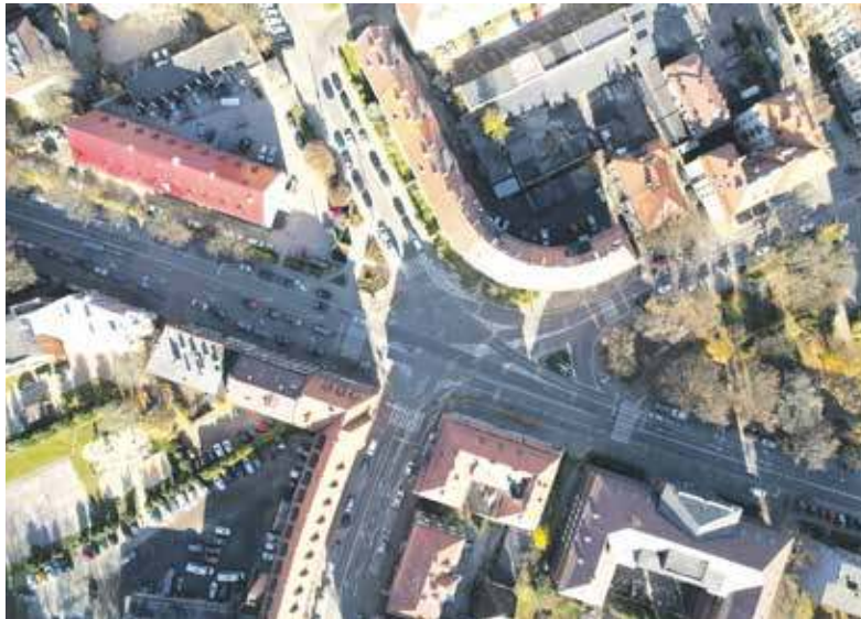
Po remoncie ulicą Strzelców Bytomskich będzie się jeździło przyjemniej

Drugi etap będzie polegał na zwiększeniu obydwu pasów ruchu na ul. Strzelców Bytomskich na odcinku od ul. Cegielnianej do ul. Fałata. Jest to konieczne ze względu na planowane prace brukarskie po lewej stronie jezd-