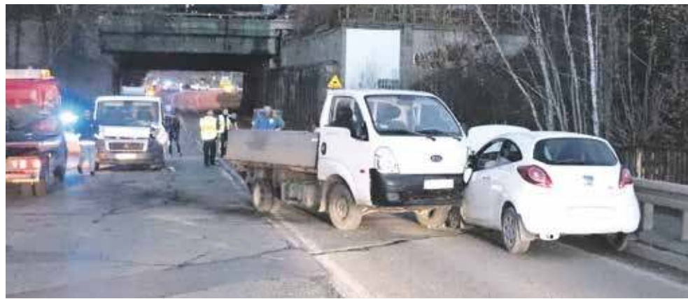
Do wypadku doszło w pobliżu granicy Bytomia i Piekar Śląskich

Na miejscu bardzo szybko przybyły wezwane specjalistyczne służby. Uczestniczący w wypadku mężczyzna prowadzący osobówkę został prze-