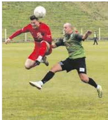
Szombierki zakończyły rundę jesienną wygraną

Zieloni zakończyli rundę jesienną na ósmej pozycji, Cidry są oczko