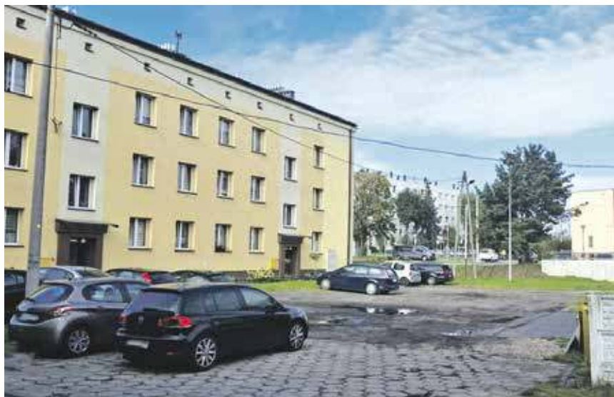
Tak to wygląda obecnie...

KATOWICE, RADZIONKÓW. WOJEWÓDZKI FUNDUSZ OCHRONY ŚRODOWISKA I GOSPODARKI WODNEJ W KATOWICACH ROZSTRZYGNĄŁ TRZECIĄ EDYCJĘ KONKURSU „ZIELONA PRZESTRZEŃ”. JEDNYM Z JEGO LAUREATÓW ZOSTAŁ RADZIONKÓW, KTÓRY OTRZYMA PONAD 227 TYSIĘCY ZŁOTYCH NA REALIZACJĘ PROJEKTU ZIELONY ZAKĄTEK. POSTANIE ON PRZY ULICY KNOSAŁY 20.