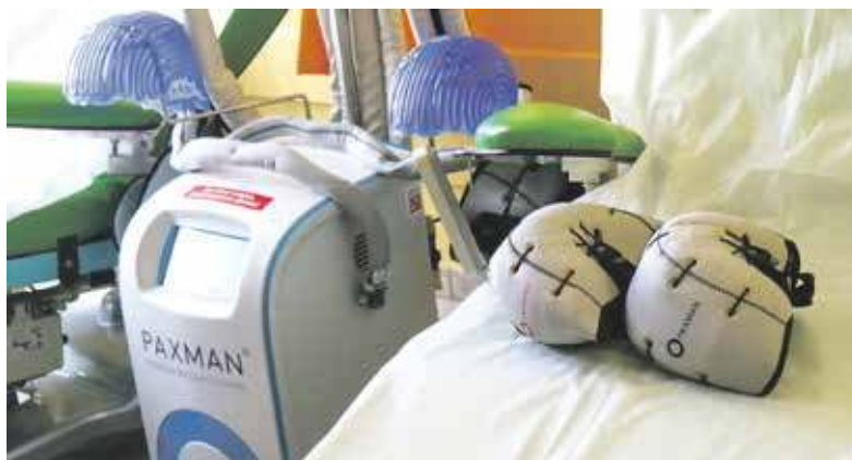
Trudno przecenić znaczenie czepców

Jak wynika z obserwacji, część kobiet (nawet 8 proc.) odmawia leczenia w obawie przed utratą włosów, a to jest nieodłącznym skutkiem niepożądanym stosowania niektórych cytostatyków. Chemioterapeutyki atakują szczególnie szybko namnażające się komórki ludzkiego organizmu, w tym te odpowiedzialne za wzrost włosów. Tymczasem wysoka samoocena i pozytywne nastawienie w trakcie leczenia są bardzo ważne w walce z chorobą.