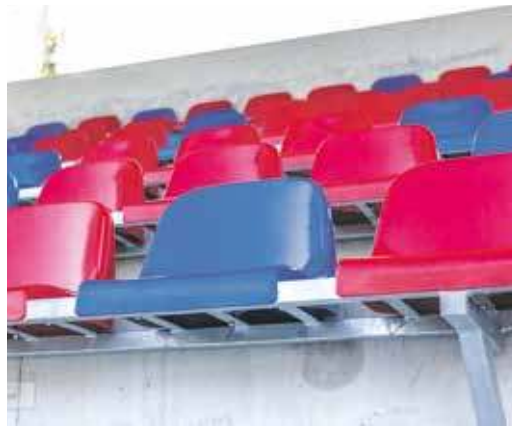
Na nowej trybunie kibice zasiądą w połowie lutego przyszłego roku

Jak podkreślają władze zarządzającego obiektem Bytomskiego Sportu zadaszona trybuna zachodnia w połączeniu z barwnymi krzesełkami nadała obiektowi szczególny charakter i są symbolicznym znakiem zbliżania się do zakończenia kluczowego etapu budowy. Zgodnie z założeniami nowa trybuna zostanie udostępniona kibicom, kiedy ruszy wiosenna runda rozgrywek na zapleczu