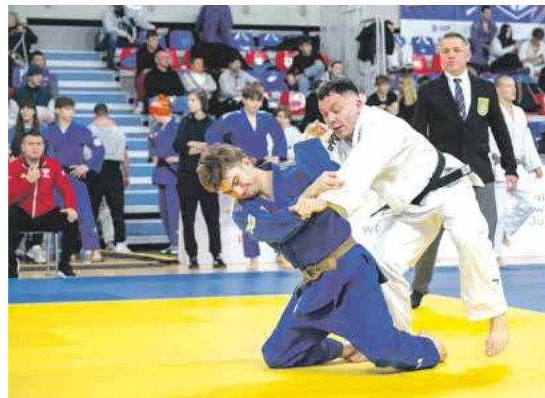
Zawody dostarczyły wielu emocji

Za nami dwa dni wielkich emocji, pięknych walk i co dla nas najważniejsze efektownych zwycięstw bytomskich dżudoków. Czarni Bytom organizowali w miniony weekend dwie bardzo udane i ważne imprezy.