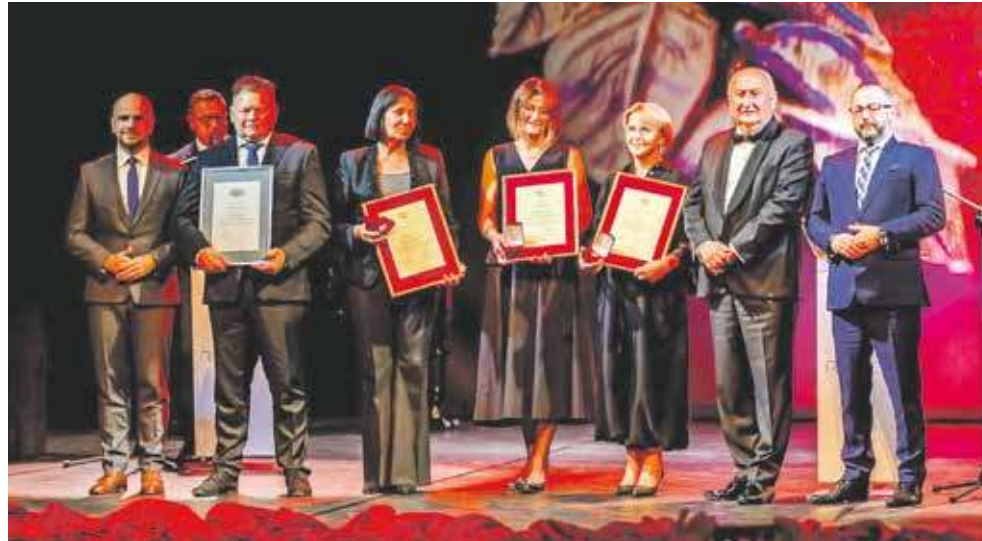
Na scenie zdobywcy laurów

Za współpracę oraz promocję idei samorządu gospodarczego przyznano Laury Umiejętności i Kompetencji. Po raz pierwszy nadany przez