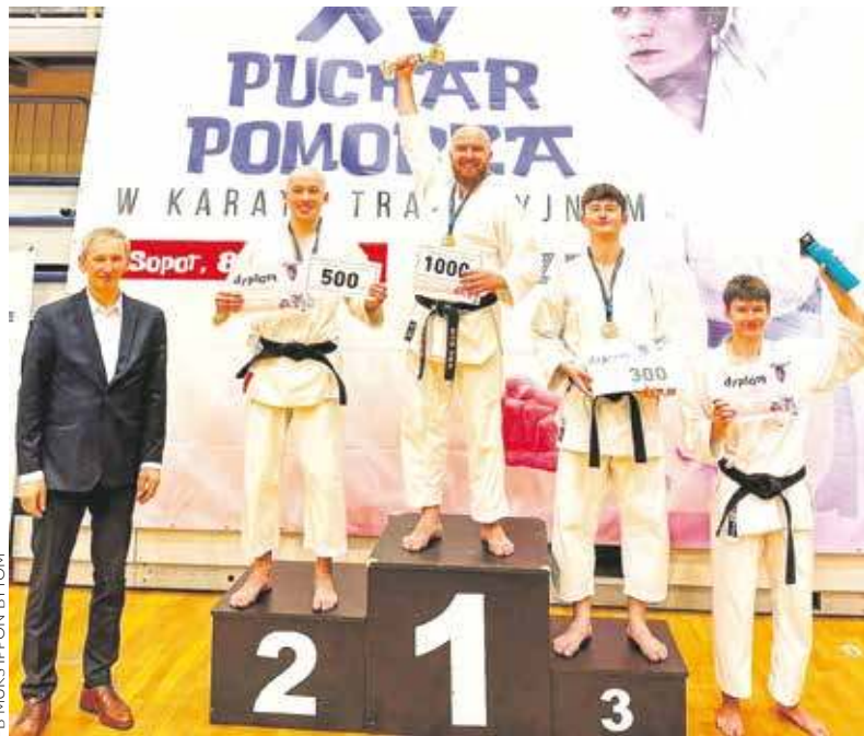
FB MUKS IPPON BYTOM

SOPOT. PO RAZ XV POCHODZĄCY Z CAŁEJ POLSKI ZAWODNICY UPRAWIAJĄCY TRADYCYJNĄ ODMIANĘ KARATE SPOTKALI SIĘ NA PUCHARZE POMORZA. BYLI WŚRÓD NICH I PRZEDSTAWICIELE KLUBU MUKS IPPON BYTOM, KTÓRZY JAK ZWYKLE ODGRYWALI PIERWSZOPLANOWE ROLE.