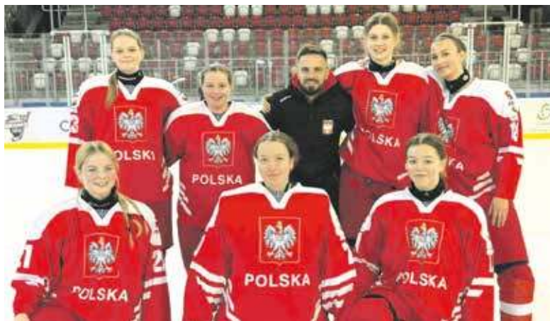
Bytomianki w kadrze U18

W niedzielę, 16 listopada niebiesko-czerwoni mierzyli się w Karvinie z JKH GKS Jastrzębie. Drużyna z Jastrzębia-Zdroju rozgrywa swoje spotkania w Czechach, bo ich lodowisko jest gruntownie przebudowywane.