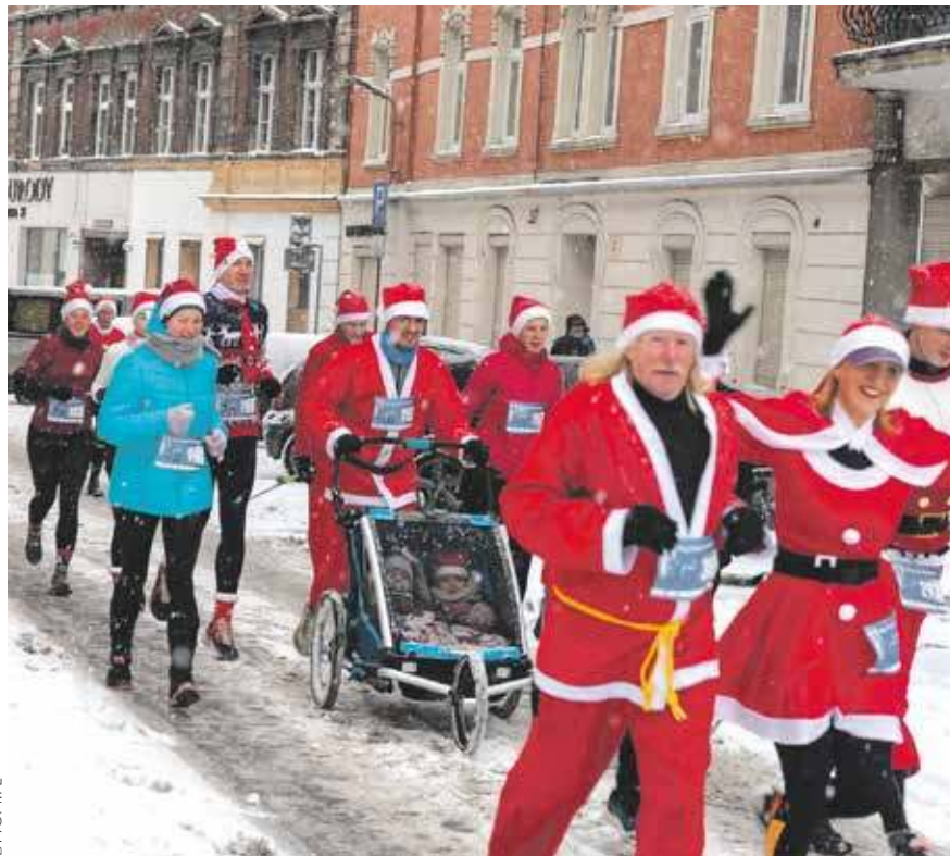
Czy tym razem przed biegiem spadnie śnieg?

W ubiegłorocznym biegu wzięło udział prawie 500 osób nie tylko z Bytomia,