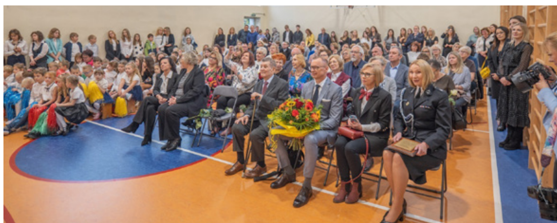
FotUM Brzeg Dolny