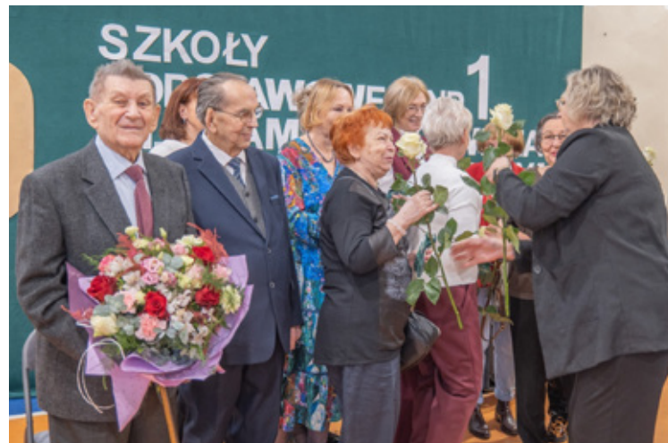
FotUM Brzeg Dolny

„Piękna uroczystość, piękne wydarzenie. 80 lat to naprawdę imponująca liczba, pełna wzruszeń i wspomnień, które zostały tu pięknie zebrane. Gratuluję wszystkim pokoleniom nauczycieli, wychowawców, absolwentów i uczniów za wkład w rozwój wartości przekazywanych przez te 80 lat.” Gratulacje złożyli także wszyscy dyrektorzy szkół z gminy, podkreślając znaczenie