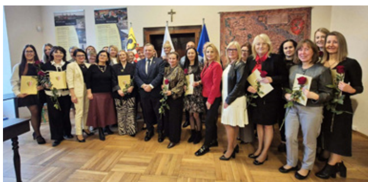
Nauczyciele z nagrodą Starosty Powiatu Wołowskiego.