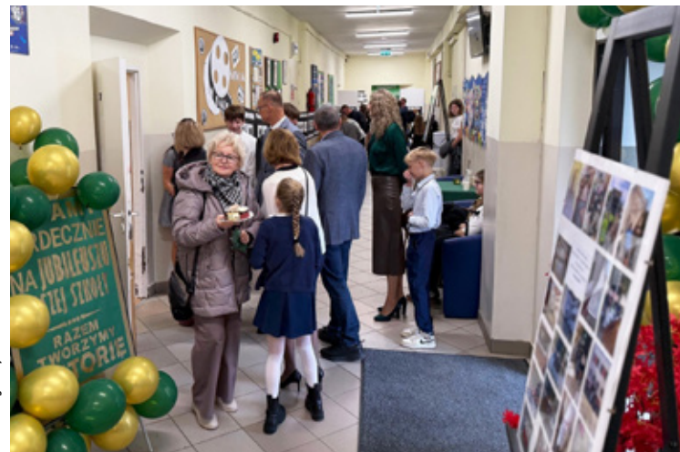
FotUM Brzeg Dolny