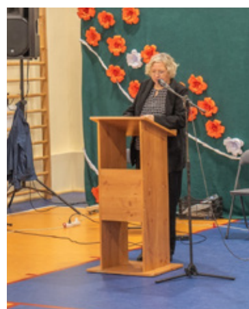
FotUM Brzeg Dolny