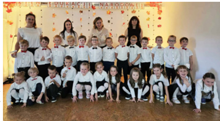
Uczniowie z gminy Wołów wraz z nauczycielkami.