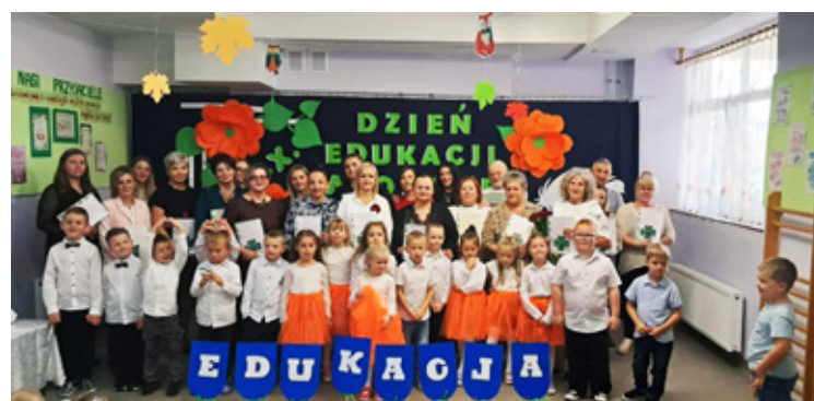
Przedszkole Samorządowe w Wińsku.

nauczycielka w Liceum Ogólnokształcące im. J.M. Ossolińskiego w Brzegu Dolnym.