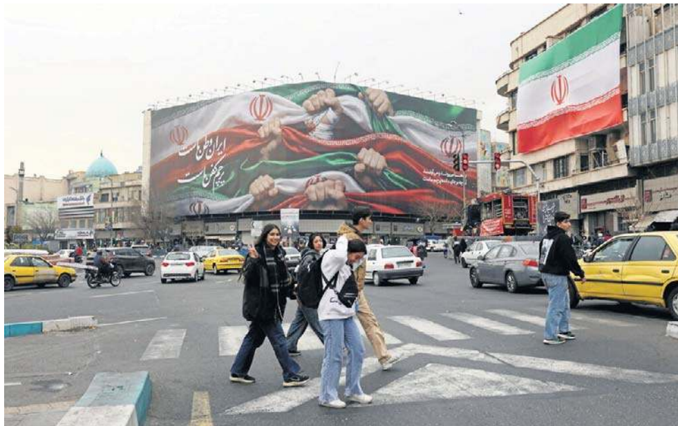
Billboard z napisem „Iran jest naszą ojczyzną” w Teheranie. Iran doświadcza ogólnokrajowej przerwy w dostępie do internetu, która rozpoczęła się 8 stycznia

Irańska organizacja broniąca praw człowieka HRANA, która działa z USA, ale opiera się na informacjach od sieci aktywistów