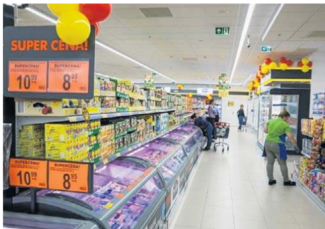
Firma przeznaczy na same podwyżki dla pracowników ponad 200 milionów złotych w skali roku

Pracownicy sieci Biedronka od stycznia 2026 r. otrzymają wyższe pensje. Wynagrodzenia wzrosną o 400 zł brutto, co dla początkującego sprzedawcy-kasjera może dać kwotę 5 800 złotych brutto. Zwiększeniu - do 500 złotych brutto - ulega też comiesięczna potencjalna premia. Na przykład sprzedawca-kasjer, rozpoczynający pracę w sieci, zarobi od stycznia od 5300 zł do 5650 zł brutto. Doliczając pozostałe składniki wynagrodzenia może otrzymać nawet 5800-6150 złotych brutto. Z kolei pracownicy, którzy mają staż powyżej 3 lat zainkasują od 5450 zł do 5900 zł brutto pod-