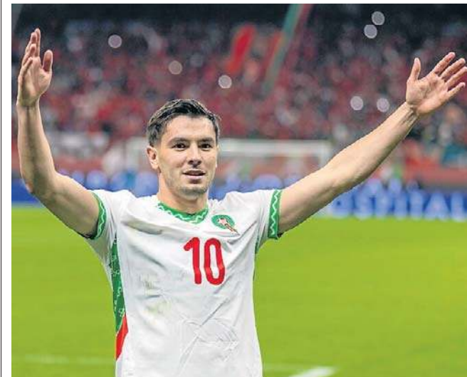
FOT. PAPIEPA/JALAL MORCHIDI

Początek spotkania Senegal - Egipt dziś o 18.00. Oba mecze można obejrzeć w płatnym serwisie Megogo. ©©