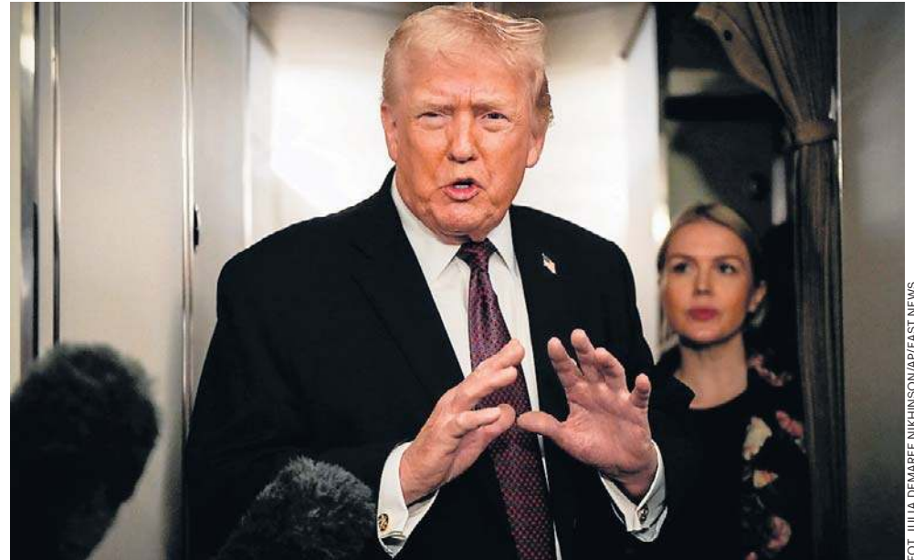
Donald Trump na pokładzie samolotu Air Force One powiedział mediom, że zastanawia się nad możliwością ataku na Iran. Dodał, że jest gotów na spotkanie z władzami Iranu

– Niektórzy protestujący zginęli stratowani w panice, było ich tak wielu (...) a niektórzy zostali zastrzeleni. Dostają raporty co godzinę i podejmiemy decyzję – oznajmił. Zaznaczył też, że ma „bardzo mocne opcje na stole”. Prezydent ujawnił też, że „przywódcy Iranu” zadzwonili do niego w sobotę i „chcą negocjować”. Dodał, że może się z nimi spotkać, ale ocenił również, że być może będzie