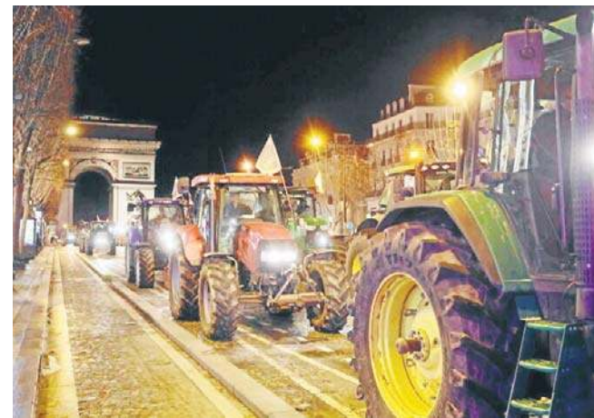
Pierwszy konwój protestujących rolników wjechał do Paryża po godzinie 6 rano