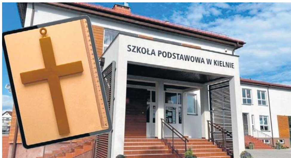
Wejście do Szkoły Podstawowej w Kielnie, do której miało dojść do obrazy uczuć religijnych. W mniejszej ramce plastikowy krzyżyk, który nauczycielka miała wyrzucić

Takie same można kupić już za 7,99. To tworzywo sztuczne, taka plastikowa zabawka. Dużo o tym myślałam i nie sądzę, a wręcz wydaje mi się to niemożliwe, by ktośkolwiek z moich uczniów poczuł się urażony