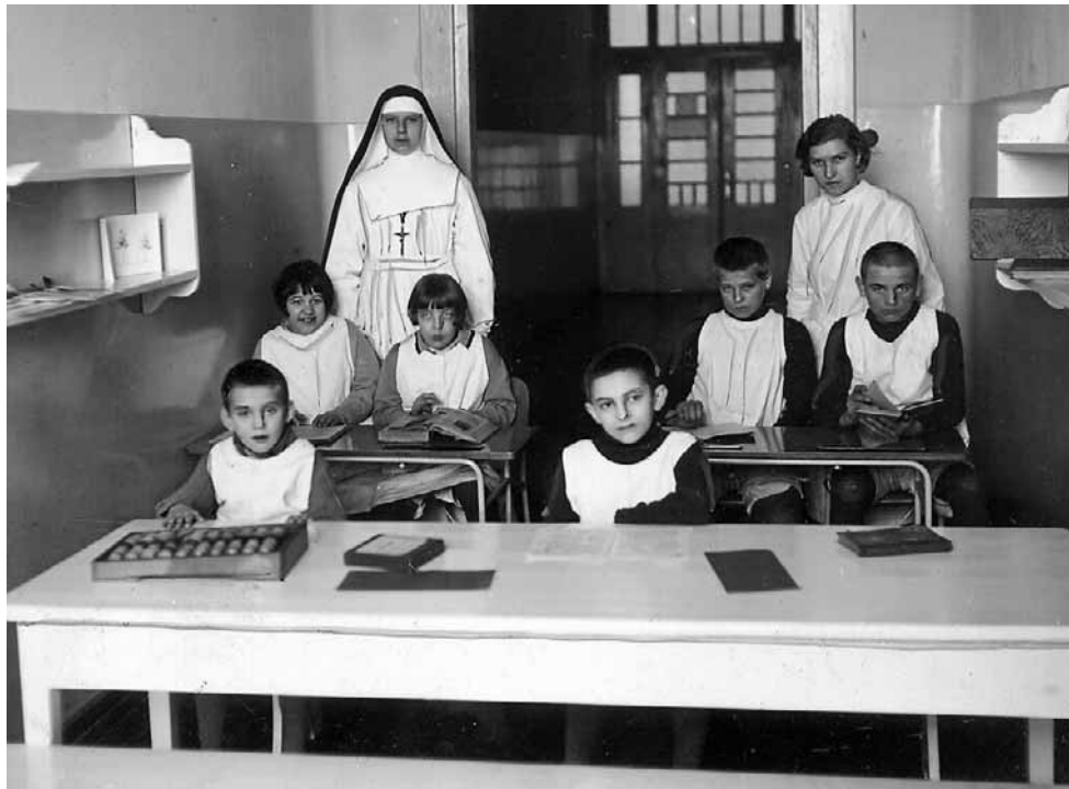
Pacjenci i personel szpitala w Chełmie, rok 1936

Po dojściu do władzy Adolfa Hitlera w Niemczech, w ramach realizacji głoszonej przez nazistów polityki „czystości rasowej”, rozpoczęto proces przymusowej sterylizacji osób fizycznie lub też umysłowo upośledzonych. Akcja ta była realizacją przyjętej w dniu 14 lipca 1933 r. ustawy „o zapobieganiu narodzin potomstwa obciążonego chorobą dziedziczną”. Z kolei w 1938 r. w przestrzeni publicznej w III Rzeszy pojawiły się plakaty przygotowane przez ministra propagandy i oświecenia publicznego Josepha Goebbelsa, których zadaniem było uświadomienie społeczeństwu niemieckiego, iż koszt utrzymania osoby chorej psychicznie wynosi 60 tys. marek, czyli około 40-krotności średniego rocznego wynagrodzenia. Natomiast tuż