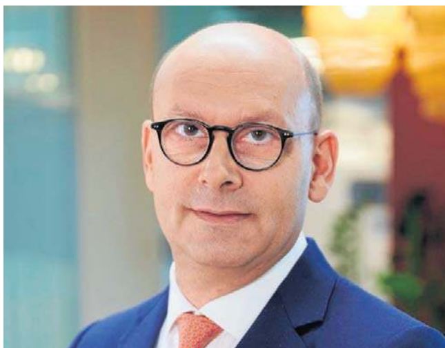
– W Warszawie popyt na biura jest stabilny, choć jego struktura zmieniła się znacząco – przekonuje Erik Drukker, CEO BNP Paribas Real Estate Poland

W Warszawie popyt na biura jest stabilny, choć jego struktura zmieniła się znacząco w porównaniu do okresu sprzed pandemii. W trzecim kwartale 2025 roku wolumen transakcji sięgnął około 185 tys. mkw., a rynek w dużej mierze opiera się na renowacjach (ok. 40%), choć spory udział mają też nowe umowy. Nowa podaż jest bardzo ograniczona, co wzmacnia pozycję najlepszych lokalizacji i budynków - aktywa prime bronią swoich stawek, słabsze muszą konkurować zachętami i CAPEX-em. W regionach sytuacja jest bardziej zróżnicowana - średnia pustostanów w ośmiu głównych miastach regionalnych wynosi 17,7%, a nowa podaż w pierwszych trzech kwartałach roku była rekordowo niska - zaledwie ok. 18 tys. mkw. To sprawia, że rynek jest bardziej konkurencyjny dla właścicieli, ale zaczyna brakować dużych, nowoczesnych modułów w lokalizacjach preferowanych przez firmy. W magazynach popyt utrzymuje się na wysokim poziomie (I-III kwartał: 4,54 mln mkw.), ale aktywność zdominowana jest przez renowacje. Wskaźnik pustostanów na poziomie 8,2% świadczy o zdrowej równowadze rynkowej, bez presji na przegrzanie. W handlu podaż rośnie w przewidywalnych formatach - dominują parki handlowe i convenience. Całkowita podaż nowoczesnej powierzchni handlowej przekro-