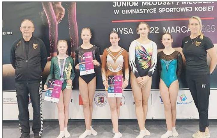
Zabrzeńska ekipa podczas Pucharu Polski w Nysie.