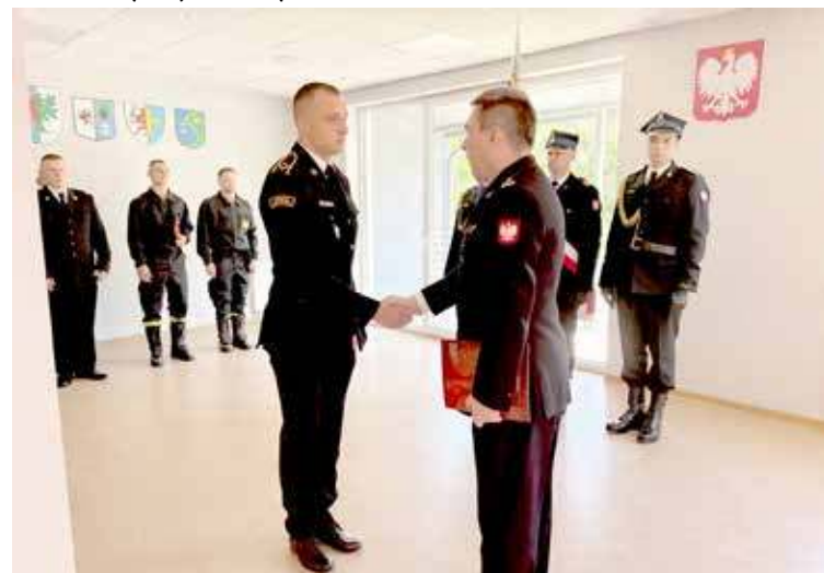
Wręczane były awanse