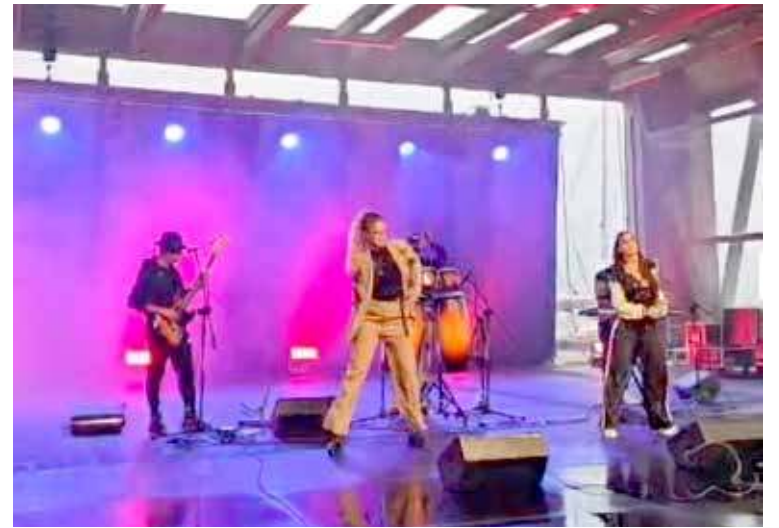
Pierwsze koncerty już odbyły się w amfiteatrze