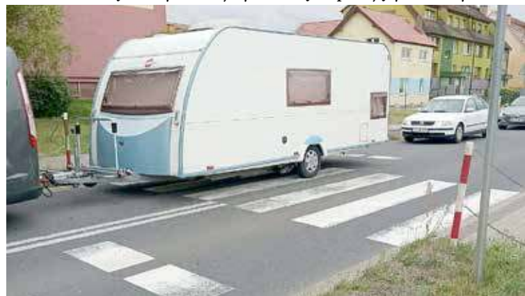
Blokowanie przejść dla pieszych to norma.