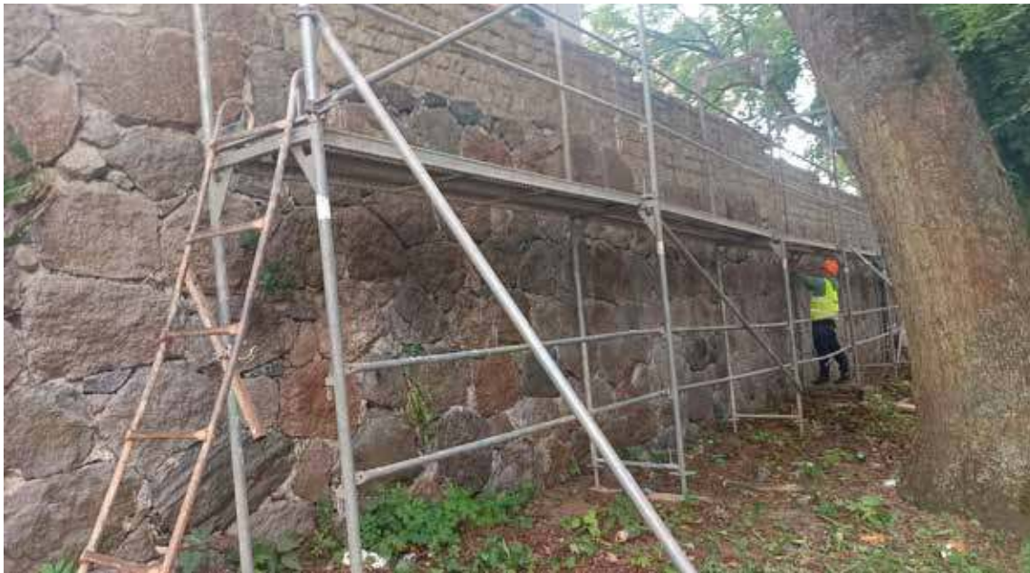
Remont murów obronnych trwa

częcie prac remontowych. Jak tłumaczy magistrat – rozpoczęcie ich nie było łatwe. Z racji zabytkowości murów obronnych konieczne było wypełnienie wielu formalności. Między innymi różnego rodzaju zezwoleń od konserwatora zabytków. Re-