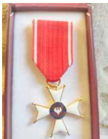
Krzyż Kawalerski Orderu Odrodzenia Polski