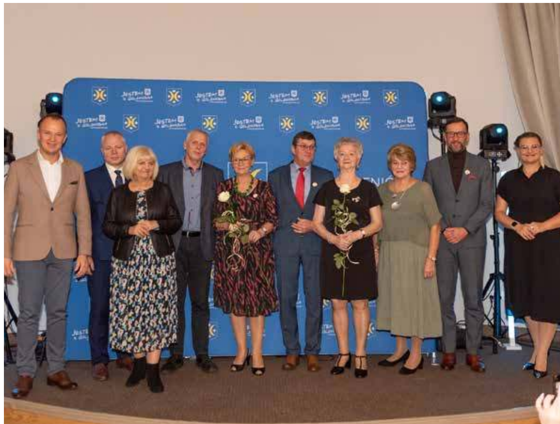
Nagrodzeni i wyróżnieni w roku 2024