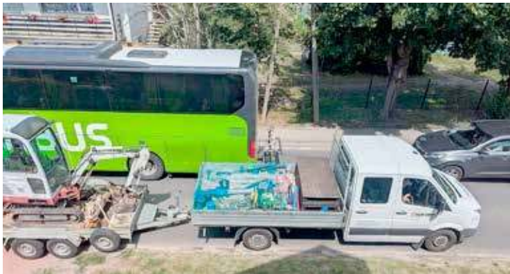
Taki widok w Kliniskach jest częsty.

Sam protest przyniósł jedynie tymczasowo efekty. Nastąpił wzrost obecności służb oraz kontroli w trudnych odcinkach. I to przyniosło efekt – ruch ciężarowy zmniejszył