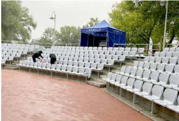
Przy obiekcie powstała nowa widownia

Na tym jednak prace się nie kończyły. W samym amfiteatrze została wymieniona podłoga oraz osłony poliwęglanowe. Zainstalowany został również nowy system oświetleniowo-nagłośnieniowy. Wybudowano także będzie nowy budynek. Służyć on