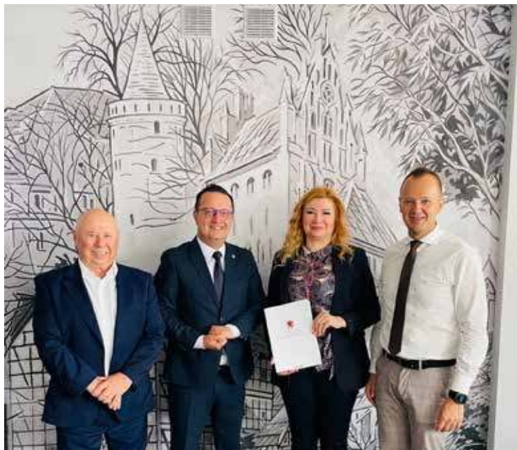
Umowa na dofinansowanie została podpisana