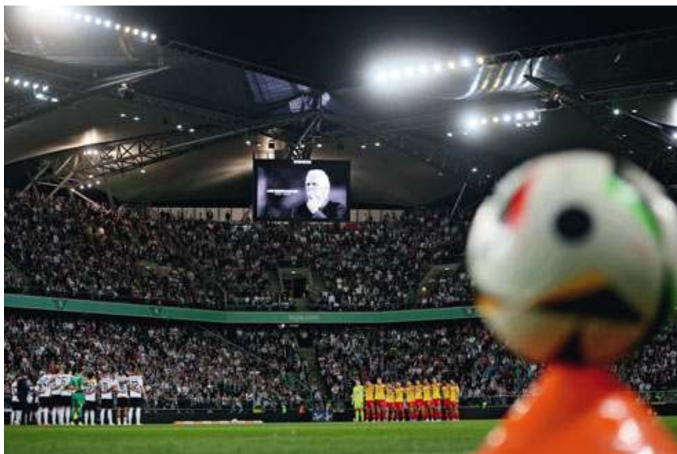
Zawodnicy Legii Warszawa i Jagiellonii Białystok podczas uroczystej minuty ciszy poświęconej pamięci zmarłego byłego selekcjonera reprezentacji Polski Leo Beenhakker

Wyjątkowe sceny rozegrały się także po olimpijskim finale rugby w Rio de Janeiro. W meczu o złoto reprezentacja Fidżi ograła Wielką Brytanię 43:7 i zdobyła pierwszy medal igrzysk w historii tego kraju. A po zwycięskim spotkaniu świat zobaczył kilkunastu twardych, silnych, bardzo dobrze zbudowanych mężczyzn stojących w kółku, śpiewających, wznoszących wzrok ku niebu i zalewających się łzami. Widok niezapomniany, a o sportowcach z małego kraju leżącego na Oceanie Spokojnym mówili wtedy wszyscy. Wyczyn rugbyistów i ich jedność pięknie podsumował wtedy ich trener. – Tych dwunastu ludzi dokonało czegoś wielkiego. Oni mogą zainspirować całe Fidżi. Pokazali, że dzięki ciężkiej pracy oraz umiejętności działania w grupie