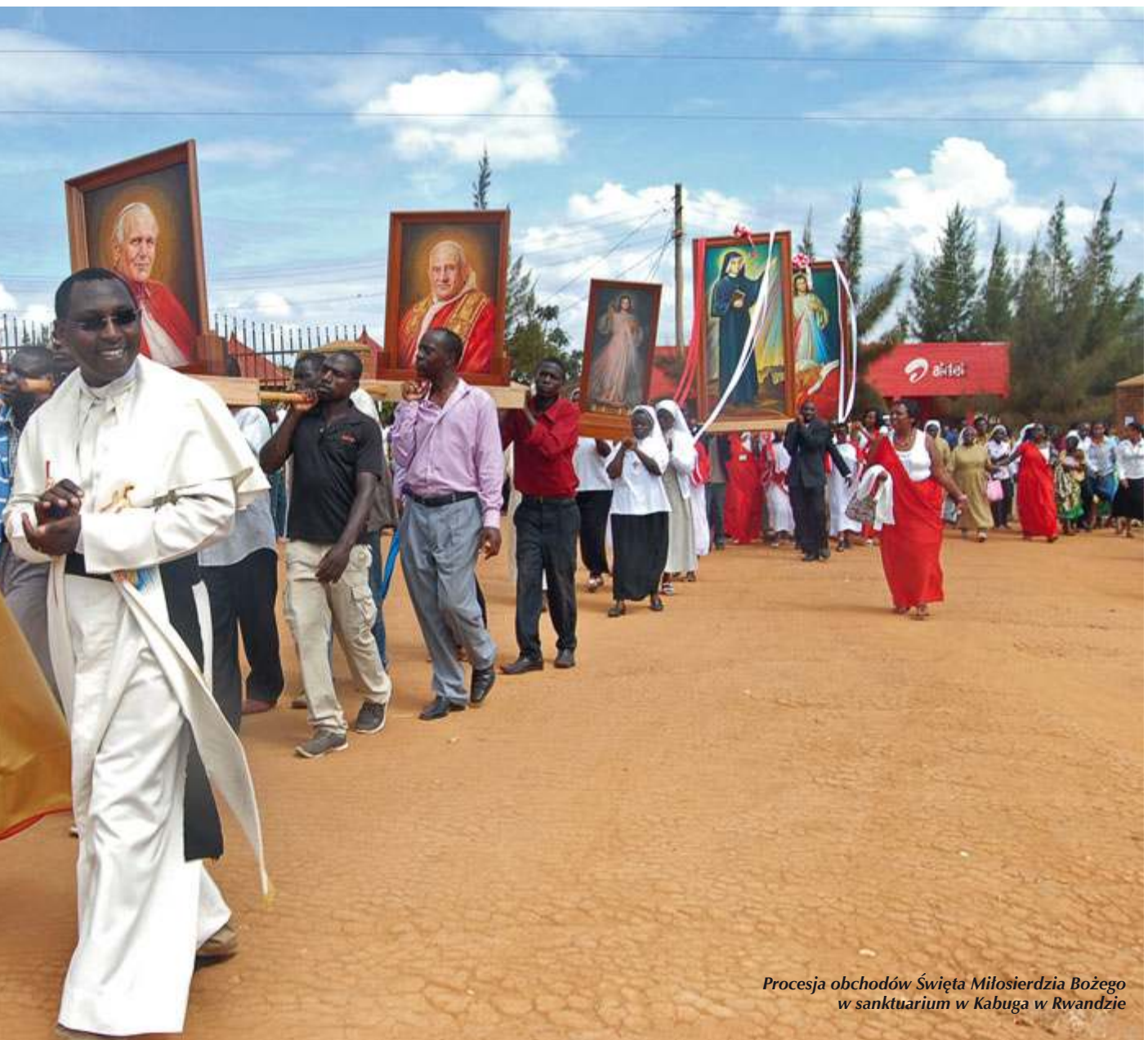
Procesja obchodów Święta Miłosierdzia Bożego w sanktuarium w Kabuga w Rwandzie