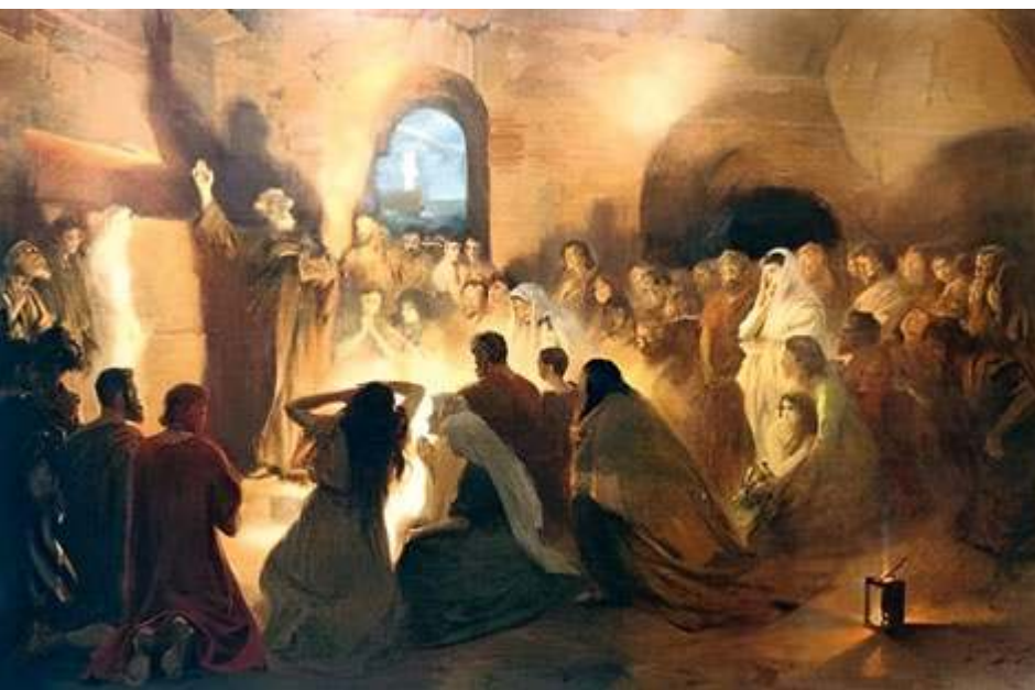
Jan Styka, „Święty Piotr głoszący Ewangelię w katakumbach”

Ten, który po bolesnych doświadczeniach związanych z wystawą jego obrazów w Ameryce (St. Louis, 1904 r.) zażegnywał się, że już nigdy Ameryki nie odwiedzi (padł wówczas ofiarą nieuczciwych agentów), znalazł w niej miejsce wiecznego spoczynku... I to jest kolejny paradoks jego życia.