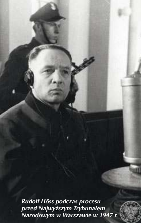
Rudolf Höss podczas procesu przed Najwyższym Trybunałem Narodowym w Warszawie w 1947 r.