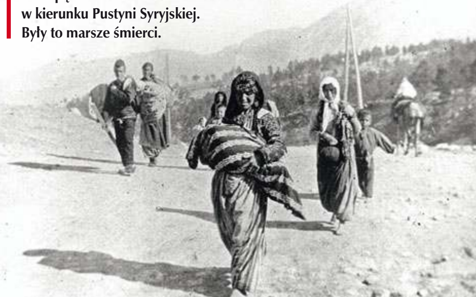
foto. Zdjęcia z Armenii 1917–1919/Kolekcja zdjęć Johna Eldera/Armenian National Institute

Konwoje z dziesiątek tysięcy ludzi pędzono setki kilometrów w kierunku Pustyni Syryjskiej. Były to marsze śmierci.