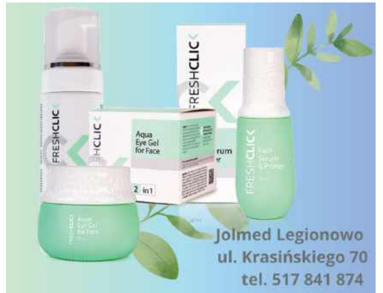
Jolmed Legionowo ul. Krasińskiego 70 tel. 517 841 874

Tarczycy bajkalska, stosowana od wieków w medycynie tybetańskiej, działa tonizująco, reguluje wydzielanie sebum i wspiera produkcję kolagenu. Odmładza,