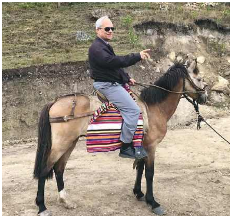
Robert kard. Prevost widywany był też w mniej oficjalnym stroju, szczególnie na misyjnychścieżkach