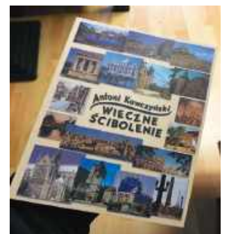
Książka opublikowana przez Wydawnictwo TiO. Do nabycia w księgarni „U Leszka” - Legionowo, Stefana Batorego 10

Mam ją na sobie, gdy piszę te słowa, marynarkę koloru marengo. Portki dawno przepadły, lecz marynarka wciąż w użyciu. Niekiedy kładę się na tapczanie, by uciąć sobie drzemkę. Myśl, że spanie w marynarce naraża ją na pogniczenie, ani trochę mnie nie wzrusza. Cackać się z nią nie warto, bo nic jej zaszkozić nie