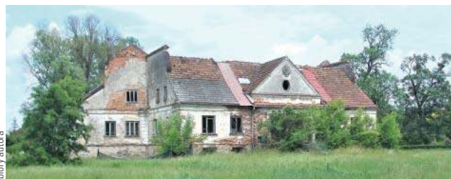
Dwór w Susku Starym, 18 VI 2025 r.