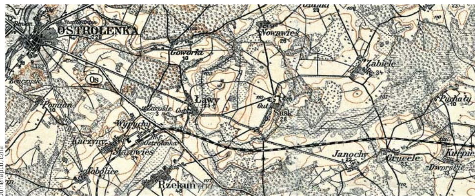
Mapa sytuacyjna okolic: Ostrołęka - Rzekuń - Susk Stary, okres I wojny światowej - 1920 r.