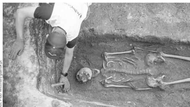
Szkielet rycerza, znaleziony podczas wykopalsk, w miejscu, gdzie przez dziesięciolecia działała kultowa gdańska lodziarnia „Miś”

TO ŻADNA METAFORA — NA POCZĄTKU LIPCA W MOIM UKOCHANYM GDAŃSKU RZECZYWIŚCIE ODKRYTO — NAJPIERW BOGATO ZDOBIONY NAGROBEK, A NASTĘPNIE W JEGO WNETRZU KOMPLETNY SZKIELET ŚRĘDNIOWIECZNEGO RYCERZA. EKSPERCI JUŻ DZIŚ OCENIAJĄ TO ODKRYCIE JAKO ZNACZĄCY WKŁAD W BADANIA NAD DZIEJAMI ŚRĘDNIOWIECZNEJ EUROPY WSCHODNIEJ.