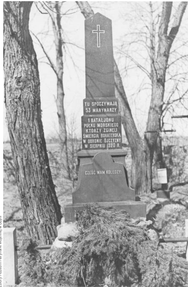
Zbiory Muzeum Marynarki Wojennej w Gdyni