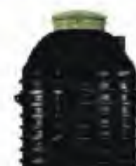
Zbiorniki na deszczówkę