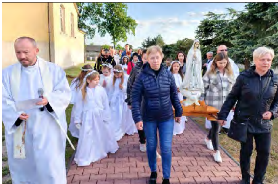
» 13 maja wierni w parafii Piotrowice wyszli na zewnątrz świątyni, aby po raz pierwszy wziąć udział w procesji fatimskiej

Pierwsze objawienie Matki Najświętszej miało miejsce 13 maja 1917 r. Maryja powiedziała dzieciom: „Nie bójcie się, nic złego wam nie zrobię. Jestem z Nieba. Chcę was prosić, abyście tu przychodzili co miesiąc o tej samej porze. W październiku powiem wam, kim jestem i czego od was pragnę. Odmawiajcie codziennie Różaniec, aby wyprosić pokój dla świata”. Podczas drugiego objawie-