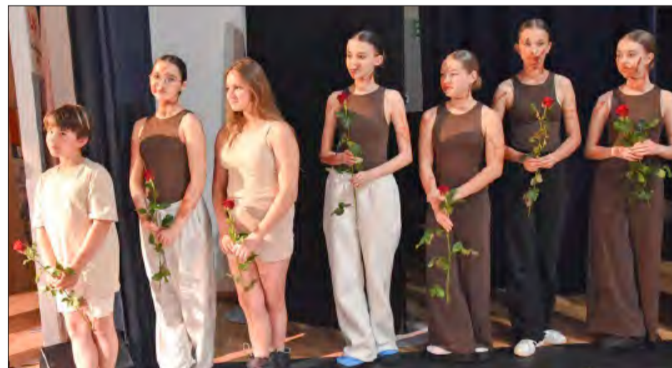
„Mała Rewia Taneczna” od ponad 20 lat rozwija talenty dzieci i młodzieży z powiatu ryckiego