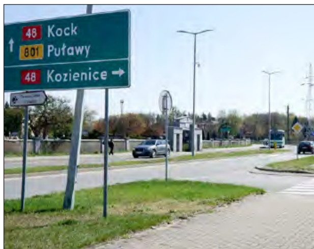
Na skrzyżowaniu ul. 15 Pułku Piechoty Wilków oraz ul. Stężyckiej w Dęblinie powstanie rondo