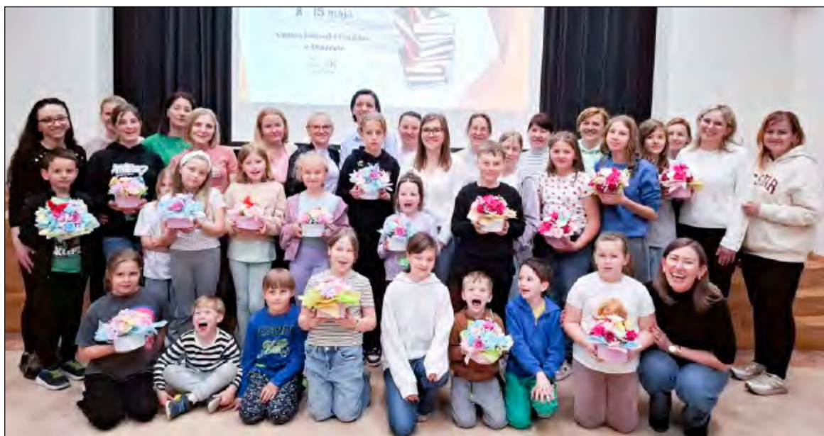
Warsztaty miały również charakter edukacyjny i promowały kreatywne spędzanie czasu wolnego w gronie najbliższych

Organizatorzy podkreślają, że wydarzenie spotkało się z dużym zainteresowaniem mieszkańców, co potwierdza rosnącą popularność tego typu inicjatyw. Warsztaty miały również charakter edukacyjny i promowały kreatywne spędzanie czasu wolnego w gronie najbliższych.