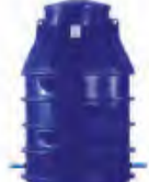
Studnie wodomierzowe z atestem