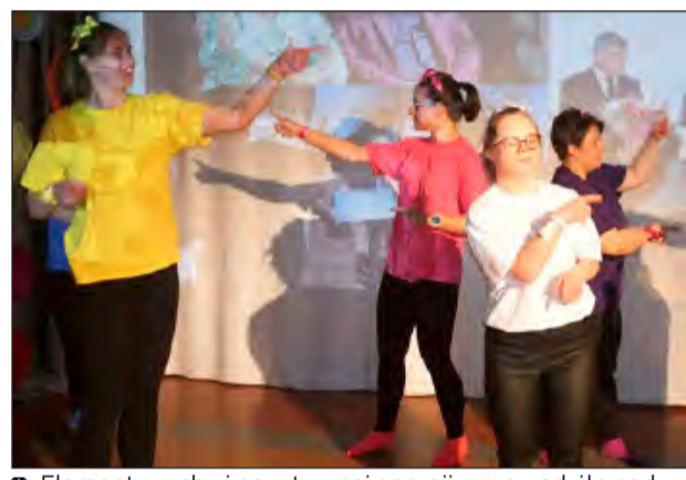
➤ Elementy ruchu i pozytywnej energii wprowadziła podczas uroczystości grupa taneczna WTZ