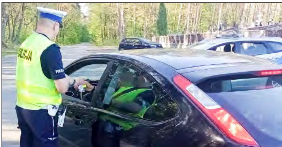
☛ Kierowcy ignorujący przepisy i zasady trzeźwości muszą liczyć się z poważnymi konsekwencjami - zarówno prawnymi, jak i finansowymi

Skrajną nieodpowiedzialnością wykazał się mieszkaniec Dębłina. Nie dość, że był kompletnie pijany, to przyjechał nieubezpieczonym samochodem bez aktualnego badania technicznego, a sam nie ma prawa jazdy