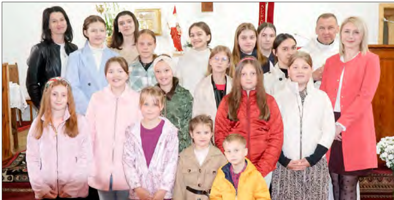
» O niebiańskich rytmie podczas Mszy świętej zadbała schola działająca przy parafii

» „Oto jest dzień, który dał nam Pan, weselmy się i radujmy się w nim”. Słowa piosenki pielgrzymkowej uczestników niedzielnej Eucharystii w parafii Przemienienia Pańskiego w Grabowie Szlacheckim