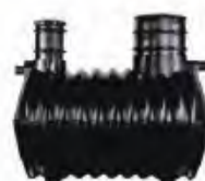
Oczyszczalnie drenazowe CE

ZBIORNIKÓW PE I OCZYSZCZALNI ŚCIEKÓW, PRZEPOMPOWNI, ZBIORNIKÓW NA DESZCZÓWKĘ, STUDNI WODOMIERZOWYCH