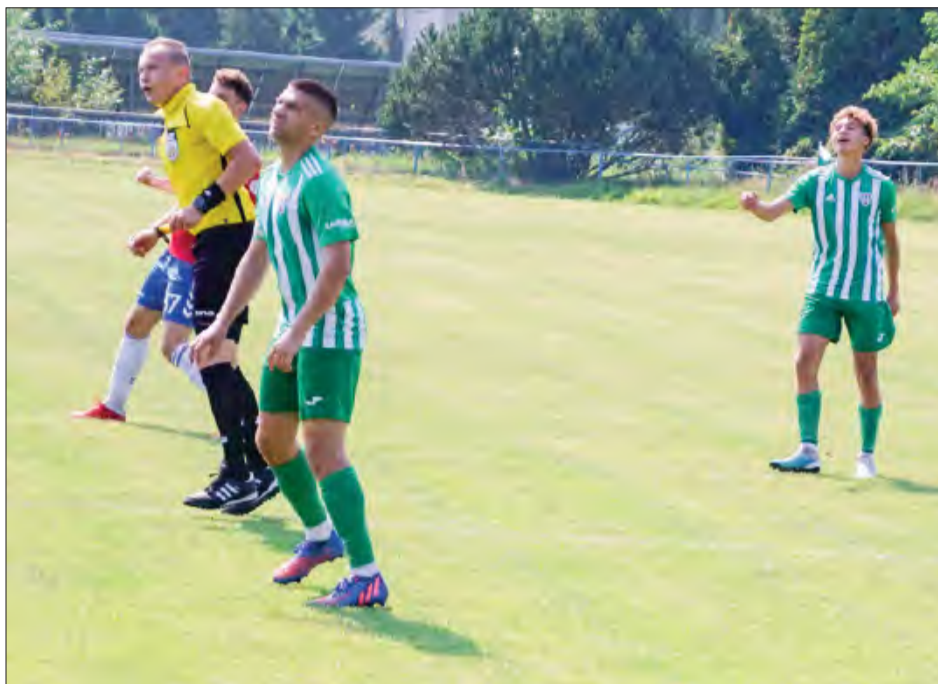
Ruch Ryki tylko zremisował z Wisłą II Puławy i w tabeli „okręgówki” został dogoniony przez Tur Milejów