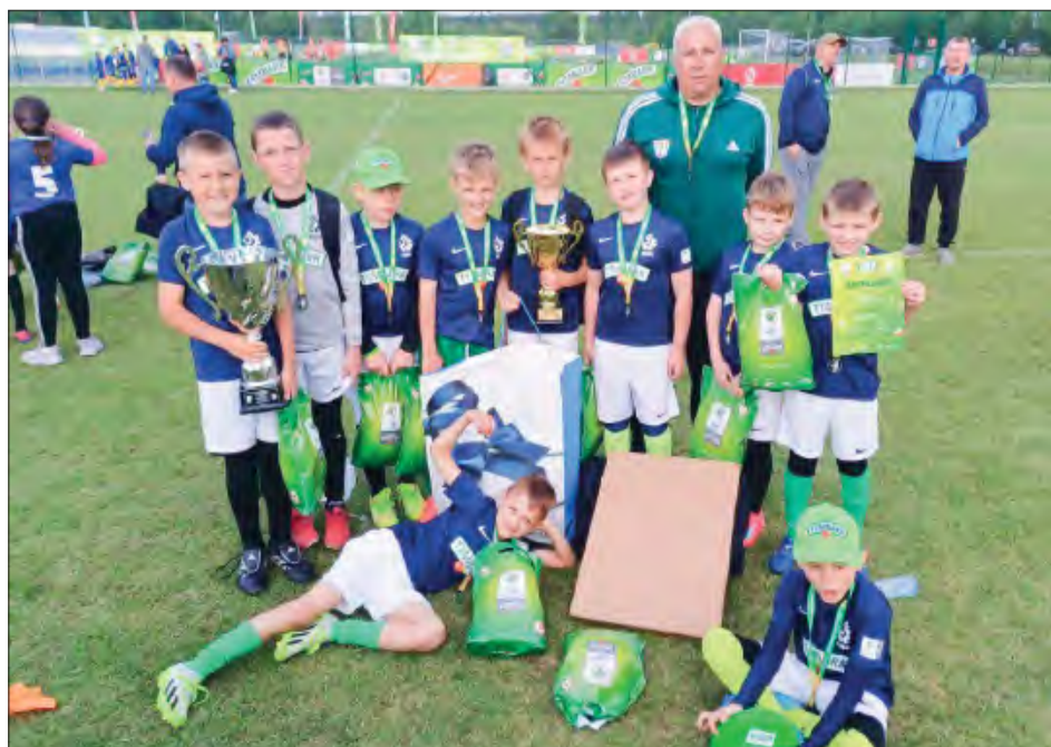
Chłopcy z Dwójki Ryki byli najlepsi w rywalizacji 10-latków