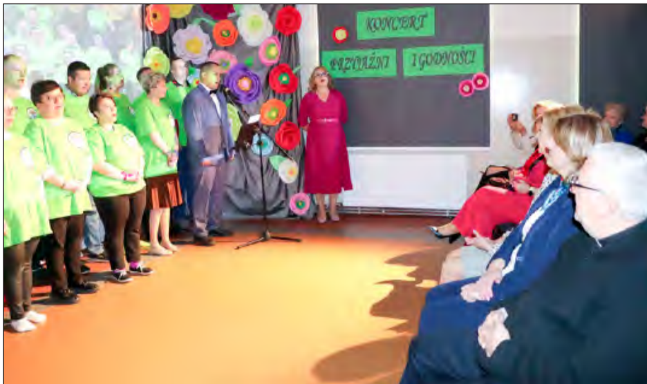
➤ Główną część spotkania stanowiły występy artystyczne podopiecznych WTZ, za które byli nagradzani brawami przez publiczność

Uczestnicy Warsztatów Terapii Zajęciowej w Rykach 15 maja świętowali Dzień Godności, udowadniając talentem wokalnym, aktorskim i plastycznym, że są tak samo wartościowi jak osoby pełnosprawne