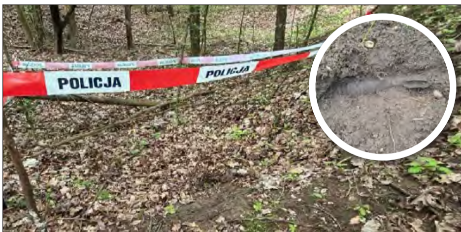
☛ Policjanci zabezpieczyli teren i wezwali saperów. Po przybyciu na miejsce specjaliści potwierdzili, że znalezisko to pocisk artyleryjski z czasów II wojny światowej

Na takie niebezpieczeństwo natknął się pewien mieszkaniec powiatu ryckiego, któ-