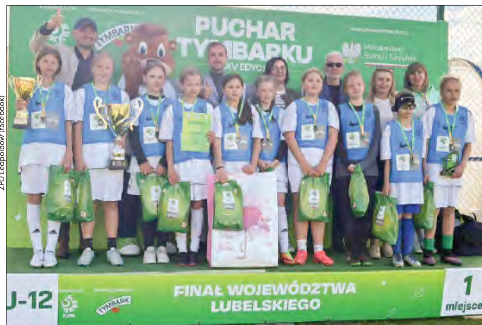
Supermenki - zespół złożony z uczennic szkół w Leopoldowie, Grabowie Szlacheckim i Swatach wygrał wojewódzki finał XXV Turnieju o Puchar Tymbaraku