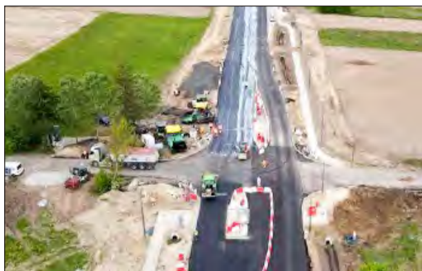
Przy skrzyżowaniu w Sobieszynie budowane są dodatkowe pasy skrętu w lewo, bezpieczne, doświetlone przejścia dla pieszych, chodniki, a sama jezdnia będzie szersza. Za inwestycję odpowiada firma PORR, która kilka lat temu wybudowała obwodnicę Ryk na S17. Roboty mają zakończyć się w wakacje

Na drodze krajowej nr 48 - na odcinkach od mostu na Wiśle do wiaduktu nad linią kolejową oraz od granic Dębina do Moszczanki - wkrótce będzie nie tylko wygodniej, ale przede wszystkim bezpieczniej