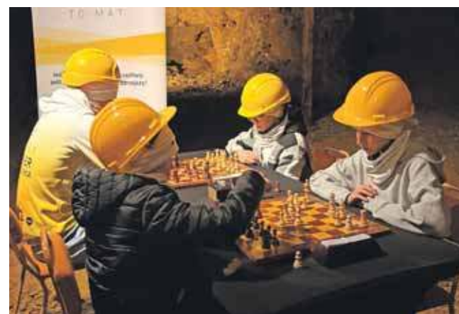
Pod ziemią była rozgrywka na dwóch szachownicach tempem błyskawicznym