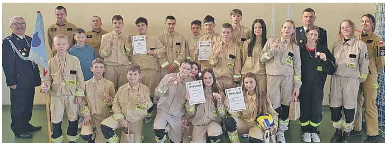
Silna ekipa z OSP Żyglinek