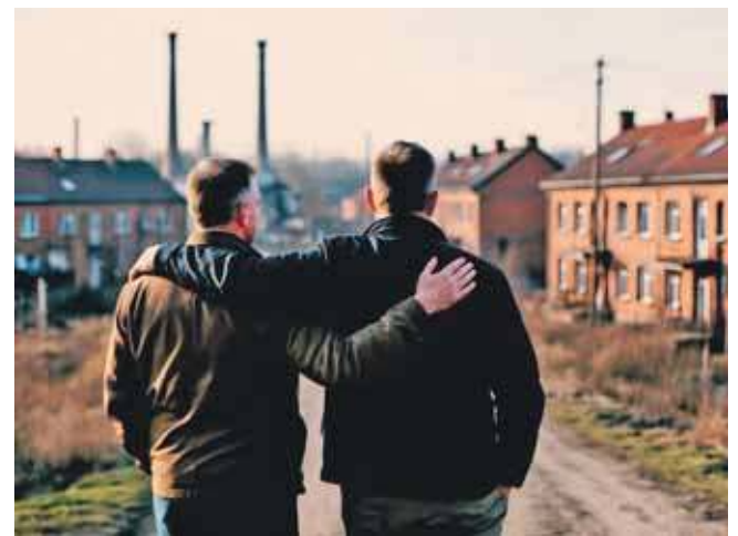
Film został zrealizowany przez Stowarzyszenie Wrazidlok