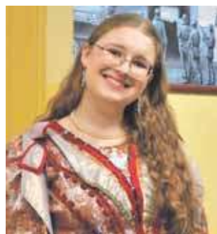
Była i sala historyczna