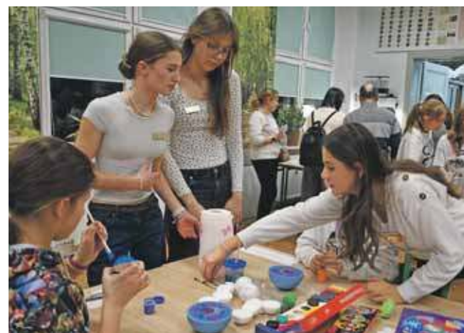
W salach lekcyjnych przygotowano pokazy, doświadczenia, zabawy