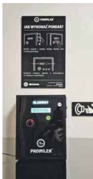
W komisariacie policji w Radzionkowie zamontowano ogólnodostępny, samoobsługowy alkomat