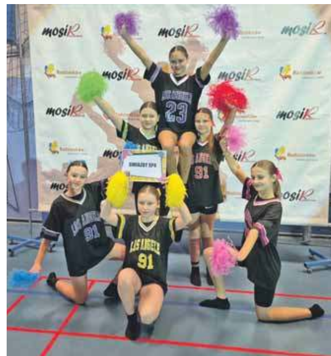
Konkurs wygrał zespół Gwiazdy ze Szkoły Podstawowej nr 4 w Radzionkowie

Poza laureatami w konkursie udział wzięli: Girls Power (NSP Pyrzowice),