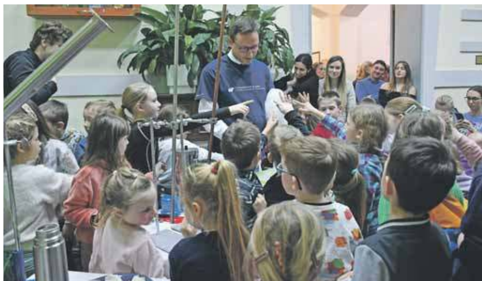
Prowadzący pokazy doświadczeń świetnie nawiązywał kontakt z publicznością

Noc Naukowców rozpoczęła się pokazem doświadczeń „Ciekły azot wokół nas”, przygotowanym przez pracowników wydziału nauk ścisłych i technicznych Uniwersytetu Śląskiego. Nie zabrakło wybuchów, strzelania korkiem i róż w ciekłym azocie. Publiczność, zwłaszcza ta najmłodsza, świetnie się bawiła. Dzieci krzychały: – To magia!