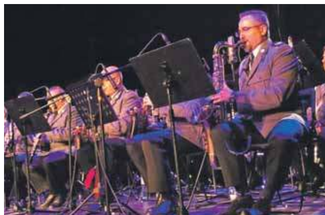
Orkiestra Reprezentacyjna Komendy Wojewódzkiej Policji nie po raz pierwszy wystąpi w Piekarach Śląskich