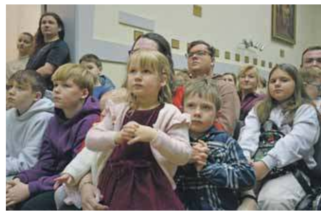
Wydarzenie było dedykowane dzieciom i młodzieży