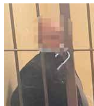
Wpadł dzięki reakcji świadków

– Tu ponownie kluczową rolę odegrał świadek. Była nim kobieta, którą zaczęła na jednym z parkingów. Wtedy wyczuła od niego alkohol, gdy podszedł do niej i popro-