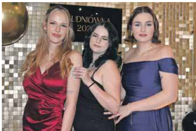
Na studniówce spotkaliśmy też nasze byłe praktykantki

Trwa czas studniówkowych bali. W piątek zajrzeliśmy do restauracji Rubinowa w Koszęcinie, gdzie bawili się maturzyści z Wieloprofilowego Zespołu Szkół w Tarnowskich Górach.