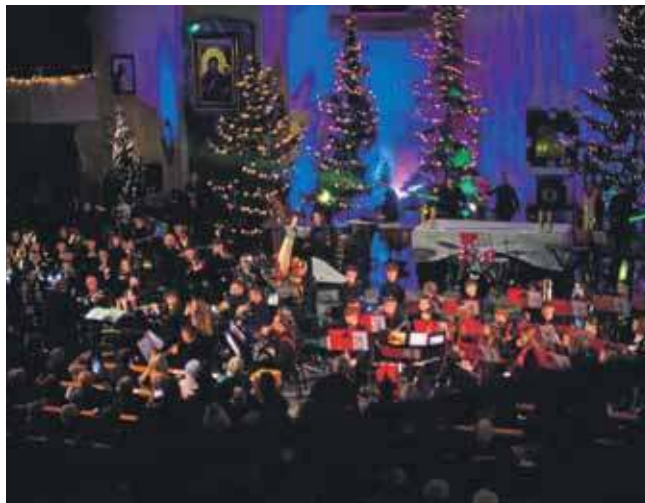
Koncerty Świąteczno-Noworoczne orkiestry kamiliańskiej zdobyły już sobie wierną publiczność