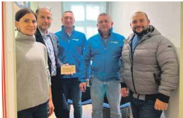
Przekazana przez fundację darowizna to 22 125 zł

– Centrum wspiera małych pacjentów z terenu powiatu, tak by zapewnić im stabilne funkcjonowanie w szkole i ich własnym środowisku. Dwa nowe gabinety znacząco ułatwią pracę