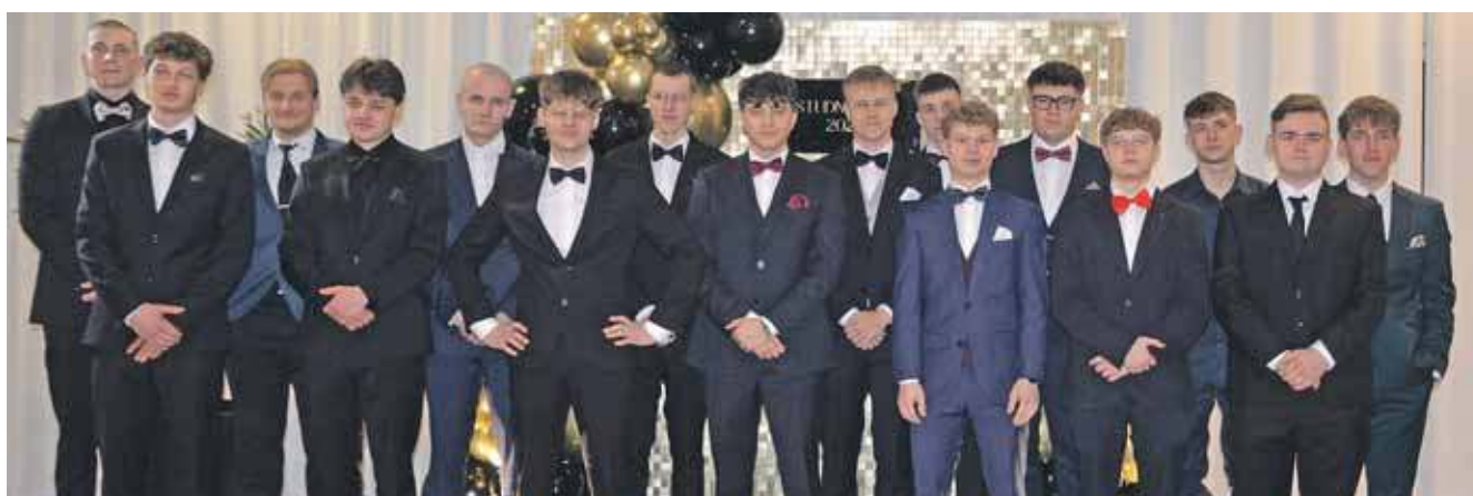
Męska ekipa w Rubinowej