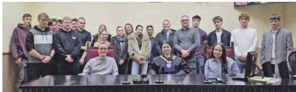
Sąd w Tarnowskich Górach odwiedzili m.in. uczniowie Ekonomika