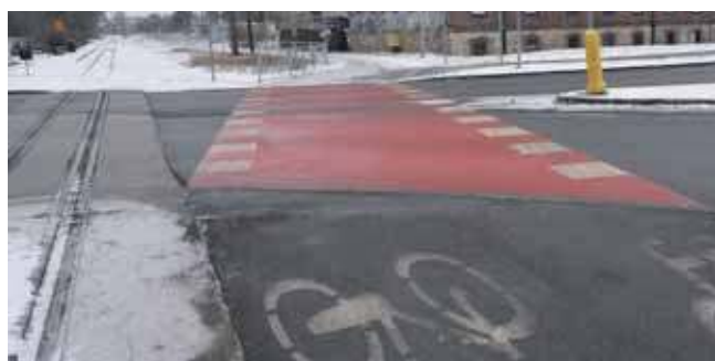
Droga rowerowa biegnąca wzdłuż wąskotorówki będzie miała ciąg dalszy, do granicy z Bytomiem

Dobre wieści dla rowerzystów – projektowana jest droga rowerowa wzdłuż wąskotorówki do Bytomia, w planach jest też rowerowa trasa od Bramy Gwarków do zalewu Nakło-Chechło.