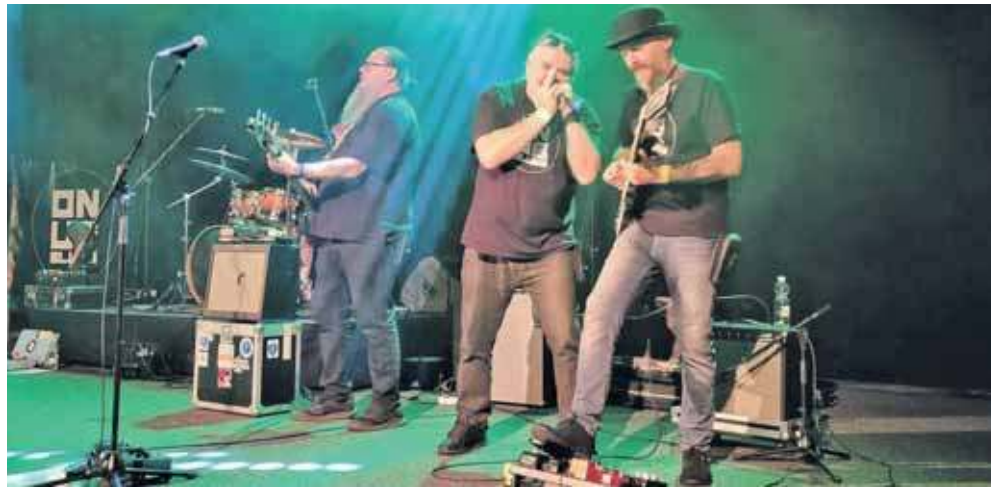
Gościem wieczoru będzie Onus Blues