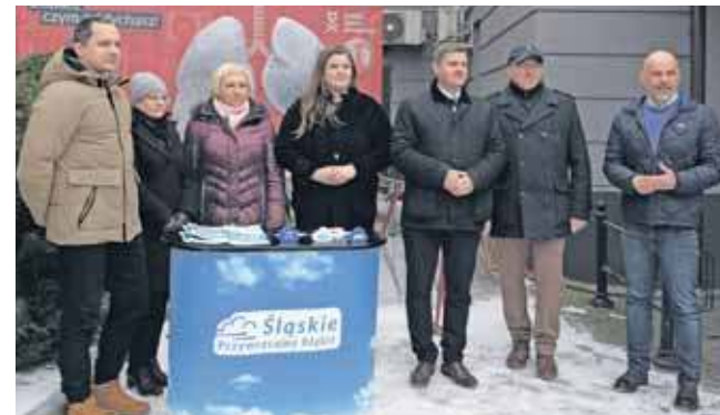
Płuca będą stały w Miasteczku Śląskim do 28 stycznia