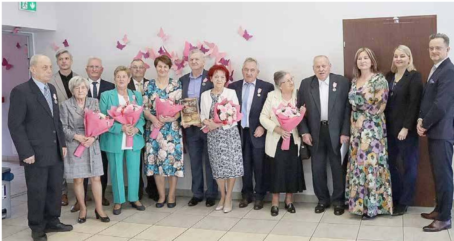
Wspólne zdjęcie udekorowanych par