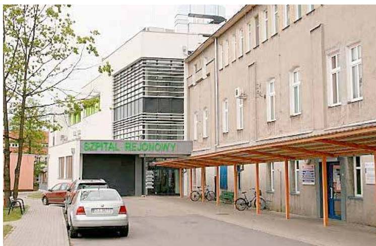
Fundacja działalność w szpitalu prowadzi do dziś