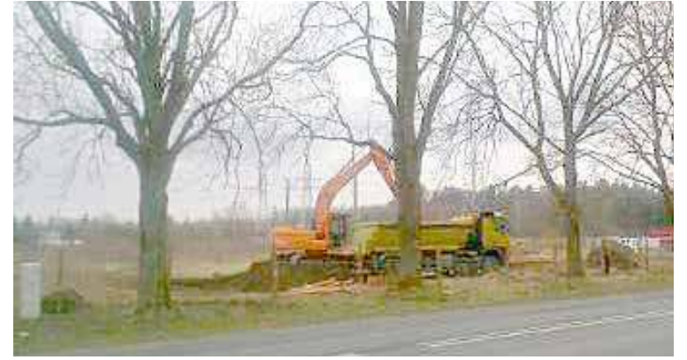
Budowa drugiego Dino ruszyła