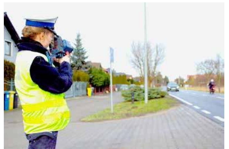
I tym razem mundurowi mieli pełne ręce roboty

Nadmierna prędkość jest jedną z najczęstszych przyczyn wypadków na drodze. Zachowaj zdrowy rozsądek, pomyśl nie tylko o sobie, ale również o innych. Stosuj się do przepisów