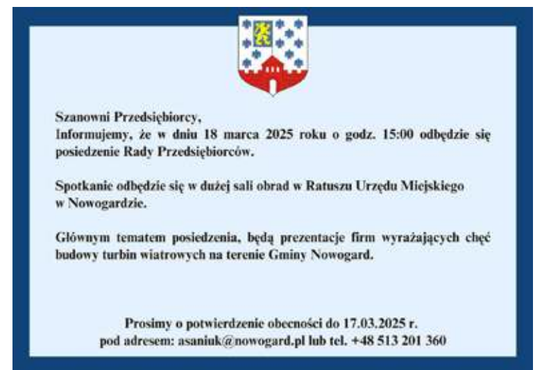
Takie oto zaproszenie pojawiło się w gminnym publikatorze