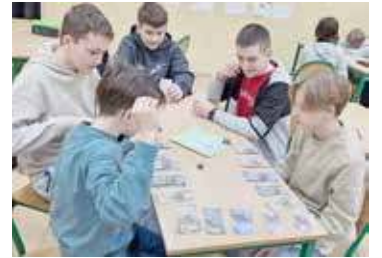
Wśród przygotowanych prac znalazły się m.in. gry planszowe

- Model układu oddechowego człowieka: Uszyty z tkaniny