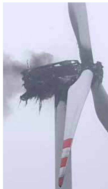
Do zdarzenia doszło w środę, ok. godz. 10

Wiatraki w miejscowości Ługowina to Elektrownia Wiatrowa Resko I należąca do PGE Energia Odnawialna. Działa od 2013 roku, czyli od 12 lat. Moc zainstalowana to ponad