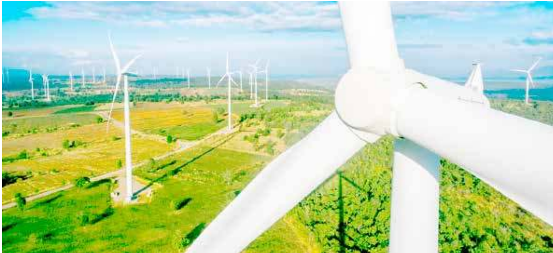
Radni na najbliższej sesji Rady Miasta mogą dać zielone światło na dalsze działania ws. instalacji wiatraków

Podjęcie prac na sporządzeniem planu zagospodarowania przestrzennego dla części gminy to póki co efekt jedynie zakulisowych rozmów w trakcie spotkania firm zainteresowanych z władzami gminy, w trakcie posiedzenia komisji finansowo-gospodarczej czy też bezpośredniego spotkania z radnymi pod koniec stycznia br. Jak nam wiadomo firmy promujące tzw. „zieloną energię” od kilku miesięcy rozmawiają też z właścicielami gruntów na temat pozyskania gruntów pod wiatrakowe