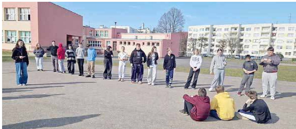
To była lekcja matematyki inna niż wszystkie wcześniejsze