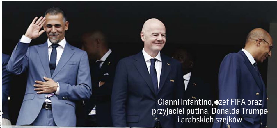
Gianni Infantino, szef FIFA oraz przyjaciel putina, Donalda Trumpa i arabskich szejków

Trump spotkał się z buczaniem igwizdami, gdy wręczał trofeum zwycięzcom Klubowych Mistrzostw Świata,