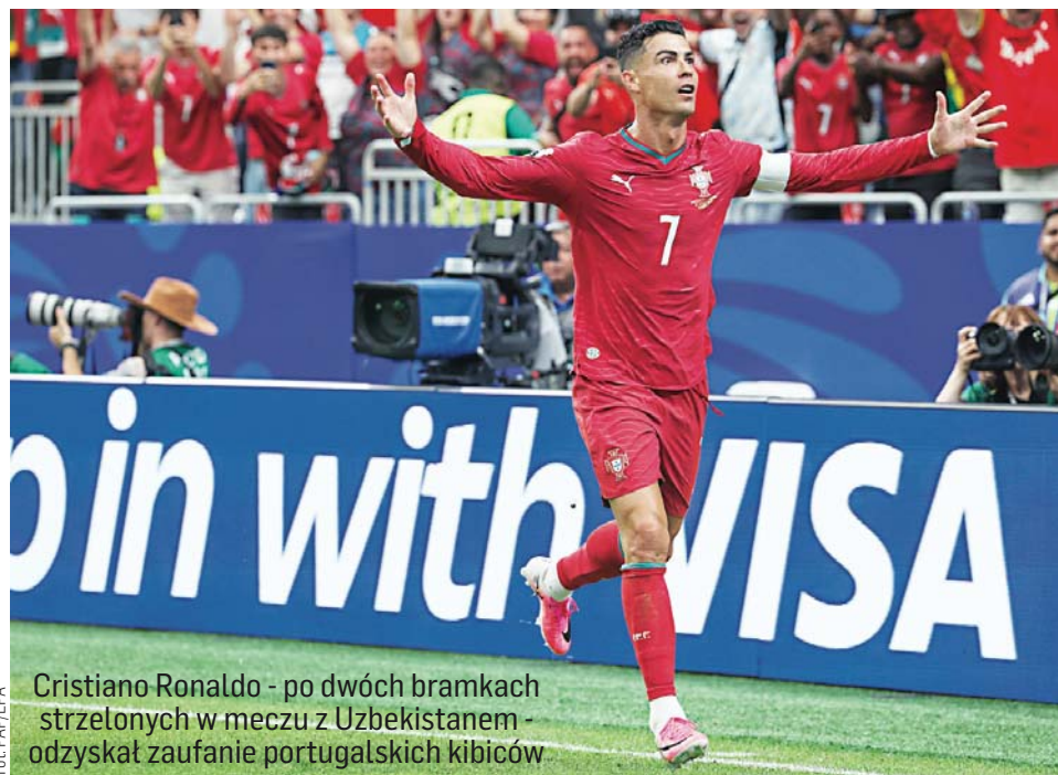
Cristiano Ronaldo - po dwóch bramkach strzelonych w meczu z Uzbekistanem - odzyskał zaufanie portugalskich kibiców

Dwa gole strzelone przez Ronaldo przeciwko Uzbekistanowi pozwoliły mu umocnić się na pozycji lidera w klasyfikacji najlepszych strzelców drużyn narodowych wszech czasów. Portugalczyk ma ich obecnie 145. Za nim plasuje się