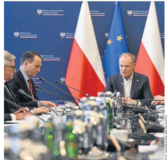
Szef rządu podziękował za współpracę służbom zaangażowanym w organizację ewakuacji

– Wszystko musi wynikać ze zdrowego rozsądku ludzi. Jeśli ktoś nie musi tam lecieć, to niech tam nie leci (...). Warto mieć świadomość, że ten, kto leci dzisiaj, jutro być może będzie czekał na pomoc państwa i będzie chciał się ewakuować. Więc zwracam się do wszyst-