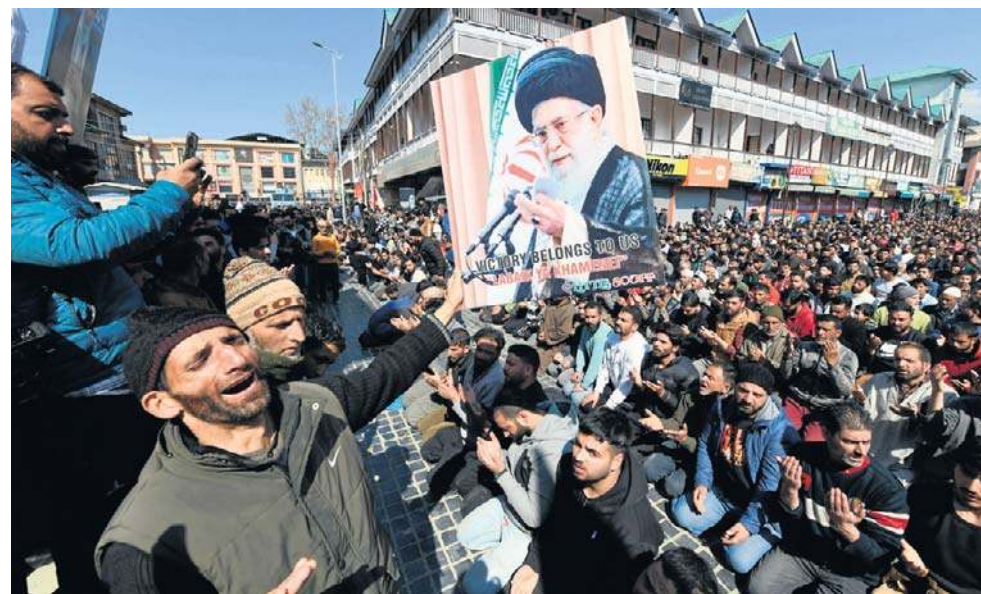
W sobotę w amerykańsko-izraelskim ataku zginął najwyższy przywódca duchowo-polityczny Iranu Ali Chamenei. Jego następcę ma wybrać Zgromadzenie Ekspertów

Ali Chamenei, który od 1989 r. zajmował pozycję najwyż-