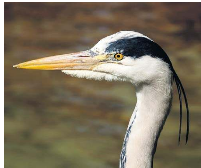
Czaple to rodzina ptaków z rzędu pelikanowych. Najpopularniejsze z nich to czaple siwe ( Ardea cinerea )