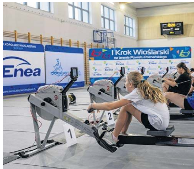
WZTW od lat promuje akcję „Pierwszy Krok Wioślarski” w powiecie. Tym razem zorganizuje Mistrzostwa Poznania

– Wiem, że na liście zgłoszeń są już wioślarze z Wrocławia i Bydgoszczy. Pewnie inne ośrodki też się zgłoszą, bo mistrzostwa mają formułę otwartą i cieszą się dużym zainteresowaniem – dodał szkoleniowiec.