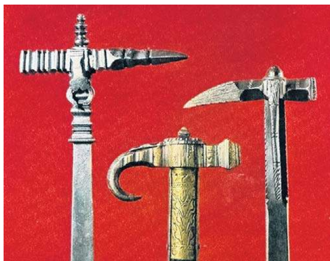
Od lewej: nadziak z XVII w., obuszek z wieku XVIII i nadziak z tego samego okresu (Muzeum WP w Warszawie)

Jak Chryzostom Pasek pisze w swoich pamiętnikach: „»Obuchem w piersi - padł«. Był to zatem cios ciężki, choć nie krwawy, tłómaczący wyrażenie językowe »pod obuchem«, czyli pod grozą ciosu”.