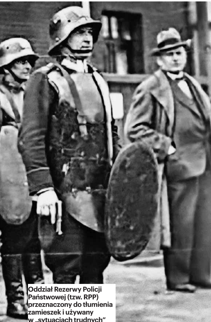
Oddział Rezerwy Policji Państwowej (zw. RPP) przeznaczony do tłumienia zamieszek i używany w „sytuacjach trudnych”