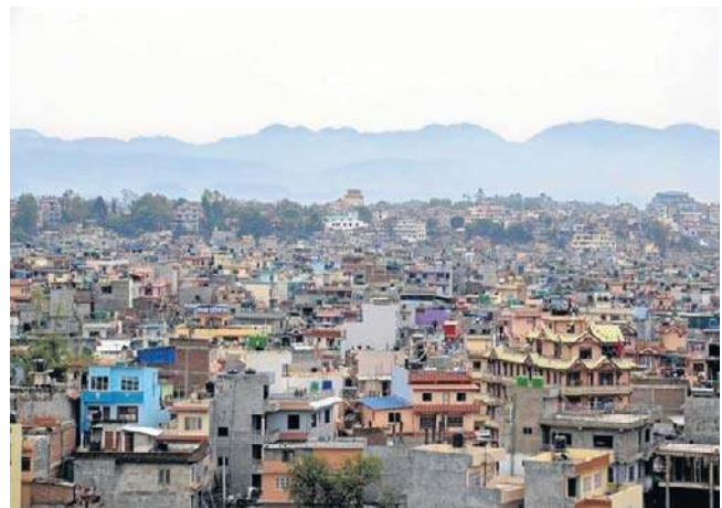
Katmandu liczy niecałe 900 tysięcy mieszkańców, natomiast obszar metropolitalny około 4 milionów

Szacuje się, że do urn pójdzie około 19 milionów Nepalczyków, którzy wybiorą 275 deputowanych.