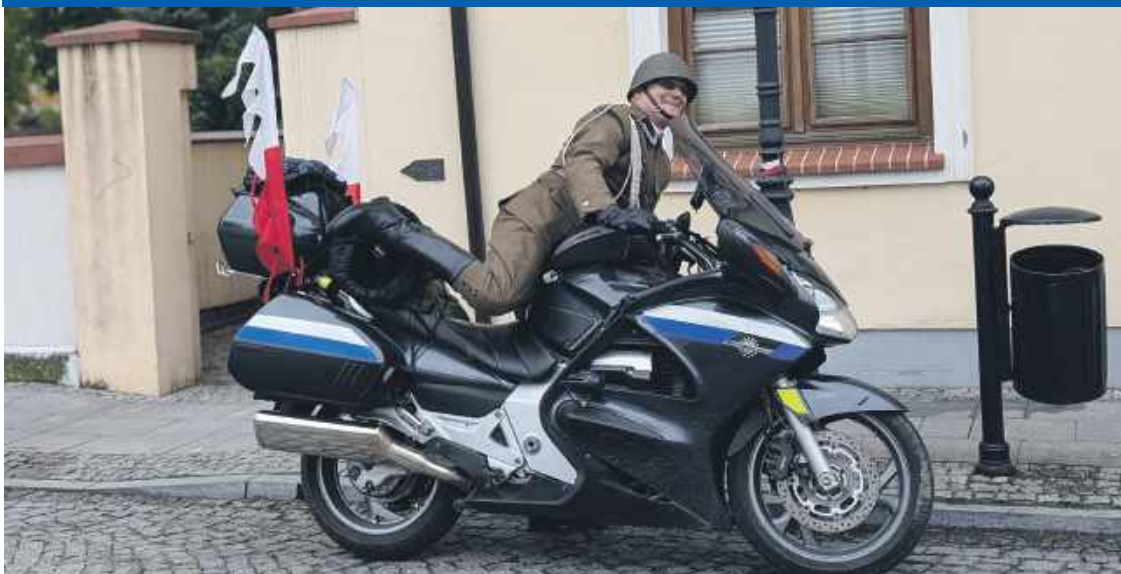
PODRÓŻE W CZASIE JEDNAK SĄ MOŻLIWE!