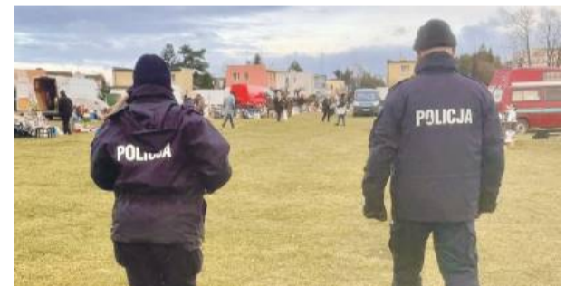
Policjanci regularnie odwiedzają strzelińskie targowisko, gdzie przestrzegają przed kradzieżami i sprawdzają legalność sprzedawanych towarów.