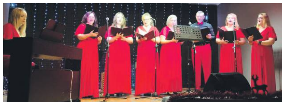
Zespół Cantanti zachwyił umiejętnościami muzycznymi.