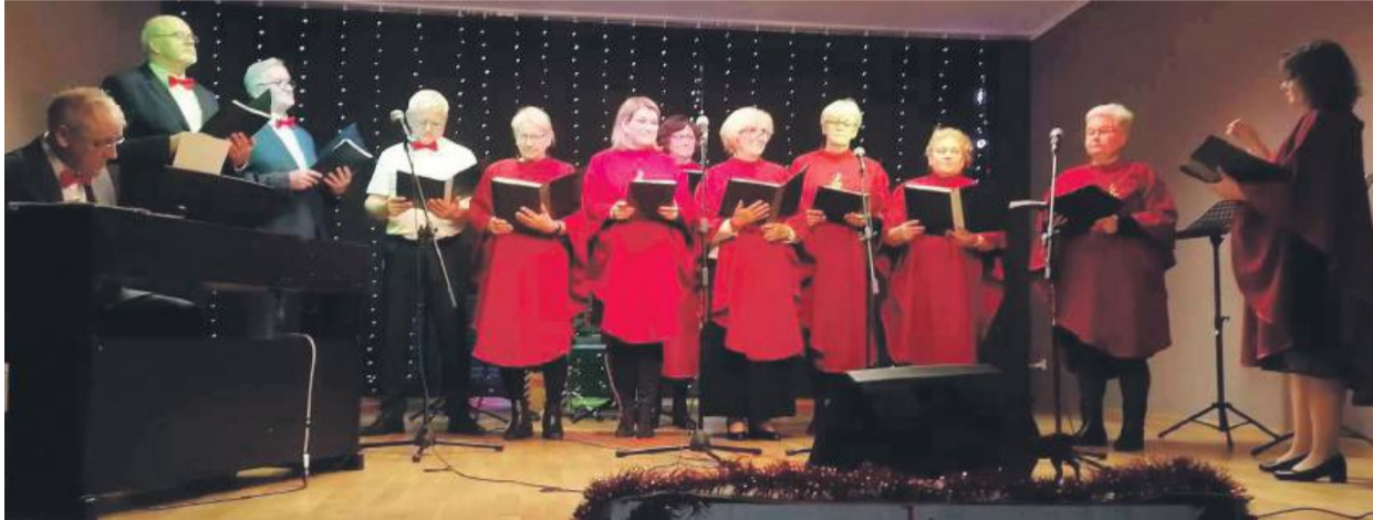
Chór Gaudete prezentował się pięknie.

Jak długo trwają święta? Czy o cudach wciąż można dziś usłyszeć? Przekonajcie się sami.