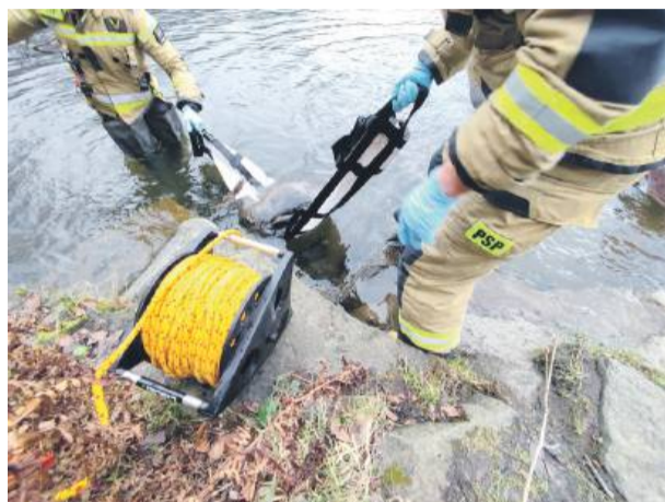
Martwą sarnę strażacy wyjęli przy pomocy specjalnej plandeki

na miejsce przybyli strażnicy z PSP w Strzelinie, którzy z wodowali niewielki