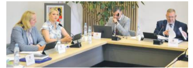
Sesja powiatu. Fot. ilustracyjne

Trzeba jednak jasno powiedzieć – za inwestycje powiatu odpowiadają ci, którzy