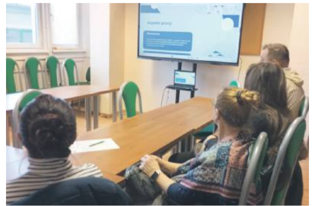
Uczestnicy zdobyli również praktyczne umiejętności tworzenia strategii skutecznego poszukiwania pracy, co może zwiększyć ich szanse na rynku.