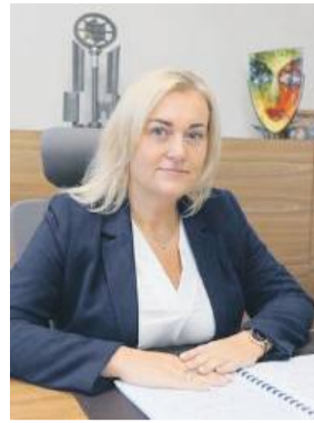
Burmistrz Dorota Pawnuł zaprasza na wyjątkową kolację w podziemiach strzelińskiego ratusza