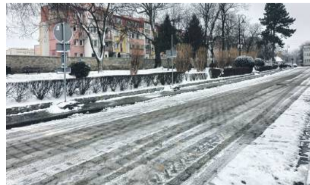
Znak zakaz parkowania przy ul. Pocztowej został ściągnięty w ubiegłym tygodniu