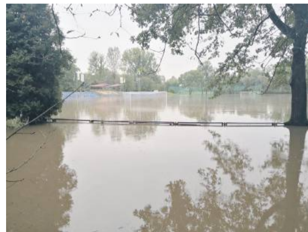
Podczas jesennych powodzi pod wodą znalazło się m.in. boisko w strzelińskim parku.

z wyminą zraszaczy oraz skrzynek na elektroawary, uszkodzonego drenażu boiska oraz remont płyty murawy, polegający na wykonaniu wertykulacji, piaskowania, szczotkowa-