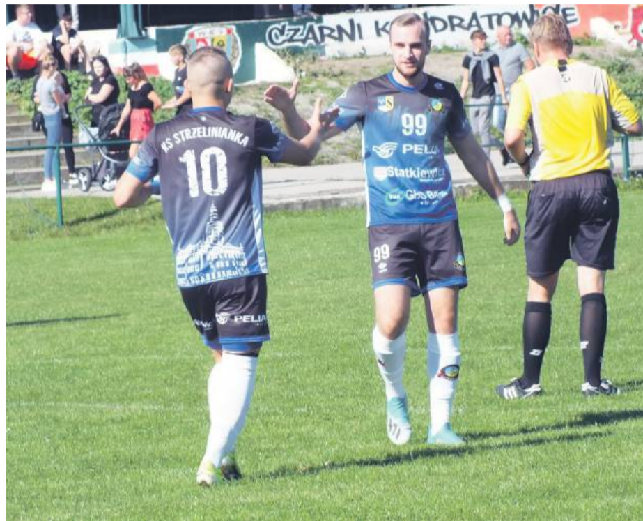
Strzelinianka rozegrać sześć sparingów