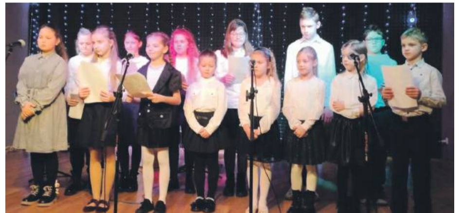
Niezwykle utalentowane dzieci ze scholi parafialnej w Borowie.

dycji kościoła w Polsce aż do 2 lutego śpiewamy kolędy i pastorałki, które rodzą w sercu radość i przypominają wydarzenia sprzed ponad