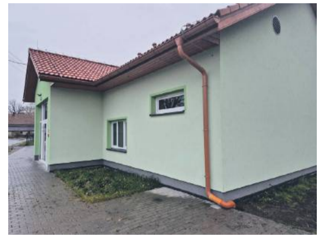
W ostatnim czasie przy świetlicy wiejskiej w Księginicach Wielkich wykonano profesjonalne odwodnienie