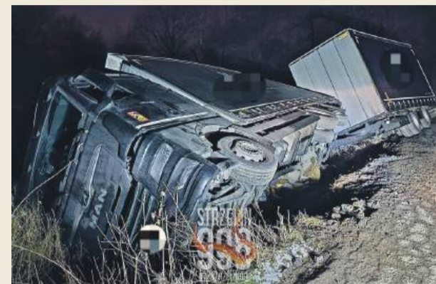
Przewrócona ciężarówka na drodze z Krzepic do Wyszonowic.

z Krzepic do Wyszonowic. Przewróciła się tam cięża-