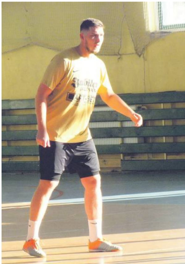
Piłkarze rozegrali pierwsze mecze o punkty w roku 2025