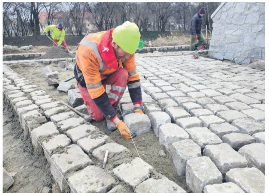
Plac obok remontowanej drogi układany jest również z dużej granitowej kostki. Takie miejsce będzie odporne na większe obciążenia i bardzo trwałe

Już dziś widać, że opaski drogi zrobione są z kostki granitowej. Czy cała droga będzie wykonana w tej technologii? Jaka to jest kostka?