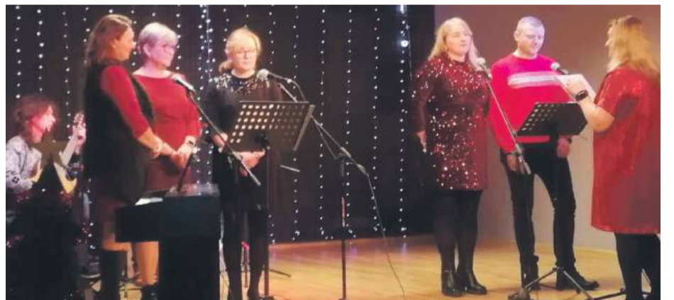
Najbardziej nowoczesny repertuar scholi parafialnej z Zielenic wzruszył publiczność do łez.