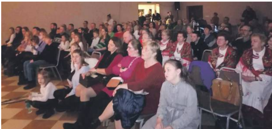
Zasłuchana publiczność.

wać z Maryją i Józefem przy Dzieciątku, które niesie światu pokój. Schola z Zielenic, grając i śpiewając kolędy świa-