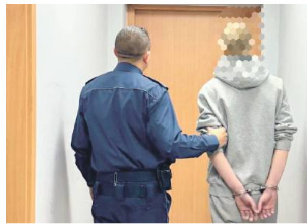
Poszukiwany mężczyzna ewidentnie nie spodziewał się, że w końcu zostanie namierzony i trafi w ręce policji.