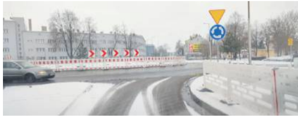
Wjazd i wyjazd z ul. Kościuszki jest już otwarty

Od kilku dni otwarty została wjazd i wyjazd z ronda