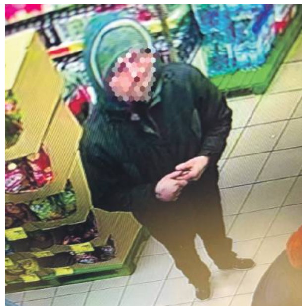
Mężczyzna wyrwał torbę seniorkie. Na szczęście policjanci szybko zatrzymali sprawcę.