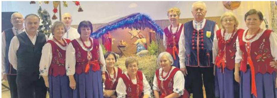
Zespół Przewornianie podczas występu w Starym Grodkowie.

W niedzielę, 12 stycznia, w świetlicy wiejskiej w Starym Grodkowie odbył się jubileuszowy XX Wieczór Kolęd, organizowany przez radę sołecką i radę parafialną. Wydarzenie zgromadziło lokalną społeczność, która wspólnie świętowała przy dźwiękach tradycyjnych kolęd.