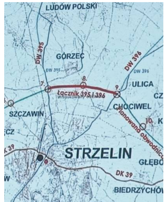
Zaznaczony na mapie kolorem czerwonym planowany łącznik dróg wojewódzkich nr 395 i 396 (w centralnym miejscu zdjęcia)