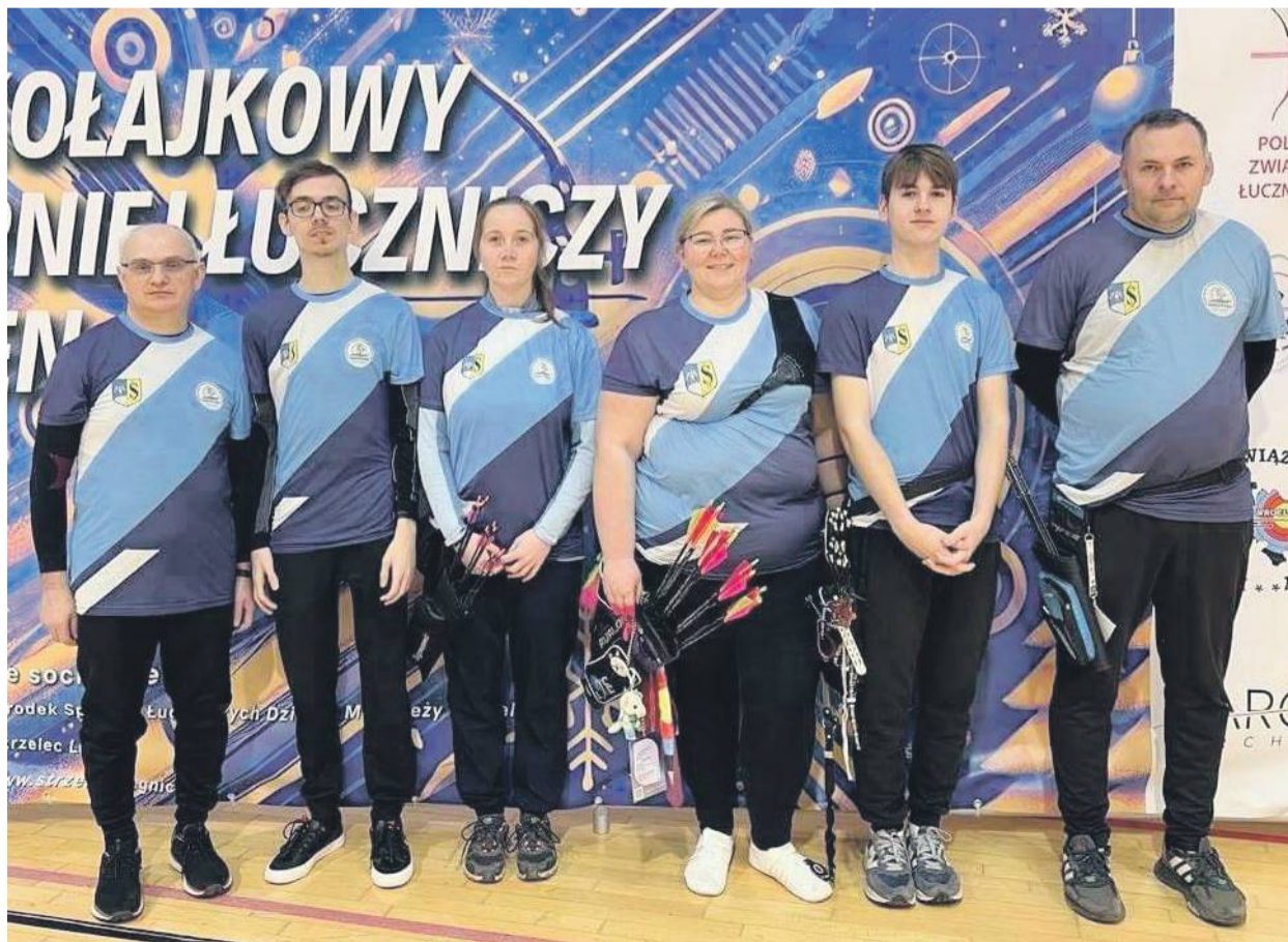
Łucznicy ze Strzelina należą do wojewódzkiej czołówki