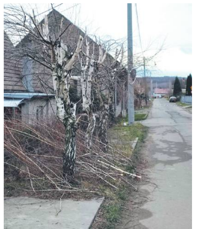
Ogłowione brzozy nie będą przez jakiś czas dotykały znajdującej się nad nimi linii energetycznej. Po ich przycięciu na poboczu drogi pozostały spore ilości gałęzi do posprzątnia