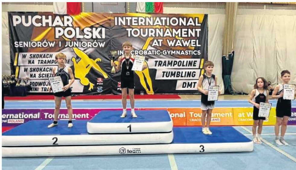
To był naprawdę wielce udany start naszych reprezentantów Freedom of Movement

W XIII Międzynarodowym Turnieju Pod Wawelem (6 - 8 marca 2026 r.) wzięło udział 525 zawodników z 7 krajów, w tym