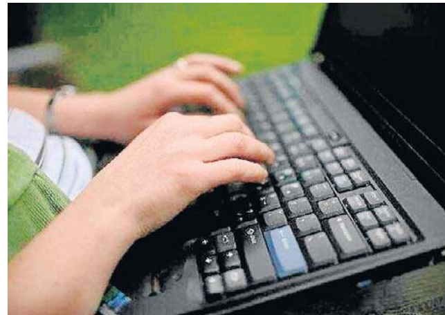
Zanim zamówimy coś przez internet sprawdzmy sprzedawcę i warunki dostawy - przypomina UOKiK

To była prawda. Odesłanie maski do Hong Kongu sklep wyceenił na 240 zł, do tego doliczył 15 proc. za „uzupełnienie zapasów”. Tłumaczył, że przekroczony już został 14-dniowy okres