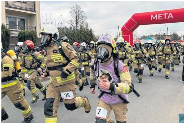
Strażacy biegli w pełnym umundurowaniu bojowym łącznie z butlą, z której powietrzem oddychają podczas biegu

Dziennik Łódzki ☎ 42 715 80 68 bok.prenumerata@polskapress.pl prenumerata.dzienniklodzki.pl