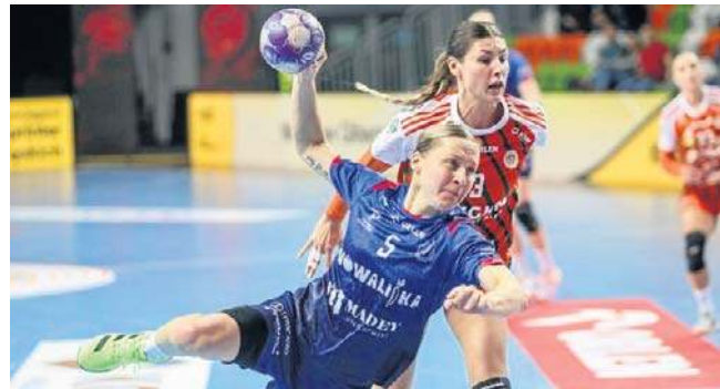
Szczyptorniki Piotrcovii Piotrków Trybunalski mają trzecie miejsce w Superlidze na wyciągnięcie ręki