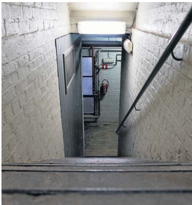
Schron schronowi nierówny. Firmy z branży podpowiadają, na co zwracać uwagę przy takich inwestycjach

I podpowiada, że jeżeli ktoś nie ma miejsca na wybudowa-