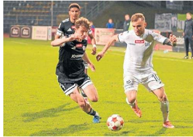
Piłkarze rezerwowej drużyny ŁKS Łódź (czarne stroje) zajmują przedostatnie miejsce w tabeli II ligi