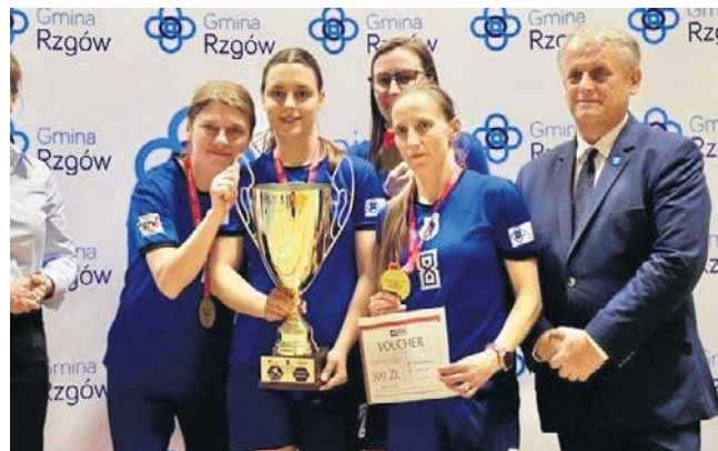
Puchary, dyplomy i nagrody finansowe trafiły w godne ręce. Zawodniczki Zawiszy Rzgów nie miały równych

Bardzo cieszy futnetowy rozwój, już nie tylko zawodniczek trenujących w centralnym ośrodku Polskiego Futnetu, jakim od lat jest Rzgów, ale także w innych lokalizacjach, na czele z Szczercowem. Świetnie wrażenie zrobili na mnie również