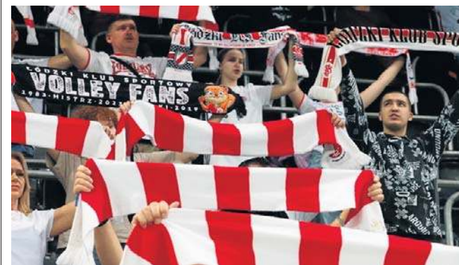
Kibice siatkarek ŁKS Commercecon często bywają także na meczach koszykarzy ŁKS Coolpack