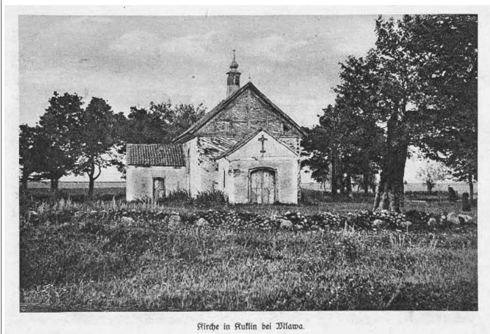
Kościół w Kuklinie, okres I wojny światowej