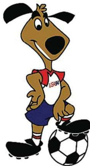
Striker, oficjalna maskotka Mistrzostw