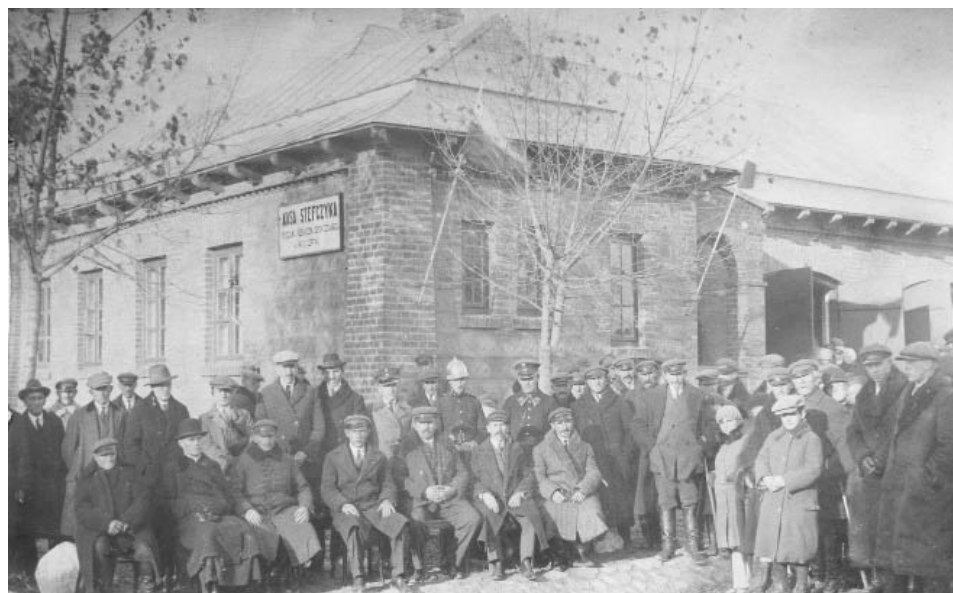
OSP i Kasa Stefczyka w Wieczfni, 1929 r.