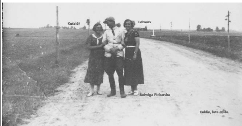
Widok ogólny wsi Kuklin, lata 30. XX w.