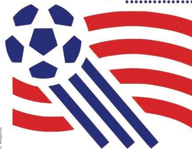
Oficjalne logo Mistrzostw