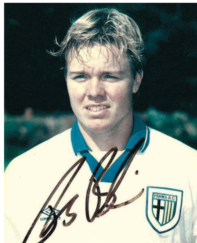
Zdjęcie i autograf, które w 1994 Tomas wręczył mi osobiście. Był czas, że zdjęcie stało w ramce i bez mała modliłam się do podobizny, i do samego podpisu...!

Korzystałam z materiałów w „El País”, „The Bogota Post”, na goal.com oraz w Encyclopædia Britannica.