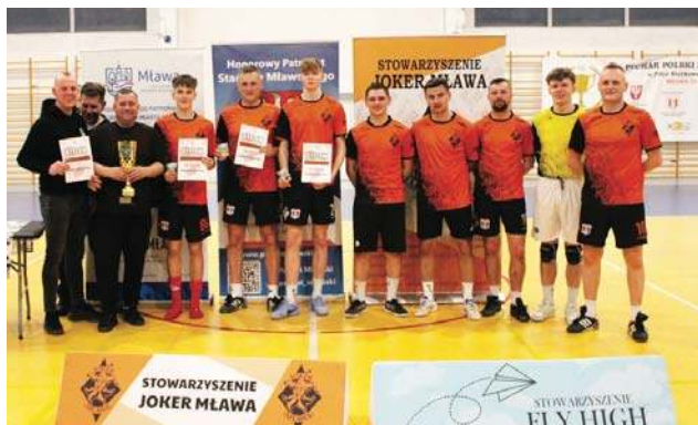
Joker Mława znów górą s. 13