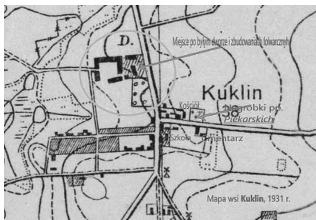
Mapa wsi Kuklin, 1931 r. (Domena publiczna)