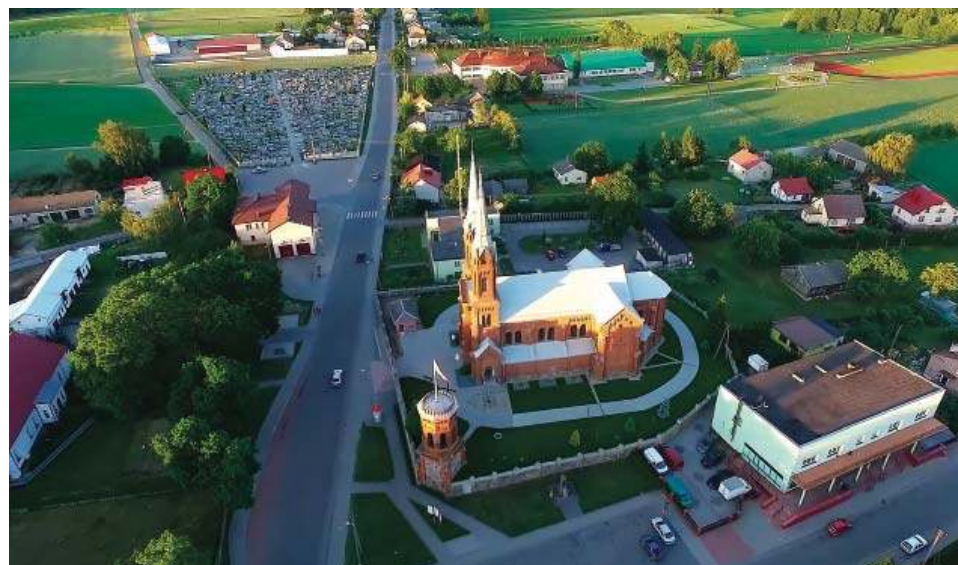
Widok ogólny wsi Wieczfni, ok. 2025 r. (Domena publiczna)

Do Wieczfni przyjeżdżały również organizacje z innych wsi. Od kiedy zbudowano tam remizę strażacką (między 1927-29 r.) zrobiło się więcej miejsca do ćwiczeń i zabaw. (Wbu-