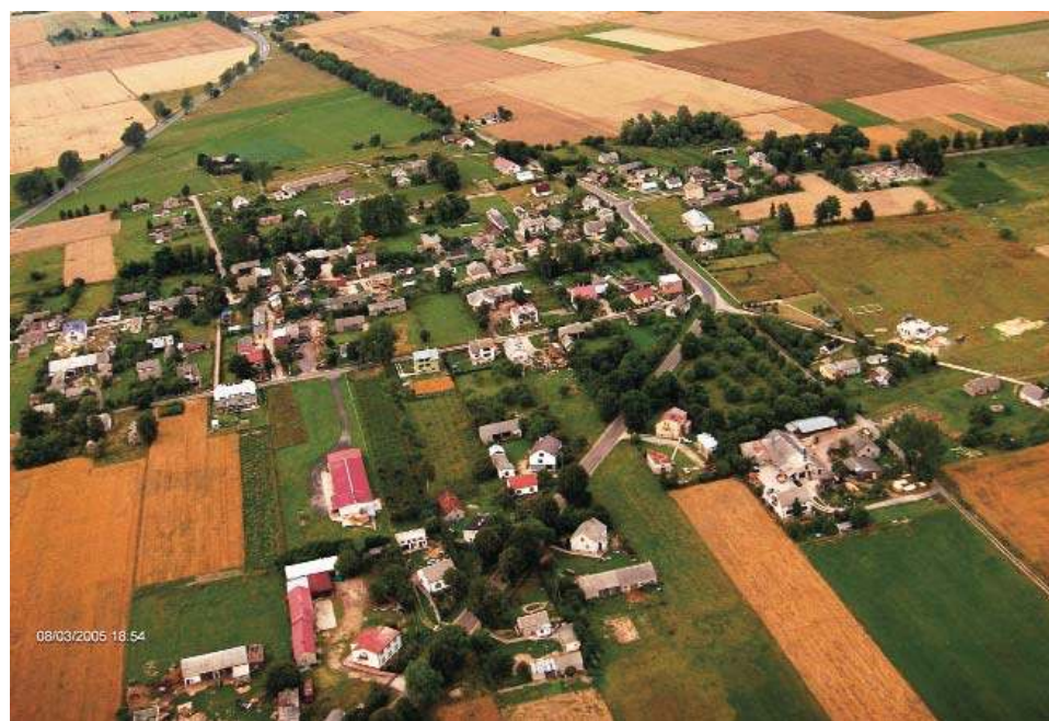
Widok ogólny wsi Kuklin, 3 VIII 2005 r.

Gdy mój ojciec wrócił do wsi Kuklin. W Kuklinie nie należałam do „Koła Gospodyń Wiejskich”