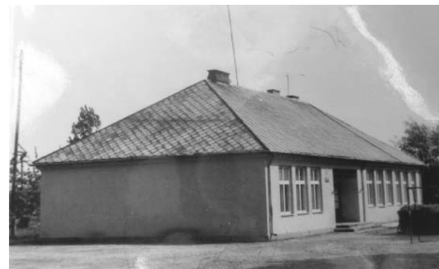
Przedwojenna szkoła w Kuklinie, lata 70. XX w.

się wykłady, np. pouczenie dla dziewcząt odnośnie dzieci, a także roboty gospodarcze. C.d. n.