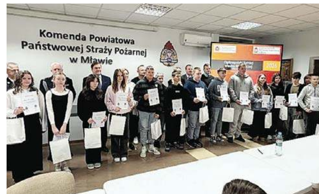
Eliminacje powiatowe OTWP „Młodzież zapobiega pożarom” s. 16