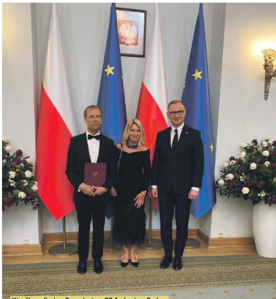
Wspólne zdjęcie z Prezydentem RP Andrzejem Dudą