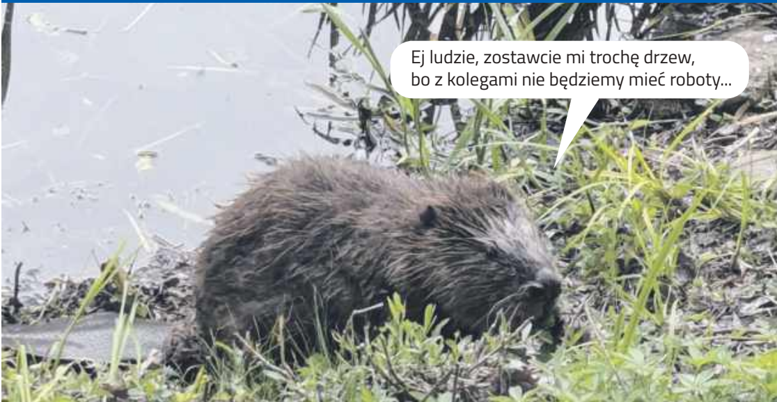
MIESZKANIEC PUŁTUSKIEGO KANAŁKU – BÓBR PUŁTUŚ (6 LAT)