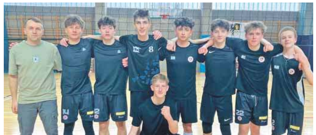
Uczniowie I Liceum Ogólnokształcącego im. Stefanii Sempołowskiej w Tarnowskich Górach zdobyli mistrzostwo powiatu tarnogórskiego w siatkówce, przechodząc przez cały turniej bez porażki

W składzie zwycięskiej drużyny z Zespołu Szkół Chemiczno-Medycznych i Ogólnokształcących w Tarnowskich Górach znalazły się: