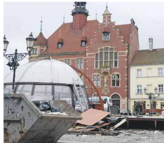
Ostatni rzut oka na kopuły

Czy zniknięcie kopuł było stratą, czy szansą na nowy początek? A jeżeli to ostatnie, to czy tą szansę dobrze wykorzystano? Każdy Tarnogórzanin ma na ten temat własne zdanie. (MIR)