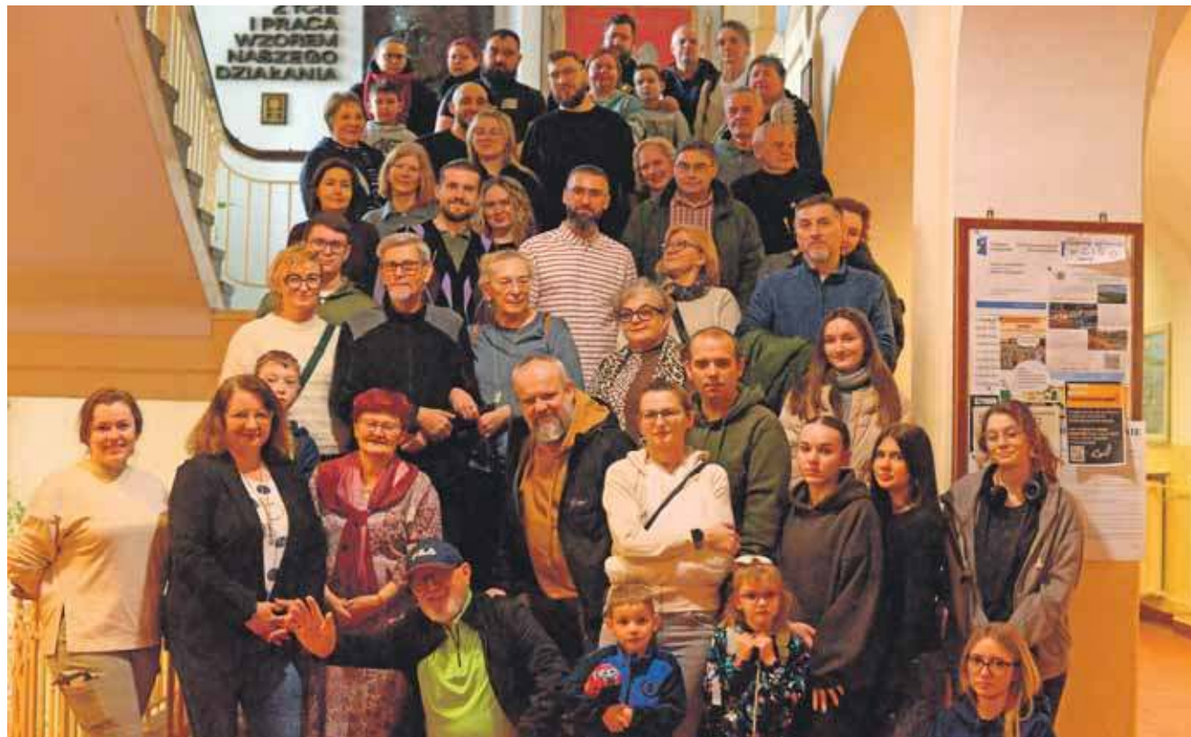
W rajzie wzięło udział kilkadziesiąt osób, niektóre dobrze znały budynek

W czasie wojny w gmachu działało Żeńskie Seminarium