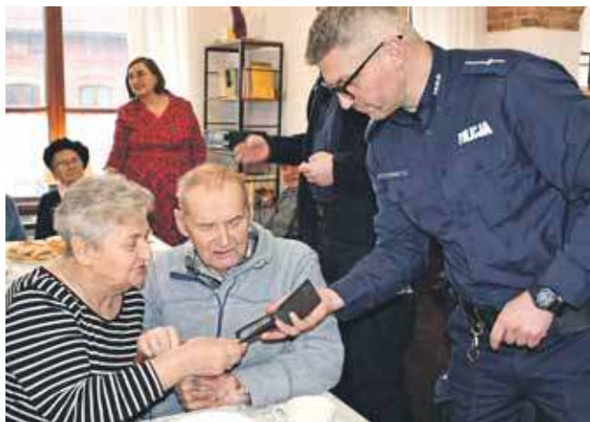
Policjanci mówili, co robić, żeby nie dać się oszukać

Panie mają do dyspozycji pomieszczenia przykościelnej salki, kiedyś służyły jako zabudowania gospodarcze. Były w kiepskim stanie, ale zapał i ogrom pracy zmieniły je nie do poznania. W prace zaangażowało się KGW i mążowie pań, sołtys i rada sołecka, przychodzili też mieszkańcy. Panie cały dochód ze swojej działalności przekazywały właśnie na rzecz remontu. Dziękują wszystkim, na których wsparcie mogły liczyć.