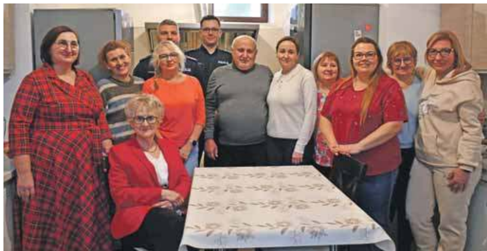
Chcą integrować lokalną społeczność i widać, że dobrze im to wychodzi

Na spotkaniu byli także policjanci z pobliskiego