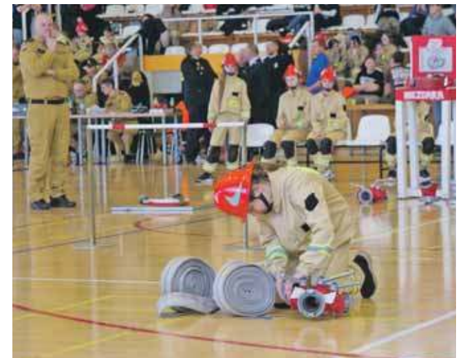
W rywalizacji z najlepszej strony pokazało się 27 ekip

Sędzią głównym zawodów był st. bryg. Piotr Gwóźdź, a medale czekały na wszystkich uczestników. (ESP)