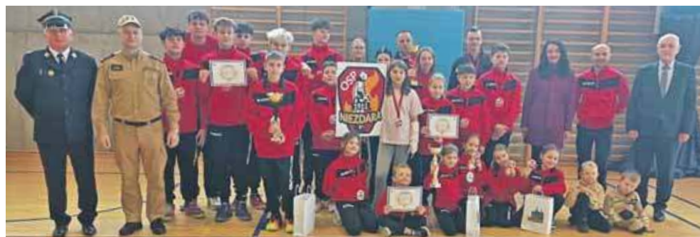
Reprezentacja OSP Niezdara

W kategorii MDP dziewcząt wygrała OSP Niezdara przed OSP Ożarówice i OSP Księża Las, a MDP chłopców