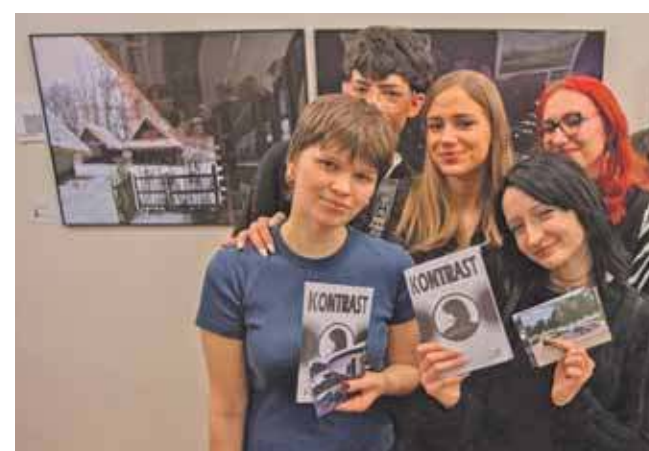
– Wernisaż był pięknym dowodem na to, jak wysoki poziom i potencjał ma młoda sztuka – zaznaczają przedstawiciele ZSAP

– Gratulujemy uczniom wspaniałego sukcesu, dojrzałości artystycznej i odwagi w prezentowaniu własnych poszukiwań twórczych. Dzisiejszy wernisaż był pięknym dowodem na to, jak wysoki poziom i potencjał ma młoda