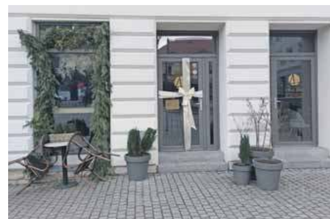
Restauracja 4 Pory Dnia kończy swoją działalność