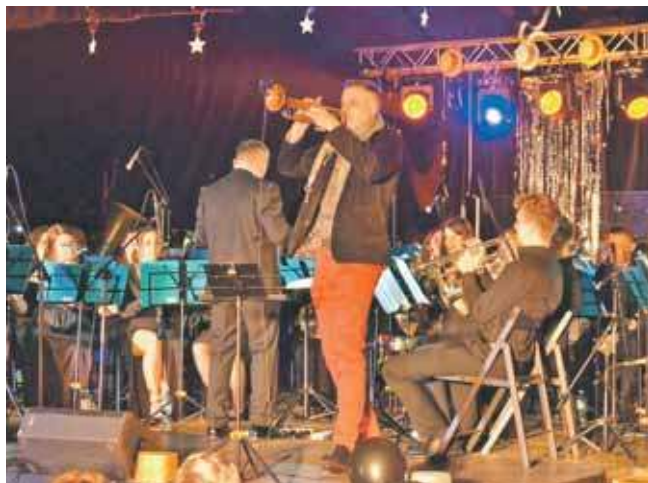
Karnawałowy koncert orkiestry z Miasteczka Śląskiego

Kabaret zaprezentuje nowy program „Da się zrozumieć” – nowe skecze, piosenki i zapowiedzi. Jak zawsze znajdzie się co naj-