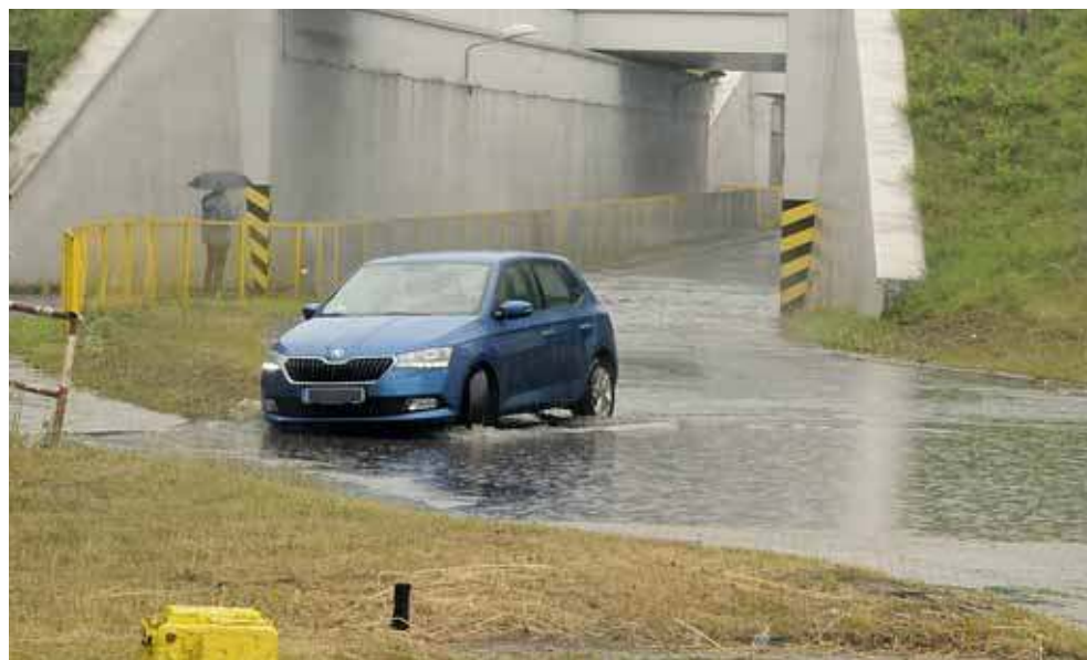
Od lat w czasie ulewnych deszczy zalewany jest odcinek pod wiaduktem

– Zgodnie z dokumentacją, którą posiadamy, ta inwestycja – zdaniem specjalistów – może nie wyeliminować problemu całkowicie – powiedział w czerwcu ubiegłego roku Dariusz Wysypol.