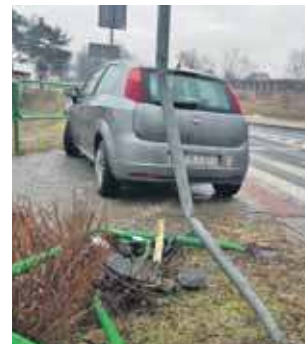
Zaczęto się od Fiata w barierkach