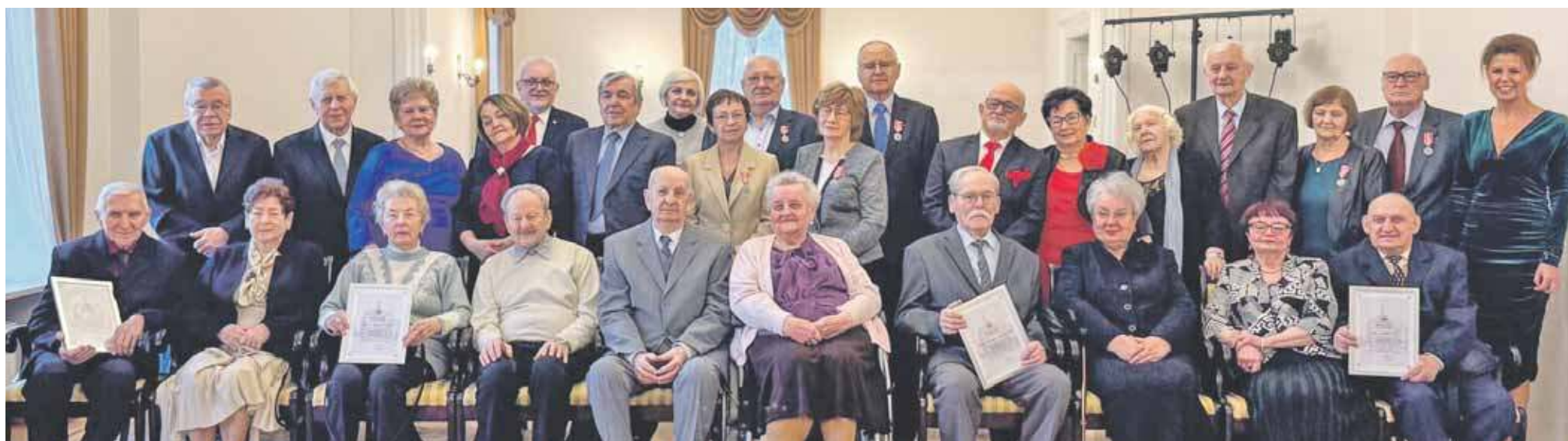
W Pałacu w Rybnej trzynastce par świętowało swoje małżeńskie jubileusze