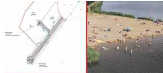
Obiekt powstanie przy istniejącej plaży nad górnym stawem w Zielonej

– Obiekt będzie miał pełne zaplecze z toaletami, przebie-