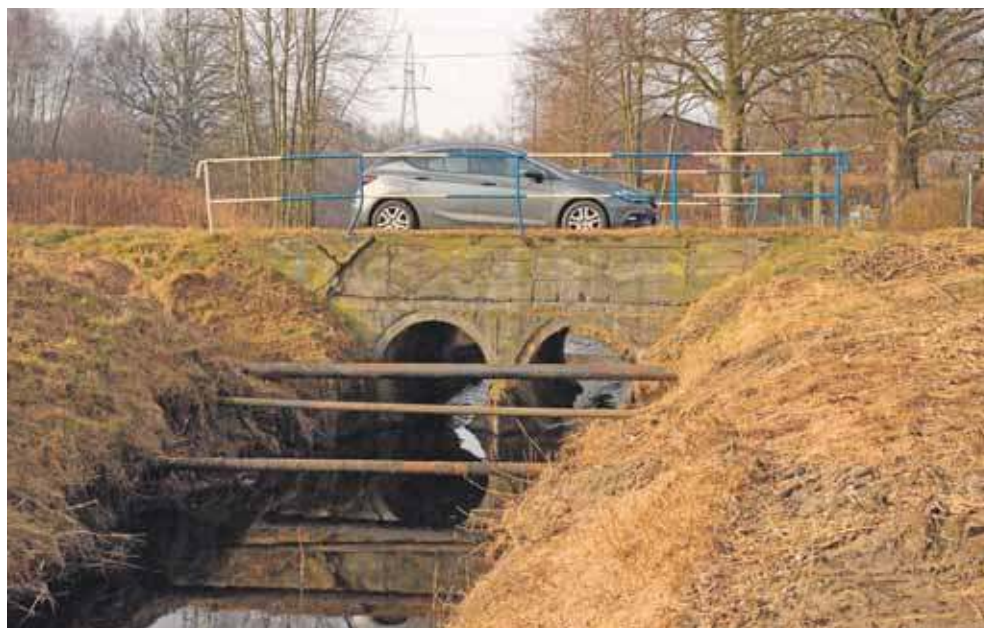
Kluczowym elementem zgłoszonego projektu jest propozycja budowy mostu o dużej nośności na rzece Stole przy ul. Wodnej

Kluczowym elementem zgłoszonego projektu jest propozycja budowy mostu o dużej nośności na rzece Stole przy ul. Wodnej. Zdaniem autora projektu takie rozwiązanie pozwoliłoby na wyprowadzenie ciężkiego transportu z ulic Strzybnicy. Z ul. Zagórskiej przez ul. Wodną do bazy samochodów przy ul. Grzybowej jest 1 km, natomiast teraz muszą one pokonywać ponad 4 km, przejeżdżając przez centrum dzielnicy. Obecnie obowiązuje zakaz wjazdu na most