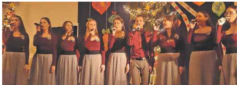
Młodzi artyści z Powiatowego Młodzieżowego Domu Kultury w Tarnowskich Górach pod koniec stycznia po raz ostatni w tym roku dali kolędowy koncert