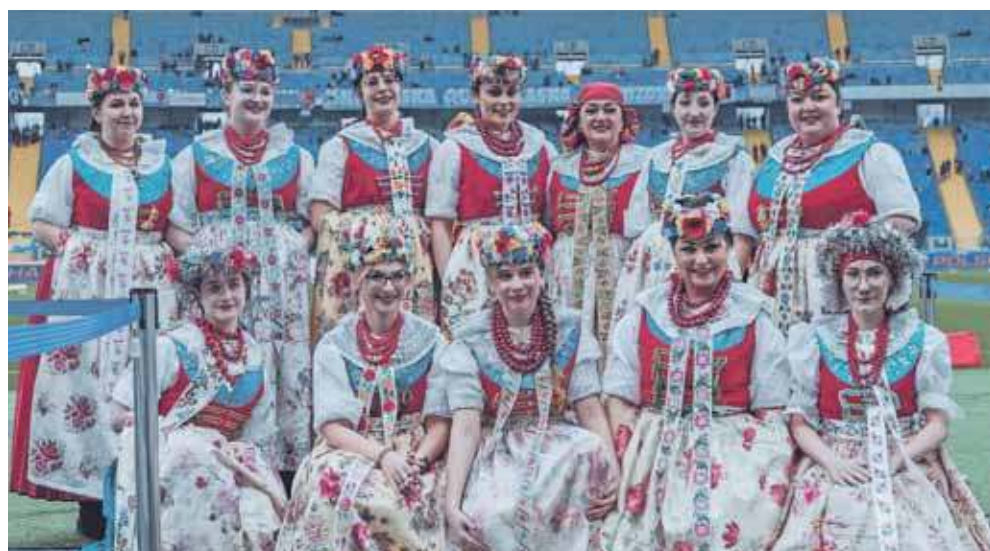
8 lutego na murawie Stadionu Śląskiego, na meczu Ruchu Chorzów, pojawiły się panie z Koła Gospodyń Wiejskich z Orzecha