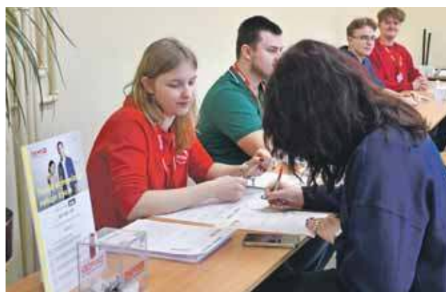
Młodzież chętnie zaangażowała się w akcję

Wcześniej w szkole były lekcje edukacyjne, uczniowie dowiadywali się o tym, jak przebiega rejestracja dawców, jak potem pobiera się szpik – jeżeli szczęśliwie będzie zgodność z biorcą. Okazało się, że wśród najbliższych, znajomych młodych ludzi też są osoby, które potrzebują pomocy.