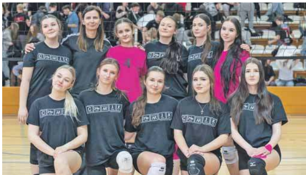
Zawodniczki „Chemika” potwierdziły swoją klasę na siatkarskich parkietach w Tarnowskich Górach

Uczennice z Chemika i uczniowie z Sempy zdobyli mistrzostwo powiatu tarnogórskiego w siatkówce. Dziewczyny wywalczyły mistrzowski tytuł po raz trzeci z rzędu, chłopcy przeszli cały turniej bez porażki. Finałowy turniej powiatowej licealiady rozegrano 9 lutego w hali sportowej w Tarnowskich Górach.