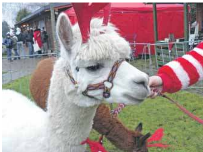
Atrakcją, nie tylko dla najmłodszych, były alpaki

I taka jest też idea Połomskiego Kiermaszu Mikołajkowego. To forma podziękowa-