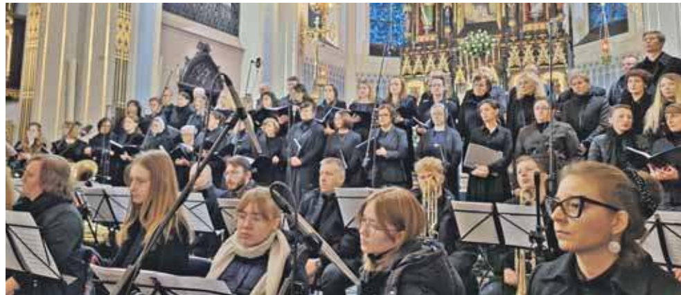
Prawykonanie oratorium „Wojciech – Adalbert – święty znak dla Radzionkowa”