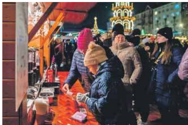
Bytomski jarmark potrwa do 21 grudnia

20 grudnia o godz. 17 – Zimowa muzyka z DJ-em, godz. 18 – Zimowa Kraina Zabawy – animacje dla rodzin, a o godz. 19.30 – Christmas songs z DJ-em. 21 grudnia o godz. 17 – Zaginiona Gwiazdka