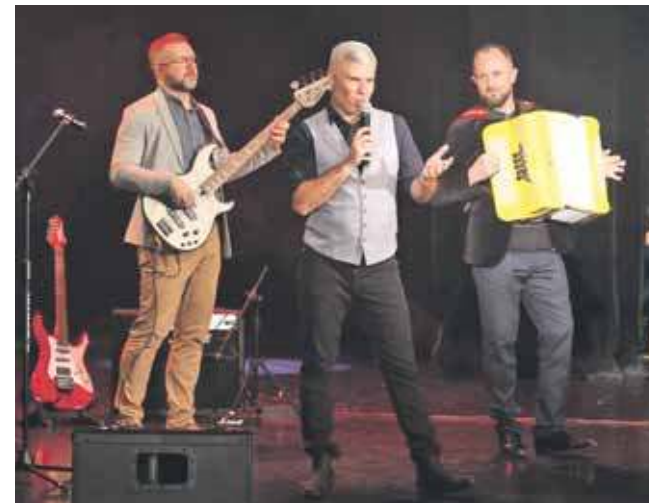
Koncert to cykliczna impreza odbywająca się w tym roku po raz XVIII

Cegielki w cenie 40 zł i 50 zł są dostępne w kasie CKK.