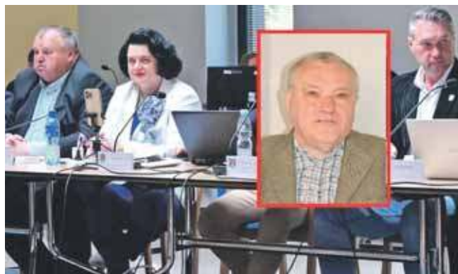
NSA oddalił kasację w sprawie uchwały antyimigranckiej powiatu tarnogórskiego, którą złożył Zenon Lis

Po drugie, radni weszli w uprawnienia należące do administracji rządowej. Zenon Lis uznał także, że