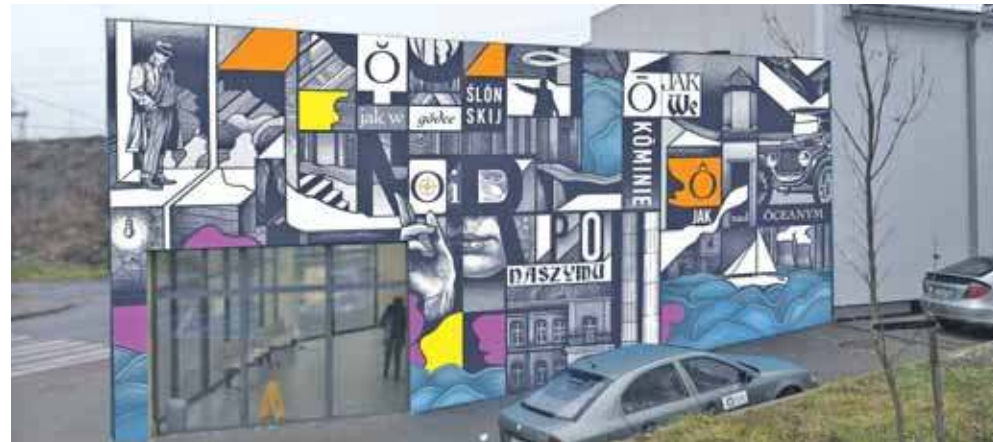
Tak ma wyglądać nowy radzionkowski mural