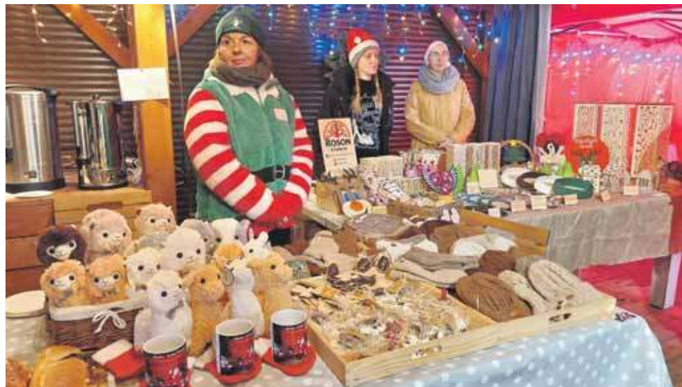
Na kiermaszu królowali producenci i rękodzielnicy z Połomi