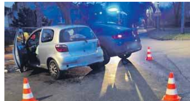
Wszystkie kierujące były trzeźwe