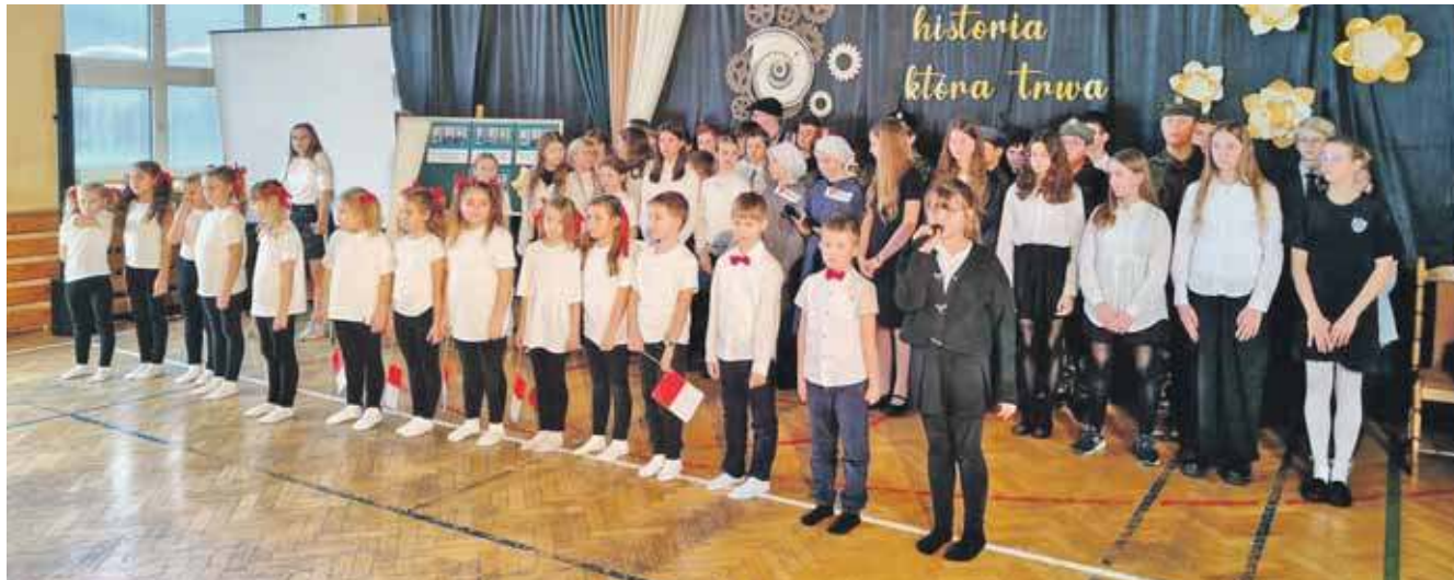
Początki szkoły w Orzechu sięgają 1869 roku, natomiast 50 lat temu powstała nowa siedziba placówki