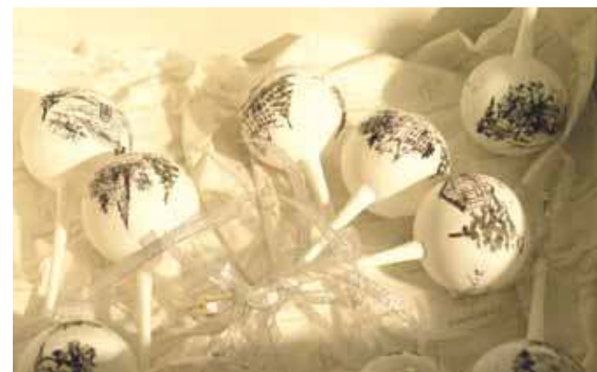
Rarytasem były bombki z dawnej wytwórni w Tarnowskich Górach, która została zamknięta kilkadziesiąt lat temu

Na przełomie lat 70. i 80. wprowadzono mechaniczną