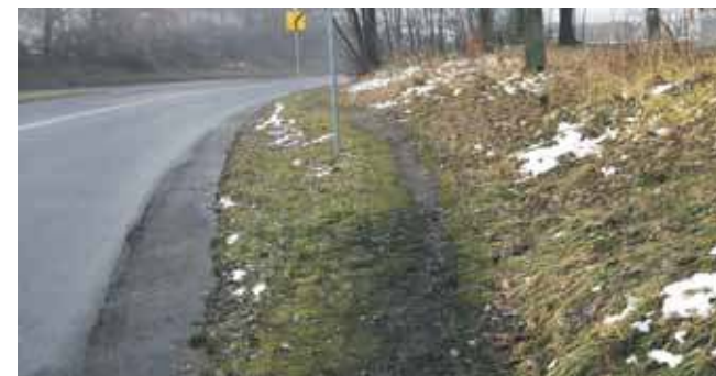
Wydeptana ścieżka, ani bezpieczna, ani komfortowa