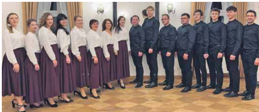
In Tempore wystąpi w Kościele Zbawiciela w Tarnowskich Górach