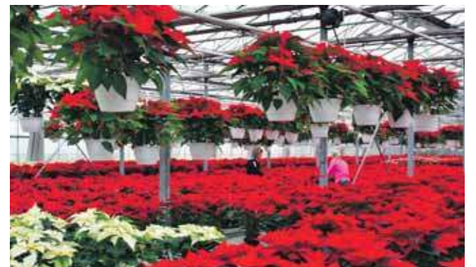
– W tym roku rozpoczęliśmy sadzenie już w czerwcu, obecnie mamy przeszło 20 tysięcy gwiazd, które można u nas zakupić aż do 23 grudnia – mówi Marek Wojewodzic