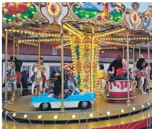
Największą atrakcją dla dzieci będzie bezpłatna karuzela wiedeńska

Między występami Śpulanderów swoje koncerty