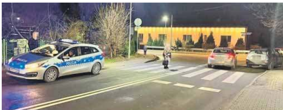
38-latek był na przejściu dla pieszych, kiedy wjechał w niego samochód osobowy

Mężczyzna nie ustąpił pierwszeństwa pieszemu znajdującemu się już na pasach, w wyniku czego doszło