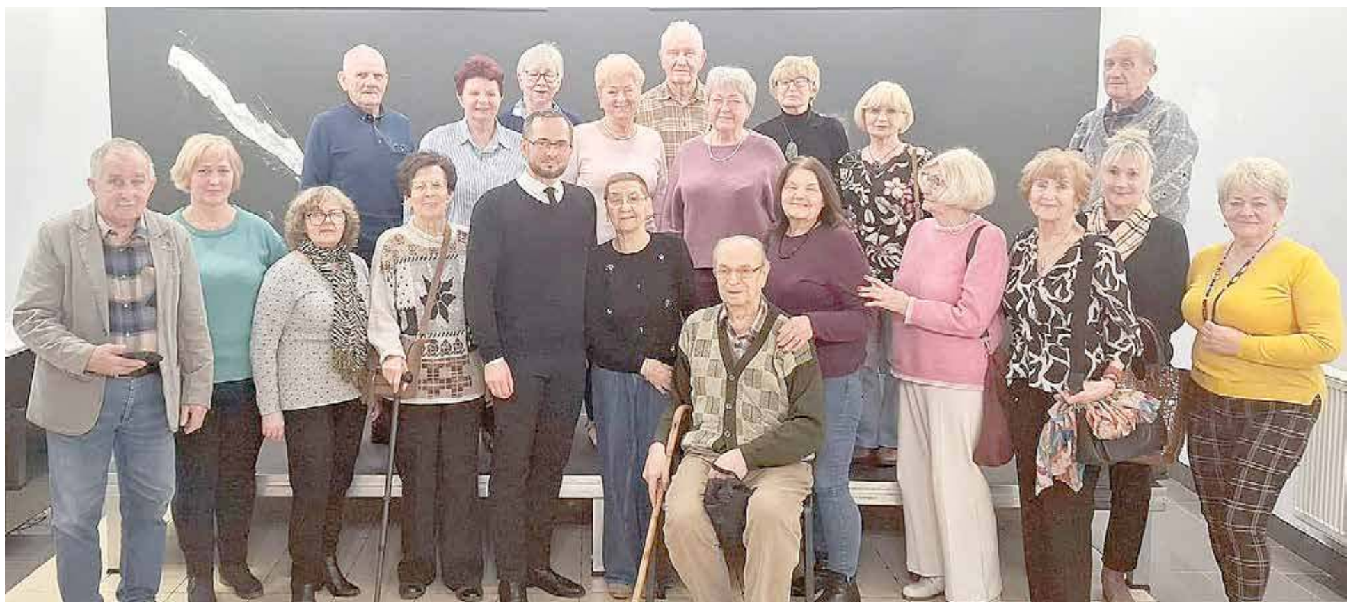
Spotkanie cieszyło się zainteresowaniem ze strony słuchaczy Koła Historycznego UTW Goleniów