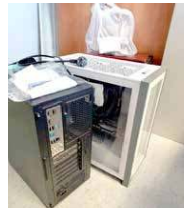
Podstawowym narzędziem pracy oszustów internetowych jest komputer

cych oszustw internetowych. W prowadzonym postępowaniu ustalono już około tysiąca osób pokrzywdzonych, a straty spowodowane przestępczą działalnością pięciu mieszkańców powiatu goleniowskiego osza-