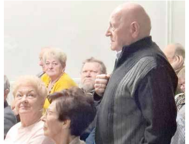
Uczestnicy spotkania zadawali wiele pytań