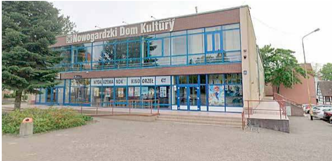
Wniosek Gminy Nowogard dot. termomodernizacji NDK znalazł się tylko na liście rezerwowej