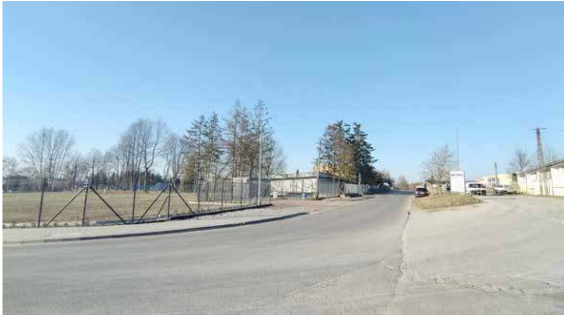
Działka na której możliwa będzie organizacja PSZOK położona jest przy ul. Górnej