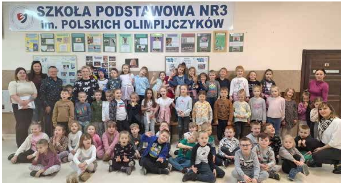
To była najlepsza okazja, aby zobaczyć jak wygląda SP nr 3 od wewnątrz

Inf. SP nr 3 (art. M. Kijowska, M. Kazuba)