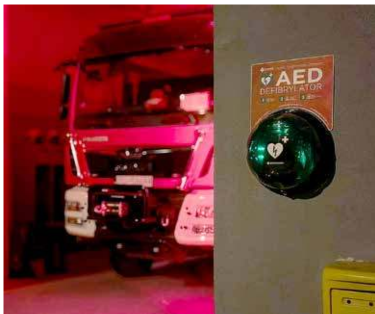
Urządzenie zamontowane zostało na ścianie remizy OSP Węgorza, tuż obok bramy wyjazdowej