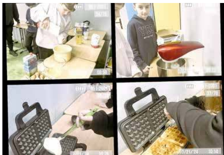
Okazuje się, że matematyka może być bardzo przydatna w kuchni