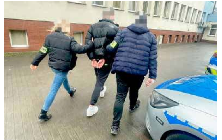
Wobec trzech zatrzymanych sąd orzekł środek zapobiegawczy w postaci tymczasowego aresztu

Zebrany w tej sprawie materiał dowodowy pozwolił na przedstawienie wszystkim zatrzymanym zarzutów dotyczą-