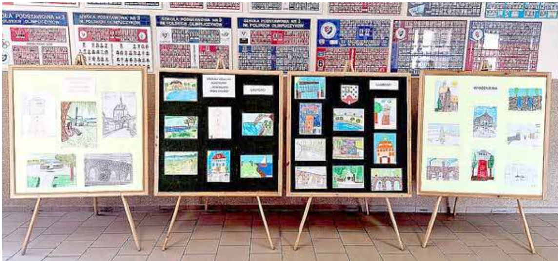
Wystawa nagrodzonych prac

Ogłoszenie wyników i wystawienie prac nastąpiło 4 marca