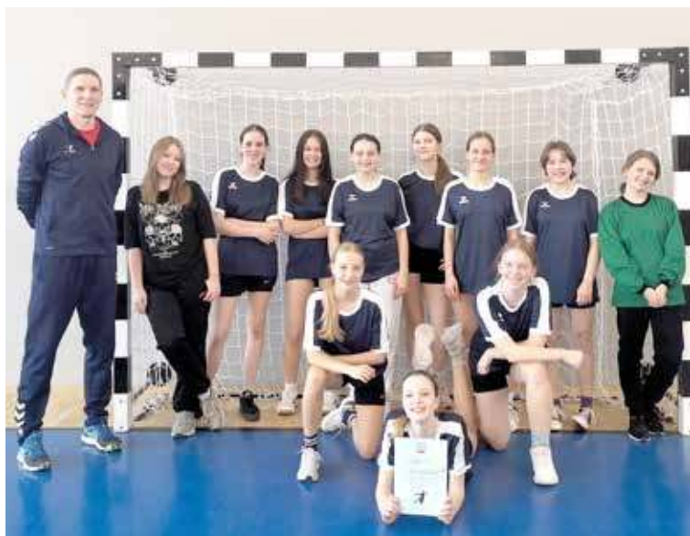
Drugie miejsce w regionie dało przepustkę do półfinału wojewódzkiego. Brawo!

Awansem do półfinału wojewódzkiego w rywalizacji dziewcząt zakończył się start reprezentacji SP nr 1 w Igrzyskach Młodzieży Szkolnej na poziomie Regionu „B”.