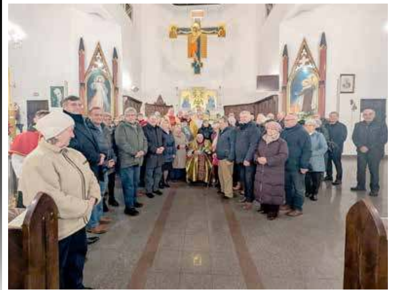
Wspólne zdjęcie z parafianami