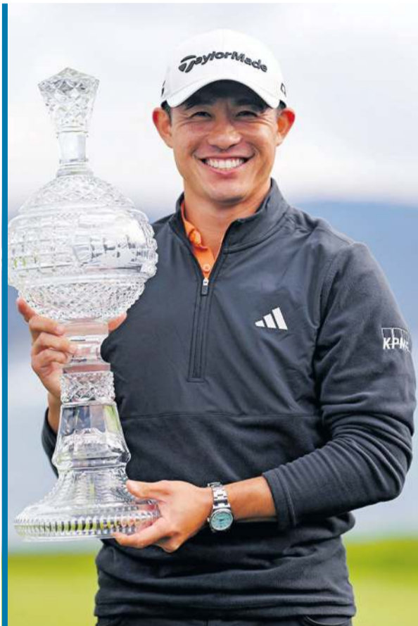
Collin Morikawa zwyciężył na Pebble Beach!

Niecałe 5 miesięcy później, zwyciężył w wielkim