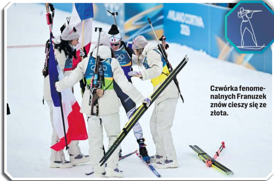
Czwórka fenomenalnych Franuzek znów cieszy się ze złota.

Na starcie stanęło 20 ekip, Polki ruszyły na trasę