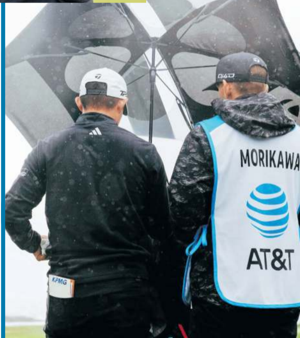
Warunki w niedzielę były wymagające.

wróżyło dobrze. W odpowiedzi „wykreślił” 63 uderzenia, rozegrał swoją najlepszą rundę i niespodziewanie wskoczył do mitycznej 7-osobowej dogrywki o brąz, w której znaleźli się jeszcze C.T. Pan, Mito Pereira, Sebastian Munoz, Rory McIlroy, Paul Casey i Hideki Matsuyama! Panowie ruszyli w bój w dwóch grupach. Najpierw odpadli Matsuyama i Casey. Na trzecim dołku Collin o mały włos nie zakończył całej zabawy, prawie trafiając drugim uderzeniem do dołka. Na czwartym dołku na placu boju pozostali już tylko