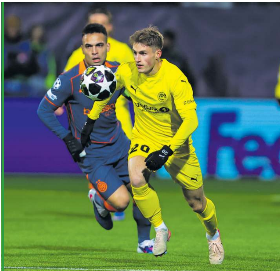
Bodo/Glimt jest bezlitosne - po wygranych z Manchesterem City i Atletico Madryt pokonało Inter Mediolan!

W 61 minucie po raz drugi wyszło na prowadzenie, a 3 minuty później było już 3:1! Mediolan był w szoku! Chivu musiał sięgnąć po posiłki, wprowadził Zielińskiego na plac gry, ale na odrabianie strat było już za późno. Podczas rewanżu w Mediolanie Inter ma do odrobienia dwie