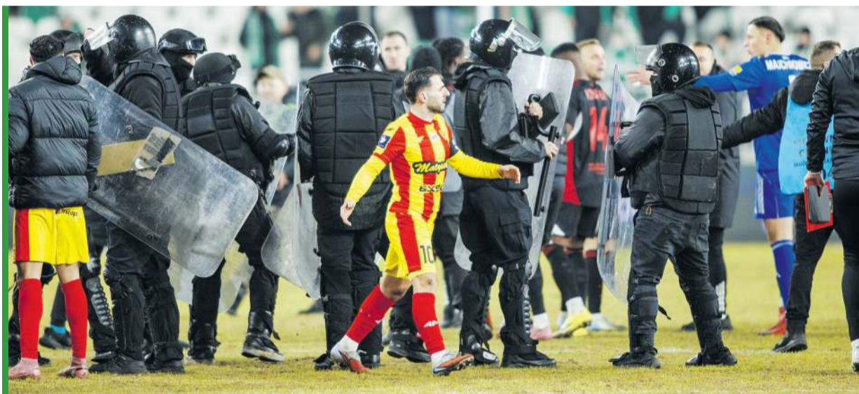
Emocje po „świętej wojnie” jeszcze długo będą się kottować...