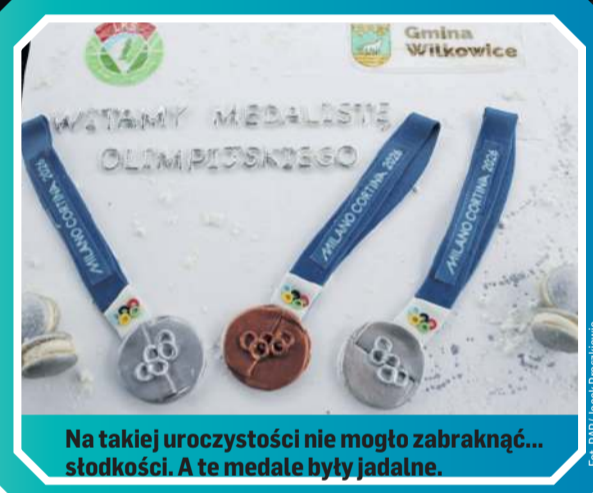
Na takiej uroczystości nie mogło zabraknąć... słodkości. A te medale były jadalne.