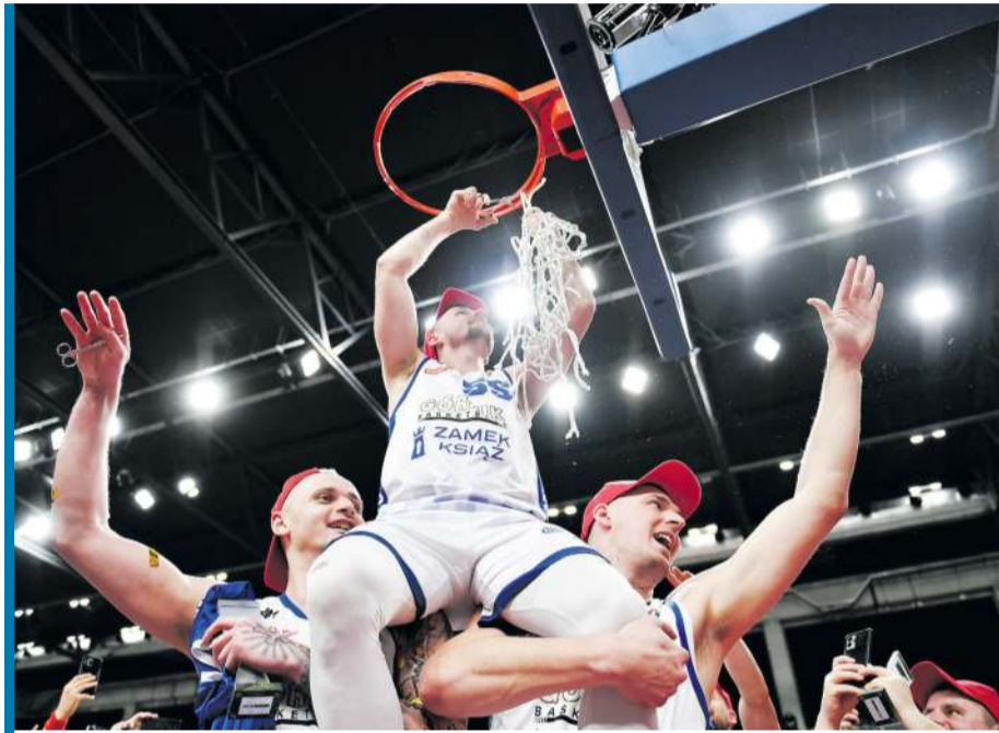
Przed rokiem krajowy puchar zdobyła oraz siatkę z kosza odcięła ekipa z Wałbrzycha.

Kogo zabraknie w Sosnowcu? Przede wszystkim Anwilu. Włocławianie - zdobywcy Pucharu Polski w 1995, 1996, 2007 i 2020 roku - celują w tym sezonie