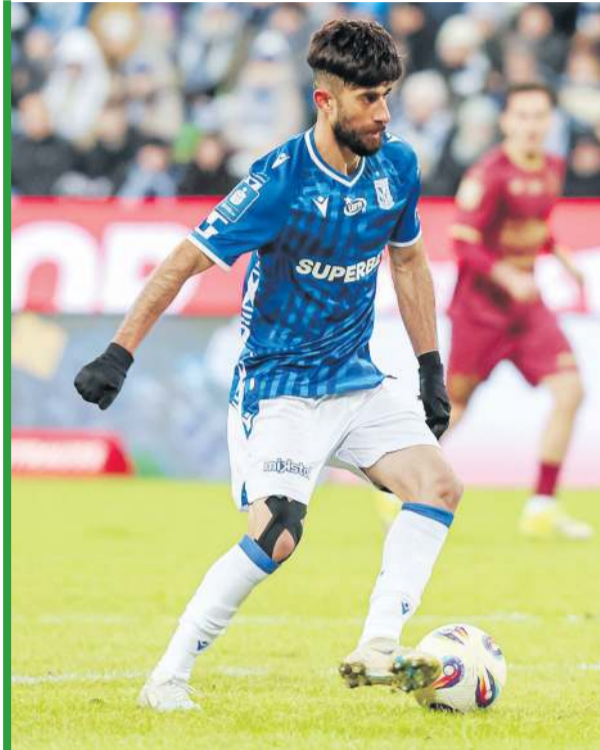
Ktoś będzie musiał się bardzo postarać, żeby zastąpić irańskiego skrzydłowego.