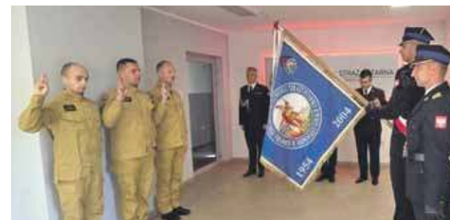
Nowi funkcjonariusze z Komendy Powiatowej Państwowej Straży Pożarnej w Tarnowskich Górach złożyli ślubowanie