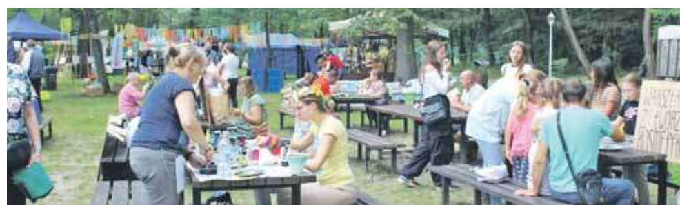
Tak się bawiono na wcześniejszej edycji Pikniku na Łączce