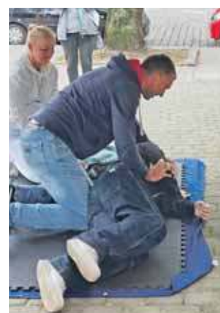
Jeden z punktów przygotował Harcerski Klub Ratowniczy

Impreza miała pokazać, że pomaganie może być przygodą, a jednocześnie świętem wspólnoty. Liczyło się poczu-