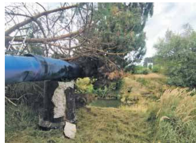
W Brynku było drzewo powalone na rurę wodociągową nad rzeką Stołą