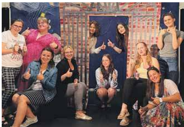
Spektakl w wykonaniu Teatru Niespasowani i Teatru TG Akt będzie można zobaczyć 4 września w TCK

Spektakl Teatralny „Zagadkowe spotkanie w TG” w wykonaniu Teatru Niespasowani i Teatru TG Akt zobaczymy w Tarnogórskim Centrum Kultury 4 września o godz. 19. Wstęp 10 zł.