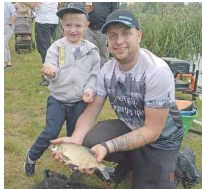
Jedną z atrakcji były rodzinne zawody wędkarskie