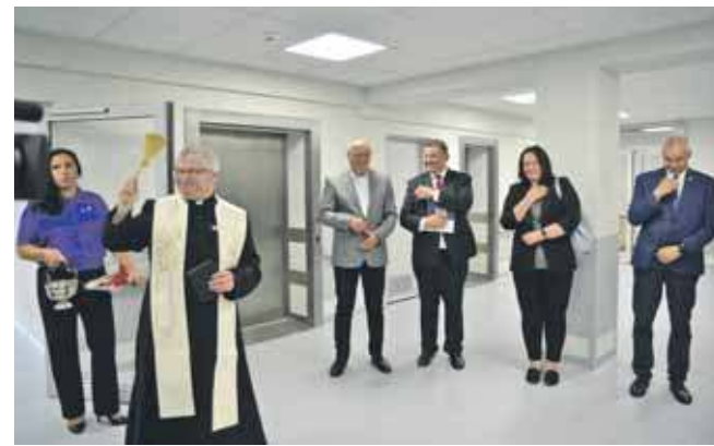
Przed rozpoczęciem remontu oddział dysponował 120 łóżkami, obecnie – 150

To dopiero początek modernizacji całego szpitala. Kolejne etapy prac będą realizowane tak, by nie zakłócały bieżącej działalności placówki. Już wkrótce rozpocznie się remont tzw. niskich pawilonów.