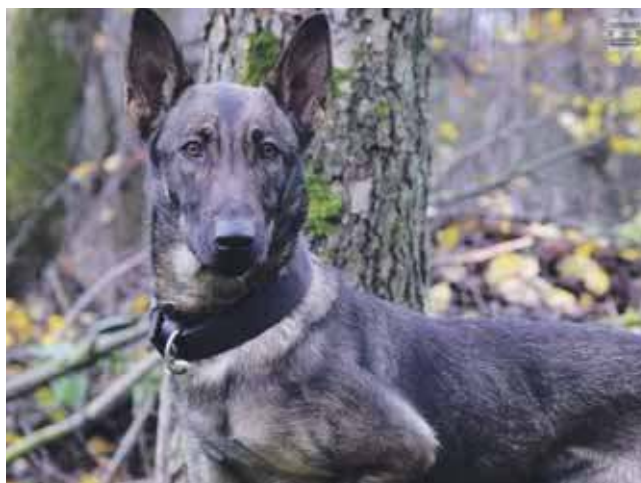
Neta jest już na emeryturze