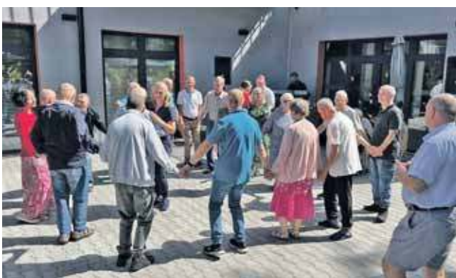
Spotkanie zgromadziło podopiecznych z domów pomocy społecznej z powiatu tarnogórskiego