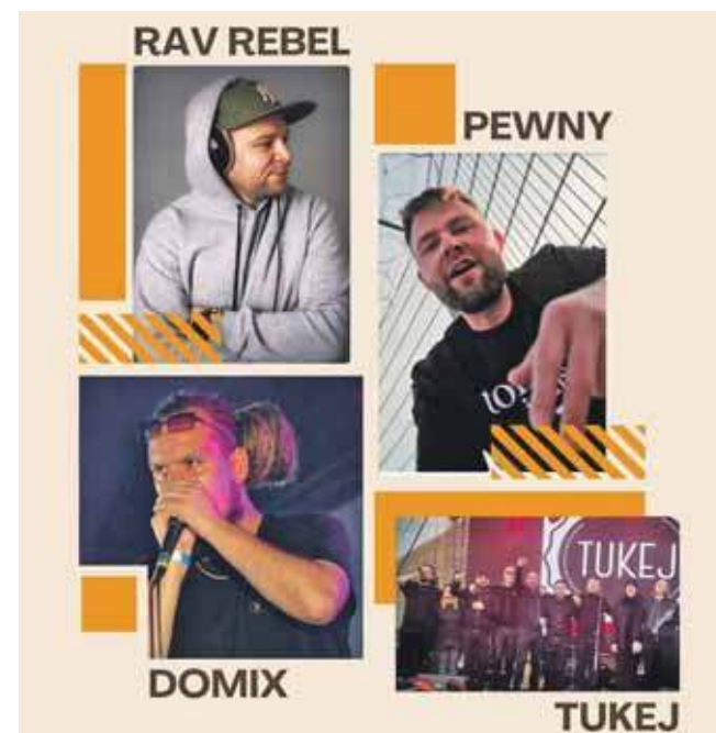
Wstęp na wydarzenie jest bezpłatny

Początek o godz. 16. Wstęp na wydarzenie jest wolny. (EKA)