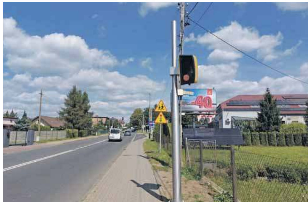
Fotoradar na ul. Korola mierzy prędkość z odległości kilkunastu metrów

Jak informuje GITD, pomiar prędkości wykonywany jest z odległości kilkunastu metrów. Ze strony kierowców i mieszkańców pada też pytanie, czy fotoradar rejestruje tylko, ile na liczniku mają pojazdy nadjeżdżające od strony Bytomia, czy też „łapie” także tych jadących z przeciwnego kierunku. Tu odpowiedź jest jasna: fotoradar nie rejestruje prędkości pojazdów oddalających się od urządzenia.