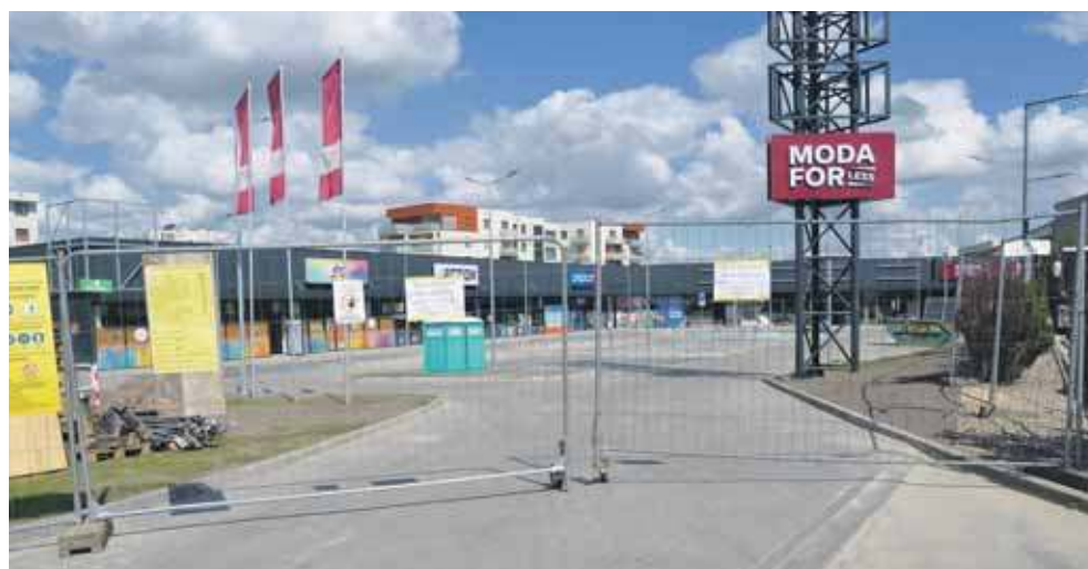
Inwestor wycofał wniosek w sprawie pozwolenia na użytkowanie obiektu