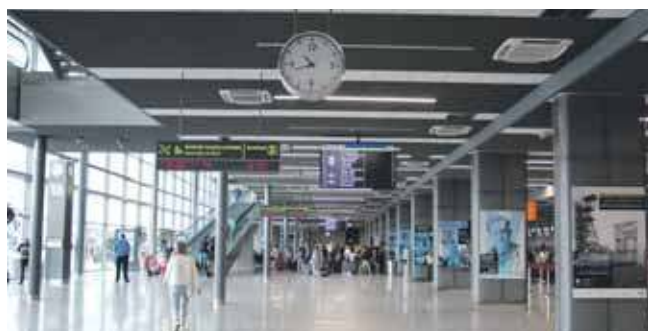
Międzynarodowy Port Lotniczy Katowice to jedno z największych regionalnych lotnisk w kraju

Prezydent Katowic oraz marszałek województwa śląskiego złożyli wniosek do Urzędu Ochrony Konkurencji i Konsumentów o zgodę na dokonanie koncentracji. Samorządy chcą przejąć kontrolę nad Górnośląskim Towarzystwem Lotniczym (GTL), spółką zarządzającą portem lotniczym.