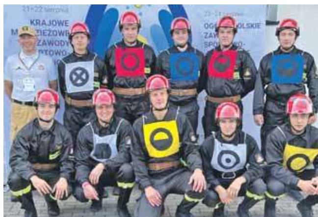
Drużyna Komendy Miejskiej PSP w Piekarach Śląskich zajęła 2. miejsce podczas Ogólnopolskich Zawodów Sportowo-Pożarniczych

Rywalizacja była zacięta, a konkurencje wymagające. Strażacy z Piekar Śląskich mieli do zaliczenia ćwiczenie bojowe i sztafetę pożarniczą 400 m z przeszkodami. (ESP)