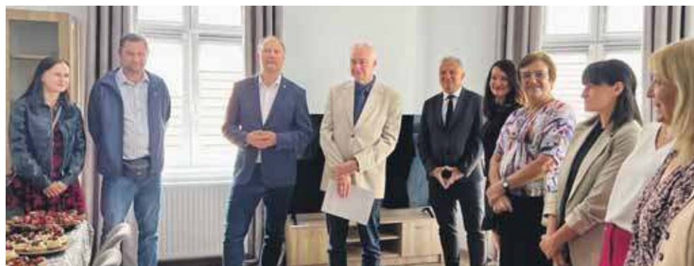
Lokal przeszedł gruntowny remont i jest dostosowany do potrzeb wielodzietnej rodziny zastępczej

Rodzinny Dom Dziecka to część większego przedsięwzięcia. W ramach projektu powstaną jeszcze dwa mieszkania treningowe dla usamodzielnianej młodzieży, będą programy szkoleń i poradnictwa dla rodzin zastępczych i wychowanków, a także diagnoza i terapia dzieci oraz działania promujące rodzicielstwo zastępcze. (ESP)