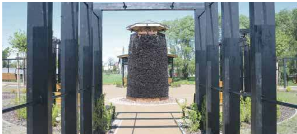
Zielona Przestrzeń w Kaletach powstała na powierzchni 3,5 tys. metrów kwadratowych, a jej sercem jest tężnia solankowa

Kalety znalazły się w gronie laureatów pierwszej edycji konkursu „Zielona Przestrzeń”, organizowanego przez Wojewódzki Fundusz Ochrony Środowiska i Gospodarki Wodnej w Katowicach. Dzięki dotacji w wysokości 183 tys. zł udało się stworzyć miejsce, które zachęca do