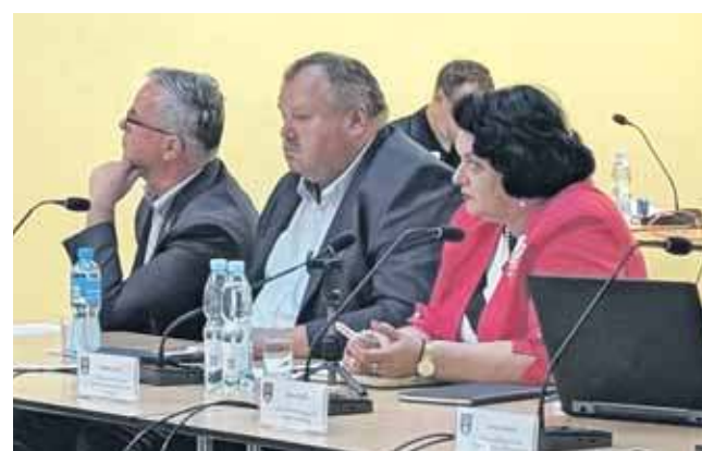
Podczas sesji powiatowej radna oświadczyła, że nie jest już członkiem rady nadzorczej

Podczas sesji radna podkreśliła, że już 26 sierpnia złożyła rezygnację z członkostwa w radzie nadzorczej. Jak powiedziała, nie uczestniczyła w żadnym posiedzeniu, RN nie podjęła też żadnych decyzji z jej udziałem.