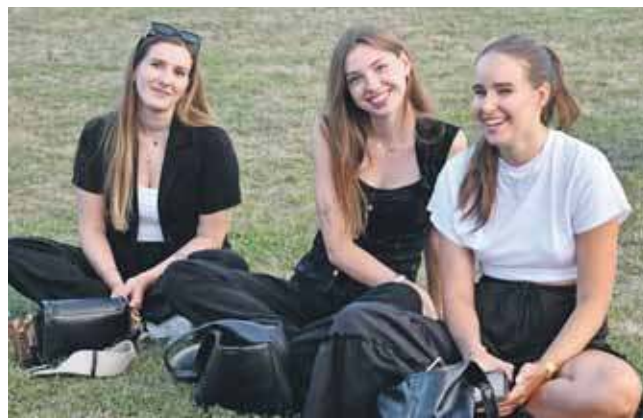
Słuchaczom humory dopisywały