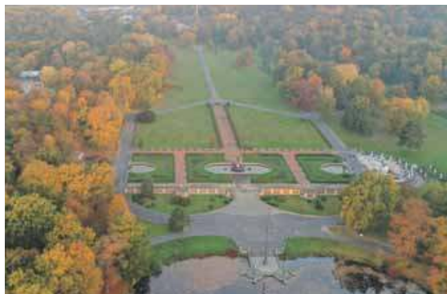
Zabytkowy park w Świerkłańcu znalazł się na prestiżowej liście 5 obiektów pretendujących do tytułu Śląskiej Lokacji Filmowej 2025

Organizatorzy gwarantują zwycięzcy reklamę, czyli dwutygodniową emisję spotu promocyjnego w kinach Kosmos i Światowid w Ka-