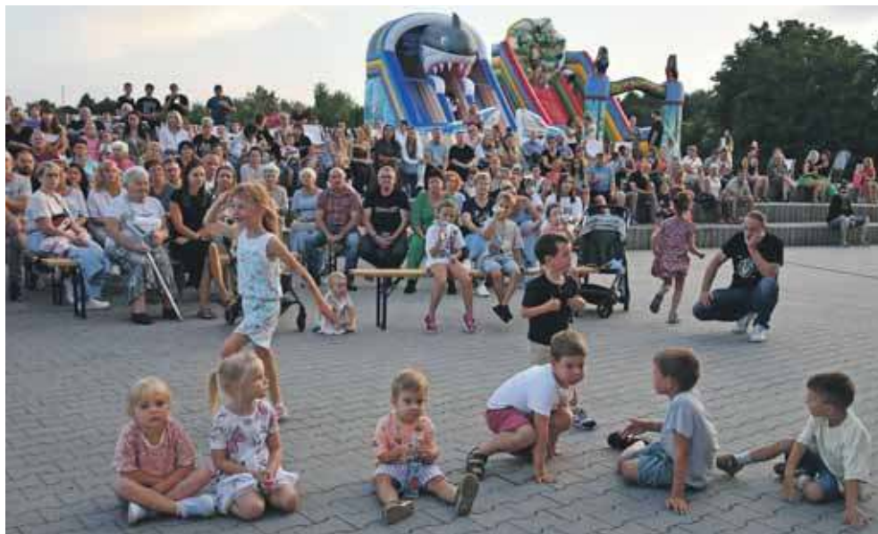
Koncertowi towarzyszyła piknikowa atmosfera