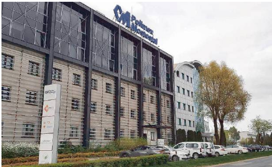
Czy w siedleckim zakładzie jest bezpiecznie?

Sekcja zwłok wykazała, że 49-letni pracownik Mostostalu Siedlce zginął w wyniku rozległych obrażeń głowy. Prokuratura prowadzi śledztwo, PIP wszczęła kontrolę, a pracownicy i opinia publiczna pytają wprost: czy bezpieczeństwo w jednej z największych siedleckich firm faktycznie stoi na wysokim poziomie?