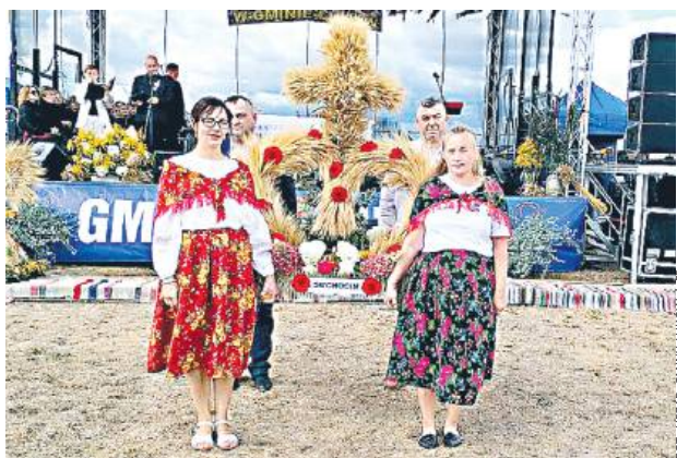
W konkursie na najpiękniejszy wieniec pierwsze miejsce zdobyły Kownatki, drugie Suchocin, a trzecie - Grzędówka.

Wystąpiły także grupy Modem i Szwajcar Band, a dzień zakończyła zabawa z DJ-em.