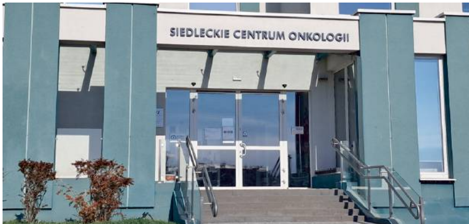
Siedleckie Centrum Onkologii pokazuje, że ludzkie dobro nadal istnieje.

Za namową naszej czytelniczki wybieram się na siedlecką onkologię. Jestem gotowa na chłodne rozmowy, skrupowa-