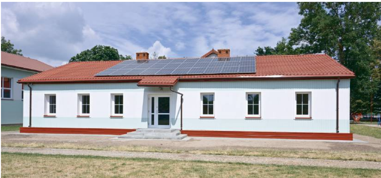
Remont zabytkowej części Szkoły Podstawowej w Nowej Wsi nie był zwykły.

Zakończono remont zabytkowej części Szkoły Podstawowej w Nowej Wsi - i to szybciej, niż planowano. Za kilka dni uczniowie wrócą do odnowionych sal, które będą im służyć w codziennej nauce.