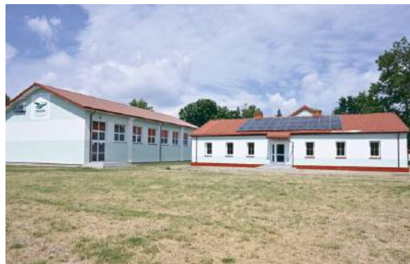
Uczniowie zyskali przestrzeń odpowiadającą wymaganiom.

Szkoła Podstawowa w Nowej Wsi jest placówką, w której