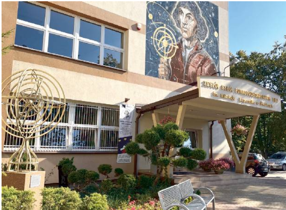
W tym roku szkoła świętuje stulecie istnienia, a wraz z nim odbędzie się VI Zjazd Absolwentów.