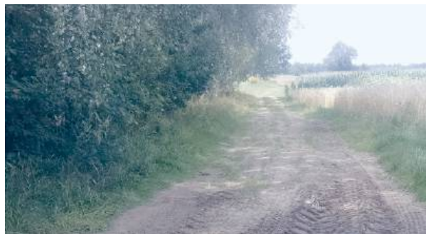
Tak wyglądają drogi w Dybowie.

Jak komentują, obecnie rzeczywiście niewiele już da się zrobić. Pytają więc: - Ale może dałoby się skierować te pieniądze na cele niewymagające dokumen-