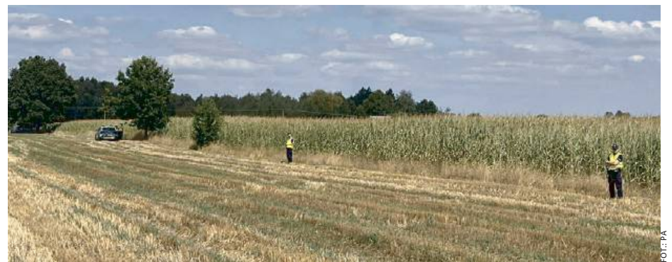
Wybuch miał miejsce około północy.

– Obudziłam partnera, wyrzeliśmy przez okno, ale przez