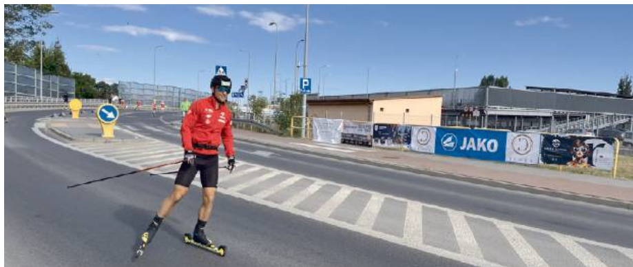
Centrum przesiadkowe stało się sercem imprezy.

Pierwszy etap za nami, a przed biegaczami kolejne odsłony – między innymi w Tomaszowie Lubelskim, Jakuszycach, Ptaszkowej czy Białymstoku.