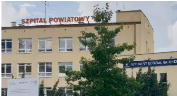
Kolejny atak na pracownika ochrony zdrowia, tym razem w SPZOZ w Mińsku Mazowieckim.

Prezydium zaapelowało do minister zdrowia Jolanty Sobeirańskiej-Grendy, wyrażając stanowczy sprzeciw wobec rosnącej fali agresji wobec pracowników ochrony zdrowia. Pielę-