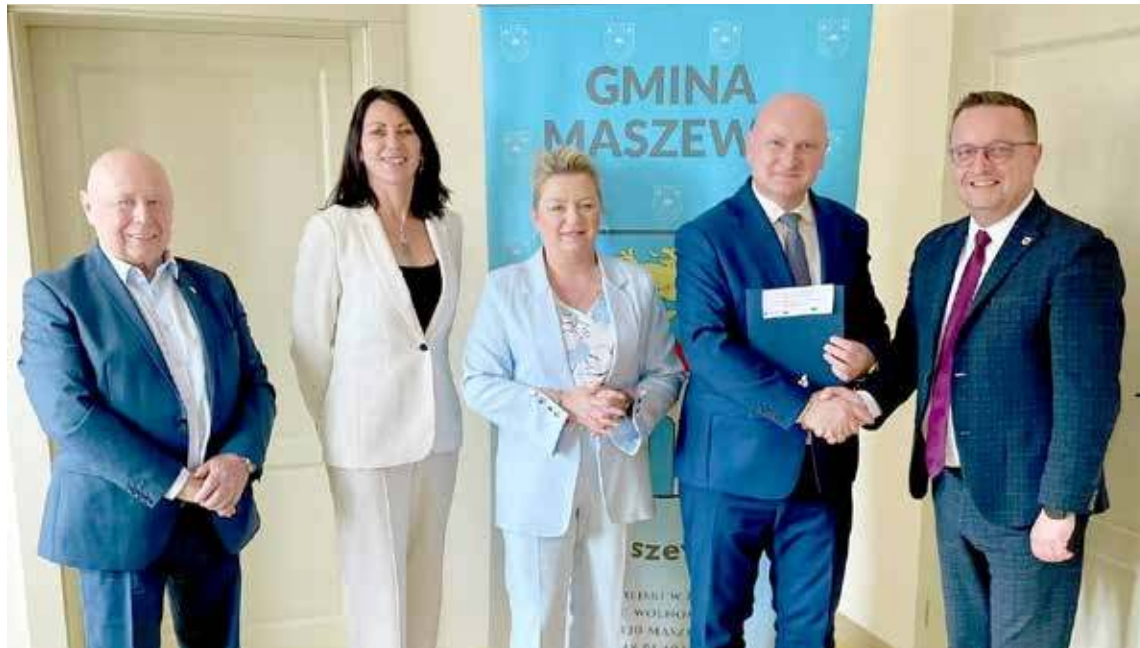
Umowa o dofinansowanie została podpisana