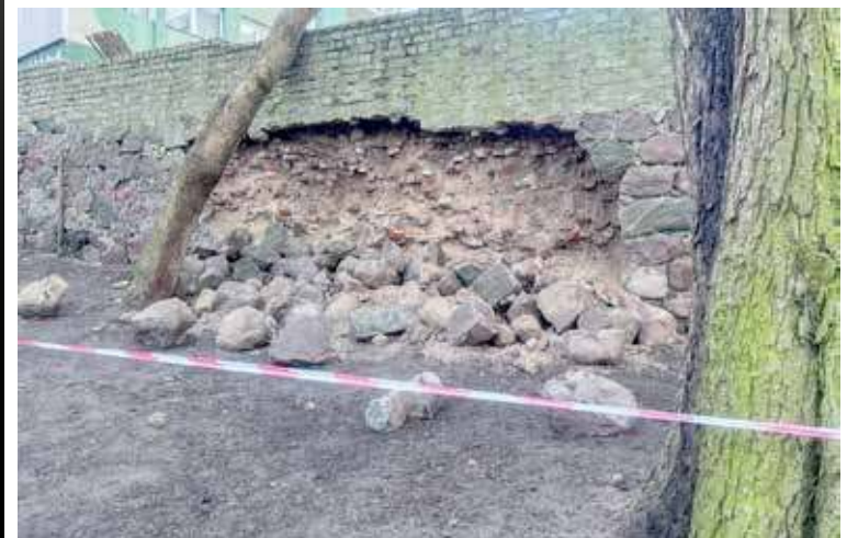
Uszkodzony mur obronny w końcu doczeka się naprawy

Fragment zabytkowych murów obronnych, który zawalił się w styczniu ubiegłego roku może doczekać się naprawy. Gmina podpisała umowę w wykonawcą wyłonionym w przetargu. Naprawa muru to koszt ponad miliona złotych.