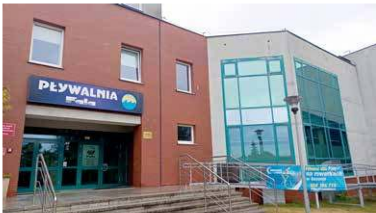
Basen Fala czeka modernizacja

Jego stan jednak pozostawia coraz więcej do życzenia. Lata użytkowania odcisnęły na nim swoje piętno. W trakcie swojego istnienia nie były tam prowadzone porządne prace modernizacyjne i to widać. Szczególnie z tyłu budynku, gdzie w elewacji można