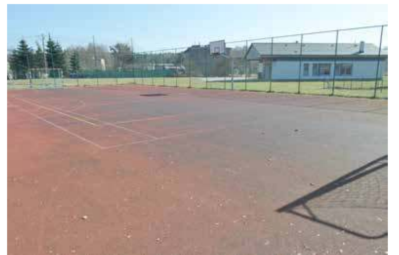
Boisko w Łące