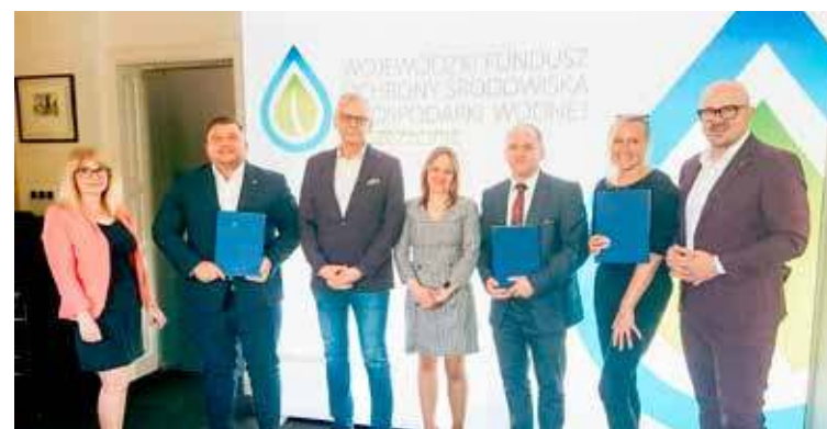
Podpisanie umów

Z danych, które Fundusz uzyskał od gmin, na terenie województwa istnieje co najmniej dwa tysiące trzysta budynków wielorodzinnych w miejscowościach popegeerowskich. Program termomodernizacyjny