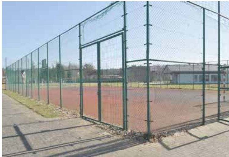
Wymagana jest m.in. wymiana piłkochwyłów

W marcu br. Gmina Stepnica złożyła wniosek do Urzędu Marszałkowskiego Województwa Zachodniopomorskiego na modernizacji dwóch boisk wielofunkcyjnych. Są one położone w Racimierzu oraz Łące. Mają one już swoje lata, zostały wybudowane odpowiednio szesnaście i czternaście lat temu. Przez ten okres były jednymi z najczęściej użytkowanych obiektów tego typu w Gminie. Oczywiście taka eksploatacja sprawiła, że konieczny jest ich remont. Planuje się m.in. uzupełnienie ubytków, wykonanie nowej nawierzchni, malowanie linii, zabezpieczenie krawędzi kostką betonową oraz naprawy ogrodzenia i piłkochwyłów. Celem prac jest poprawa bezpieczeństwa, estetyki i funkcjonalności obiektów, które służą lokalnej społeczności – zarówno dzieciom i młodzieży podczas zajęć szkolnych, jak i mieszkańcom