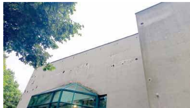
Stan budynku jest zły, co szczególnie widać na elewacji