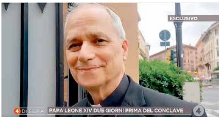
Kadr z nagrania wywiadu a pod nim podpis w języku włoskim - Papież Leon XIV na dwa dni przed Conclave

Kardynał Robert Prevost: Wszystko w rękach Ducha Świętego.