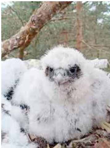
Piskle sokoła wędrownego

Odnalezione pisklęta są w bardzo dobrej kondycji. Fakt ten daje wskazówkę o warunkach sprzyjających rozwojowi tego gatunku. Każdy z nich został zaobrączkowany co umożliwi specjalistom śledzenie ich losów. Pozyskane dzięki tej obserwacji