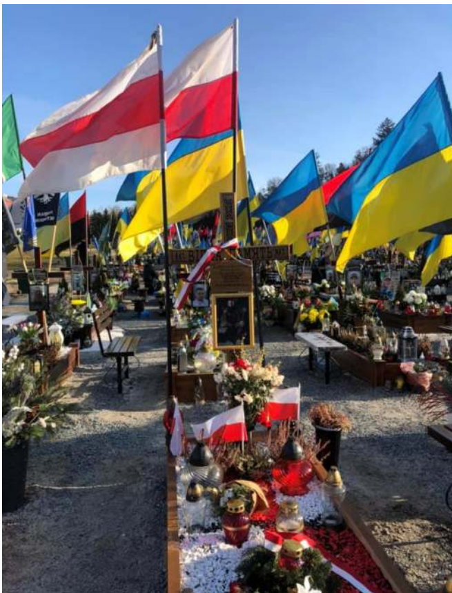
Марсове поле: поруч польські і українські прапори

– Він приходиться на похорони воїнів дуже часто, – чую від людей. Після молитви військові виносять труни. Хлопці будуть поховані на Марсовому полі біля Личаківського цвинтаря. У храмі увагу привертають стенди із сотнями фотографій. Це ті, хто загинув, боронячи Україну та внаслідок обстрілів ракетами чи артилерією, після атак дронів. Там фотографії дорослих чоловіків і жінок, дівчат і хлопців, людей похилого віку. Ще більше сліз на-