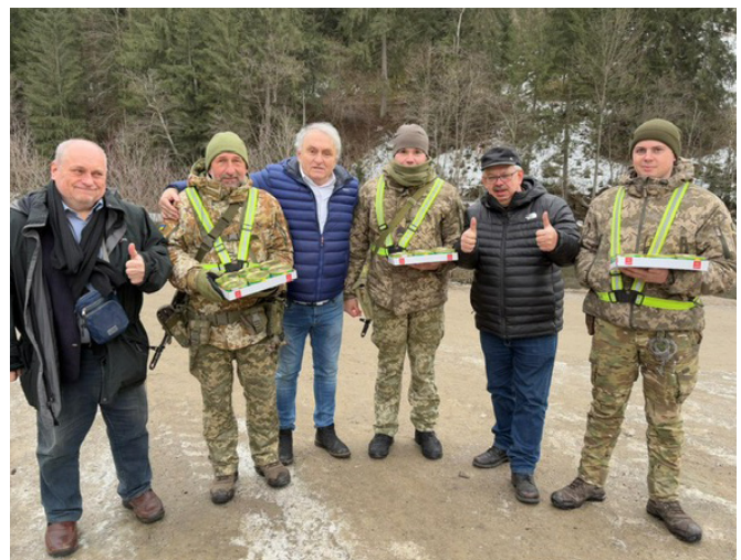
На прикордонній заставі в Карпатах