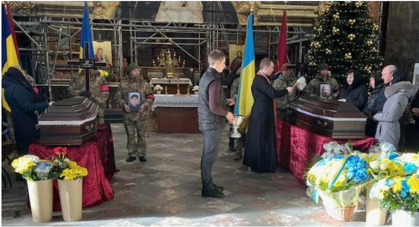
Похорон двох героїв-ровесників Михайлів

постачає гуманітарну допомогу з Карітасу Ольштинсько-Гданської єпархії УГКЦ та інші.