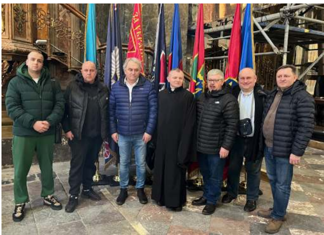
Учасники поїздки, львівські благодійники і священники у гарнізонному храмі

Ще більш прикро, і саме війна це показує, коли доводиться чути про сотні корупціонерів, які наживаються на горі, колаборантів і зрадників, що вбивають таких людей, як Ірина Фаріон, атакують воїнів у відпустках, а також військових, що зазнали травм, підпалюють їм хати або авто. І це часто молоді люди, іноді навіть неповнолітні, які чинять злочини за каїнові долари, отримані від російських ФСБ-шників. А ще є ухлянти, котрі готові заплатити й по кільканадцять тисяч доларів, щоб лише не йти на фронт. Від деяких з них, що опинилися поза межами краю, доводиться іноді почути: «Ето не моя вайна». Напевно, саме ухлянти назвали військових, які зобов'язані шукати нових воїнів для фронту, «людоловами». І про ждунів не варто забувати. Це ті, хто чекає, чия візьме – того й підтримають. Їм байдужа Україна як незалежна цивілізована держава, українська мова: «Что ето за разница, на каком языке разговаривать...» Ця війна все-таки різниться від всіх попередніх. До бою ще 2014 року, коли армії як такої не було, стали українські добровольці й тоді не дали московській орді охопити усієї України «руським міром». Від побаченого й почутого жевріє десь в глибині оптимістичне переконання, що українці не піддадуться і будуть боротися до останнього. Бо хто хоче стати рабом нелюдів XXI століття? Саме про це повинні значно рішучіше подумати і європейці, й американці. Українці вже 11 років проливають кров також за них. ●