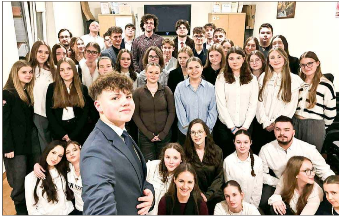
W styczniu zorganizowane zostało walne zebranie połączone z wyborami nowego zarządu KSM w Straszęcinie.