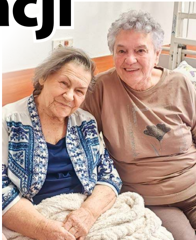
Pacjentki rehabilitacji nie wyobrażają sobie likwidacji oddziału.