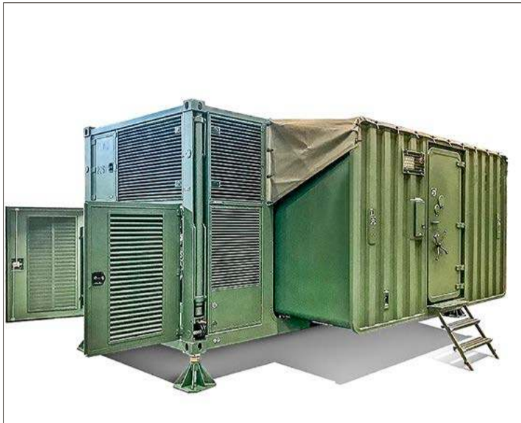
Kontener operacyjny MSN produkowany w Pex-Defence zapewnia możliwość przetwarzania danych do poziomu NATO SECRET.

- Obowiązuje też zasada warunkowości jak przy KPO, no i co się