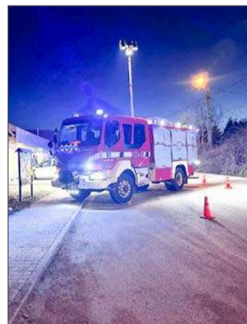
Kierująca motorowerem trafiła do szpitala w Dębicy.