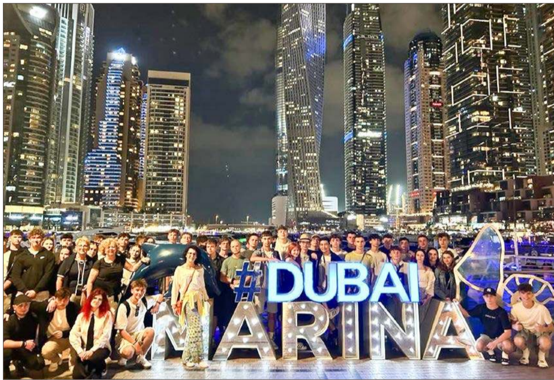
Młodzież z Kwiatka odwiedziła Dubaj już w zeszłym roku.

- Czego my się mamy tak naprawdę obawiać? Przecież mieszkamy na Podkarpaciu, więc wojnę mamy tuż obok siebie, na Ukrainie, od czterech lat. A ludzie i tak cały czas na wycieczki jeżdżą. Moja ko-