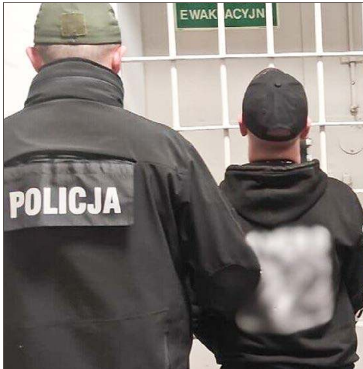
W naszym powiecie zatrzymanych zostało 11 osób.

Efekt akcji to zatrzymanie 11 osób, w tym cudzoziemców.