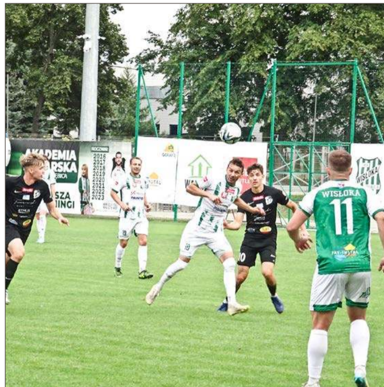
Wisłoka nie zrewanżowała się Podlasiu za sierpniową porażkę u siebie.