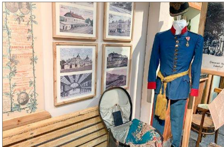
Zobaczyć można m.in. dokumenty, zdjęcia, kolejarskie mundury.

- Jest tym elementem niezrealizowanego marzenia, podobnie jak linia w kierunku Jasła, która też była projektowana, planowana, ale nigdy nie doszła do skutku. Byłby to element, dzięki któremu Dębi-