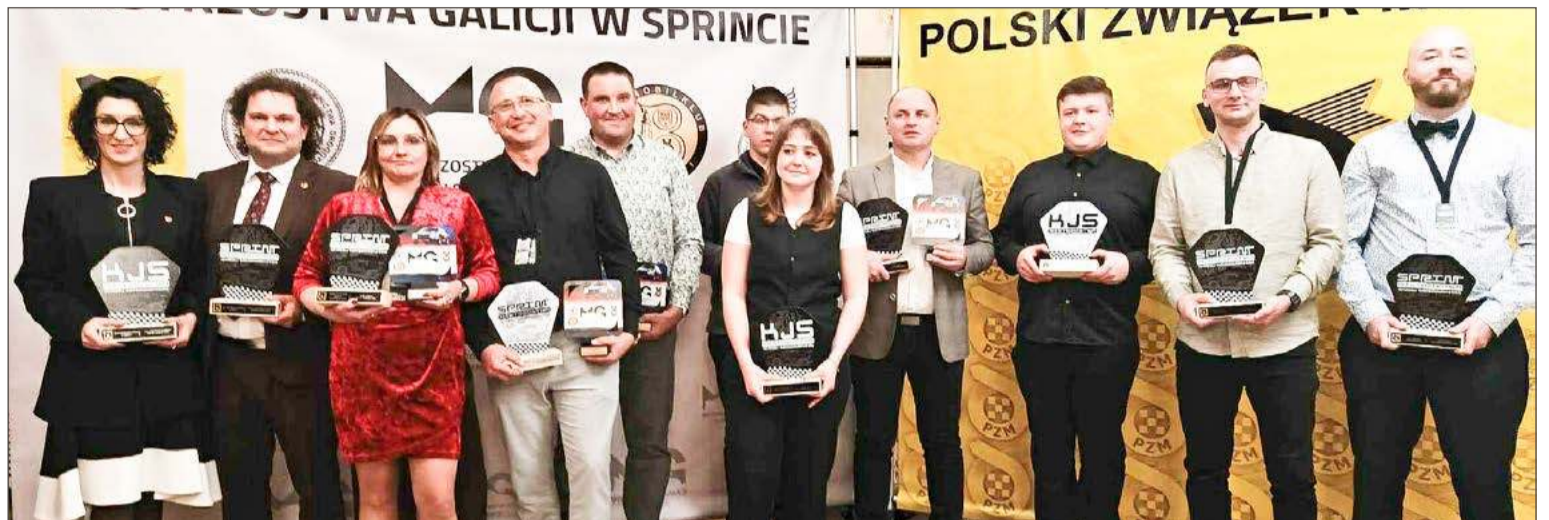
Statuetek za pierwsze miejsca w generalce i poszczególnych klasach dla kierowców Automobilklubu Stomil Dębica było aż jedenaście.