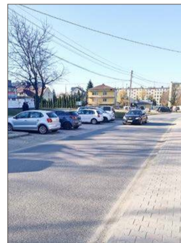
Nowe przejście miałyby powstać na tej wysokości.

Dyrektor twierdzi, że na tym odcinku, szczególnie w godzinach rannych, kiedy jedne dzieci idą, a inne są odwożone przez rodziców do szkoły, już dziś tworzą się spore korki. A gdyby wyznaczyć tam jeszcze jedno przejście dla pieszych to ruch mógłby zostać całkowicie sparaliżowany. Obiecuje jednak jeszcze raz się temu przyjrzeć, jak tylko otrzyma wniosek.