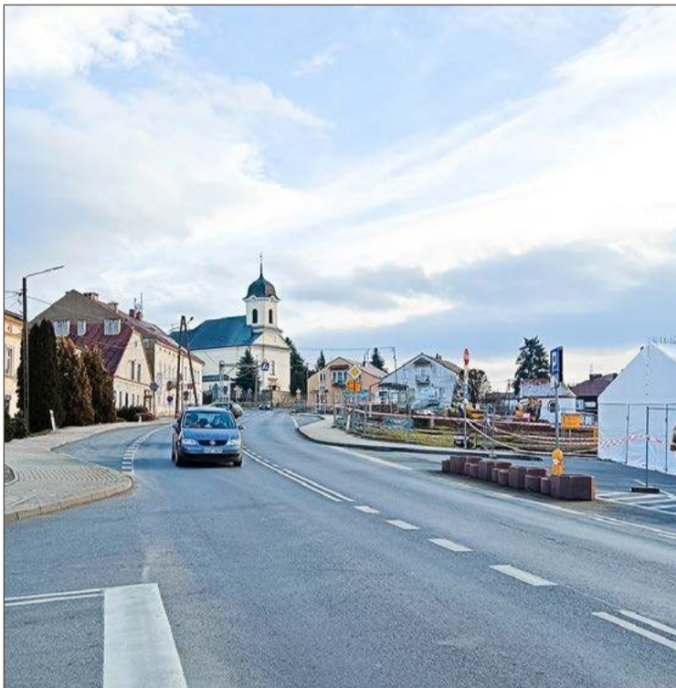
Budowa obwodnicy pozwoli wyprowadzić ruch z centrum Brzostku.

O konieczności budowy obwodnicy Brzostku mówi się od dawna. Kilka lat temu zadanie zostało włączone do projektu Prawa i Sprawie-