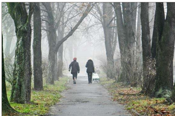
Do pobicia doszło na alejce prowadzącej do ul. Strumskiego.

Po wizycie w szpitalu nastolatek udał się do domu swojego wujka, gdzie poczekał na przyjazd mamy. Ta zjawiła się chwilę później i za-