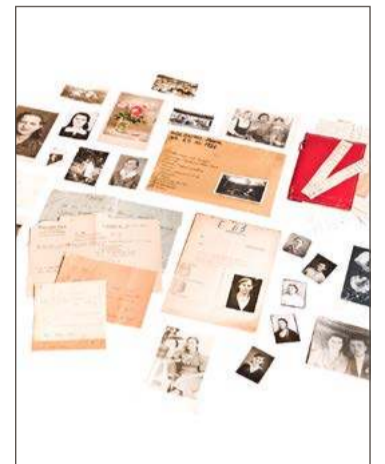
Na wystawie prezentowane są rzeczy osobiste więźniów.

Krewni wypowiadają się w materiałach wideo, do których można