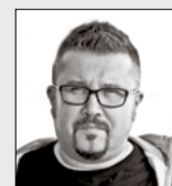
ratuszniak@ol.com.pl tel. 14 670 27 80