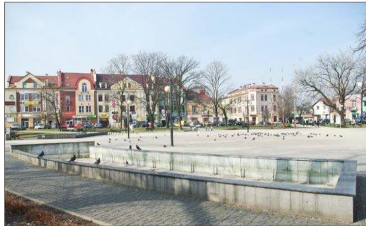
Jeśli tempo spadku liczby ludności się utrzyma, to za 25 lat w Dębicy będzie niewiele ponad 30 tysięcy osób.

Drugim powodem wskazanym przez burmistrza jest emigracja zarobkowa po otwarciu się zagranicznych rynków, zwłaszcza po