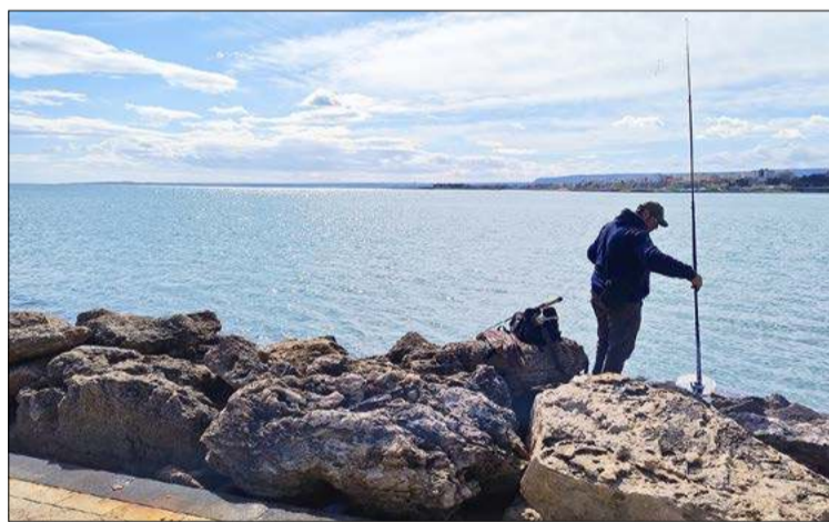
A może by tak na ryby?