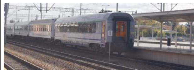
To duże ułatwienie dla podróżujących.

Od 5 czerwca działa kasa biletowa na przystanku Siedlce Zachodnie. Bilety będzie można zakupić od poniedziałku do piątku w godz. 5:20–15:10 w pomieszczeniu przy wejściu na peron 1. PA