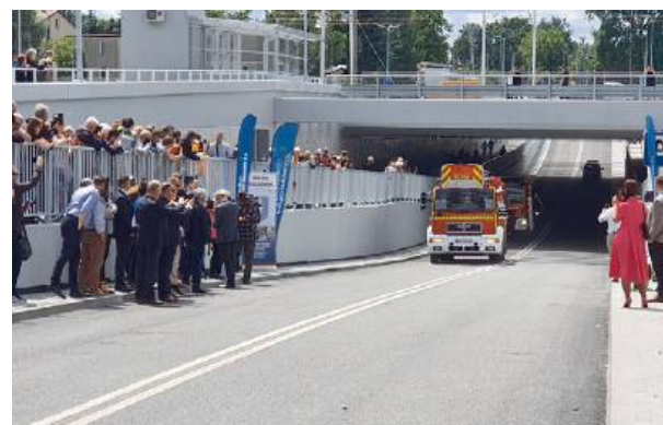
Nowy tunel to kolejna istotna modernizacja infrastrukturalna.

To kolejna istotna modernizacja infrastrukturalna w mieście – w listopadzie 2023 r. oddano tunel drogowy pod torami przy ul. Piłsudskiego (droga wojewódzka nr 638) o długości ponad 90 m. Nową inwestycję, która zastąpiła dotychczasowy przejazd kolejowo-drogowy przy ul. Krasieńskiego, zrealizowano w 15 miesięcy. Tunel ma także 90 m i całkowicie zastąpił