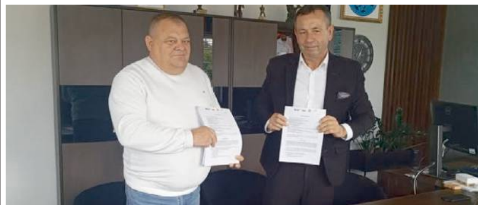
Podpisane umowy to początek renowacji kapliczek

Termin realizacji wszystkich zadań wynosi 11 miesięcy od dnia podpisania umów, co oznacza, że już za rok w gminie zabyśnie odnowa historyczna, - Przed nami ważny etap prac, który pozwoli nie tylko zabezpieczyć historyczne obiekty, ale również przywrócić im dawny blask – z poszanowaniem ich wartości kulturowej i religijnej - komentuje dumnie Urząd Gminy Bielany. RED