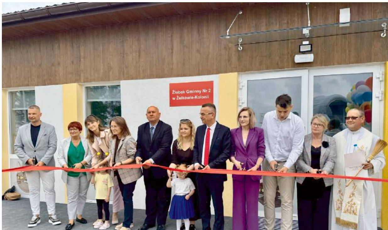
Uroczyste przecięcie wstęgi to początek historii tego miejsca

- Zapewnienie tak wysokiej jakości infrastruktury opiekuńczej i edukacyjnej jest kluczowe dla aktywizacji zawodowej rodziców oraz stymulowania lokalnego wzrostu. Mamy świadomość, że inwestując w rozwój najmłodszych, inwestujemy w przyszłość całej społeczności. A rodziny z naszej gminy również z tej inwestycji będą korzystać, dlatego tym bardziej