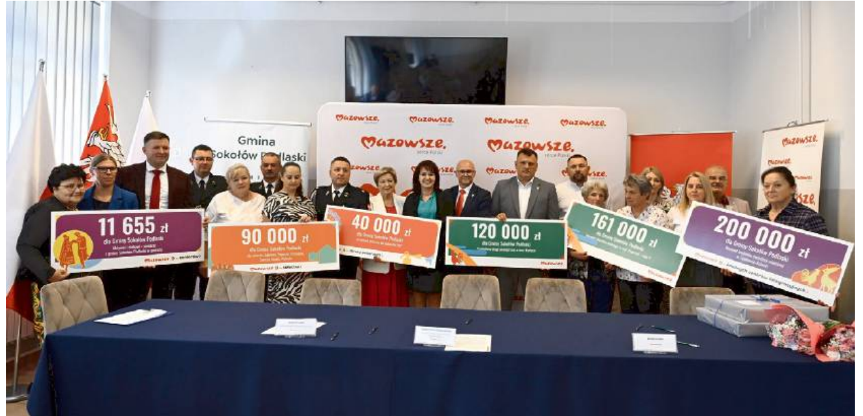
Przyznane dotacje pozwolą na rozwój gminy inwestycyjnie i strategicznie

Istotnym elementem pakietu inwestycji jest również poprawa zaplecza dla strażaków ochotników. W Przywózkach, w ramach programu „Mazowieckie Strażnice OSP”, zostanie przeprowadzona modernizacja strażnicy za kwotę 40 000 zł. To inwestycja w lepsze warunki codziennego funkcjonowania jednostki, a tym samym w sprawność i gotowość druhow. Kolejnym projektem jest realizacja wyjazdowego