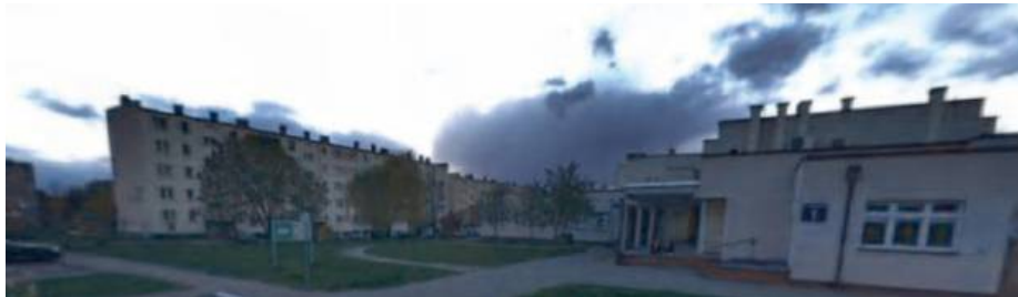
Z pomocy będą mogli skorzystać osoby w nagłych przypadkach bólowych.

Przez długi czas w Siedlcach brakowało punktu, w którym można byłoby uzyskać nagłą pomoc stomatologiczną w godzinach wieczornych, nocnych oraz w dni wolne od pracy. Teraz sytuacja ulegnie zmianie. Na