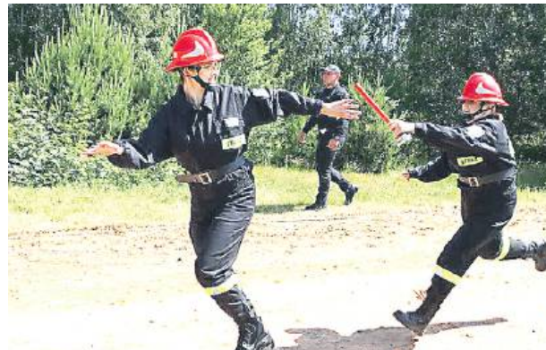
W zawodach wystartowało 21 drużyn męskich oraz 7 drużyn żeńskich.

W zawodach startowało 21 drużyn męskich oraz 7 drużyn żeńskich. W zawodach startowało 21 drużyn męskich oraz 7 drużyn żeńskich. W generalnej klasyfikacji w grupie męskiej najlepiej wypadły OSP Zemby przed OSP Trzebieszów i OSP Świdarki. W grupie kobiecej na podium stanęły drużyny z OSP Świdarki, OSP Ksawerynow i OSP Szczygły Górne.