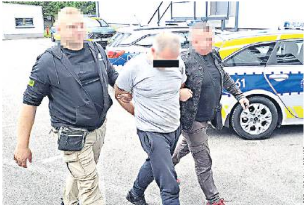
44-letni mężczyzna uprawiał ponad 100 roślin konopi. Największe z nich miały ponad metr wysokości.

44-letni łukowianin został zatrzymany za uprawę konopi i posiadanie środków odurzających.