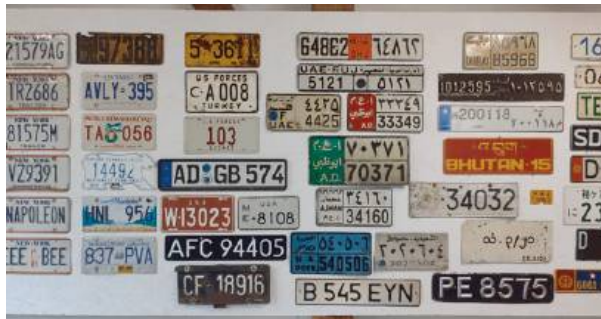
Wśród eksponatów znajdują się prawdziwe perełki.

potrzebom rosnącej kolekcji i odwiedzających.