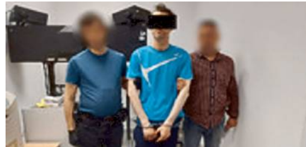
Mężczyzna śledził nastolatki w drodze do szkoły i zaczepiał je.

Szybka identyfikacja sprawcy Do policjantów wpłynęło kil-