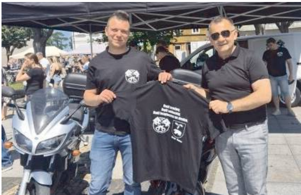
Motocykle znów zawitały do Węgrowa

Złot w Węgrowie potwierdza, że motocykliści to nie tylko pasjonaci szybkiej jazdy, ale także społeczność, która dba o bezpieczeństwo i wspólne wartości. Organizatorzy zapowiadają kontynuację wydarzenia w przyszłości. ID