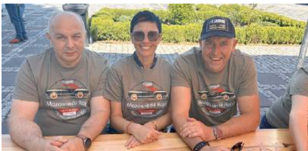
Trzy dni motoryzacyjnej przygody.