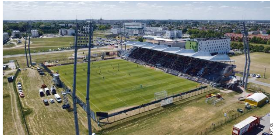
Czy to poważny kryzys w sercu siedleckiego sportu?

Co dalej? Nie wiadomo. Klub nie komentuje. Nie wiadomo, czy zarząd rzeczywiście podał się do dymisji, nie wiadomo, kto dziś odpowiada za funkcyj-