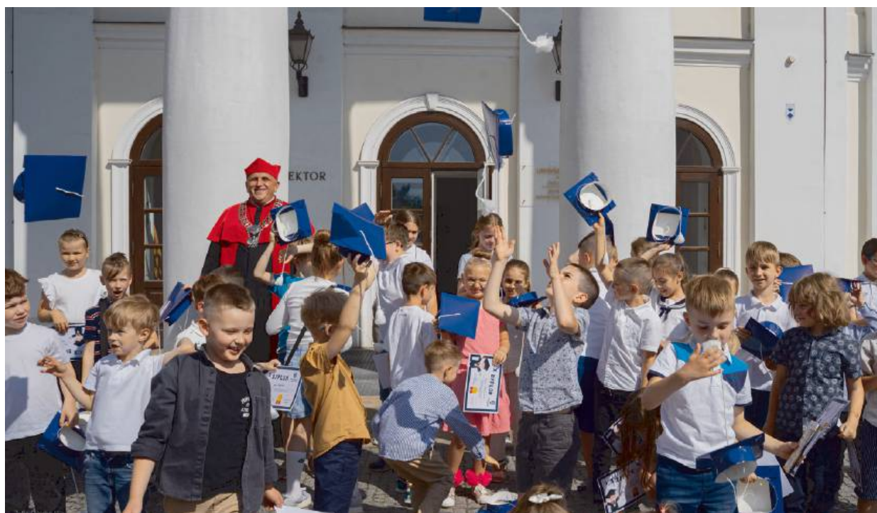
Uniwersytet Dziecięcy to inicjatywa, która od lat cieszy się ogromnym zainteresowaniem wśród najmłodszych mieszkańców regionu.

To inicjatywa uniwersytecka, która od lat cieszy się ogromnym zainteresowaniem wśród najmłodszych mieszkańców regionu i ich rodziców. Kolejny raz udało się stworzyć przestrzeń, w której dzieci mogą rozwijać naturalną ciekawość świata, uczestniczyć w interesujących zajęciach i poznawać