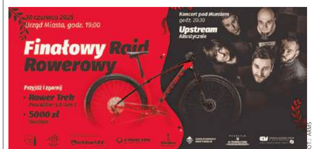
Na uczestników czeka muzyczna niespodzianka.

Warunek: przejechanie minimum 500 km do 29 czerwca. To świetna okazja, by aktywnie zakończyć miesiąc, podsumować sportowe zaangażowanie siedlczan i wspólnie świętować sukcesy miasta. PA