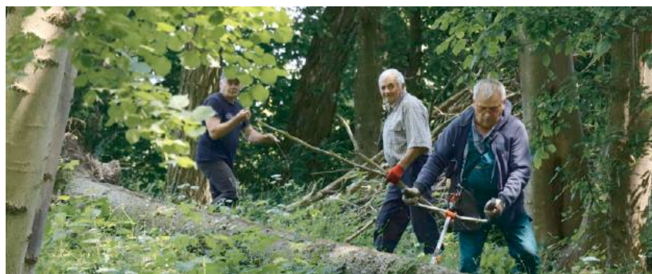
Wspólne działanie pozwoliło przywrócić zachęcający wygląd perełki gminnej

Każda „Sobota w Parku” to nie tylko czas spędzony na pracy, ale również okazja do integracji, wymiany uśmiechów i budowania silniejszych więzi sąsiedzkich. Widok całych rodzin, wspólnie pracujących na rzecz parku, jest niezwykle budujący i inspirujący. RED