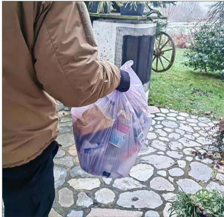
Kwota 20 zł miesięcznie to opłata za śmieci segregowane.