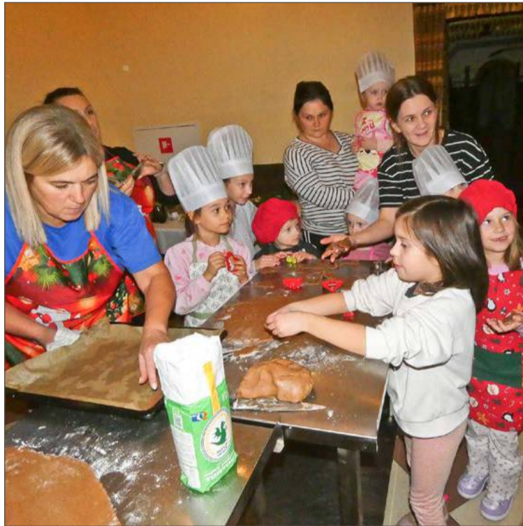
Najwięcej radości z przygotowywania pierników mieli najmłodszy.

- Stygną też bardzo szybko, zaraz można je dekorować. Dziewczyny tam już pieką ciastka, żeby były go-