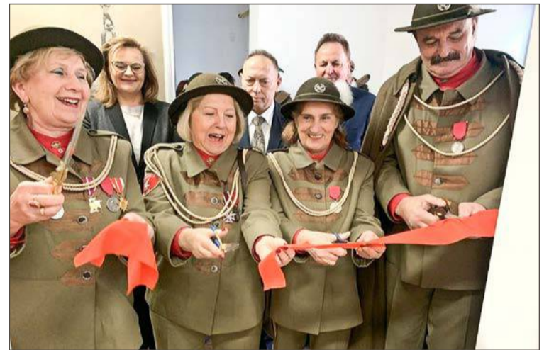
Otwarcia izby dokonali m.in. członkowie zarządu TG Sokół.