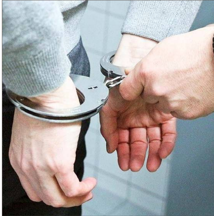
Mieszkaniec gminy Pilzno może spędzić wiele lat w więzieniu.

I dodaje, że z uwagi na grożącą podejrzanemu surową karę, a także istniejącą obawę ukrywania się, ucieczki oraz możliwość bezprawnego wpływania na zeznania