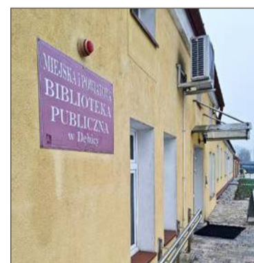
Budynek powstał pomiędzy 1881 a 1885 rokiem.

A nawet gdyby tak się stało, to w trakcie wykonywania jest obecnie dokumentacja na remont galerii sztuki, która według burmistrza bardziej tego wymaga, niż sąsiadująca z nią siedziba biblioteki. I to o dofinansowanie na nią starać się będzie miasto. Biblioteka będzie musiała jeszcze poczekać.