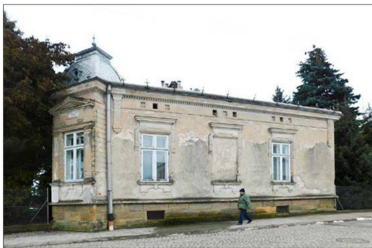
Przebudowa zabytkowej willi Szczeklików ma kosztować 165 000 zł.

1 414 542 zł pochłonie rozbudowa gminnej sieci wodociągowej, a 300 000 zł sieci kanalizacji sanitarnej. Przy punkcie dotyczącym budowy miasteczka rowerowego i muszli koncertowej w Parku Sokoła w Pilźnie znajdziemy kwotę 820 000 zł. 286 000 zł dołoży gmina do prac remontowo-konserwatorskich przy zabytkowych budynkach. Rekutywacja składowiska