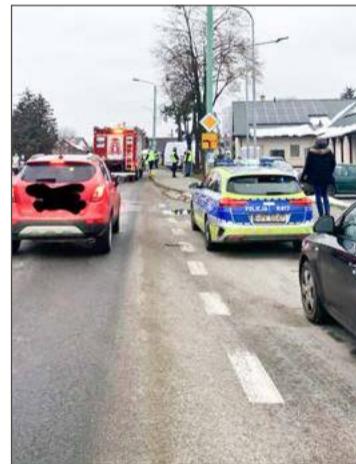
Na drodze występowały utrudnienia.