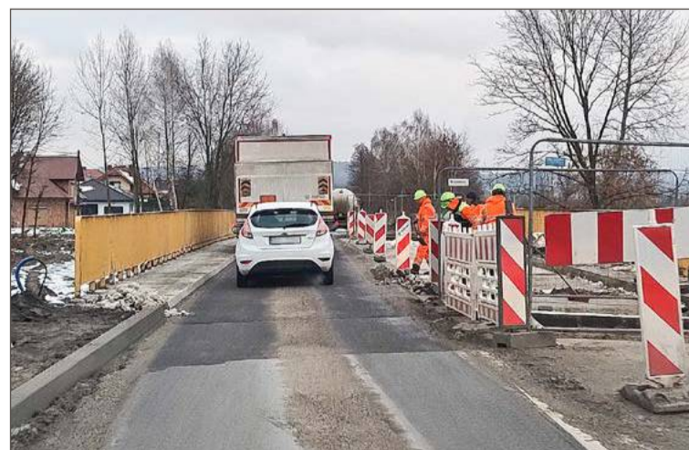
Przy moście na Grabiniance w Straszęcinie cały czas uwijają się robotnicy.