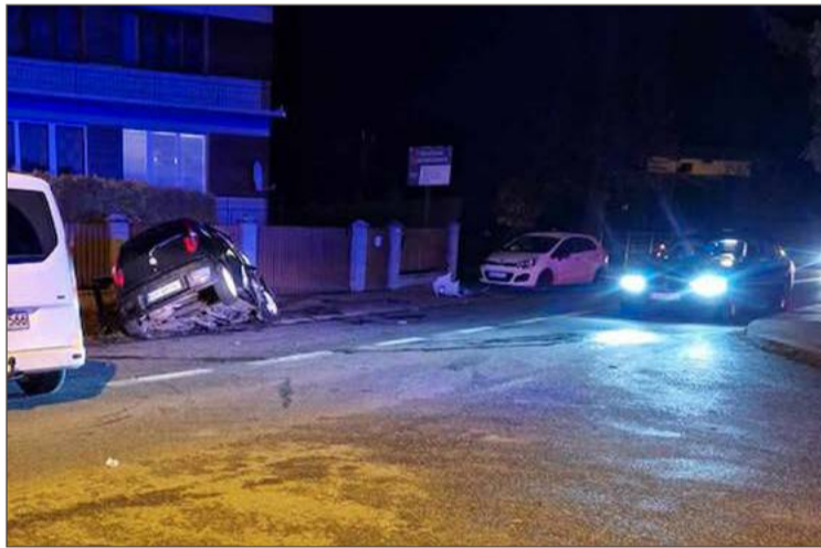
Niedawno na tym skrzyżowaniu doszło do wypadku.

I wyjaśnia, że w takiej sytuacji administrator może przystąpić do zmiany organizacji ruchu w takim miejscu: umieścić znaki lub postawić lustro.