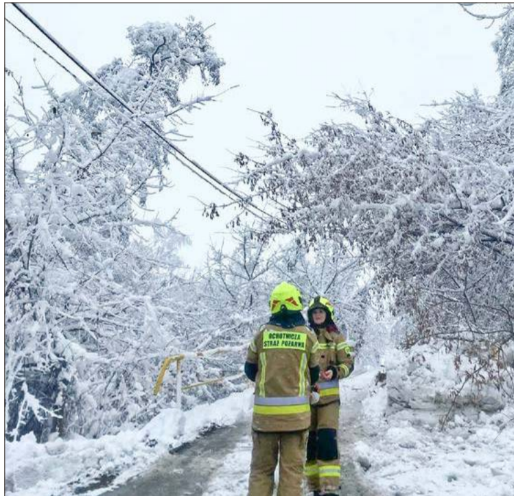
Spadające konary uszkadzały linie energetyczne w całym powiecie. Strażacy nie nadążali z usuwaniem powalonych drzew.

Rzeczniczka Tauronu wyjaśnia, że to właśnie pracownicy firmy prowadzą regularne prace przyrównawcze i wycinkowe w pobliżu infrastruktury, które zapobiegają zagrożeniom dla sieci energetycznych i ludzi.