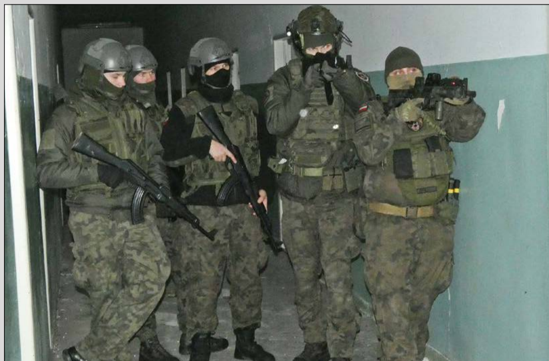
Uczniowie czwartej klasy Oddziału Przygotowania Wojskowego w ZSZ w Pustkowie-Osiedlu uczestniczyli w 40-godzinym obozie szkoleniowym, podczas którego nabywali praktycznych umiejętności m.in. z czarnej taktyki, czyli sposobu prowadzenia walki w budynkach. Zajęcia pod kierownictwem kpt. Edyty Selwy, dowódcy 331. kompanii lekkiej piechoty w Dębicy, realizowane były w Gębiczynie i w Dębicy, gdzie na ich potrzeby wykorzystany został opuszczony budynek przy ul. Metalowców 25.