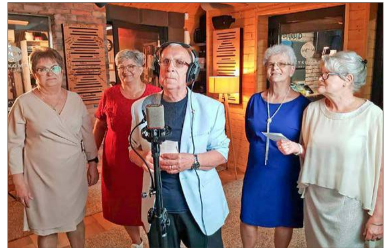
Seniorzy na planie dali z siebie wszystko. I zdobyli nagrodę.