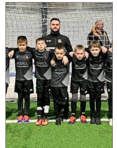
Orliki ze Stasiówki na Słowacji dały z siebie wszystko.

Policjanci dostali zgłoszenie o kolizji samochodu osobowego z sarną. Ale zanim dotarli na miejsce zdarzenia, przy kierującej samochodem mieszkance Chotowej zatrzymało się inne auto.