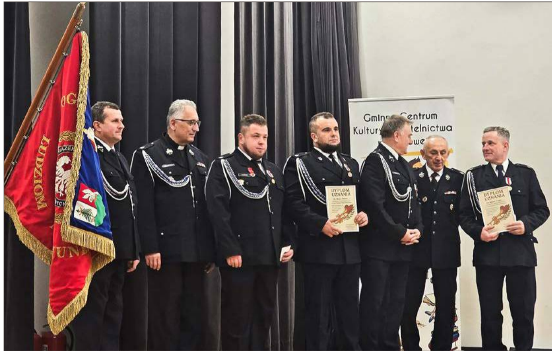
Członkowie OSP w Jodłowej, także ci z orkiestry odebrali medale i odznaczenie.

Po uroczystościach kościelnych uczestnicy przenieśli się do sali widowiskowej Gminnego Centrum Kultury i Czytelnictwa w Jodłowej, gdzie na jubilatę czekał piękny tort.