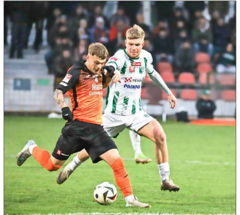
W ostatnim meczu ligowym w tym roku Wisłoka (biało-zielone stroje) zremisowała z KSZO.