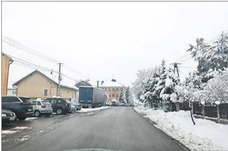
W miejscu, gdzie zaparkowany jest tir, znajduje się chodnik.

czeniem tonażu na parkingu do 3,5 tony - sugeruje nasz Czytelnik.