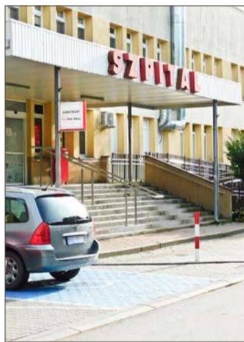
Dębicki szpital może też zostać przejęty przez większą placówkę.

Szczególnie wtedy, kiedy ponad 90 procent pieniędzy z NFZ przeznaczyc trzeba na wypłaty. A te, zgodnie z ustawą o placach w ochronie zdrowia, nie dość, że według starosty w przypadku