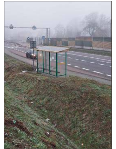
Na przystanek autobusowy warto przyjść pięć minut przed czasem.

Poczekalem więc na kolejne, a przy okazji mogłem w pełni sprawdzić słowa Czytelnika. Trzeci miał być o 7:12, przyjechał o 7:08.