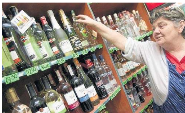
„Schowanie” alkoholu w sklepach może nie wpłynąć na spadek sprzedaży impulsywnej tych produktów

Do kupowania w sposób impulsywny i nieplanowany skłaniają przede wszystkim akcje promocyjne i możliwość nabycia większej liczby produktów za niższą cenę. „Zakupy pod wpływem okazji wielopakowych mają największe znaczenie dla konsumentów w wieku 35-44 lata (41%) oraz dla męż-