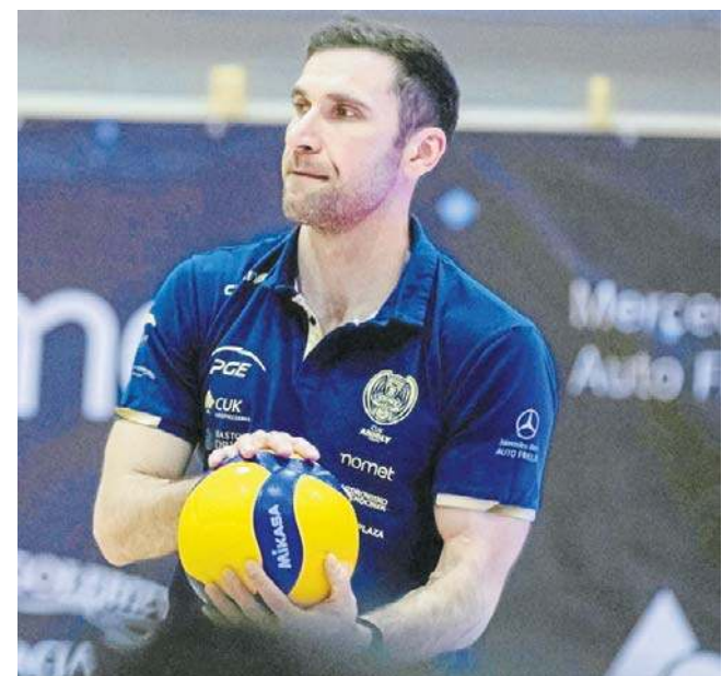
FOT. AGNIESZKA BIELECKA

A potem już play off czyli granie bez miejsca na pomyłki. Przypomnijmy, że pierwsza lokata daje przywilej rozgrywania decydujących meczów w swojej hali. ©©