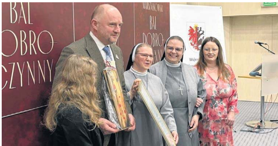
Po tegorocznym Marszałkowskim Balu Dobroczynnym pomoc trafiła między innymi do Specjalnego Ośrodka Wychowawczego Zgromadzenia Sióstr Małych Misjonarek Miłosierdzia we Włocławku

- Zebraliśmy przeszło 735 tysięcy złotych. Główni beneficjenci w tym roku otrzymają po 90 tysięcy złotych. Nie zapominamy jednak o 21 beneficjentach pozostałych edycji, którzy otrzymają po 20 tysięcy złotych. Cieszę się, że możemy wesprzeć działalność organizacji pozarządowych. Wiem, że te środki wspomogą ich podopiecznych. Wsparcie powę-