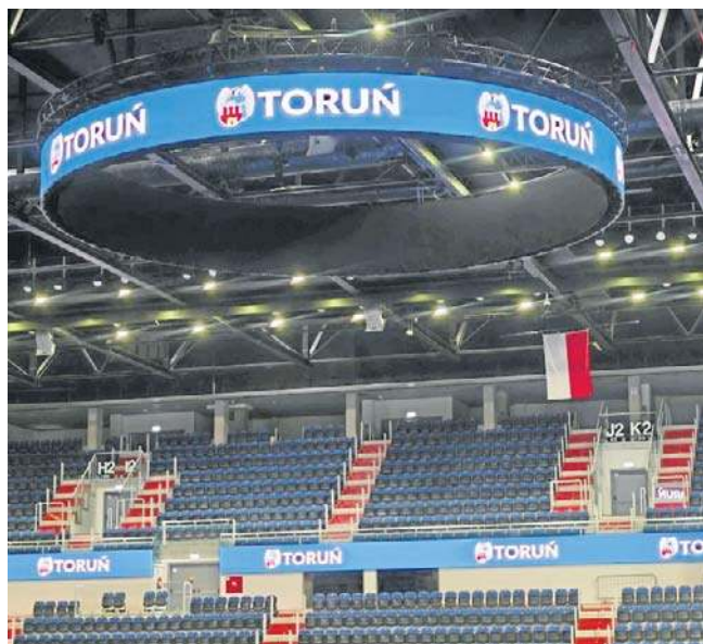
Arena Toruń jest już wystrojona na HMS

Arriva Lotto z bilansem 8-14 zajmuje 14. miejsce. 22 marca zagra we Włocławku. ©©