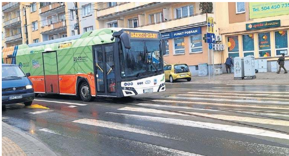
W taborze MZK Toruń jest obecnie 191 autobusów. Wkrótce przybędzie elektrycznych

- To wyjątek od reguły, bo dotąd MZK kupowało pojazdy przy dofinansowaniu zewnętrznym, czyli w praktyce unijnym. Jego pozyskiwanie nadal jest celem spółki - mówił przy okazji podpisania umowy