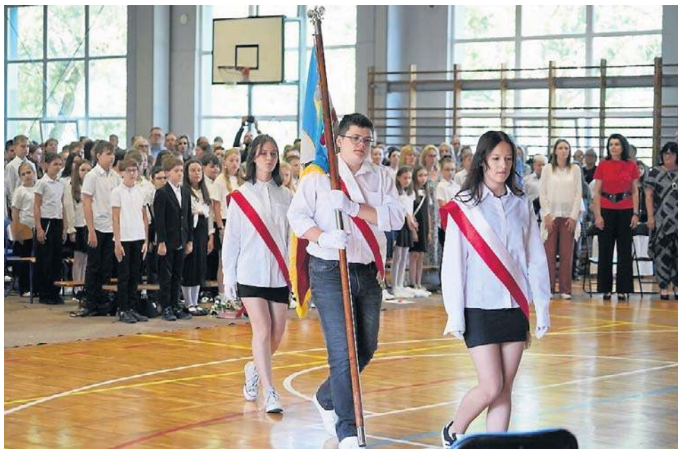
Zakończenie roku w Szkole Podstawowej nr 8 w Toruniu. Zajął 12 miejsce w rankingu

Co bardzo ważne, wszystkie placówki zostały ocenione według tej samej metodologii. Dane wykorzystane w analizie pochodzą z Centralnej Komisji Egzaminacyjnej, Okręgowych Komisji Egzaminacyjnych oraz Ministerstwo Edukacji Narodowej. Ranking opiera się więc wyłącznie na wiarygodnych, porównywalnych i publicznie dostępnych informacjach.