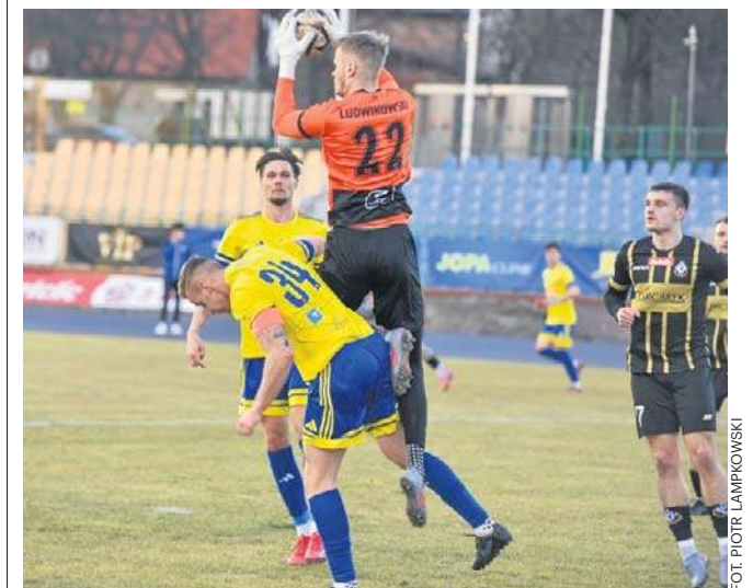
Żółto-niebiescy w dobrych humorach przystąpią do zaległego spotkania z Błękitnymi

Toruński klub poinformował, że osoby, które miały kartek na mecze jesienne wchodzi na to spotkanie za darmo. ©©