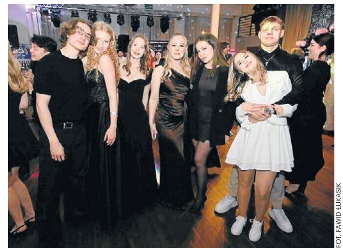
Zabawa maturzystów Centrum Kształcenia Awans w Kielcach

Jak co roku wybieramy Miss i Mistera Studniówki 2026. Kandydatki i kandydatów będziemy szukać na każdym balu w regionie. Wybory Miss i Mistera Studniówki to coroczna akcja „Echa Dnia”. Znowu wybierzemy najpiękniejszą dziewczynę oraz najprzystojniejszego mężczyznę podczas tegorocznych studniówek w regionie świętokrzyskim. Nagrodzimy Miss i Mistera Studniówki 2026, ale także Pierwszą i Drugą Wicemiss oraz Wicemisterów. O wyniku zdecydują - po połowie głosy jury i głosy czytelników na echodnia.eu. ©©