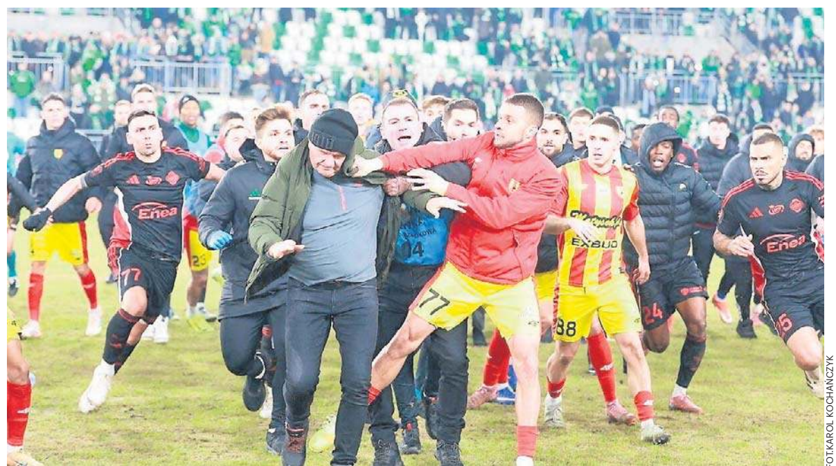
Wielka szarpanina na stadionie po meczu Radomiaka z Koroną Kielce. Są zatrzymani. Będą kary.