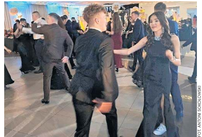
Uczniowie Zespołu Szkół imienia Korpusu Ochrony Pogranicza w Szydłowcu bawili się w Hotelu Wasik.