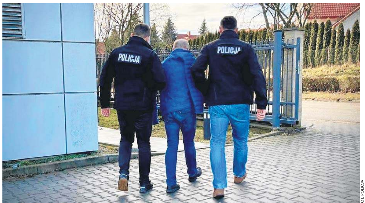
Zatrzymany lekarz usłyszał 124 zarzuty dotyczące przyjmowania korzyści majątkowych

Wspaniała zabawa do białego rana na kolejnych studniówkach w Świętokrzyskiem strona 6