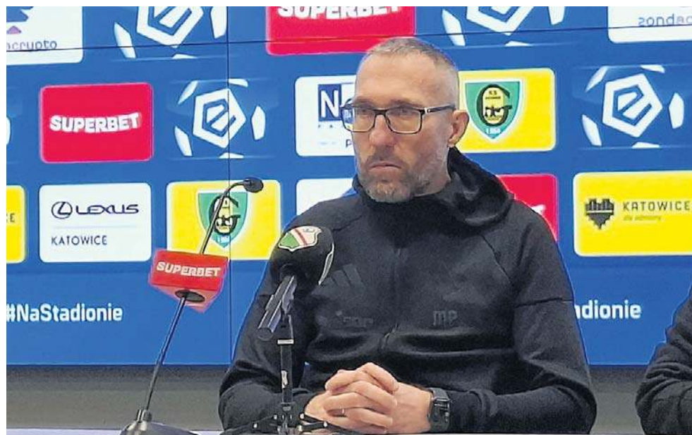
Do 12 meczów z rzędu wzrosła ligowa niemoc Legii. To jej najgorsza seria w historii...