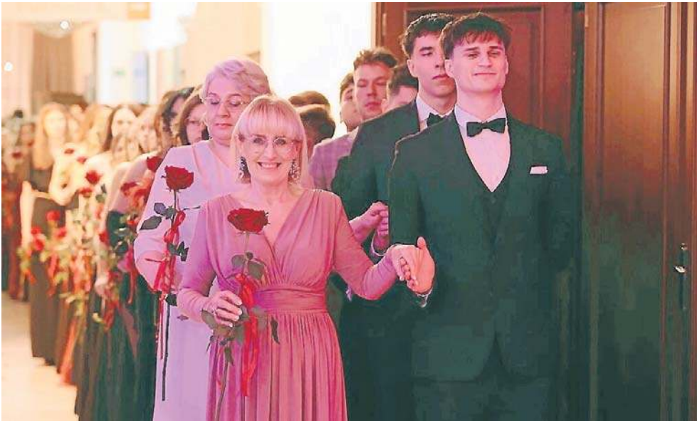
Studniówka IV Liceum Ogólnokształcącego w Kielcach