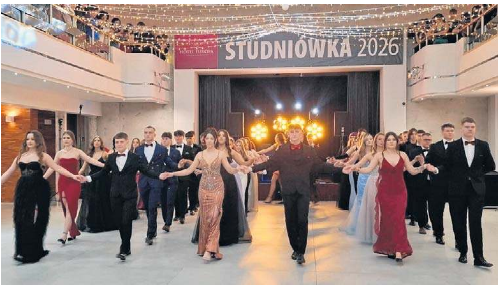
Studniówka maturzystów III Liceum Ogólnokształcącego w Starachowicach