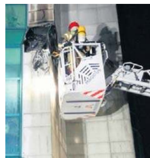
Pożar elewacji Narodowego Banku Polskiego

Ustalono, że przyczyną pojawienia się ognia najprawdopodobniej było zwarcie instalacji elektrycznej. Strażacy działania zakończyli po godzinie 1.