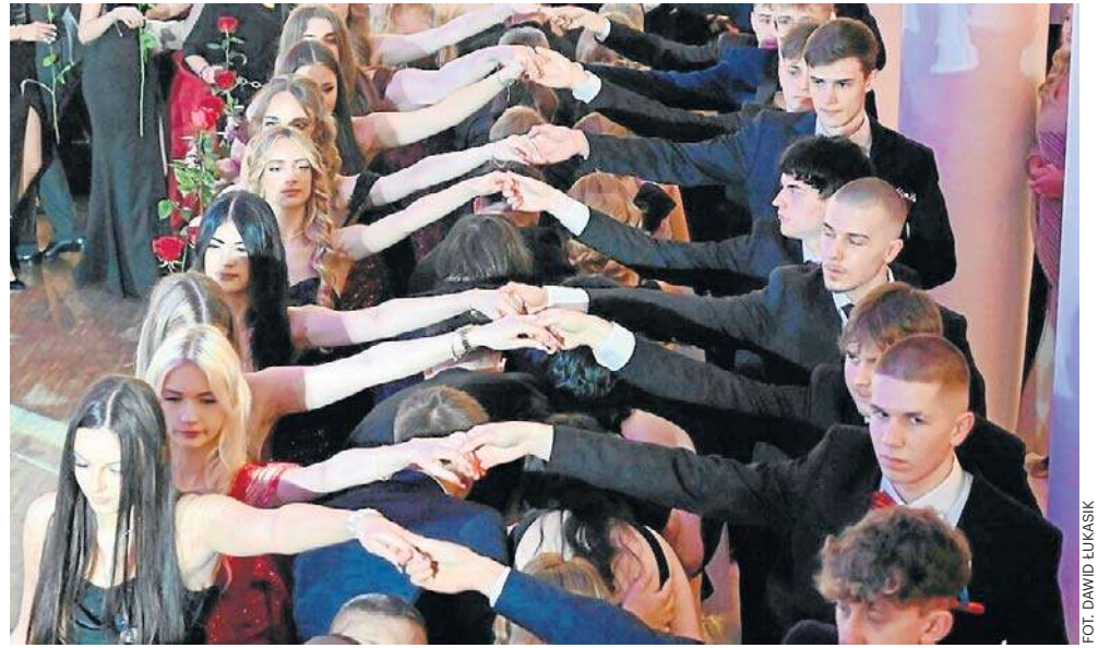
Polonez Zespołu Szkół Elektrycznych w Kielcach