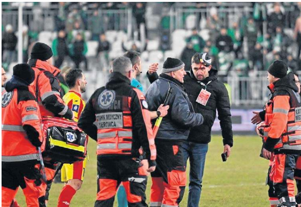
Krew, interwencja służb medycznych i wielki skandal po meczu Radomiaka z Koroną.

Przypominamy, że po meczu w okolicach trybuny gości uderzony butelką został Mi-