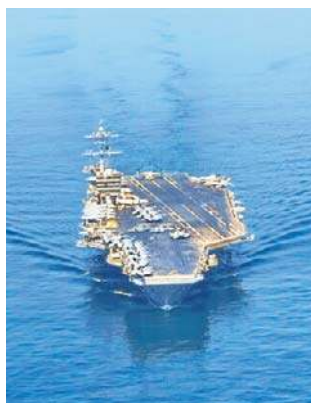
Lotniskowiec zmierza z Karaibów na Bliski Wschód

Prezydent USA Donald Trump mówił w piątek o potrzebie zmiany władzy w Iranie, a Pentagon wysłał w ten region drugi lotniskowiec. Co na to Iran?