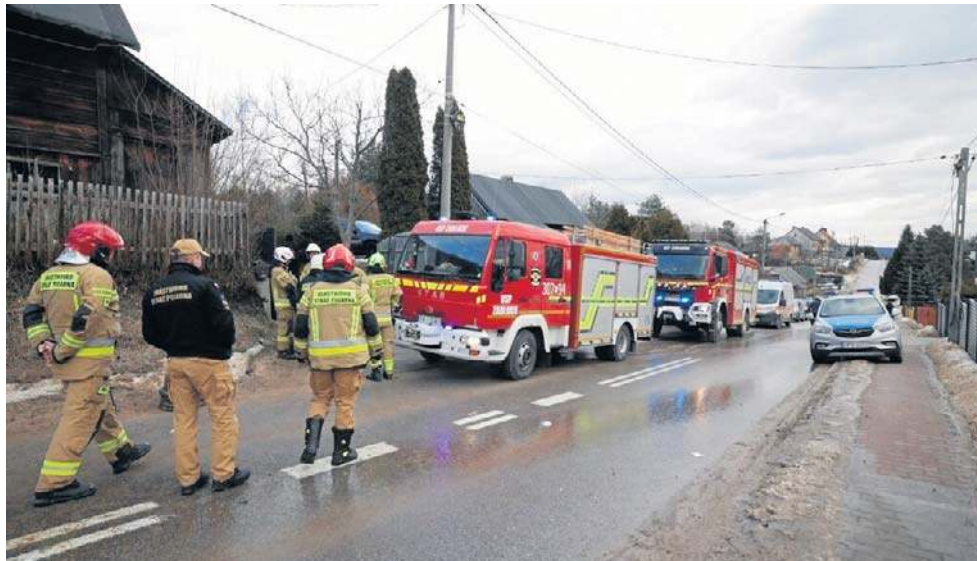
Na miejscu zdarzenia pojawiły się służby

- Doszło tam do pożaru w jednym z pomieszczeń w budynku jednorodzinny. W obiekcie w momencie zdarzenia przebywały trzy osoby. Wszystkie są pod opieką zespołu ratownictwa medycznego i Lotniczego Pogotowia Ratunkowego ze względu na poparzenia - informuje starszy kapitan Marcin Bajur, rzecznik prasowy świętokrzyskiej straży pożarnej.