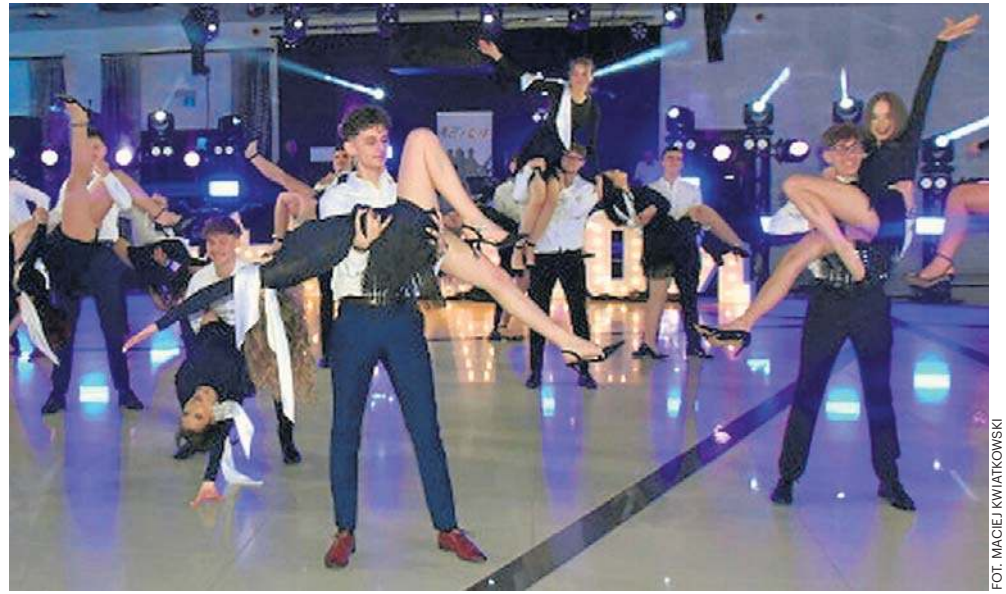
Pięknego poloneza zatańczyli uczniowie radomskiego liceum „Konopnickiej”.