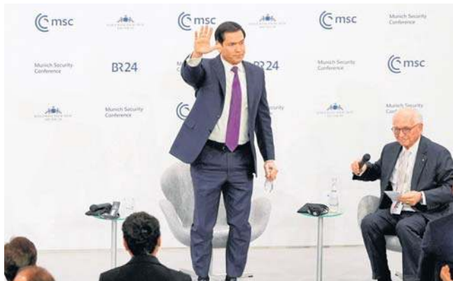
Szef amerykańskiej dyplomacji odpowiadał między innymi na pytania poświęcone wojnie na Ukrainie. Jego wystąpienie zostało przyjęte z dużym zadowoleniem

Rubio dał też do zrozumienia, że administracja Trumpa