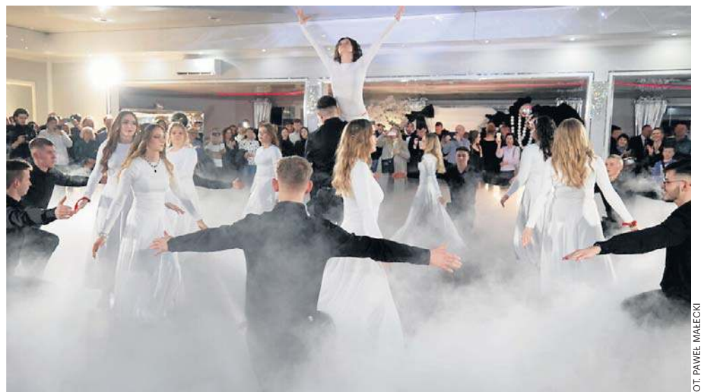
Studniówka Zespołu Szkół numer 3 imienia Stanisława Staszica we Włoszczowie