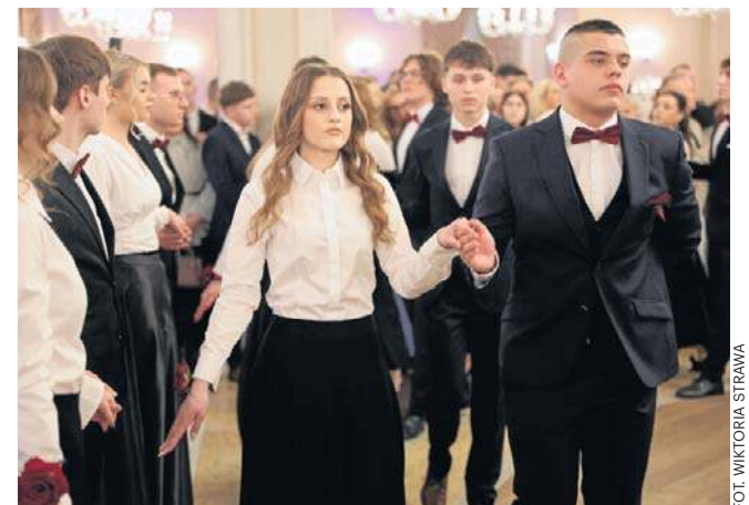
Studniówka Liceum Ogólnokształcącego imienia księdza kardynała Stefana Wyszyńskiego w Staszowie