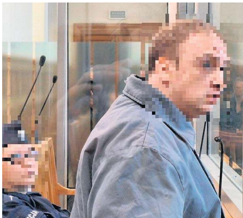
Prokurator domagał się dożywocia dla sprawcy podpalenia

Oskarżony został zatrzymany przez policjantów 20 marca 2024 roku przed godz. 21 w rejonie al. Wyszyńskiego w Łodzi na Retkini. Był pijany i agresywny, ale szybko go obezwładniono, skuto kajdankami i odstawiono do policyjnej izby zatrzymań. Miał 1,7 promila alkoholu w organizmie.