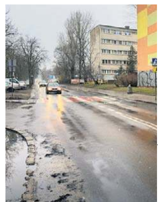
Ulica Wielkopolska nie była remontowana od lat

Na remont ulicy Wielkopolskiej mieszkańcy osiedla o tej samej nazwie czekali przez wiele lat. Ulica ta odznacza się wyjątkowo zniszczoną nawierzchnią, na której podczas opadów zbiera się woda. Z kolei przystanek przy Pułaskiego w stronę centrum to prawdziwe wyzwanie dla pasażerów. Nie dość, że trzeba wsiadać z poziomu