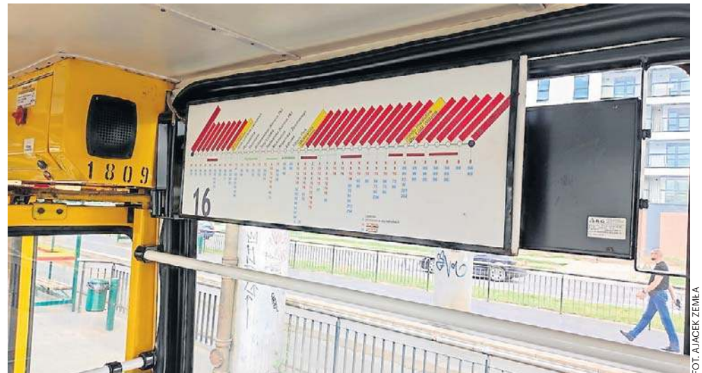
Z ulicy Pabianickiej wycofane zostaną tramwaje linii 11, 16 i 41, a w ich miejsce uruchomiona zostanie autobusowa komunikacja

W najbliższą niedzielę - 1 marca rozpoczną się prace torowe na skrzyżowaniu ulicy Pabianickiej i Placu Niepodległości. W związku z tym wycofane zostaną z ulicy Pabianickiej tramwaje 11, 16 i 41, a w ich miejsce uruchomiona zostanie autobusowa komunikacja zastępcza w postaci linii Z11 i Z41. Autobusy będą kursować pomiędzy Placem Niepodległości a krańcówką Chocianowice Ikea. MPK zapewnia, że zostanie utrzymane skomunikowanie autobusów Z41 i tramwajów linii 41 odjeżdżających spod Ikea w kierunku Pabianic oraz w kierunku przeciwnym. Z kolei autobusy Z11 mają być skomunikowane na Placu Niepodległości z tramwajami linii 11 tak, aby pasażerowie mogli się