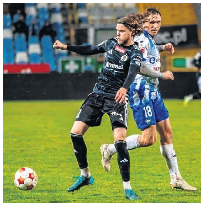
Piłkarze ŁKS Łódź (czarne stroje) zmierzą się na swoim stadionie z zespołem Miedzi Legnica