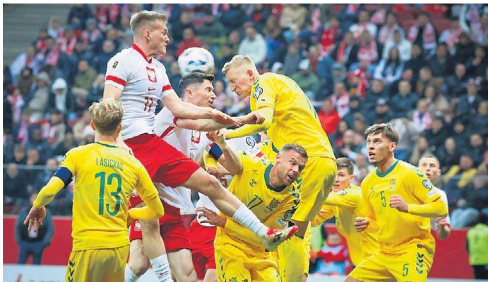
Karol Świderski i Robert Lewandowski walczą z Litwinami na PGE Narodowym

Program obozu obejmuje 630 minut zajęć na boisku. Zaplanowano treningi ofensywne, specjalistyczne zajęcia dla bramkarzy oraz osobne jednostki treningowe dla dziewcząt. Camp skierowany jest do chłopców i dziewcząt z roczników 2010-2018. Organizato-