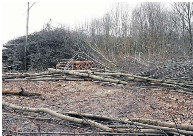
Od strony ul. Przybyszewskiego widać stertę wyciętych drzew i krzewów

Jednak liczba ta nie jest ostateczna. Jak informuje inwestor, czyli Polska Spółka Gazownictwa ile roślin zostanie usuniętych na potrzeby związane z budową przyłącza ostatecznie określi raport końcowy z wycinki, który powinien zostać opracowany w marcu 2026 roku. Dopiero wtedy będzie można obliczyć, ile drzew i krzewów spółka posadzi w ramach rekompensaty za wyciętych drzewostan.