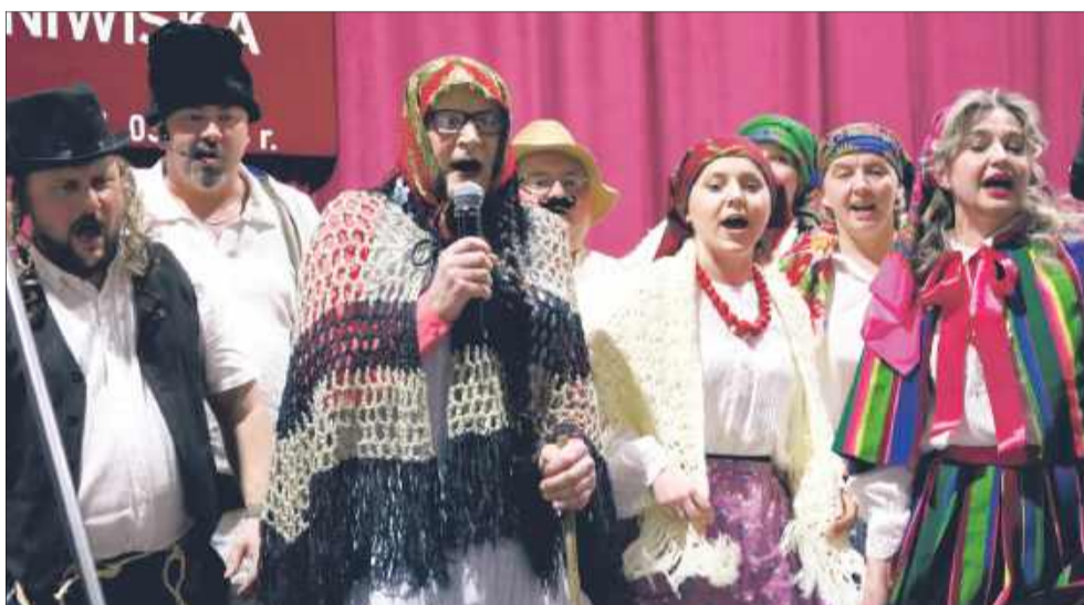
Nie zabrakło także wspólnego śpiewu.