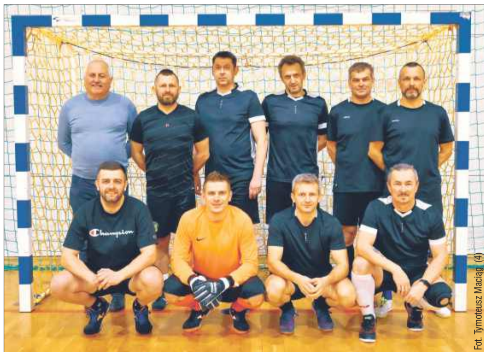
Do rywalizacji stanęło osiem drużyn.