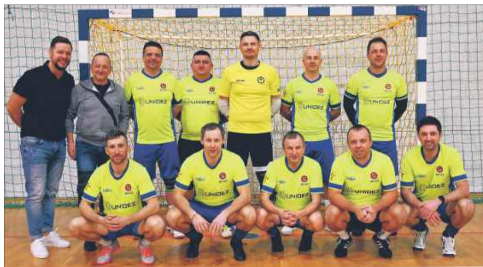
Podczas rozgrywek panowały dobre nastroje i wzajemna mobilizacja.