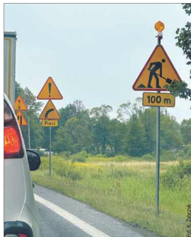
Kierowcy mogą napotkać utrudnienia.

- Pierwszy odcinek od Nowej Dęby do miejscowości Krząt-