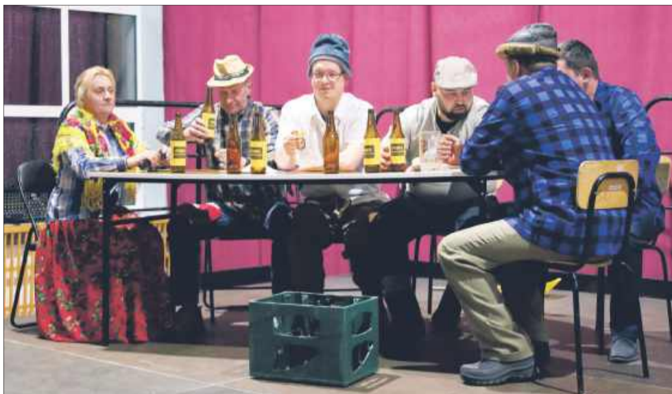
Sceny wymagały odpowiedniego przygotowania.