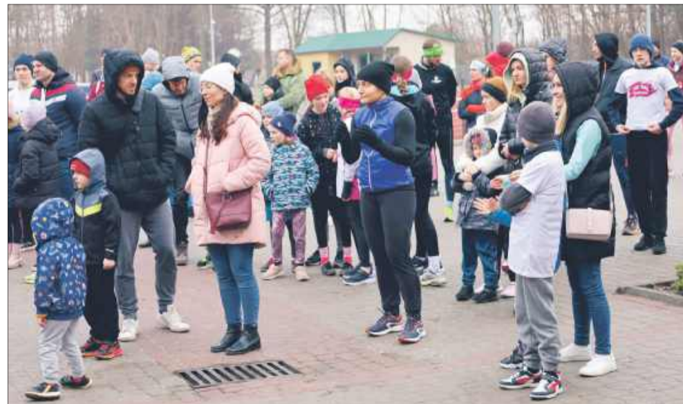
Chłodna aura nie zniechęciła biegaczy.