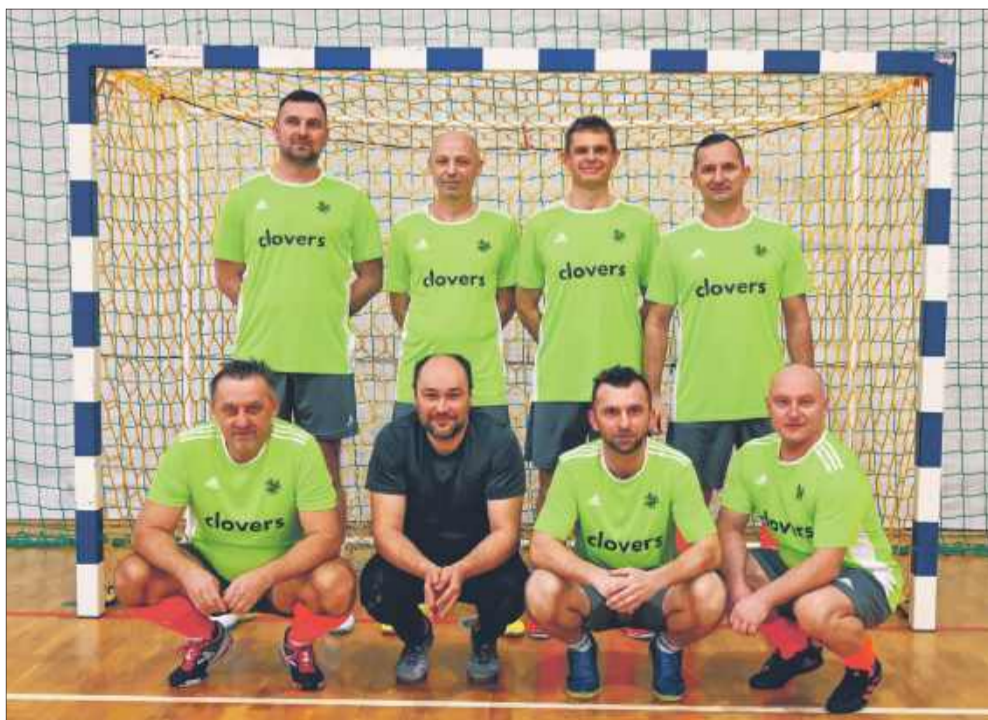
Pamiątkowe zdjęcia wykonała każda drużyna.