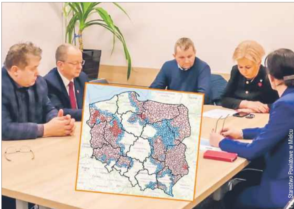
Rolnicy z powiatu mieleckiego apelują o zmiany w restrykcjach związanych z ASF.

Rolnicy z powiatu mieleckiego apelują o zmiany w restrykcjach związanych z ASF. W Powiatowym Inspektoracie Weterynarii w Mielcu odbyło się spotkanie z inicjatywą posła Krystyny Skowrońskiej.