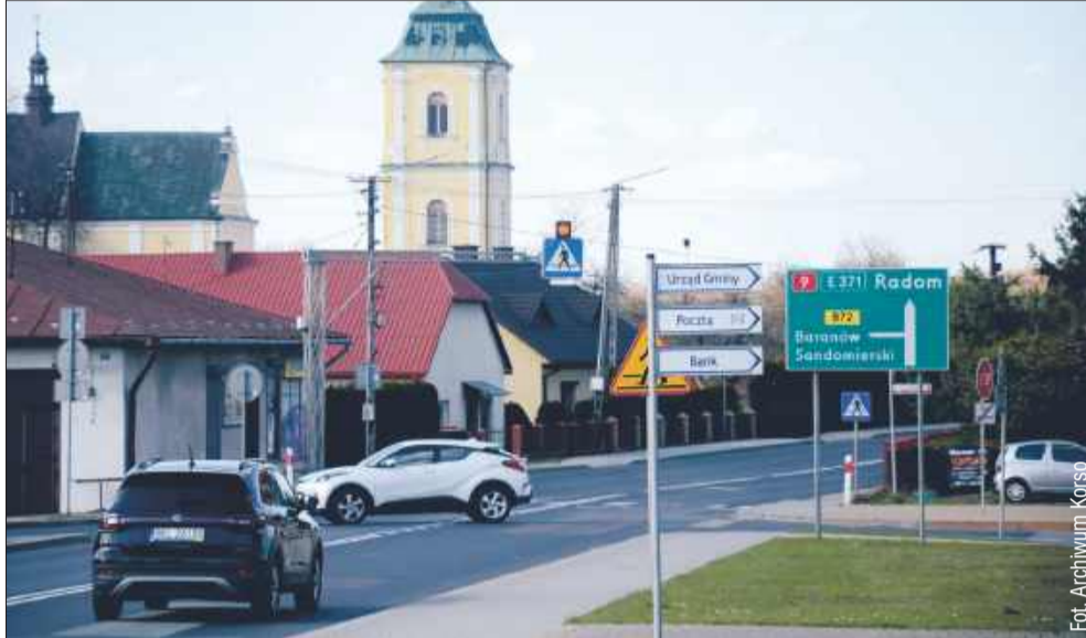
Czy Majdan Królewski pójdzie śladem Kolbuszowej? Ostateczna decyzja należy do władz gminy.

- Działając w imieniu własnym, jak również mieszkańców, zaniepokojonych sytuacją polityczną, kulturową, społeczną oraz gospodarczą w naszym kra-