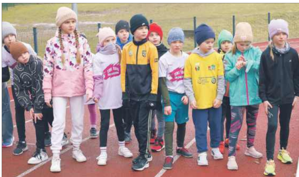
Starsi uczniowie też zdecydowali się wziąć udział w biegu.