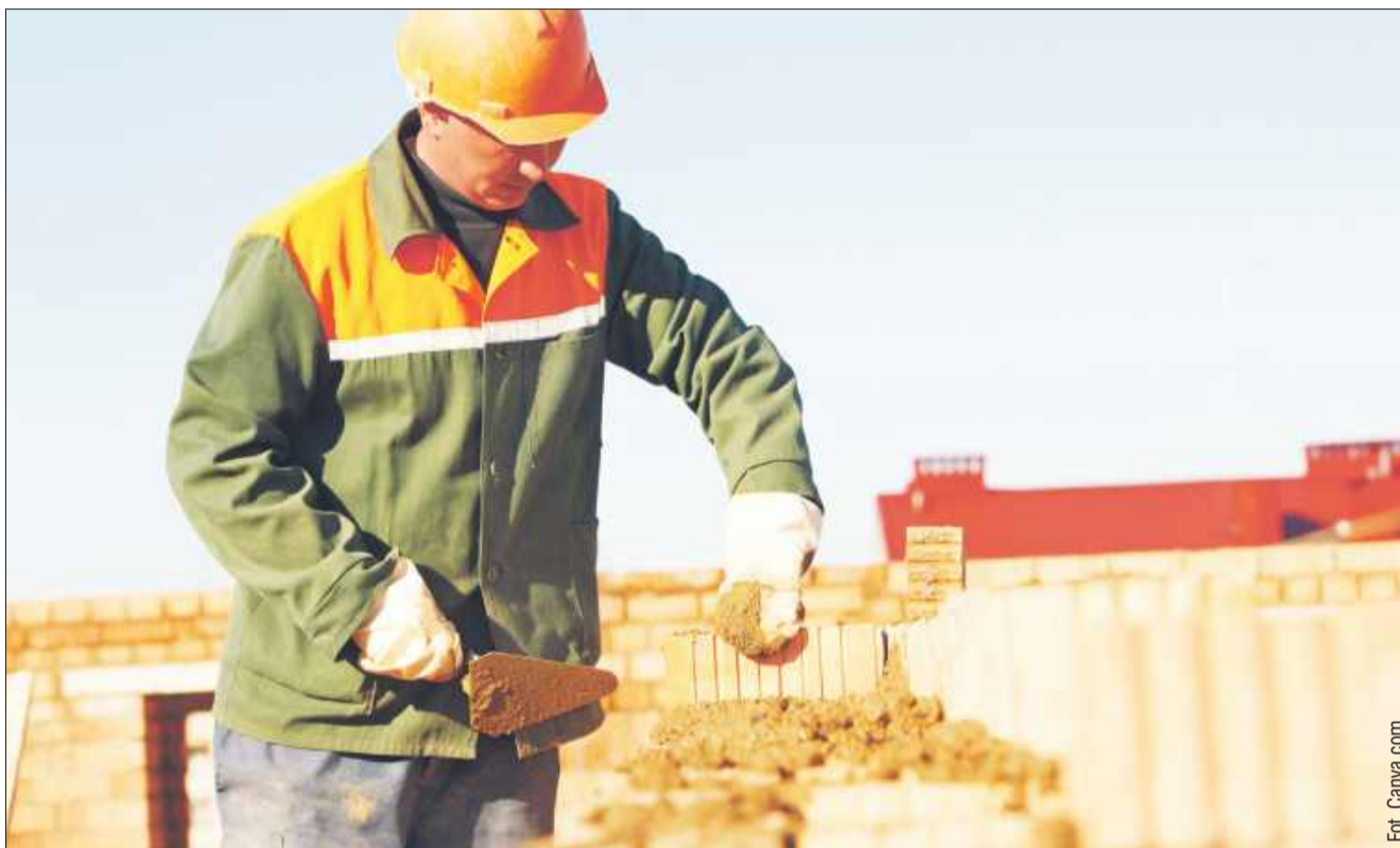
Wśród zawodów deficytowych w powiecie kolbuszowskim znaleźli się m.in. betoniarze, murarze i inni fachowcy z branży budowlanej.

Barometr zawodów na 2025 rok wskazuje, że w powiecie kolbuszowskim nadal będzie duże zapotrzebowanie na specjalistów z branży budowlanej, transportowej i edukacyjnej. Wśród zawodów deficytowych znaleźli się betoniarze, murarze i cieśle, elektrycy i elektromechanicy, mehani-