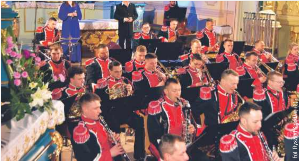
W kościele w Raniżowie odbył się wyjątkowy koncert.