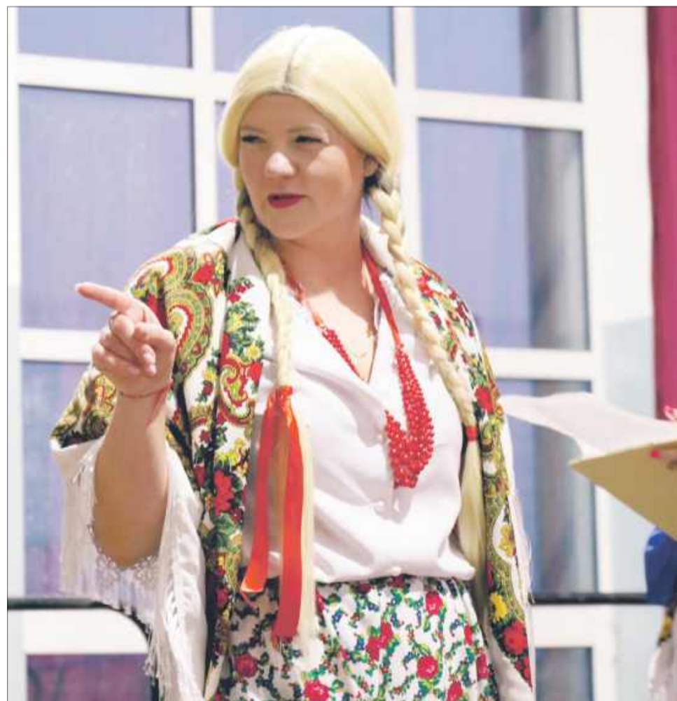
Ciekawie przedstawiona została m.in. postać Jagny.