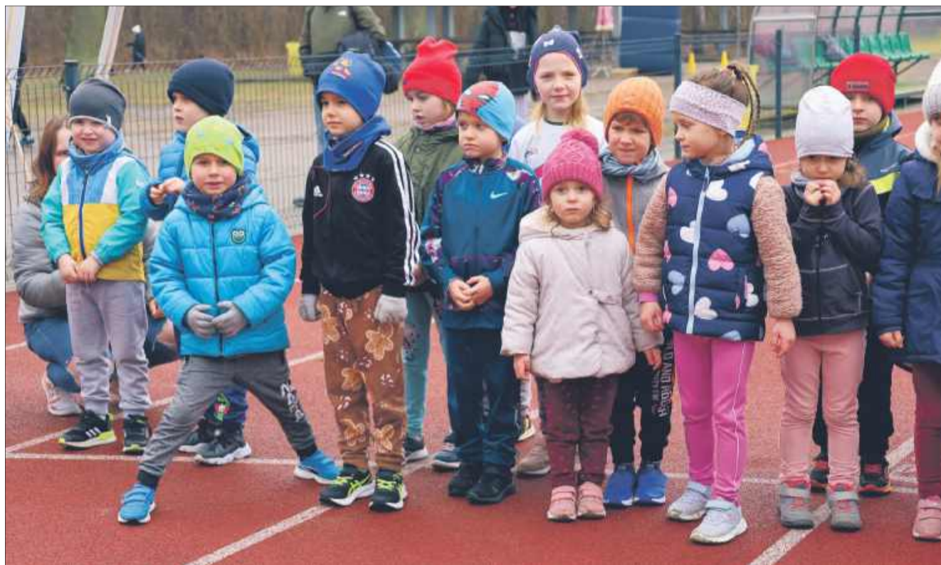
Dzieciom ten dzień sprawił wyjątkową radość.

Bieg Tropem Wilczym w powiecie kolbuszowskim to jedno z wydarzeń sportowo-patriotycznych, które na stałe wpisało się w kalendarz. Mieszkańcy pokazali, że chcą łączyć aktywność fizyczną z upamiętnianiem ważnych postaci historycznych. Już teraz wielu uczestników zapowiedziało swój udział w kolejnej edycji. kz