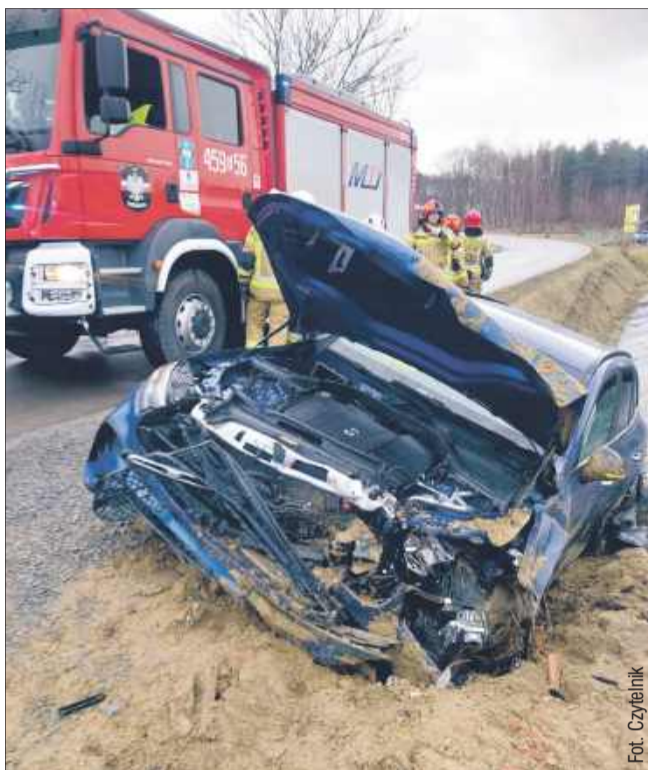
W Widelce osobowy mercedes z impetem uderzył w przepust. To cud, że nikomu nic się nie stało.

Według wstępnych informacji kierująca skodą 30-letnia kobieta, mieszkanka powiatu jarosławskiego, jadąc od Rzeszowa w kierunku Nowej Dęby, z nieustalonych dotychczas przyczyn