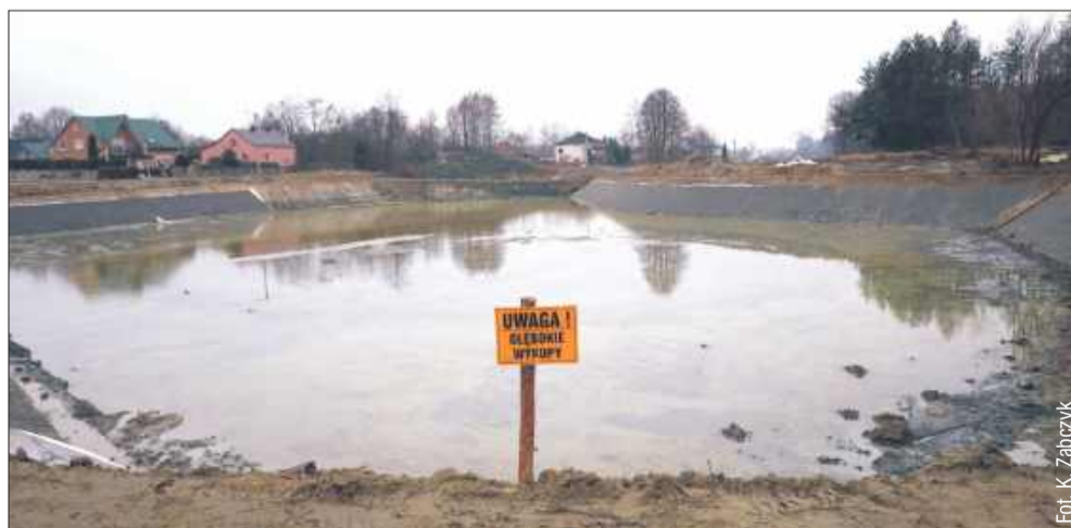
Aktualnie układane są płyty ażurowe.

Oprócz profilowania skarp i dna, projekt obejmuje także wykonanie dojazdu technicznego, który ułatwi obsługę zbior-