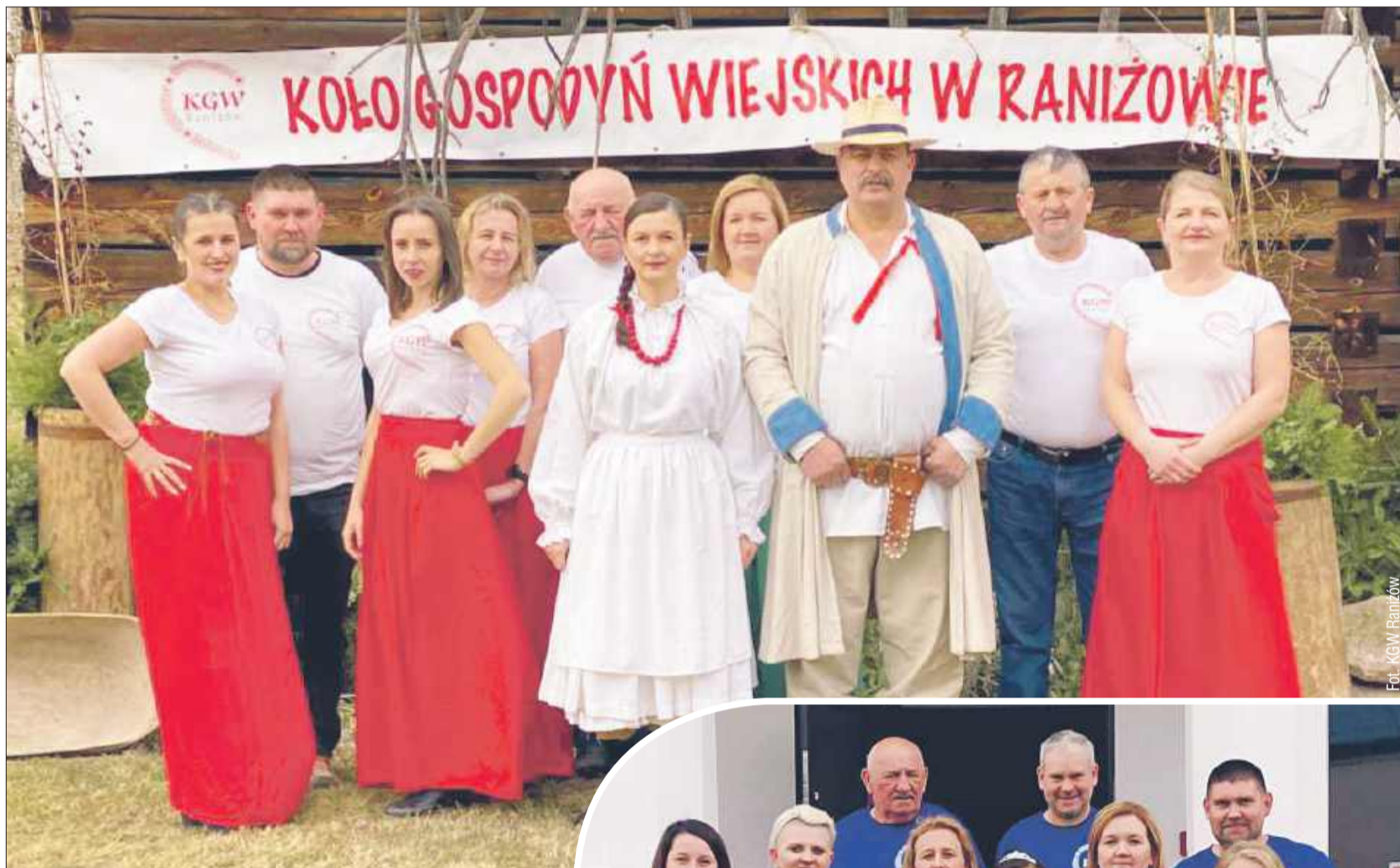
Członkowie dbają o to, by pieśni, tańce i dawne zwyczaje nie popadły w zapomnienie, a młodsze pokolenia z dumą nosiły w sercu lasowiacką tożsamość.