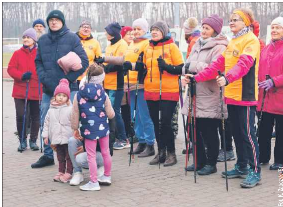
Tradycyjnie pojawili się także miłośnicy nordic walking z Kolbuszowej.