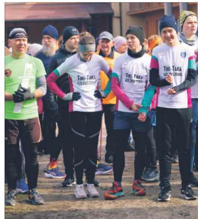
Zawodnicy tuż przed startem biegu.