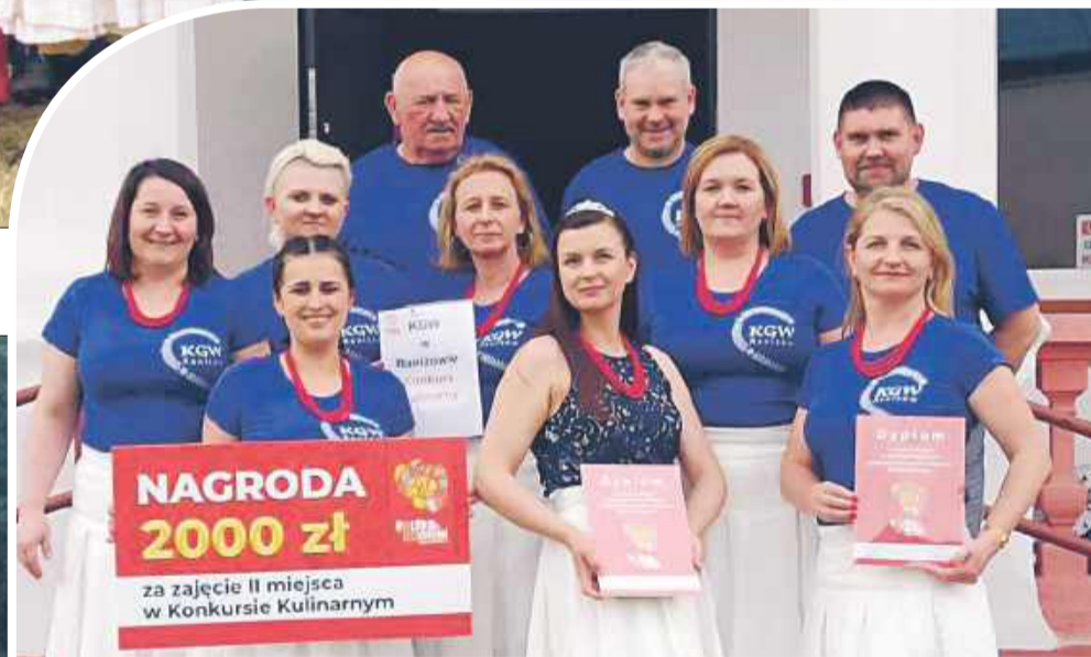
W Raniżowie KGW to prężnie działająca jednostka odnosząca sukcesy.

do działania, że aż kurz się za nią unosił, jak brokat na odpustowym straganie.