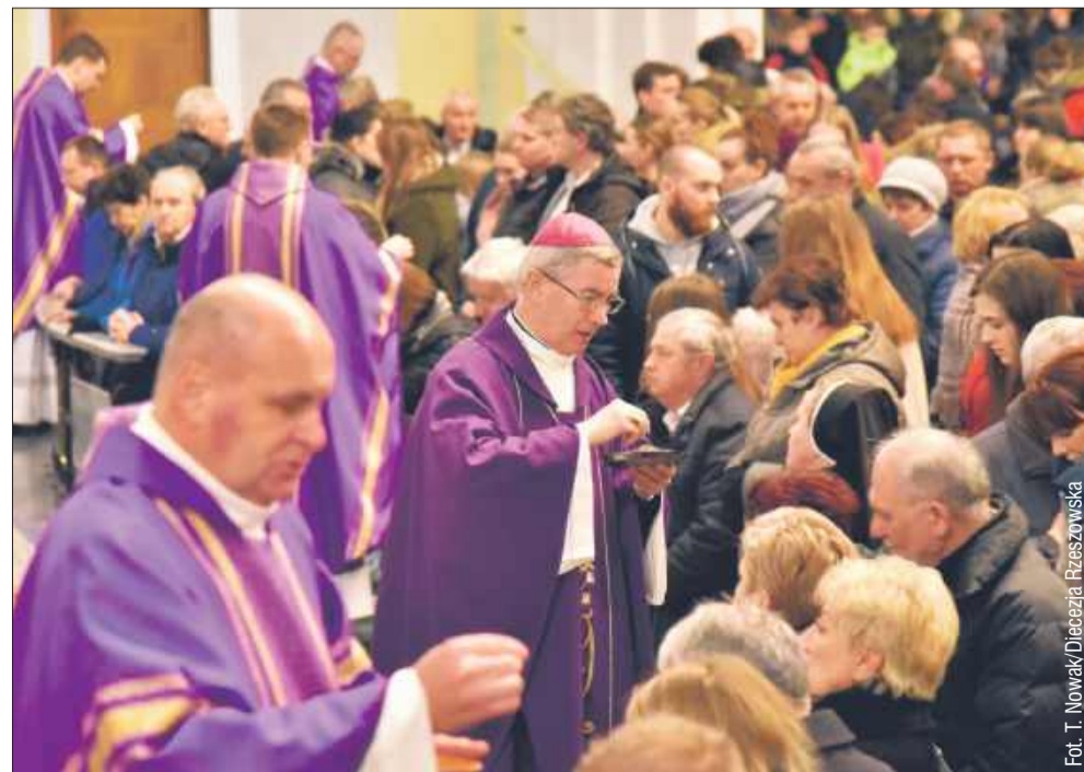
Środa Popielcowa to dla wielu katolików ważny dzień.