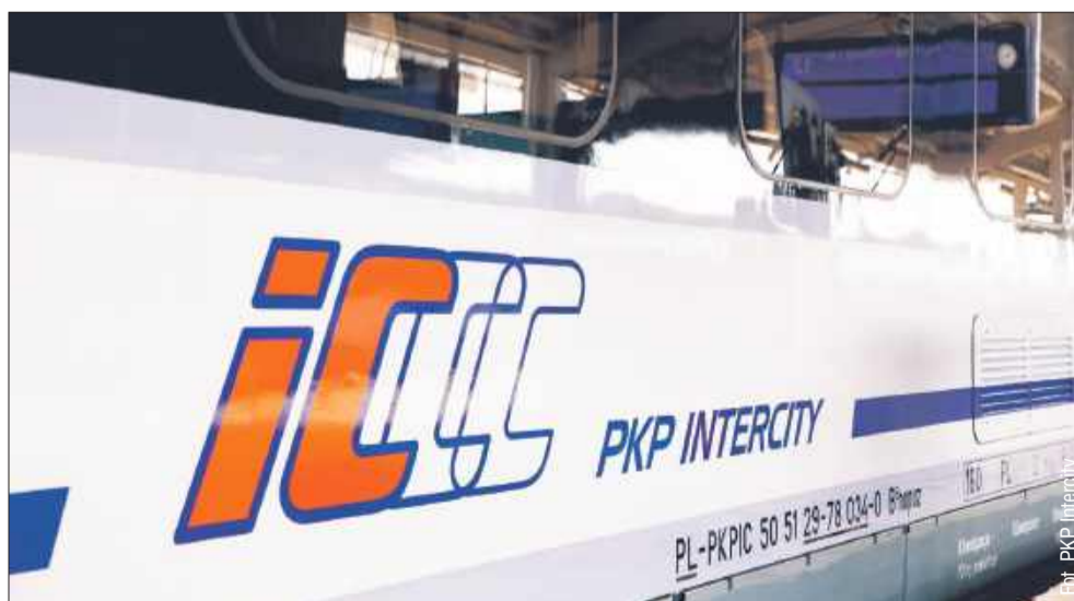
Ile potrwa podróż i ile zapłacimy za przejazd?

Obecnie najszybszym połączeniem kolejowym z Rzeszowa do Warszawy jest Express InterCity Premium (EIP), który pokonuje trasę w 3 godziny i 49 minut, jednak cena biletu wynosi aż 191 zł. Nowy pociąg IC San, który wyruszy 9 marca, pozwoli na nieco szybszy przejazd, bo o 8 minut krótszy, a jednocześnie koszt biletu będzie niższy o ponad 130 zł. To znacząca różnica dla pasażerów poszukujących tańszych alternatyw dla