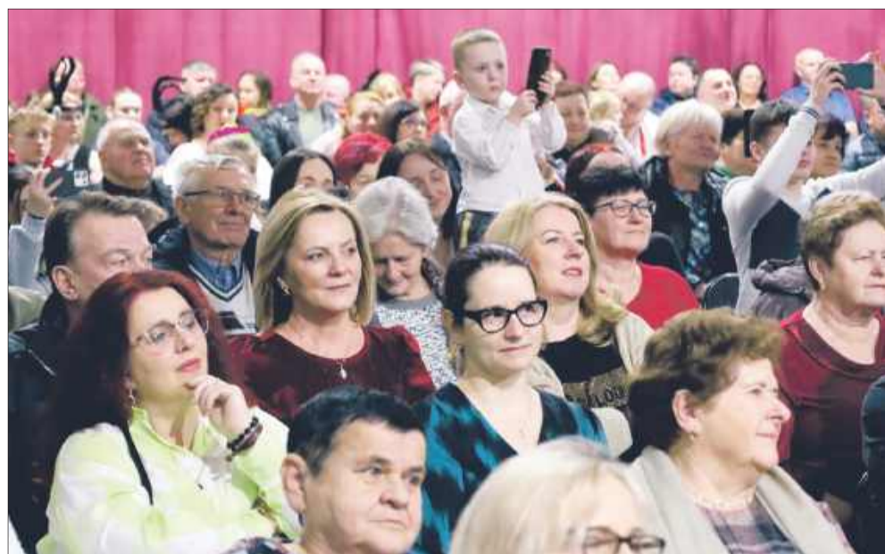
Sala gimnastyczna pękała w szwach.