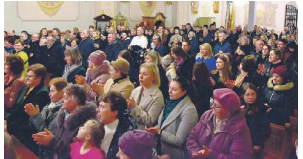
Licznie zgromadzona publiczność mogła podziwiać występ orkiestry.