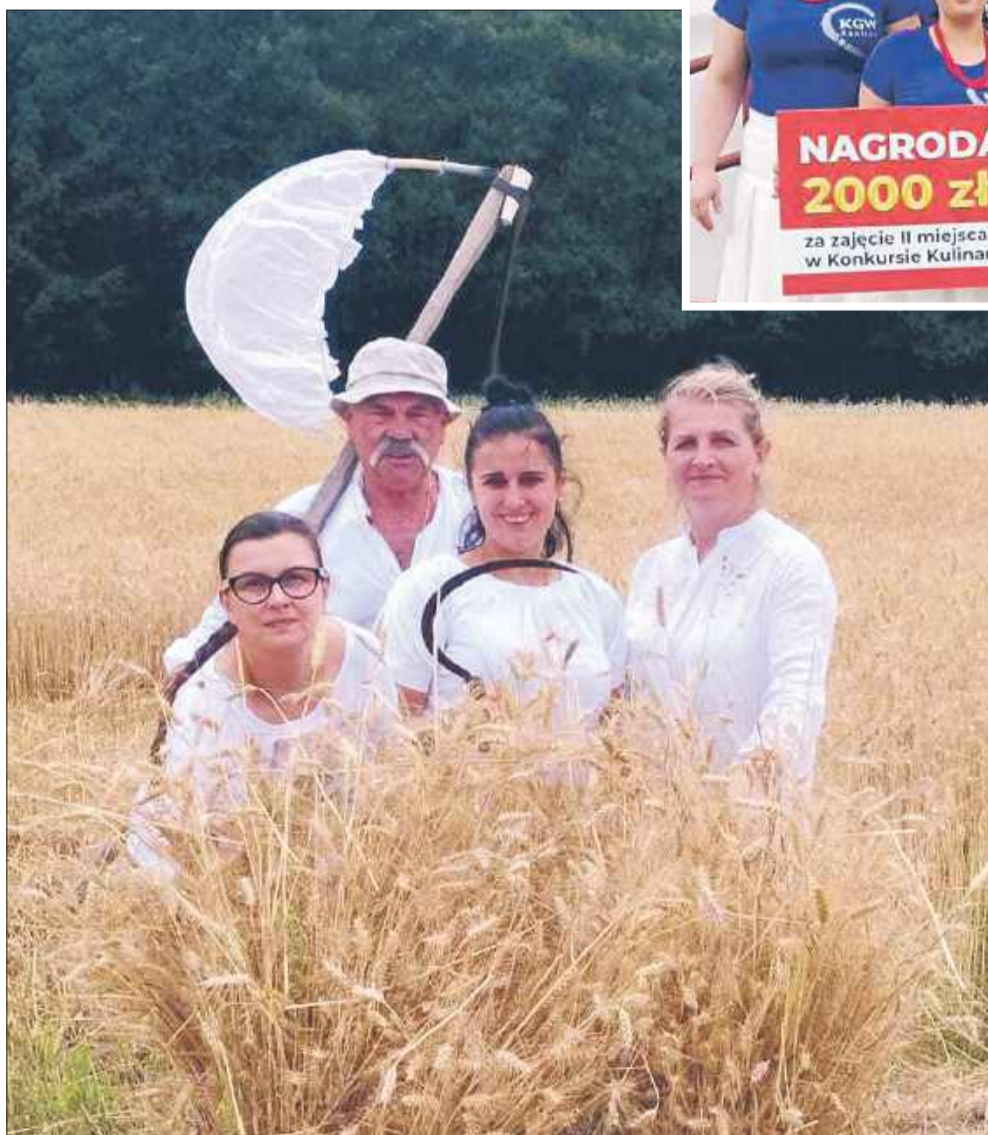
KGW Raniżów podtrzymuje lasowiacką kulturę i tradycję.