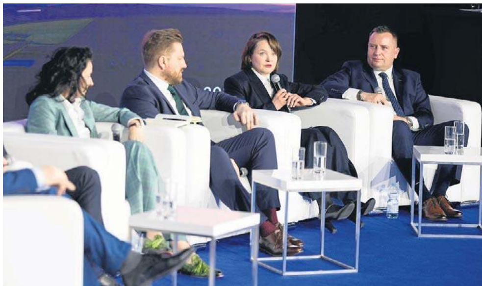
Trzeba obniżyć koszty i dostosować kontrakty do krajowych wykonawców

- Jeśli chodzi o onshore, nasza aktualna strategia, która została przyjęta w styczniu zeszłego roku, mówi o blisko 13 GW mocy zainstalowanej w OZE - przypomniał jednocześnie.