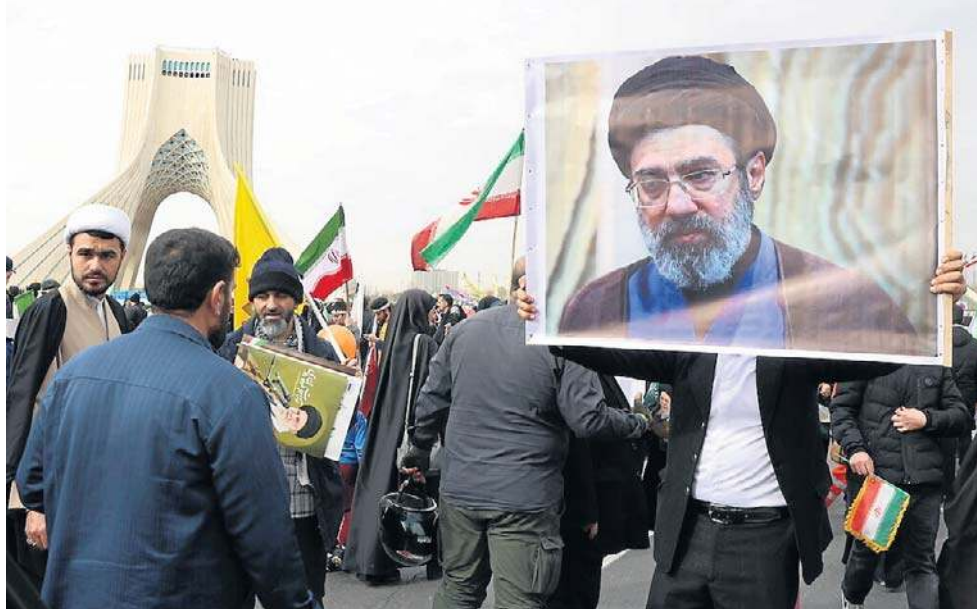
Modżtaba Chamenei zastąpił swojego ojca ajatollaha Alego Chameneia, który zginął w atakach Izraela i USA, na stanowisku najwyższego przywódcy kraju