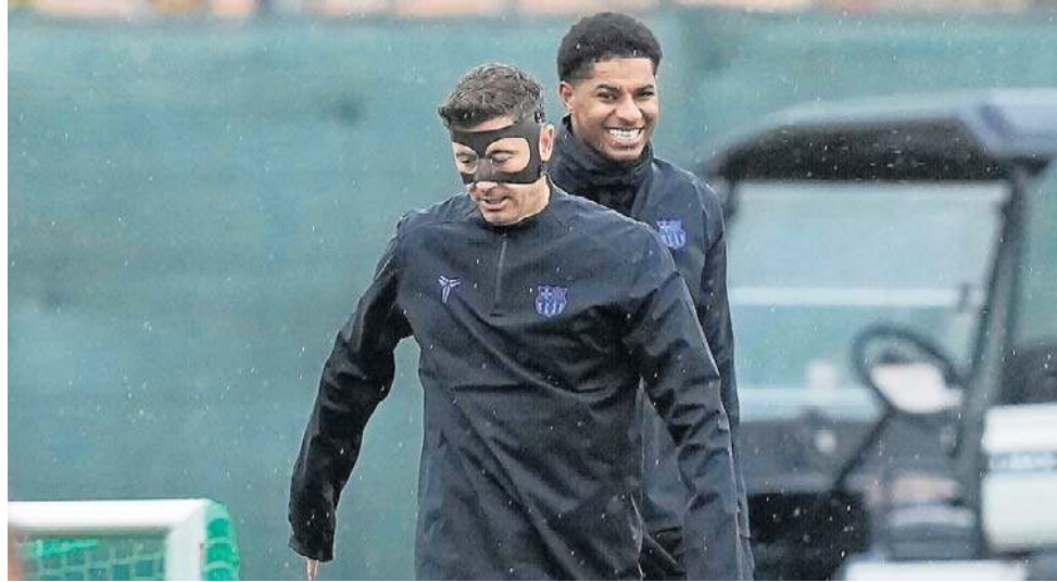
Robert Lewandowski w masce ochronnej i Marcus Rashford szykują się na strzelaninę na St. James' Park w meczu Newcastle United – Barcelona o ćwierćfinał Ligi Mistrzów