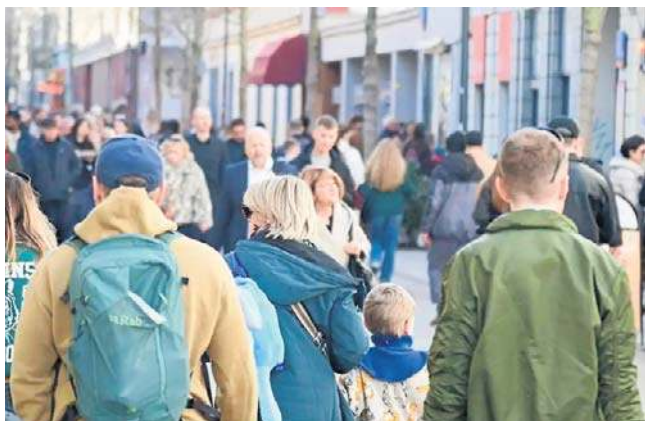
W 2025 r. wzrosła liczba zwolnień lekarskich jednodniowych, szczególnie przed weekendami

Już w ubiegłym roku informowaliśmy o tym, że w 2024 r. wzrosła liczba zwolnień lekarskich jednodniowych, szczególnie przed weekendami. Ten trend w 2025 r. jeszcze bardziej się nasilił. 23,6% takich zwolnień (badanych przez Conperio) przypadało na piątki, a 20,5% na poniedziałki. To znaczy, że ponad 44% wszystkich jednodniowych L4 koncentrowało się w dwóch