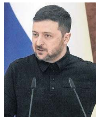
Zełenski powiedział, że chce pomóc krajom Bliskiego Wschodu

Biały Dom nie odpowiedział na pytanie, czy Stany Zjednoczone zwróciły się do Ukrainy