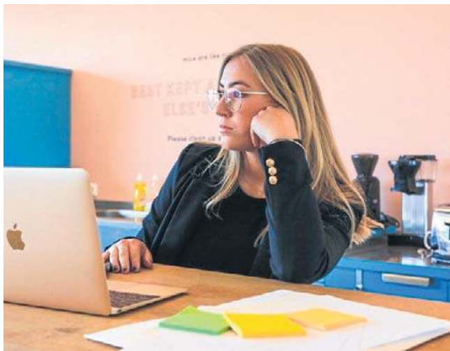
Młodzi szukają pracy: stawki są niskie, a na jedno miejsce jest istny wysyp aplikacji

- Stawki są niskie, jest po kilkadziesiąt ofert na jedno miejsce, ale niekoniecznie z potrzebnymi kompetencjami - komentuje dla nas pracowniczka działu HR w jednej z gdańskich firm. - Dziś nie można już liczyć na takie oferty, jak jeszcze dwa i cztery lata temu. Jest mniej ogłoszeń, wydłużają się procesy rekrutacyjne. Kładziony jest nacisk na większe dopasowanie kompetencji.