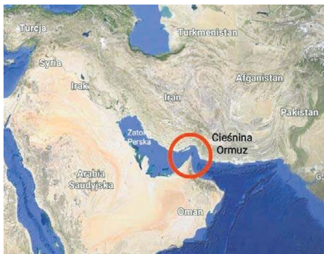
Kluczowa jest Cieśnina Ormuz, blokowana przez Iran. Ograniczane jest też wydobycie ropy

Wielu kierowców zadaje sobie teraz pytanie, o ile wzrosną ceny, kiedy mogą się zatrzymać i dlaczego widać różnice w cenach pomiędzy poszczególnymi stacjami, nawet w obrębie jednego miasta. Według ekspertów, najbardziej dynamiczne zmiany występują tam, gdzie jest stosunkowo duży ruch. Takie stacje paliwa kupują na rynku hurtowym nawet codziennie. A to oznacza o wiele szybszą reakcję