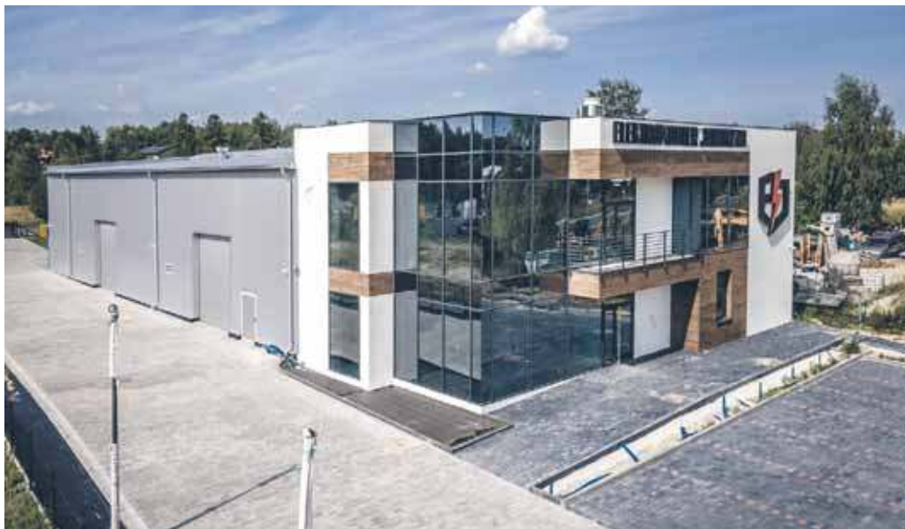
Realizacja inwestycji w Jaworznie

Spacerując ulicami Jaworzna, trudno nie zauważyć, jak dynamicznie zmienia się oblicze miasta. Każdy kolejny rok przynosi nowe inwestycje, które sprawiają, że Jaworzno nabiera nowoczesnego i atrakcyjnego charakteru. Widać to szczególnie po nowych terenach mieszkaniowych, nowych osiedlach, ale też nowoczesnych budynkach biurowych i usługowych. Nie każdy wie, że za dużą częścią tych inwestycji stoi firma z 20-letnim doświadczeniem, która w Jaworznie realizuje bardzo wiele budów. Firma RISER – lokalny generalny wykonawca – od dwóch dekad aktywnie współtworzy przestrzeń naszego miasta.