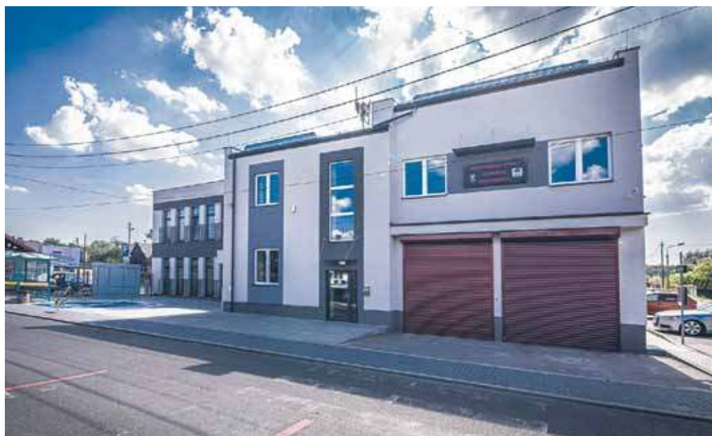
Budowa Centrum Kulturalno-Społecznego z rozbudową straży pożarnej w Ciężkowicach