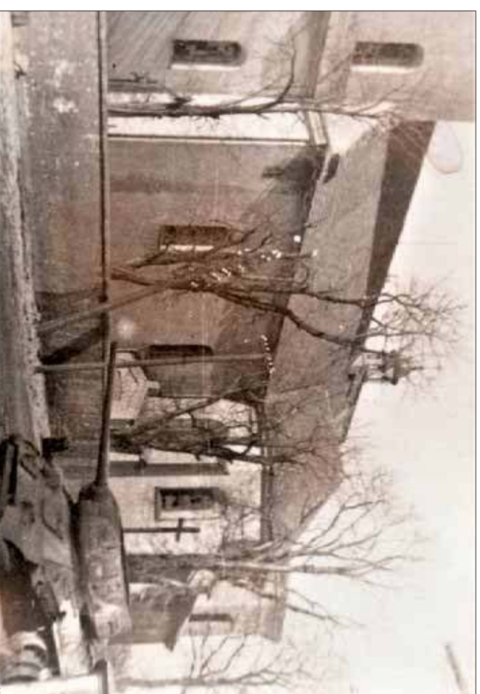
Kościół św. Wojciecha w Jaworznie pod koniec IIWŚ. Widoczna kaplica boczna to pozostałość obiektu szesnastowiecznego.

Tego typu orientacja dotyczy także chrześcijaństwa, choć w nieco innym kontekście. Łączy się ona z wątkiem architektonicznym, a więc tego, w jaki sposób stawiano dawniej kościoły. Chodzi mianowicie o tzw. oś sakralną. A czego ona dotyczy? Po pierwsze, rozpowieszchniła się i utrwaliła w średniowieczu. Polegała zaś na dość osobliwym sytuowaniu kościołów. Kościoły jako budow-