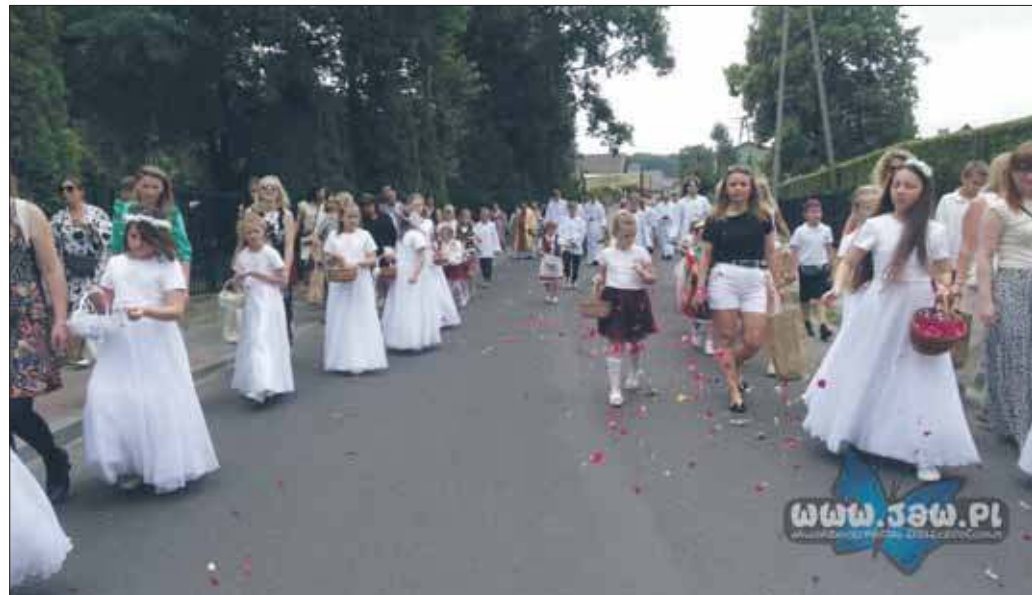
Boże Ciało w parafii w Ciężkowicach, 19 czerwca 2025 r.