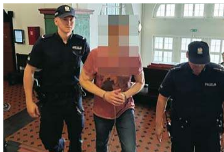
Molestował dzieci podczas imprez urodzinowych \5