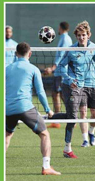
„Królewscy” kontra „Obywatele” \16