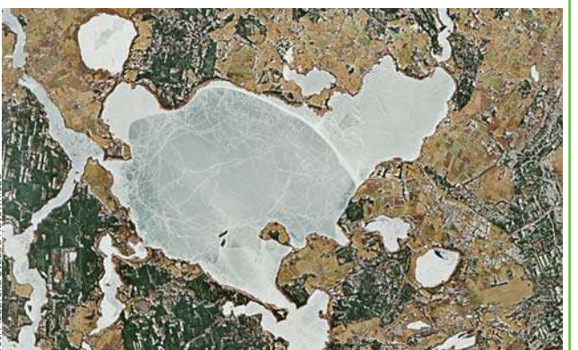
fol. Mazurska Służba Ratownicza

Służby i eksperci ostrzegają: nie wchodźcie na lód w miejscach, gdzie widać pęknięcia, ciemne pasy