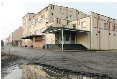
Seniorzy w Olsztynie czekają na swoje miejsce \3