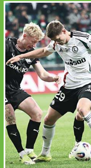
Zwycięska Legia, oburzona Wisła \13