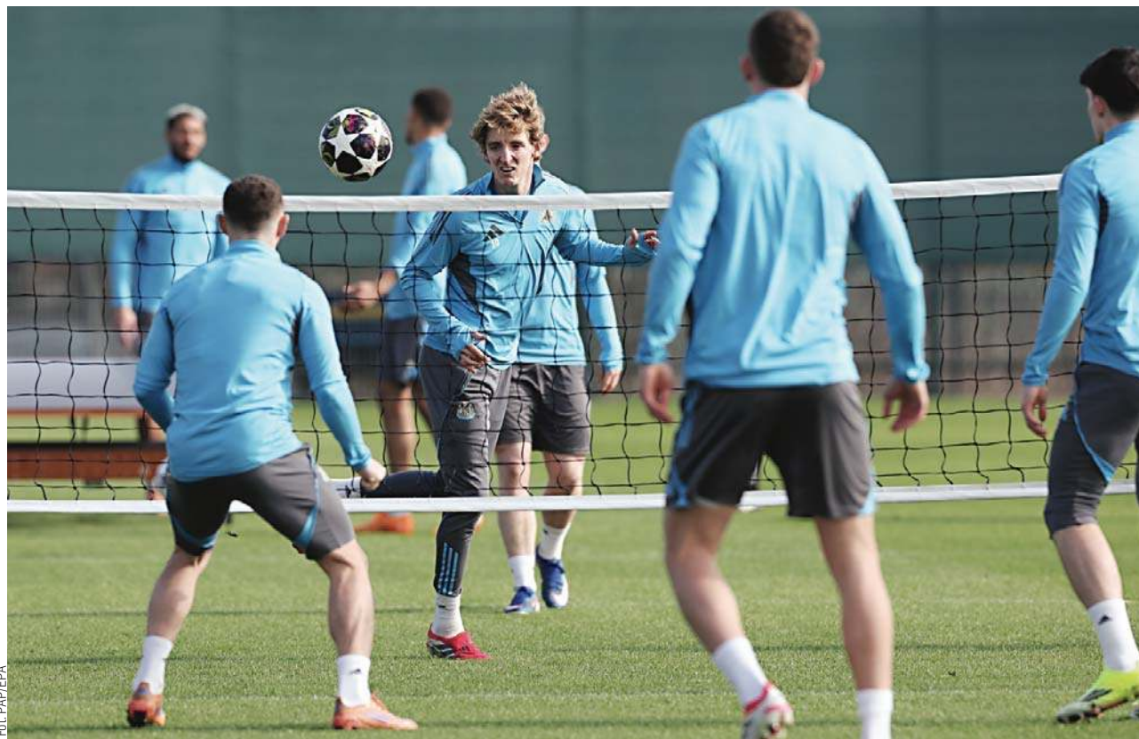
Trening piłkarzy Newcastle United przed wtorkowym meczem z FC Barcelona

W PARYŻU PSG BĘDZIE CHCIAŁO WZIAĆ REWANŻ NA CHELSEA ZA PRZEGRANY 0:3 FINAŁ KLUBOWYCH MISTRZOSTW ŚWIATA W LIPCU UBIEGŁEGO ROKU. BYŁA TO JEDYNA WYGRANA LONDŹCZYKÓW W OSTATNICH SZĘŚCIU SPOTKANIACH TYCH EKIP.