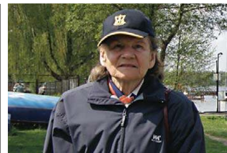
Pół wieku temu wypłynęła w samotny rejs \7