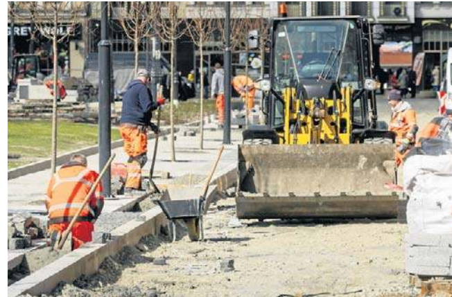
Rewitalizacja placu Wolności rozpoczęła się w kwietniu 2024. Wbrew zapowiedziom z końca stycznia, w marcu nie postawiono pawilonów kwiatowych

Pod koniec stycznia, jak co kwartał na sesji, radni Bydgoszczy wysłuchali informacji o stanie prac przy miejskich inwestycjach. Wówczas przekazano, że wykonawca, z uwagi na złe warunki atmosferyczne, złożył wniosek o wydłużenie terminu realizacji zadania o kolejne 52 dni, z 31 marca na 22 maja. Z kolei pawilony kwiatowe miały być gotowe 31 marca. Budek na miejscu nie ma, więc przed końcem marca zapytaliśmy bydgoski ratusz czy oba terminy są aktualne. - Ze względu na trudne warunki