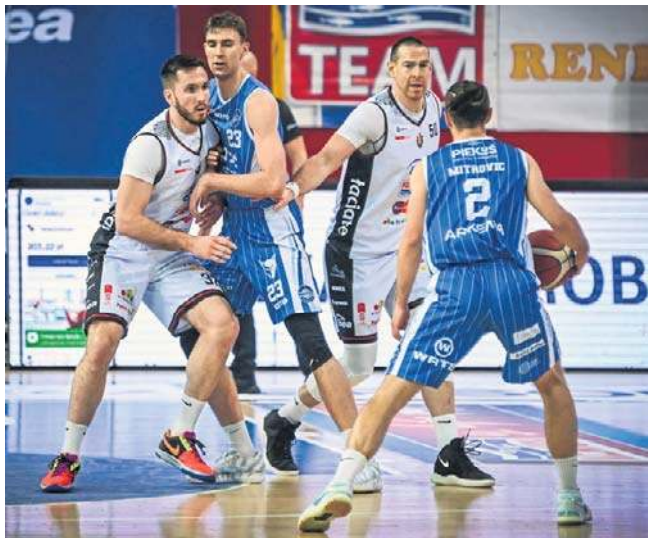
Przed Astorią (na białą) najważniejsze mecze sezonu. Noteć w środę kończy rozgrywki