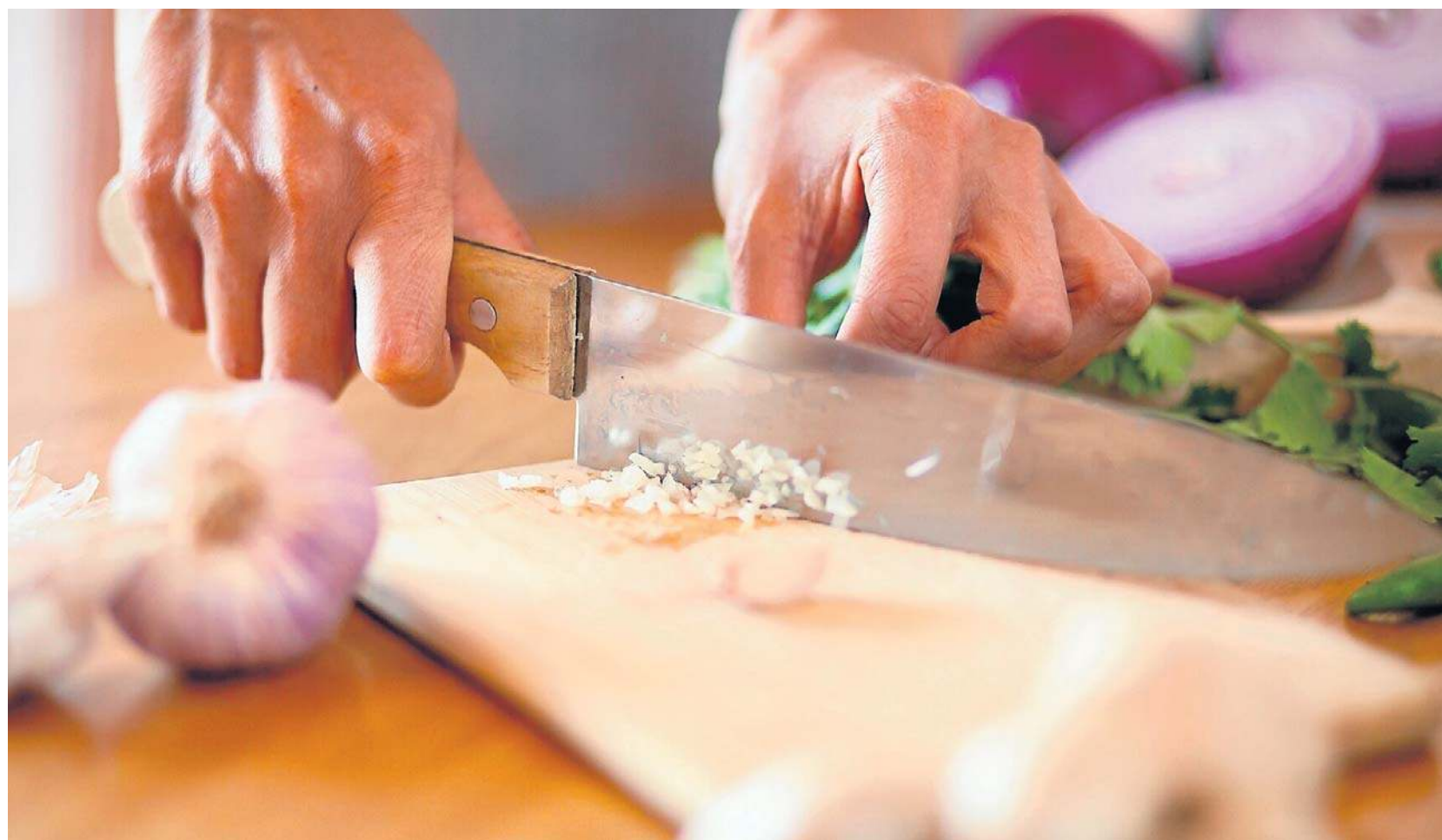
Najzdrowszy, a jednocześnie najbardziej podrażniający jest czosnek surowy

Może zdarzyć się także, że zjedzenie czosnku wywoła nie-