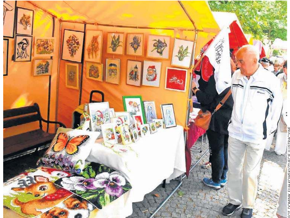
Podczas imprezy inauguracyjnej w Solankach stanie wiele kolorowych stoisk

Od godziny 16 na placu pod muszlą koncertową odwiedzać będzie można liczne stoiska. Zapraszają będzie Informacja Turystyczno-Kulturalna wraz z opiekunami Chaty Kujawskiej oraz wystaw: Askaukalis, Stałej