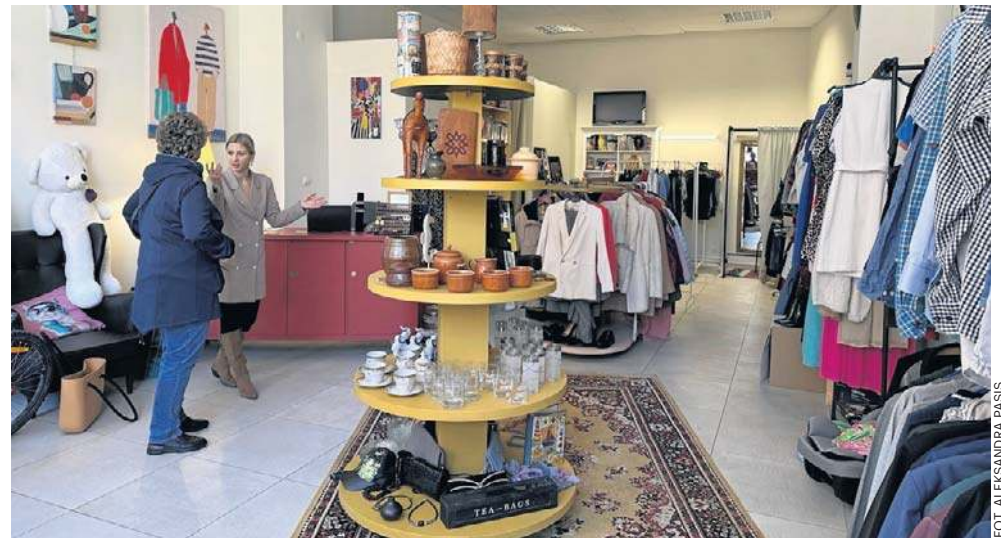
Tutaj przedmioty dostają drugie życie, a dochód z ich sprzedaży pomaga potrzebującym

Strzelecki zaznacza: - To nie jest sieciówka, ani second hand. To nas różni, że każda zarobiona w sklepie złotówka pozwala nam na niesienie wsparcia i rozszerzania naszej działal-