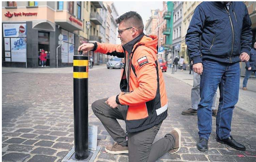
System sprawdzali przedstawiciele służb ratunkowych, miejskich i firm ochroniarskich

Słupki, na zlecenie MZD, po wygranym przetargu, zamontowała firma Transbruk Barczyńscy. Koszt prac to 582 tysiące złotych. Wygląd słupków - jak zapewniają służby miejskie - został dostosowany do zabytkowej starówki.