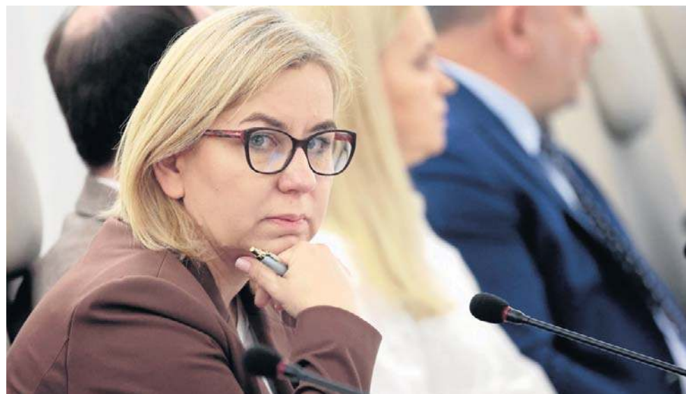
Minister klimatu i środowiska Paulina Hennig-Kloska. Czy koalicja ją wybroni?

Polska 2050 podzieliła się. Paulina Hennig-Kloska odeszła Wszystko przez rozpad Polski 2050. Paulina Hennig-Kloska,