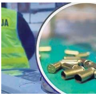
Policja szybko namierzyła mężczyznę, który strzelał do mieszkania sąsiadki.

Komisariat Policji Bydgoszcz-Szwederowo, pod nad-