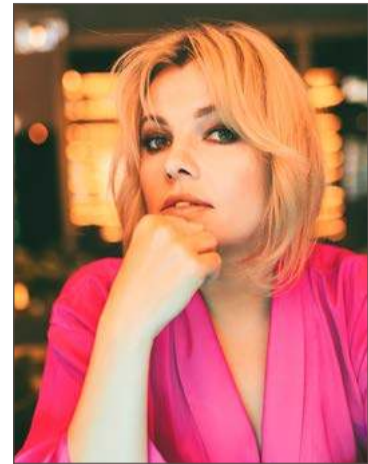
Popularna wokalistka przyjedzie do Dębicy.

Wokalistka, znana m.in. z hitu: Z Tobą nie umiem wygrać, będzie gwiazdą Dni Dębicy.