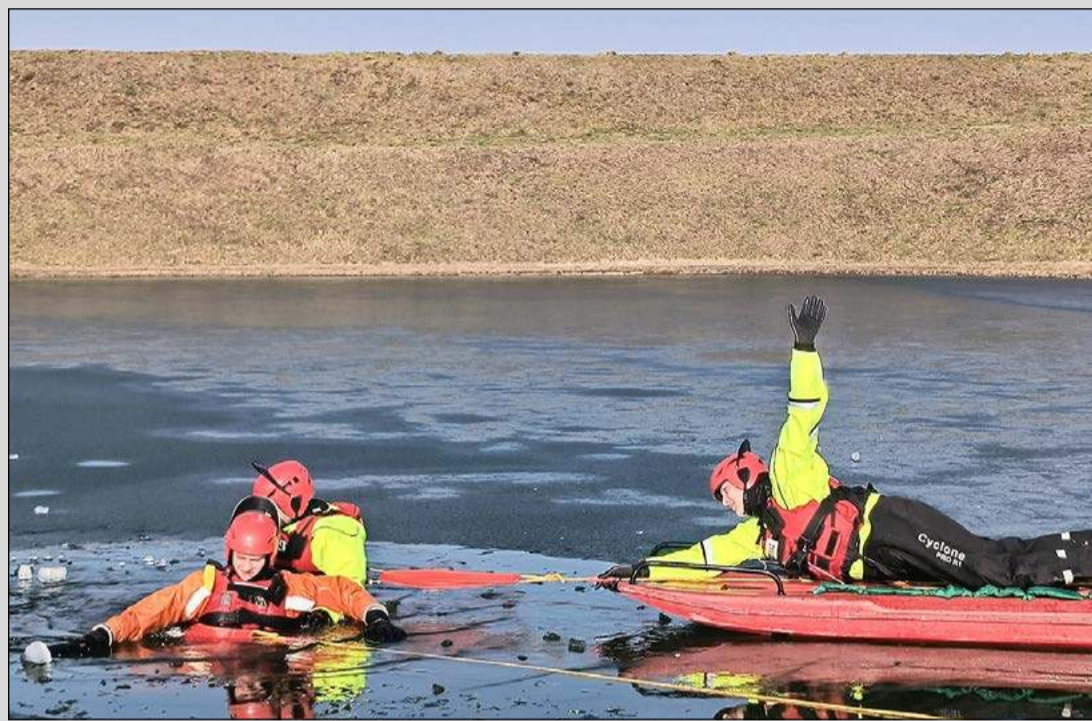
Strażacy przestrzegają, by nie wchodzić na zamrożone zbiorniki wodne. A sami szkolą się na wypadek konieczności przeprowadzenia akcji ratunkowej na lodzie. Takie ćwiczenia odbyły się w ubiegłym tygodniu na zamrożonym zbiorniku przy Al. Jana Pawła II w Dębicy. Organizatorem była Komenda Powiatowa Państwowej Straży Pożarnej, a udział wzięły jednostki z Dębicy, OSP Brzostek, OSP Pilzno, OSP Czarna i OSP Brzeźnica.