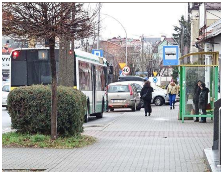
Najwięcej korekt wprowadzonych zostało w kursowaniu linii nr 1.

Ta zmiana wprowadzona została głównie z myślą o uczniach dojeżdżających do szkół średnich w Dębicy.