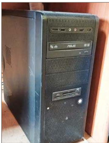
Przyjmowane będą również komputery

Z kolei w piątek 14 marca służby dotrą także do Woli Brzostekiej, Nawisia Brzostekiego i Brzostku. Zbiórki prowadzone będą od godz. 7. Sprzęt AGD i RTV będzie przy-