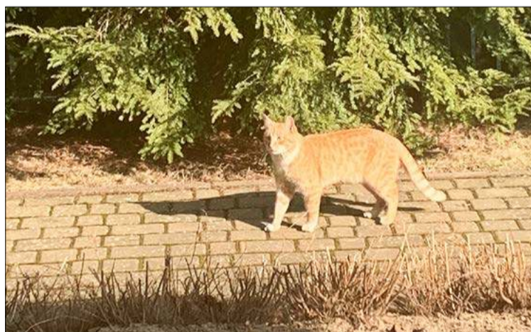
Będę wygrzewał się na słończku.