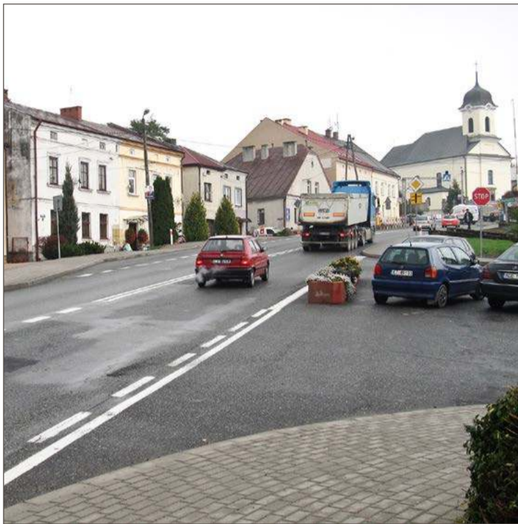
Budowa obwodnicy Brzostku ma trwać ponad cztery lata.

Termin realizacji zadania to 52 miesiące od momentu podpisania umowy, przy czym miesiące od grudnia do marca nie będą wliczane w ten okres. Cały odcinek będzie miał długość 13,4 km i przebiegał będzie po całkowicie nowym śladzie, po zachodniej stronie drogi krajowej nr 73. Będzie to droga klasy GD, czyli główna ruchu przyspieszonego. Oprócz dwóch pasów, po jednym w każdym kierunku powstaną też drogi serwisowe, jak i chodniki oraz ścieżki rowerowe. W ramach inwestycji mają powstać na terenie gminy