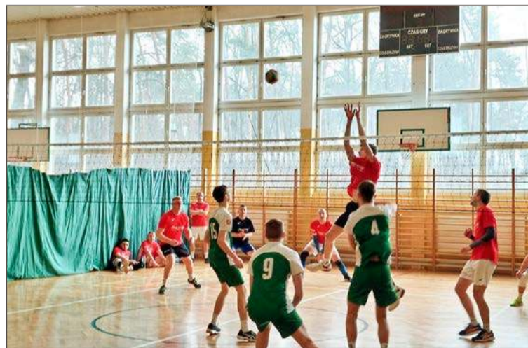
Mecze rozgrywane są w hali w Pustkowie-Osiedlu.