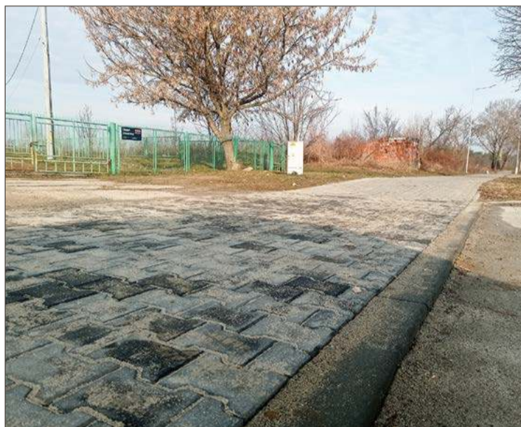
Taka kostka niespecjalnie nadaje się, by jeździć po niej np. na rołkach.