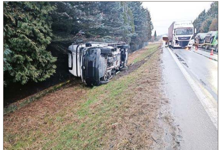
Auto dostawcze przewróciło się na poboczu.