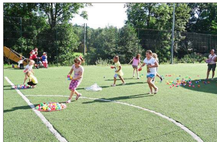
Zajęcia będą odbywać się na Orliku przy SP nr 1 w Jodłowej.

Zgłoszenia do udziału w projekcie należy przesłać na adres email: piotr.papciak@interia.pl. W wiadomości należy podać: imię i nazwisko ucznia oraz grupę wiekową. Więcej informacji można uzyskać pod nr. telefonu 516597571. Jak mówi Piotr Papciak pierwsze oso-