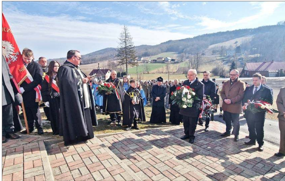
Na cmentarzu parafialnym w Siedliskach-Bogusz delegacje złożyły wiązanki przed Kaplicą Buguszów.

Złożyli kwiaty i zapalili znicze przed Kaplicą Boguszów na cmen-