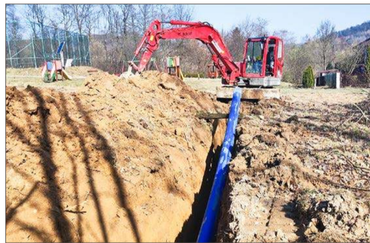
Mieszkańcy mogą już podłączać swoje domy do sieci wodociągowej.