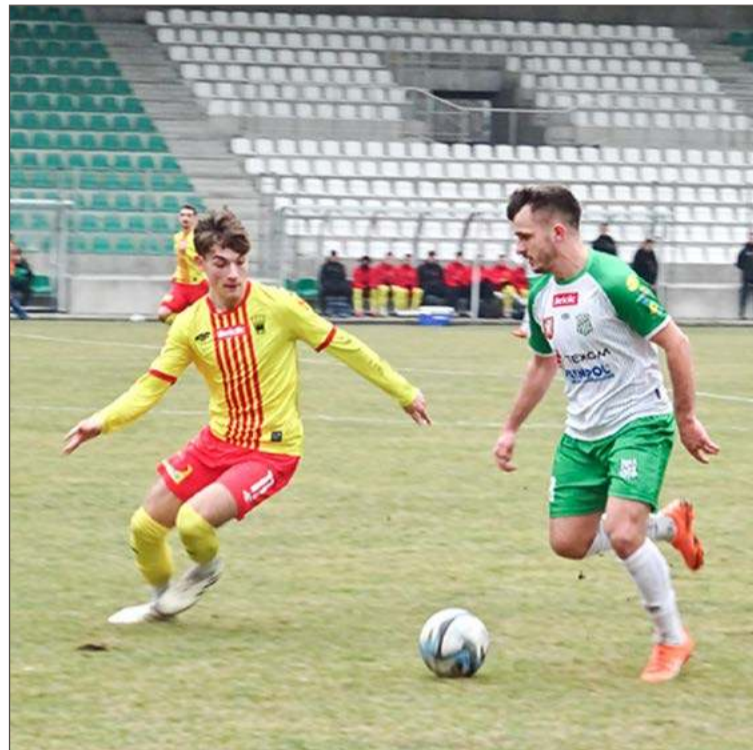
Wisłoka (na biało-zielono) rozpoczęła wiosnę od porażki z Koroną II.