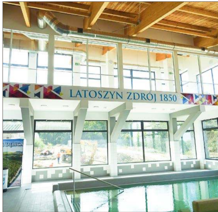
Jest szansa, że w Latoszynie powstanie sanatorium.