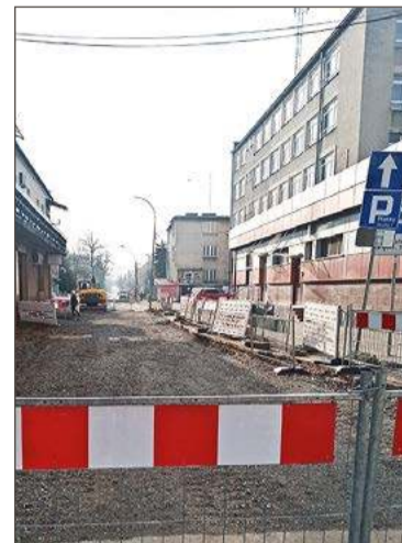
Na razie wiele się tam nie dzieje.

Mieszkańcy dziwią się, że droga w samym centrum miasta tak długo stoi zamknięta.