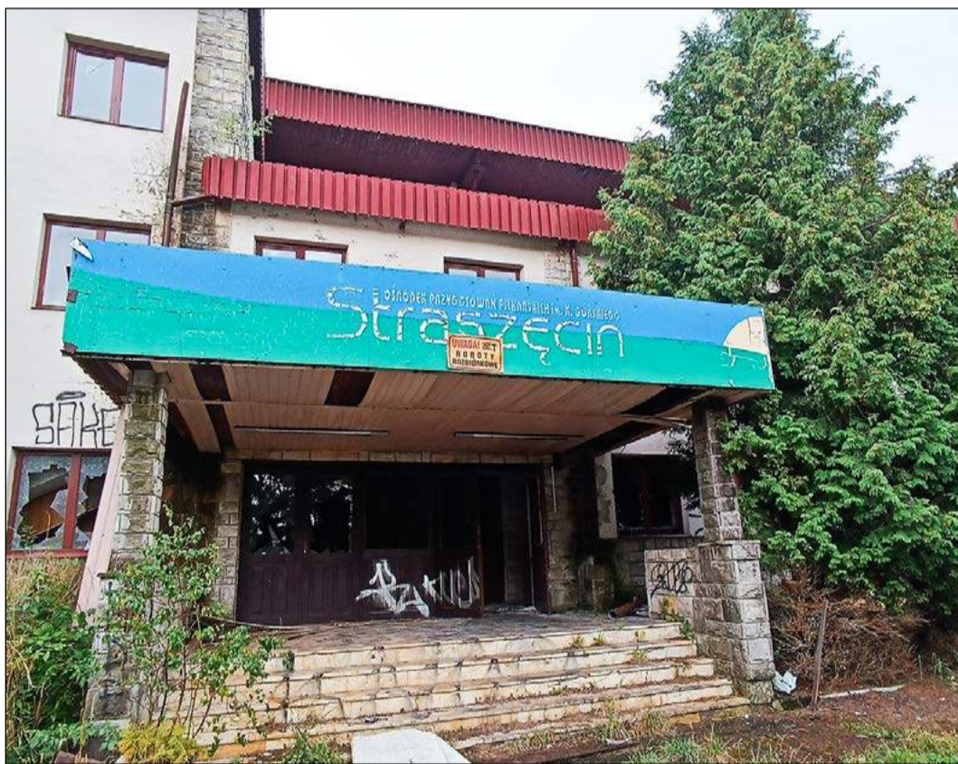
Ostatnie lata to czas dewastacji w Borowcu.