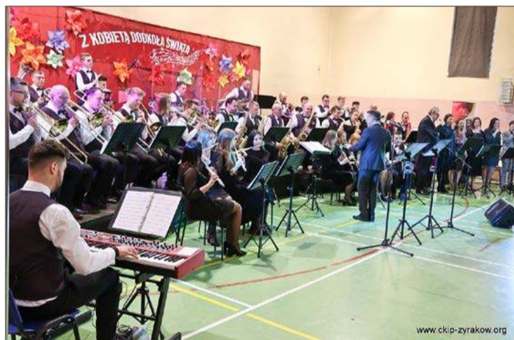
Koncerty z okazji Dnia Kobiet to w gminie Żyraków już tradycja.

W programie: wykłady dotyczące sfery duchowej i fizycznej, psychologii, fitnessu, a także biznesu.