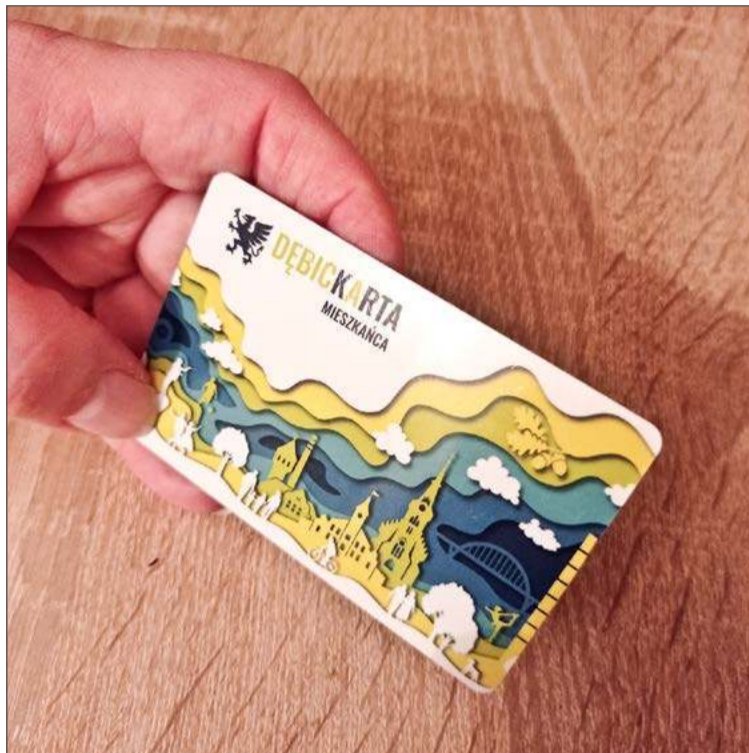
Taką kartę nosi w portfelu już 3401 mieszkańców. 2950 woli aplikację.