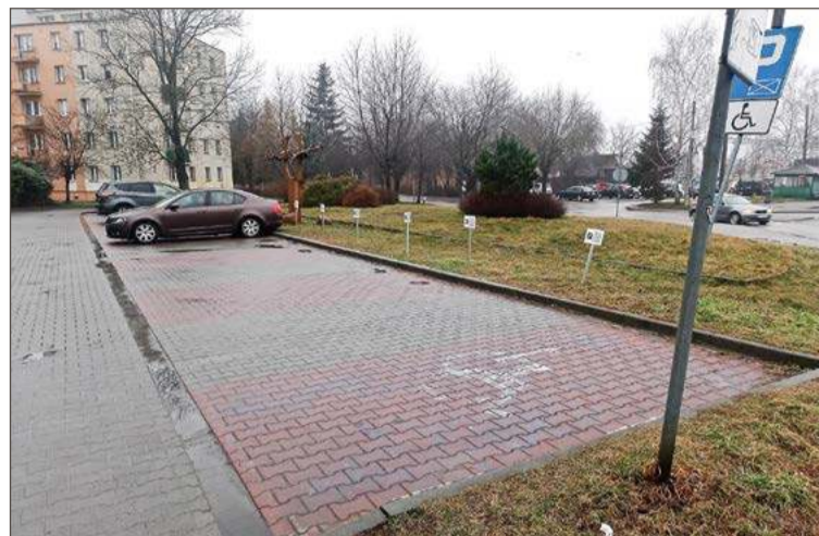
Większość miejsc przypisanych jest klientom kancelarii notarialnej.

Wzorem właściciela kancelarii poszedł właściciel działającego tam od wielu lat kantoru wymiany walut i obok tabliczek oznaczających miejsca dla klientów kancelarii pojawiły się też trzy wskazujące