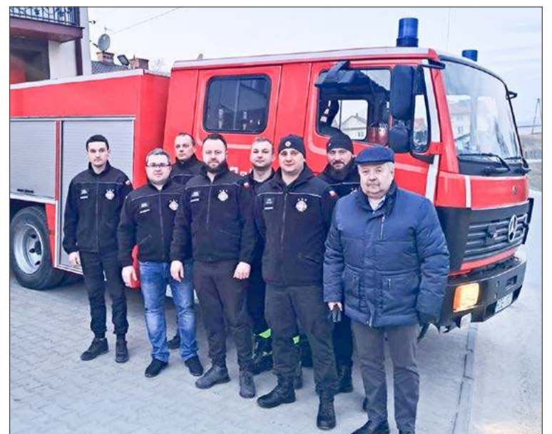
Auto z Nagoszyna teraz służy strażakom w Korzeniowie.