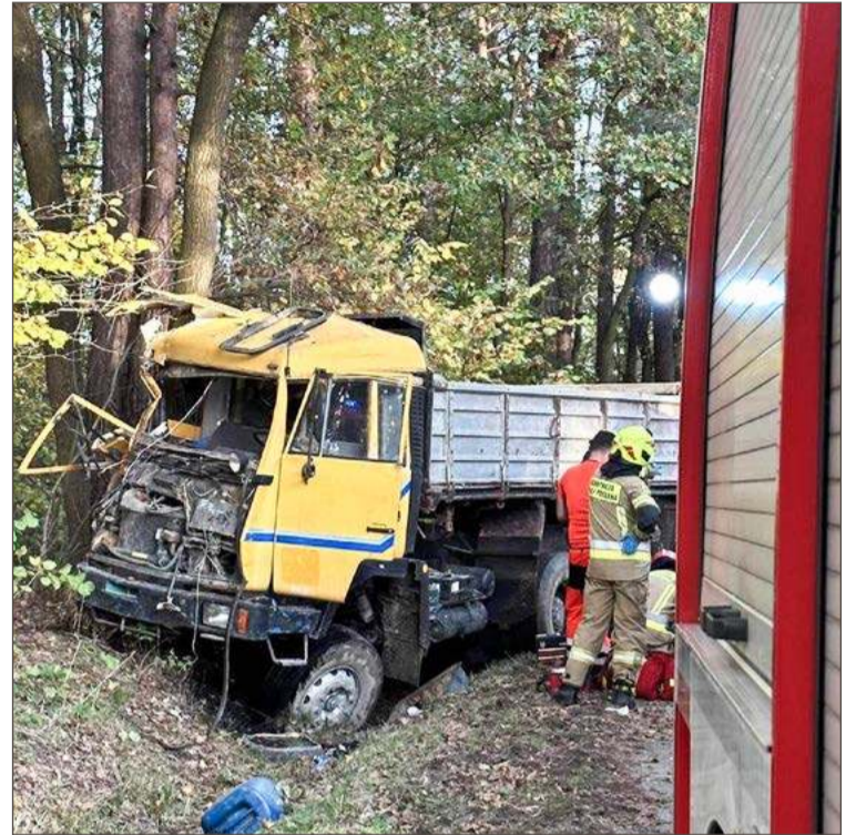
Ciężarówka, którą prowadził, uderzyła w drzewo. OSP Łęki Dolne.

Jest wyrok w tej sprawie. Sąd Rejonowy w Dębicy uznał winę Mateusza K. i skazał go na 8 lat więzienia, dożywotni zakaz prowadzenia pojazdów mechanicznych, 7 tys. zł nawiązki na rzecz Funduszu Pomocy Pokrzywdzonym oraz Po-