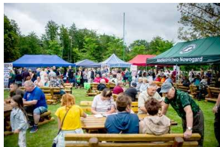
Do Płotkowa zjechały tłumy okolicznych mieszkańców, ale nie tylko