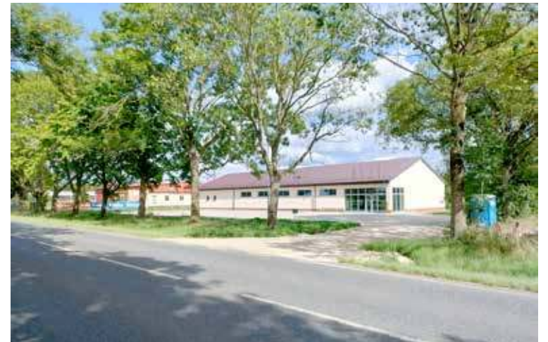
Tuż obok Armatury przy ul. 3 Maja planowany jest sklep Dino. Tu również brakuje przejścia dla pieszych