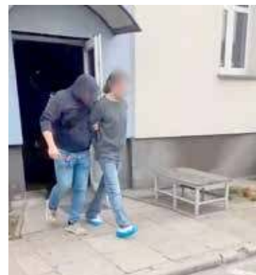
28-latek po tym jak został zatrzymany, trafił na trzy miesiące do aresztu

- Dzięki natychmiastowej wymianie informacji między jednostkami oraz nieprzerwanej łączności funkcjonariuszy prowadzących pościg, policjanci Komisariatu Policji w Nowogardzie mogli odpowiednio przygotować działania. W miejscowości Wojcieszyn ustawiono pojazdy w sposób uniemożliwiający przejazd z zachowaniem ostrożności i zasad bezpieczeństwa. Chwilę później w rejon blokady najechał srebrny Mercedes ścigany przez gryficki radiowóz. Kierowca próbował ominąć pojazdy, jednak nieskutecznie. Policjanci z KP w Nowogardzie i KPP w Gryficach natychmiast przystąpili do zatrzymania podejrzanego. Mężczyzna początkowo nie reagował na wydawane polecenia i nie chciał opuścić pojazdu. Dopiero w momencie próby wybiecia szyby otworzył drzwi, co pozwoliło