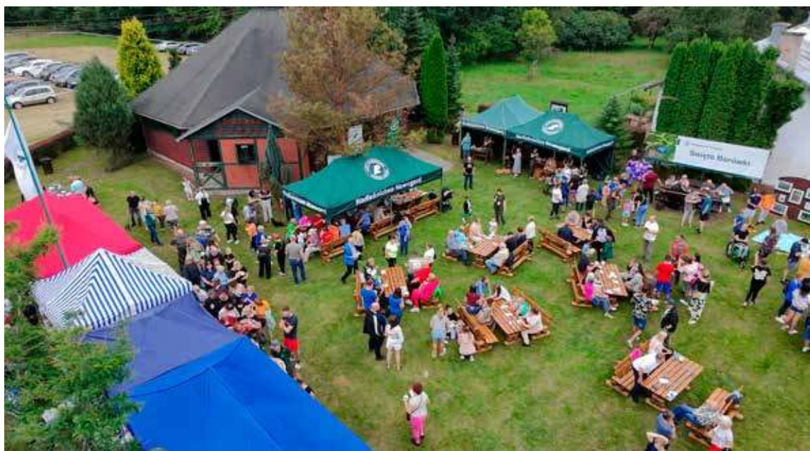
Zielona Kuźnia w Płotkowie po raz kolejny miała szansę gościć smakoszy borówki

26 lipca do Zielonej Kuźni w Płotkowie przybyli smakosze Borówki Czernicy, wielbiciele natury, przyjaciele lasu, ale przede wszystkim rodziny z dziećmi. I to nas, jako organiza-