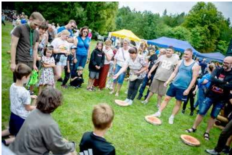
Uczestnicy wydarzenia podczas konkursu