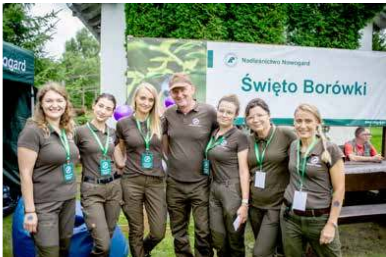
Pracownicy Nadleśnictwa Nowogard z nadleśniczym podczas Święta Borówki