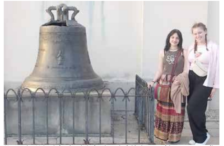
Uczennice I LO miały również okazję zwiedzić pierwszą historyczną stolicę Polski

W wyniku stoczonych 5 rund i 15 gier lepszy wynik uzyskała Hania, zajmując 29 miejsce w Polsce na 161 uczestników, ale jednocześnie dało jej to najlepszy wynik w województwie zachodniopomorskim, reprezen-