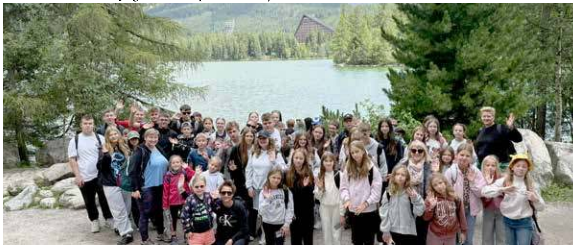
Na półkoloniach przebywa łącznie 51 dzieci i młodzieży