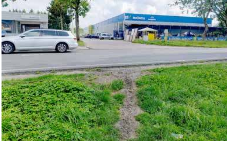
Wydeptane miejsca wskazują, w którym miejscu powinno zostać zlokalizowane przejście dla pieszych

Do dziś nie rozwiązany problemem, który dyskryminuje wszystkich pieszych chcących skorzystać z dobrodziejstwa marketu jest brak pełnoprawnego wytyczonego przejścia dla pieszych przy ul. 3 Maja. O tym,