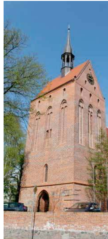
Organizatorzy serdecznie zapraszają!