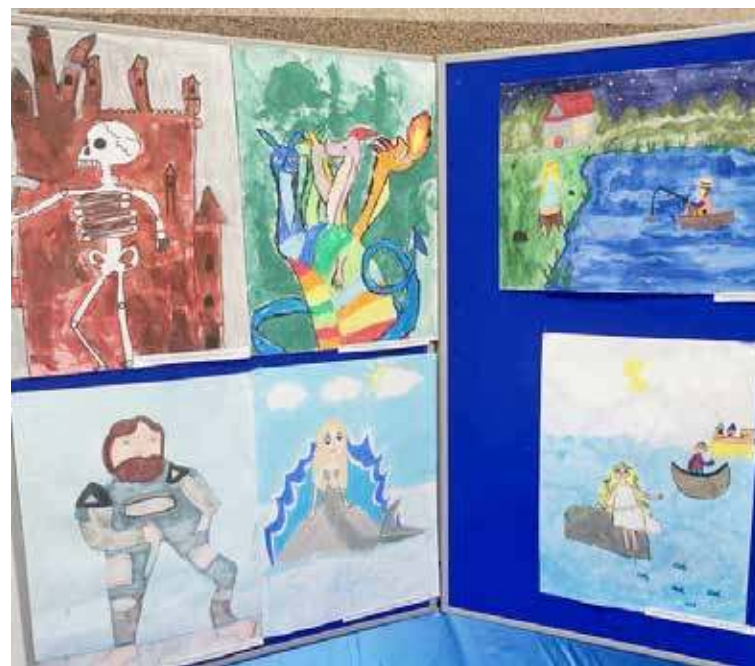
To tylko część prac stworzona przez uczniów nowogardzkich szkół