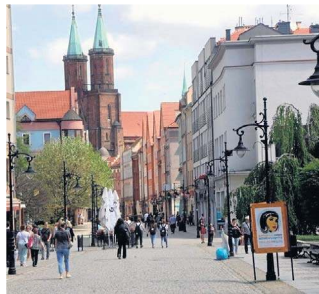
Centrum Legnicy w ostatnich dziesięcioleciach niemal całkowicie zmieniło swoje oblicze. Na zdjęciu: ulica Najświętszej Marii Panny, główny deptak miasta