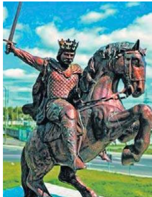
Pomnik Bolesława Chrobrego w Lubinie