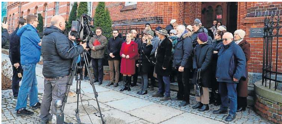
Toruńscy prolajferzy w Sądzie Okręgowym w Toruniu i przed nim - tu przegrali. Ale już Sąd Apelacyjny w Gdańsku to im przyznał rację, a nie prezydentowi miasta

ścieżkę prawną w tym wypadku wyrok zapadł na korzyść aktywistów.