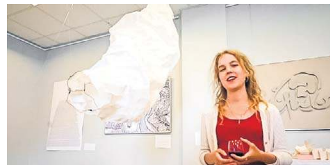
W DK Kopernik swoje prace pokazują młodzi artyści

Z okazji 65-lecia działalności, Legnicka Spółdzielnia Mieszkaniowa zaprasza mieszkańców na wyjątkowe wydarzenie plenerowe, które odbędzie się 6 czerwca od godziny 14.00 na terenach zielonych przy Spółdzielczym Domu Kultury „Kopernik”. O godzinie 20 rozpocznie się koncert Macieja Maleńczuka z zespołem Rhythm Section. Wstęp wolny