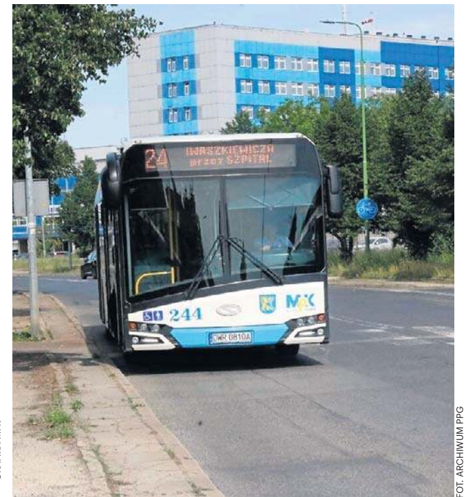
MPK przewozi rocznie 14 mln pasażerów

gający na korekcie czasu przejazdu autobusów między przystankami. W dni robocze szkolne i robocze wakacyjne / ferie