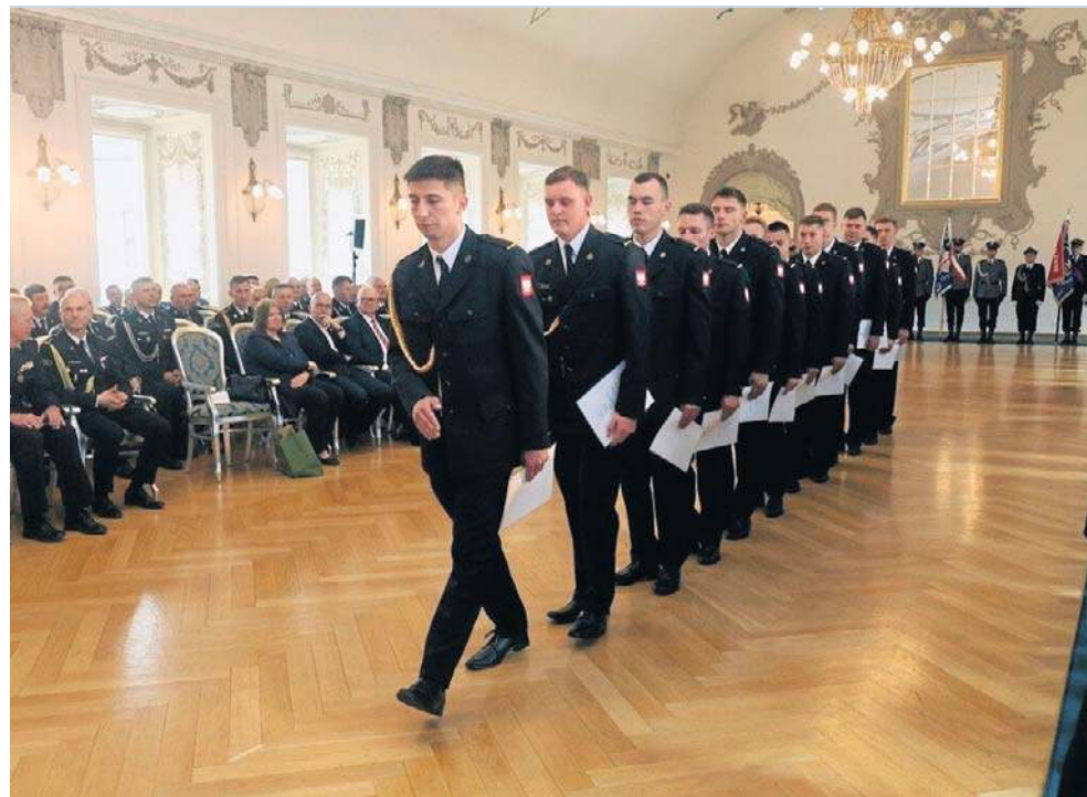
Uroczystość zorganizowano w Sali Królewskiej Akademii Rycerskiej