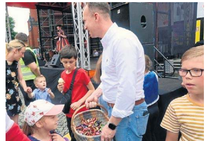
Na legnickim Rynku były też koncerty z udziałem młodych artystów oraz słodkości