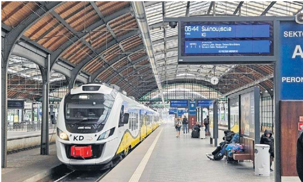
Podróż z Wrocławia do Świnoujścia trwa 5 godzin i 7 min, a z Legnicy ok. 4,5 godziny

- Ogromne zainteresowanie połączeniem do Świnoujścia było dla nas bardzo pozytywnym zaskoczeniem, dlatego zdecydowaliśmy się je ponownie uruchomić, spełniając