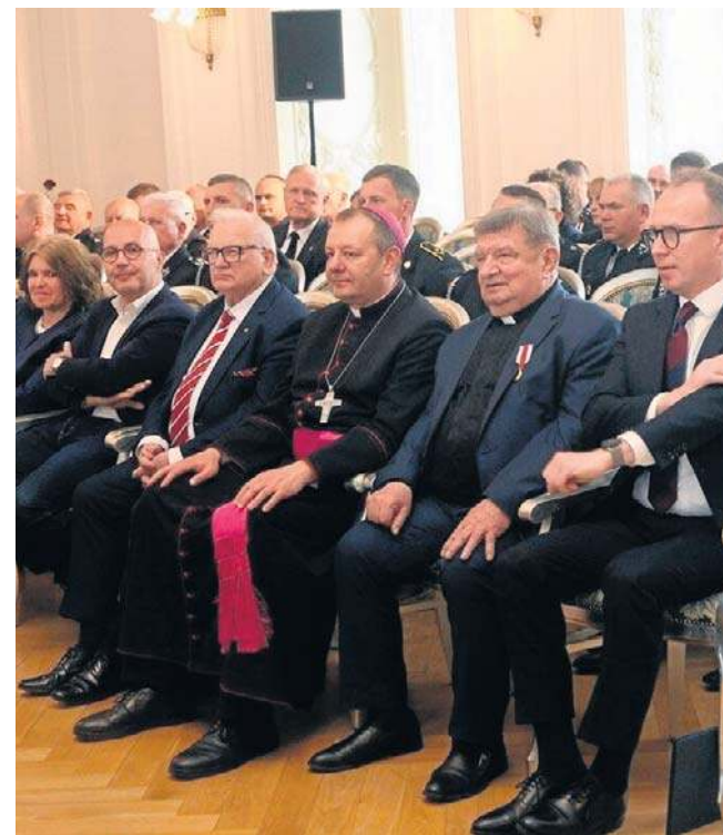
W gali uczestniczyło wielu zaproszonych gości

Oprawę muzyczną zapewniła orkiestra działająca przy Zespole Szkół Muzycznych w Legnicy pod batutą kapelmistrza Janusza Trepia.