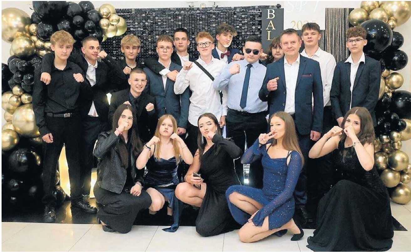
Poszczególne klasy robiły sobie pamiątkowe zdjęcia. Po latach będzie co wspominać