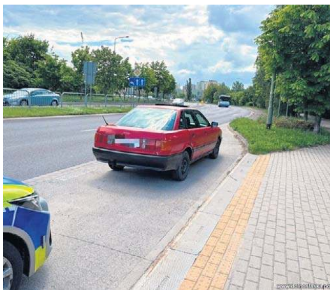
Test wykazał, że kierowca był pod wpływem metamfetaminy

Policjanci podjęli decyzję o przeprowadzeniu badania narkotesterem, które potwierdziło ich przypuszczenie. Wynik testu był pozytywny i wykrył obecność metamfetaminy.