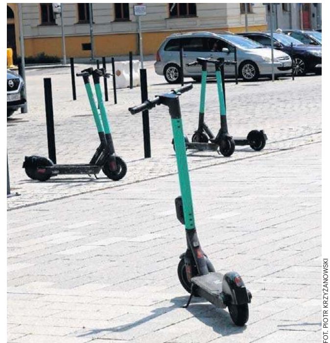
Korzystanie z hulajnogi jest proste, ale należy stosować się do zasad ruchu i bezpieczeństwa

W przypadku jeśli nie ma takiego miejsca - jak najbliższej