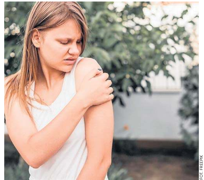
Wydaje ci się, że przyciągasz komary bardziej niż inne osoby w twoim otoczeniu? Może tak być

Negatywny wpływ na funkcjonowanie tarczycy mają długotrwały stres, przepracowanie, depresja etc. Związane jest to z nadmierną produkcją kortyzolu – hormonu stresu, który zaburza działanie podwzgórza, przysadki i nadnerczy. Może to skutkować rozregulowaniem pracy tarczycy, a także funkcjonowania systemu odpornościowego (stąd nadmierna podatność na infekcje). Oprócz tego stres zaburza konwersję T4 w T3 oraz podwyższa poziom globuliny, która odpowiada za wiązanie tyrosyny.