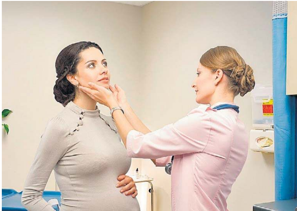
Nawet brak typowych symptomów nie wyklucza diagnozy choroby tarczycy, a zwłaszcza jej łagodnej, subklinicznej postaci, która z czasem się pogłębia

Choroby tarczycy długo nie dają o sobie znać, a chorujący narząd nie boli. Tarczycą jest na tyle