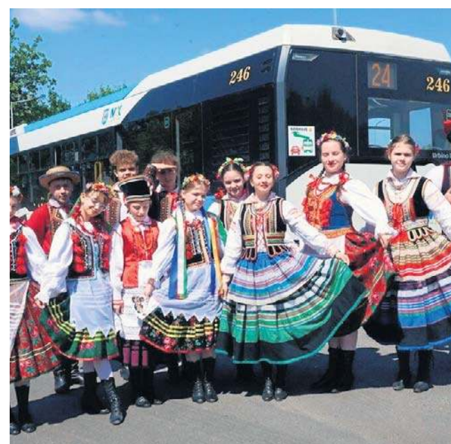
Jak co roku, Zespół Pieśni i Tańca „Legnica” w muzycznym stylu promował Festiwal w autobusach MPK