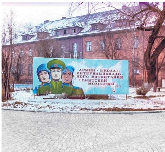
Czasy powojenne Dolnego Śląska i Legnicy to też historia długiej obecności wojsk sowieckich i związane z tym konsekwencje

Punktem wyjścia do rozmowy będzie orędzie biskupów polskich do biskupów niemieckich z 1965 roku.