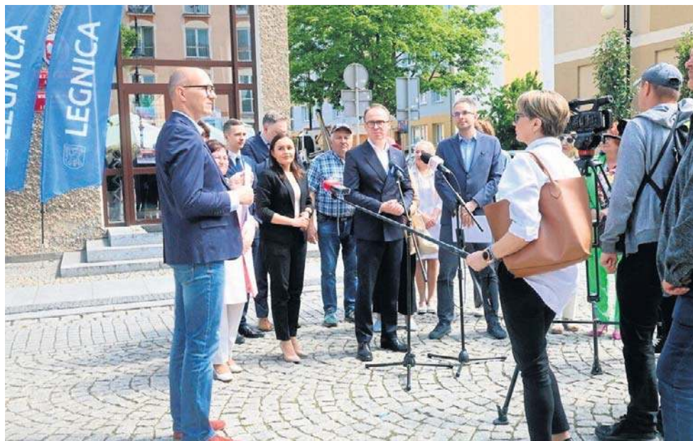
O zasadach LBO 2026 poinformowano 27 maja na konferencji prasowej w Ryнку

9 czerwca 2025 r. godz. 14:00 - spotkanie warsztatowe dla młodzieży „Od SBO do LBO”, Rynek 19.