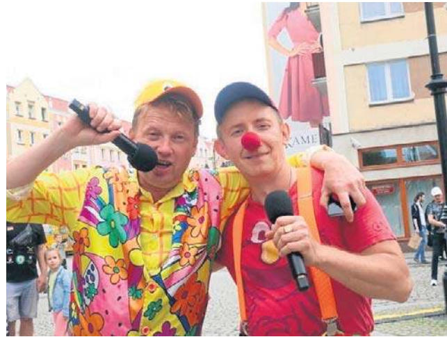
Imprezy w Rynku trwały do wieczora. W tym roku pod hasłem Legnica Rośnie Zdrowo