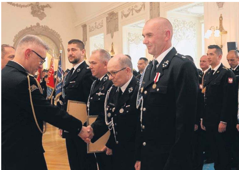
Nagrodzeni i odznaczeni zostali weterani pożarnictwa z powiatu legnickiego