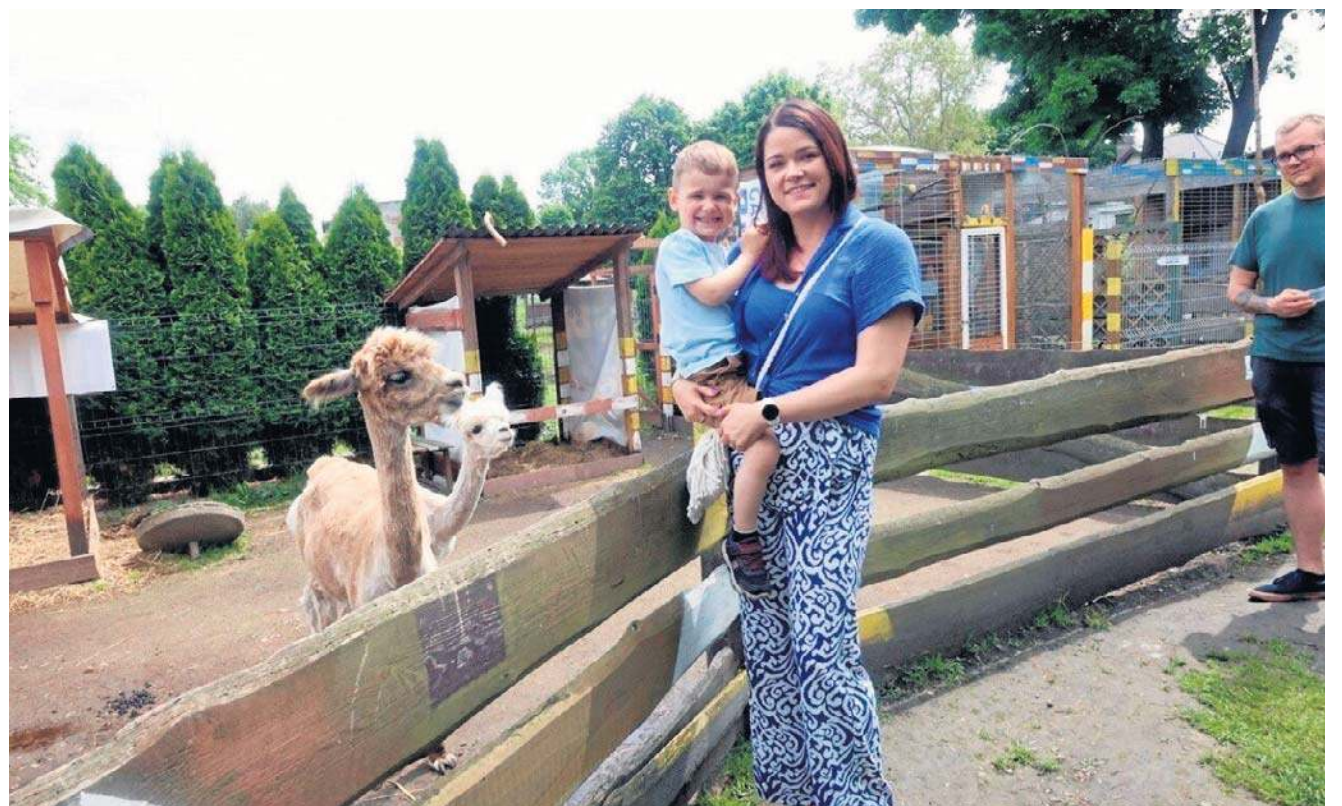
Sporo legniczan wybrało się w Dzień Dziecka do minizoo w podlegnickim Piotrkówku