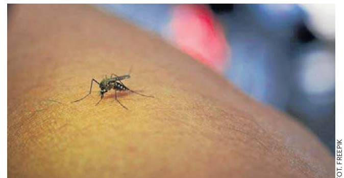
Komary lubią grupę krwi O, ale możemy być dla nich „atrakcyjnym kąskiem” także z kilku innych powodów

5. Cięża. Badanie z 2004 roku wykazało, że komary chętniej atakują kobiety w ciąży niż te, które w ciąży nie są. Może się to wiązać z innymi czynnikami, które zachęcają komary – wyższa temperatura ciała i uwalnianie większej ilości dwutlenku węgla.