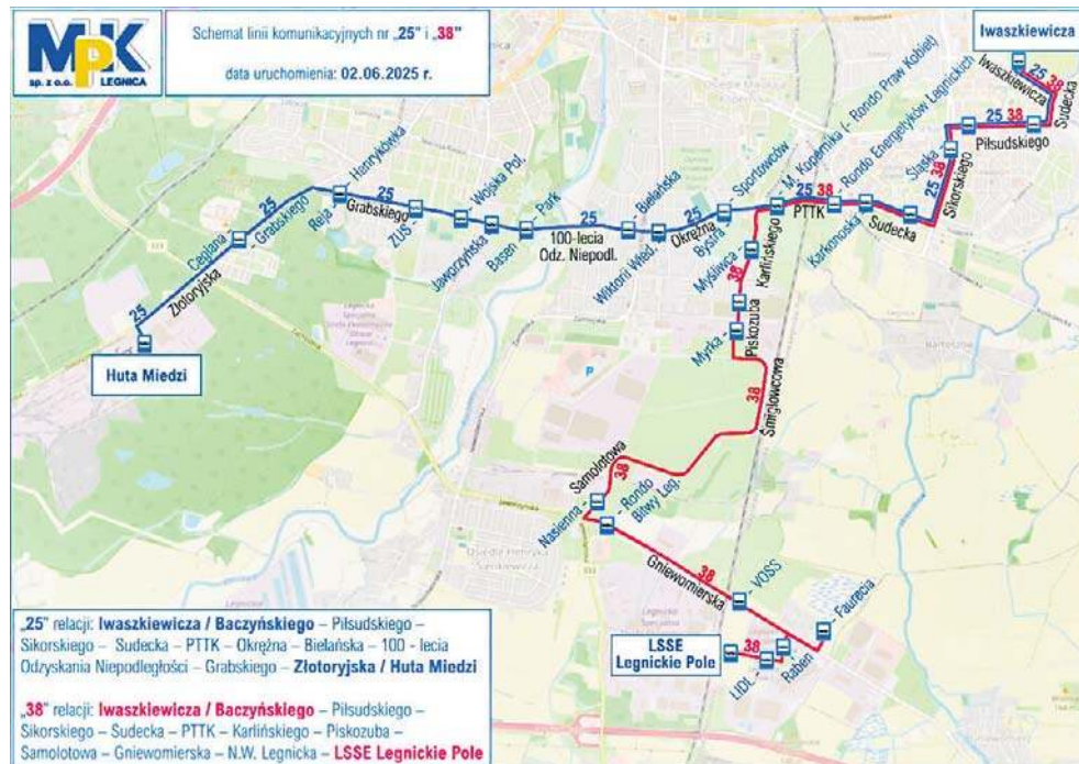
Nowe linie zawiozą pasażerów z ul. Iwaszkiewicza do huty i Legnickiego Pola

Z kolei linia 38 docierać będzie do rejonu Legnickiej Specjalnej Strefy Ekonomicznej w Legnickim Polu. Poprowadzi z Iwaszkiewicza przez al. Piłsudskiego, Sikorskiego,