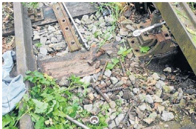
Za kradzież elementów torowiska zatrzymanym grozi do pięciu lat więzienia

który na miejscu znalazł narzędzia w postaci kilofa, łomu, szlifierki, lin stalowych, lewarka, nożyc oraz kluczy, które posłużyły sprawcom do nielegalnego demontażu stalowych elementów torowiska. Sprawcy zdołali uciec z miejsca. Jednak policjanci znaleźli ich w pobliskim lesie. 43-latek i 41-letnia kobieta (oboje z pow. polkowickiego) początkowo bronili się, że przyjechali na grzyby. Ale policja nie dała im wiary. Trafili na komendę. Usłyszeli zarzuty kradzieży i staną przed sądem.