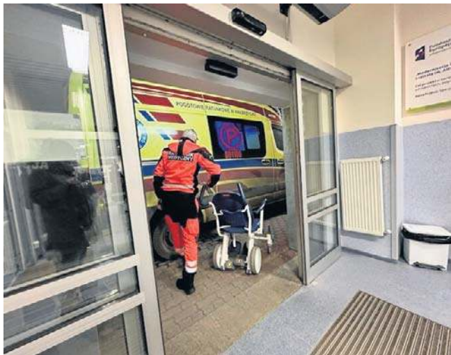
Ślisko na ulicach i chodnikach Wałbrzyska i regionu