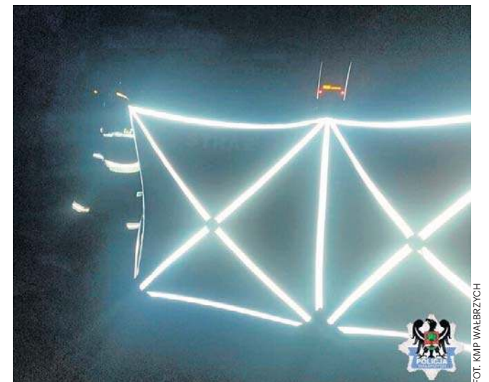
Policjanci pracowali pod nadzorem prokuratora

To kolejny tragiczny wypadek na torach na Dolnym Śląsku. Przypomnijmy, że w niedzielę (21 grudnia) na przejeździe kolejowym w Ziębicach w powiecie ząbkowickim zginęło małżeństwo. Kobieta i mężczyzna mieli po 31 lat, osierociło 2-letnie dziecko.