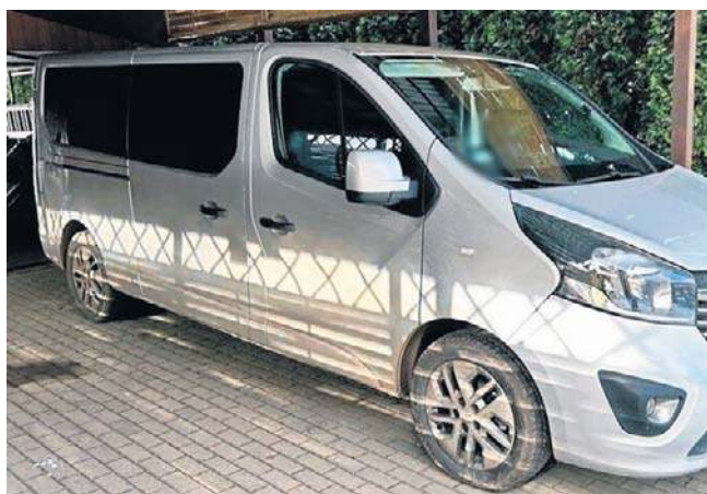
Policjanci odzyskali przywłaszczony przez 53-latkę samochód

- Jako że indywidualne poszukiwania mężczyzny, który jak się okazało przebywał za granicą, nie przyniosły przedstawicielom firmy pozytywnego rezultatu i nie odzyskali oni przez dłuższy czas samochodu, dlatego ostatecznie o zdarzeniu powiadomili Policję - informują w wałbrzyskiej Policji.