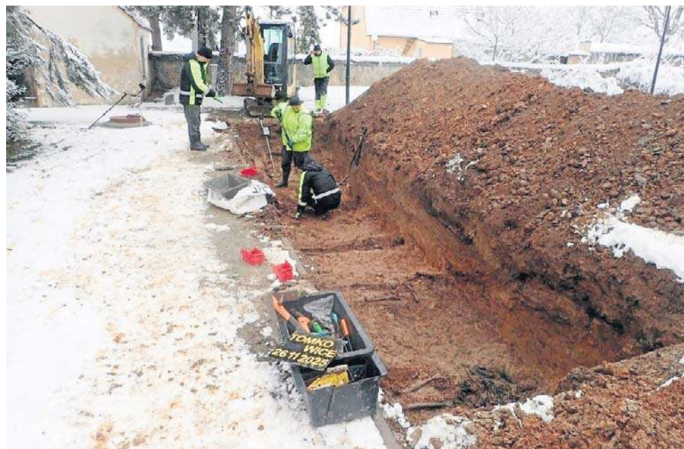
Badacze odkryli szczątki niemieckich żołnierzy pod cywilnymi mogiłami

- Według dokumentów archiwalnych, na cmentarzu ewangelickim w Tomkowicach (wówczas Thomaswaldau) w 1945 roku pochowano ponad 70 niemieckich żołnierzy. Do dziś na powierzchni nie zachowały się żadne ślady grobów z tamtych czasów, a teren został przeznaczony na nowe pochówki w ramach obecnego