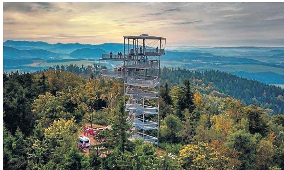
3 miejsce. Wieża na Trójarbie