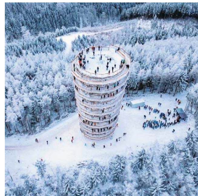
1 miejsce. Konstrukcja na Dzikowcu dostępna jest od 15 lutego 2025 roku