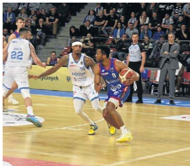
Górnik Zamek Książ przegrał we własnej hali

Od pewnego czasu nad wałbrzyszanami jakby zawisło fatum - kontuzje i choroby dopadają ich jedno po drugim. Grając w okrojonym składzie Górnika kilka dni temu gasł w meczu ze Startem w Lublinie (przegrał 79:85) i teraz tracił moc w starciu z Arrivą Lotto Twardymi Piernikami. Pierwsza kwartał wałbrzyskanie wygrali 19:13, ale kolejne odsłony były już na korzyść gości. Może gdyby gospodarze nie spudłowali 9 (na 20) rzutów wolnych, gdyby trafili więcej rzutów z dystansu (trafili 5 na 22), nie popełnili aż 16 strat, to jakoś ten