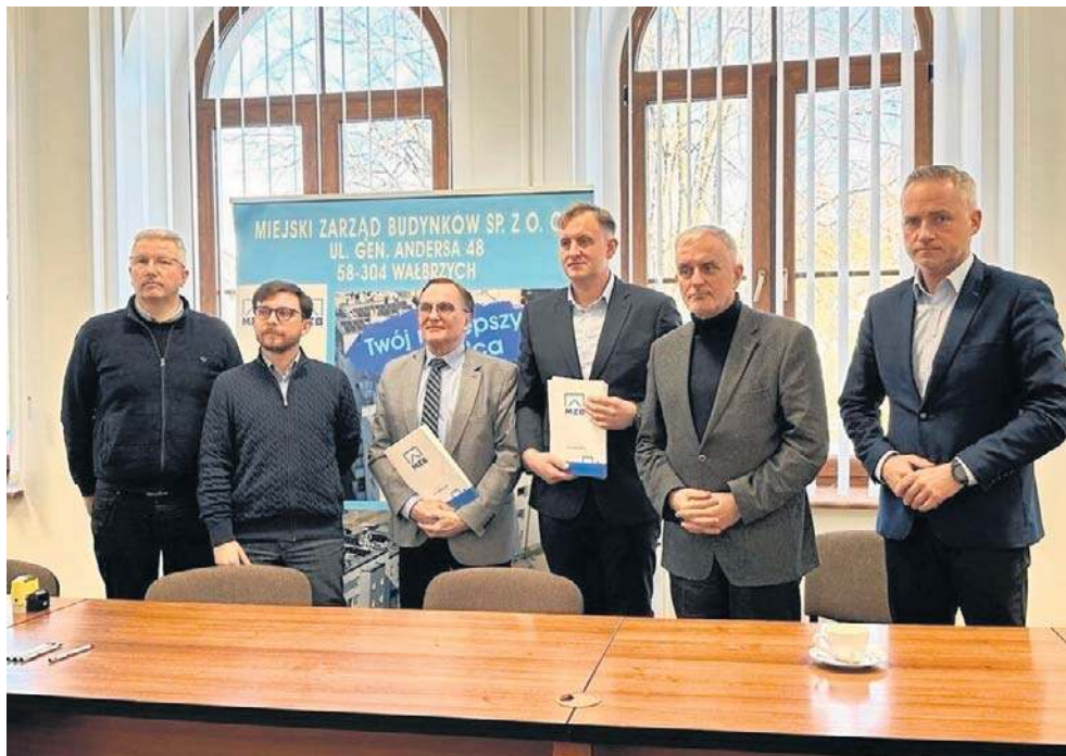
Podpisano umowę na powstanie nowego budynku przy ul. Norwida w Wałbrzychu, po sąsiedztwie z domkami jednorodzinnymi

Jak mówi prezydent miasta Roman Szelemej, to bardzo atrakcyjne miejsce zwłaszcza dla rodzin z dziećmi, sąsiadujące z wyremontowanym Parkiem Sybiraków, centrami handlowymi, przychodnią zdrowia, szkołą i przystankami komunikacji miejskiej. Budynek ma być zaprojektowany w taki sposób, by nie przytłoczył znajdującej się tu zabudowy jednorodzinnej.