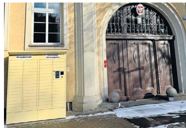
Pod koniec 2025 roku przed budynkiem Starostwa Powiatowego w Wałbrzychu staną urzędomat

Wyjaśniają, że z rozwiązaniem mogą korzystać osoby załatwiają sprawy w Wydziale Komunikacji, w szczególności dotyczące rejestracji pojazdów