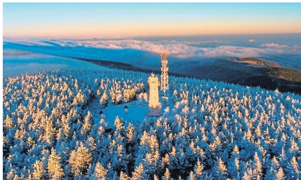
2 miejsce. Wieża na Wielkiej Sowie