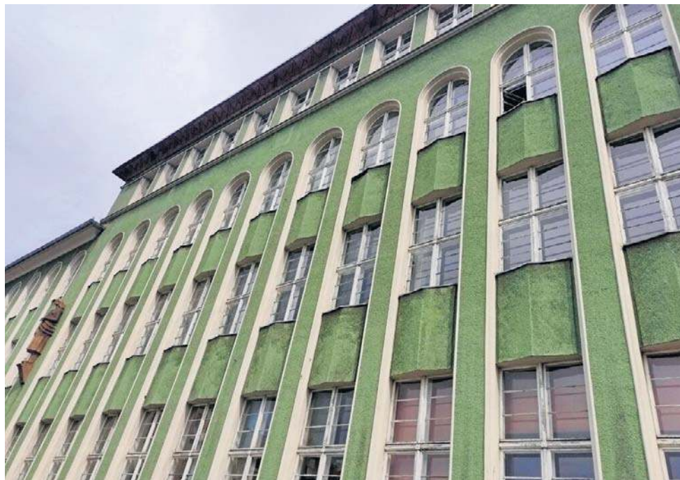
Budynek w 2006 roku został wpisany do rejestru zabytków

- Na zewnątrz niewiele się zmieni, ale wymienimy wszystkie okna, system ogrzewania, kaloryfery, wentylację, system oświetlenia, system zaopatrzenia w energię elektryczną. Cała szkoła będzie niestety przez parę miesięcy placem budowy - zaznacza prezydent miasta. Zainteresowane firmy mogą składać oferty do 7 stycznia 2026.