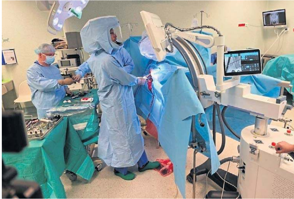
Sala operacyjna w Wałbrzychu. To tu wykonano skomplikowany zabieg wszczepienia implantu 3D

- To nie są częste zabiegi, ale są wyjątkowe, bo nie możemy u takich pacjentów zastosować implantów, które są dostępne na rynku i produkowane seryjnie. Uszczerbek