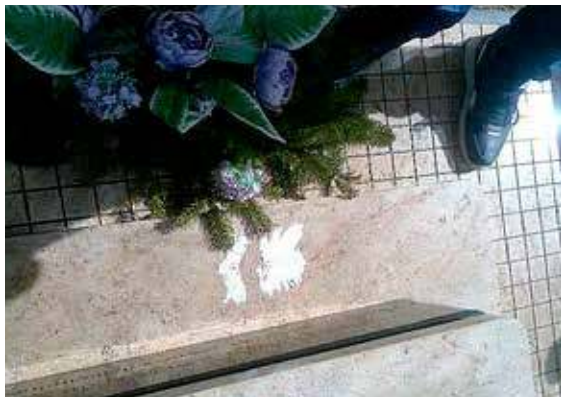
Naklejki są trudne do usunięcia z powodu mocnego kleju trzeba użyć rozpuszczalnika

gdzie generalnie nie ma problemu braku miejsc - więcej władze gmin są na ogół zainteresowane, aby te małe cmentarze miały kolejne pochówki (co częściowo łagodzi powszechny problem braku miejsc na cmentarzach miejskich) i tym bardziej nie egzekwują opłat prolongacyjnych, a już pełnym nieporozumieniem jest kwalifikowanie z powodu braku tej opłaty, grobu jako grobu przeznaczonego do likwidacji!!! - co uczyniono decyzją Nowej władzy samorządowej w naszej gminie. Jak nam powiedzieli poprzedni nasi wóldarze, to oni wcześniej nie egzekwowali tej opłaty od grobów na cmentarzach wiejskich, nie tylko z powodu że nie ma tam problemu braku miejsc, ale jeszcze z innych powodów. Często trudno było znaleźć zobowią-