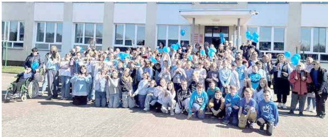
Pamiątkowe zdjęcie sprzed SP w Osinie