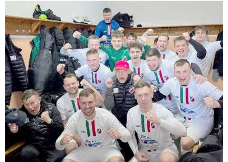
To był bardzo udany rewanż dla drużyny Pomorzanie.jpg