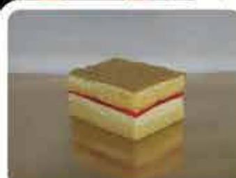
Camargo z galaretką