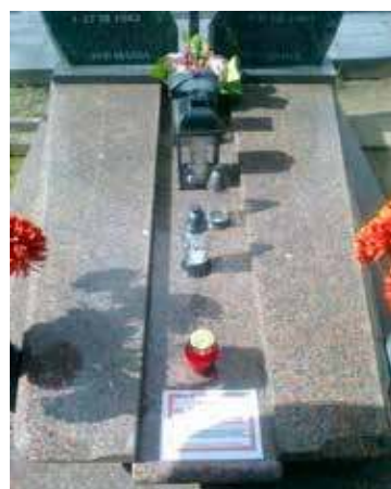
Typowy nagrobek „przeznaczony do likwidacji”