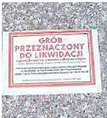
Treść przyklejonych kartek

Po raz pierwszy tzw. opłata za grób wnoszona jest w ramach formalności pochówkowych i ma ważność 20 lat i nalicza ją w tym momencie na ogół firma pogrzebowa, która odprowadza tę należność do gminy. Po tym okresie 20 lat teoretycznie powinno się uiścić opłatę ponownie jako tzw. opłatę prolongacyjną (przedłużenie na kolejne 20 lat). Teoretycznie, ponieważ w zdecydowanej większości gmin, w praktyce takie prolongacyjne ściąganie tych opłat nie funkcjonuje (także z powodu częstej niemożności identyfikacji opiekunów grobu), a zwłaszcza nikt nie ściąga takiej opłaty na małych wiejskich cmentarzach,