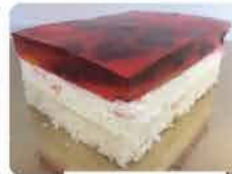
Biszkopt z galaretką i owocami