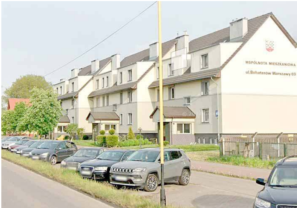
Mieszkańcy wspólnoty mieszkaniowej nie zgadzają się z decyzją referatu odpadami.png

Jak się dowiadujemy w ww. sprawie, dopiero w lutym 2025 roku zostało wszczęte postępowanie, które finalnie skutkowało wydaniem decyzji administracyjnej. Jak wynika z lokalnych przepisów, podwyższona stawka w gminie Nowogard to czterokrotność stawki bazowej (to już decyzja radnych Rady Miasta). Po przeprowadzeniu rachub oznacza to, że każdy mieszkaniec wspólnoty mieszkaniowej powinien za listopad zapłacić nie 26 zł (taka stawka obowiązywała jeszcze w 2024 roku), ale cztery razy więcej, czyli już 104 zł. Nieruchomość zamieszkiwać ma 31 osób, w związku z czym stawka na wszystkich lokatorów to już horrendalne ...3 224 zł.