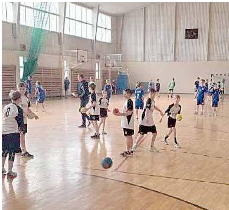
W swoim premierowym występie drużyna SPR zdobyła 6. punktów