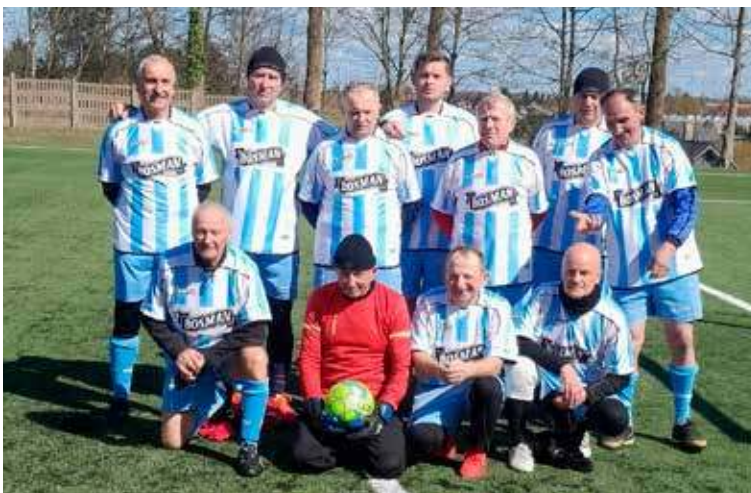
Drużyna Bosmana tym razem musiała uznać wyższość drużyny samorządowców