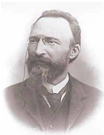
Bł. Bartolomej Longo

Jak czytamy w notce biograficznej, w 1858 r. wstąpił na wydział prawa w Neapolu. Wtedy też wiara Bartola uległa załamaniu. Wstąpił on do sekty spiryty-