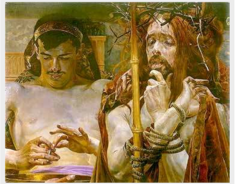
Jacek Malczewski: „Chrystus przed Piłatem”