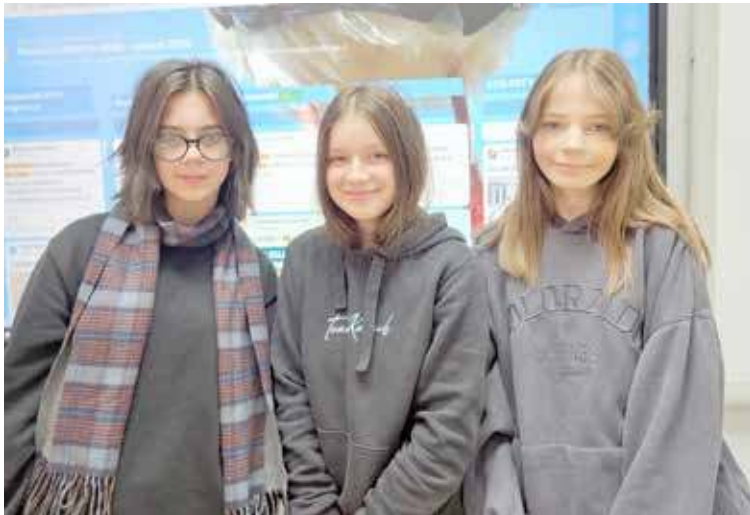
Zaangażowanie, kreatywność i chęć niesienia pomocy uczennic SP Żabowo zostały dostrzeżone i docenione przez jury konkursowe